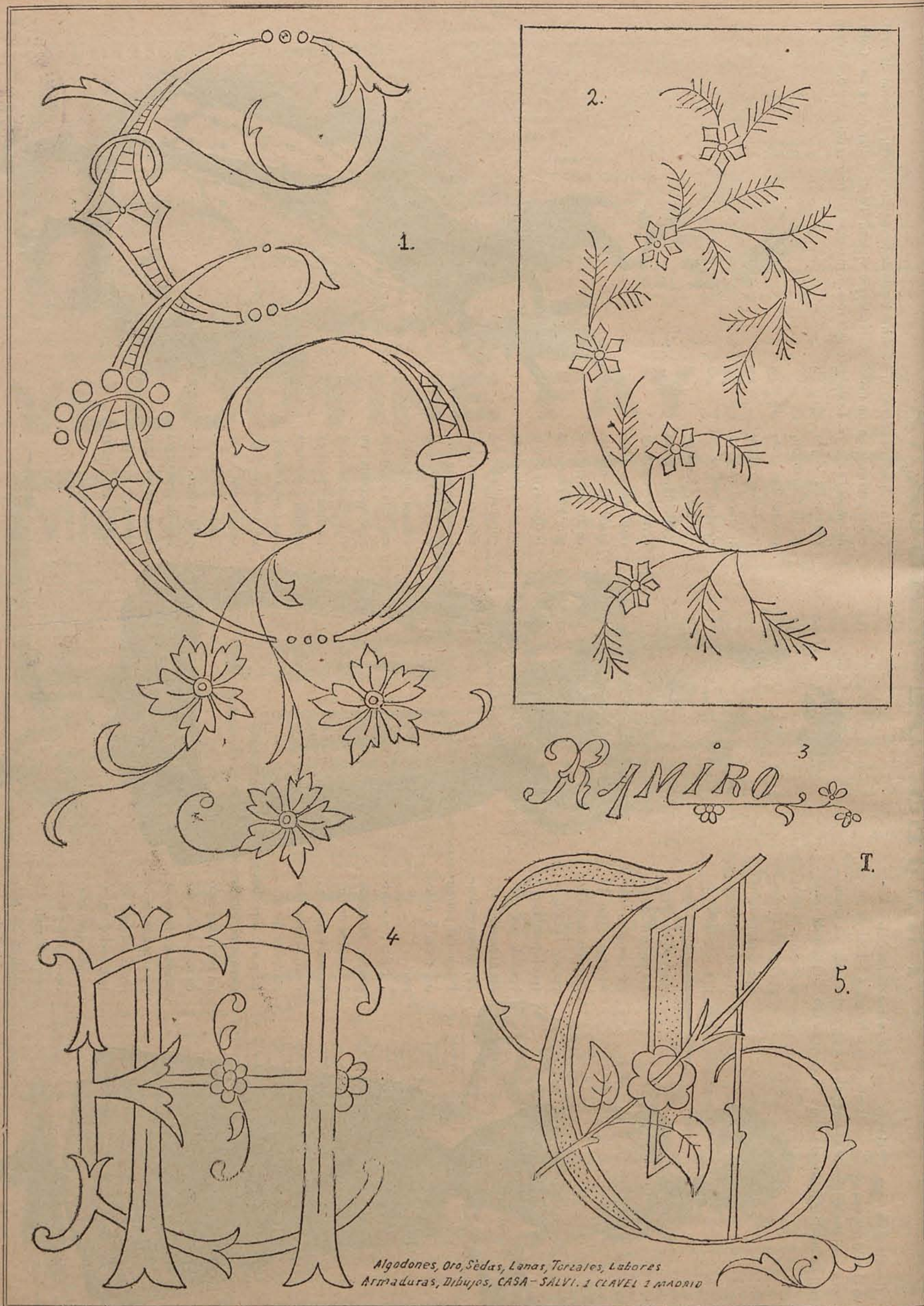
Núm. 1.—Continuación del abecedario para bordar sábanas.—2. Cubierta de secante bordado con torzales.—3. Nombre de Ramiro para pañuelo. 4. Enlace E-H para manteles.—5. Continuación del abecedario para manteles.