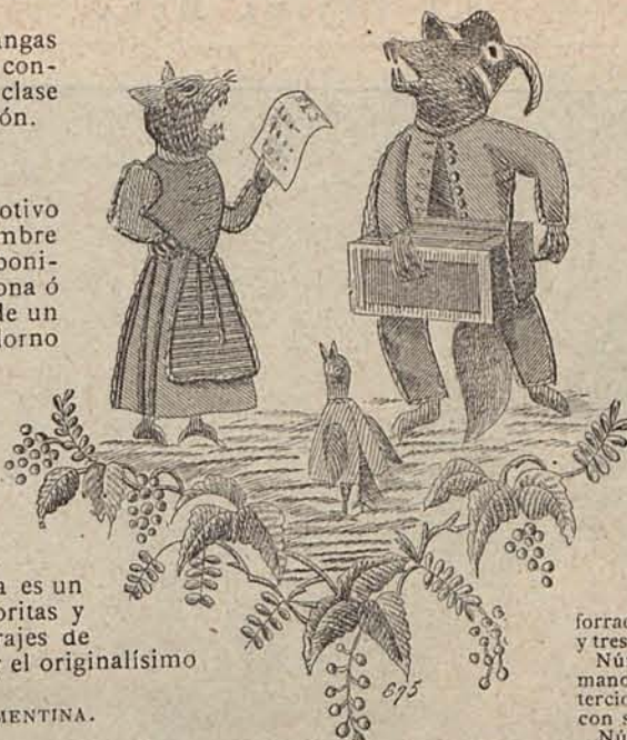
Núm. 4.—MOTIVO BORDADO.

Núm. 9.— PANORAMA DE TOILETTES DE BAILE .—(1) Traje de seda gris plata .—Falda recta, formando larga cola plegada. Los contornos del borde inferior se acentúan por medio de un triple rizado del mismo tejido. Cuerpo drapeado, escotado acentuadamente. Mangas globo. Escarolados de encaje de plata adornan los hombros y el peinado. Abanico de gasa azul. Tela necesaria para el traje, 26 metros de seda. Precio del patrón: 5 pesetas. (2) Traje de seda verde Nilo .—Cuerpo muy corto, escotado en redondo, adornado con encajes y bordados de perlas. De la parte inferior del escote sale una larga túnica de tul rosa, bordado de perlas, que vela el delantero de la falda. Esta última se prolonga en larga cola, plegada al estilo Watteau . Mangas abul-