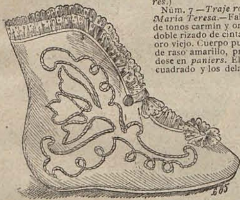
Núm. 5.—BOTITA PARA NIÑO PEQUEÑO.

Núm. 7.— Traje rococó de la época de María Teresa .—Falda de seda brochada de tonos carmín y oro, guarnecida con un doble rizado de cinta de raso oro viejo. Cuerpo puntiagudo de raso amarillo, prolongándose en paniers . El escote es cuadrado y los delanteros se