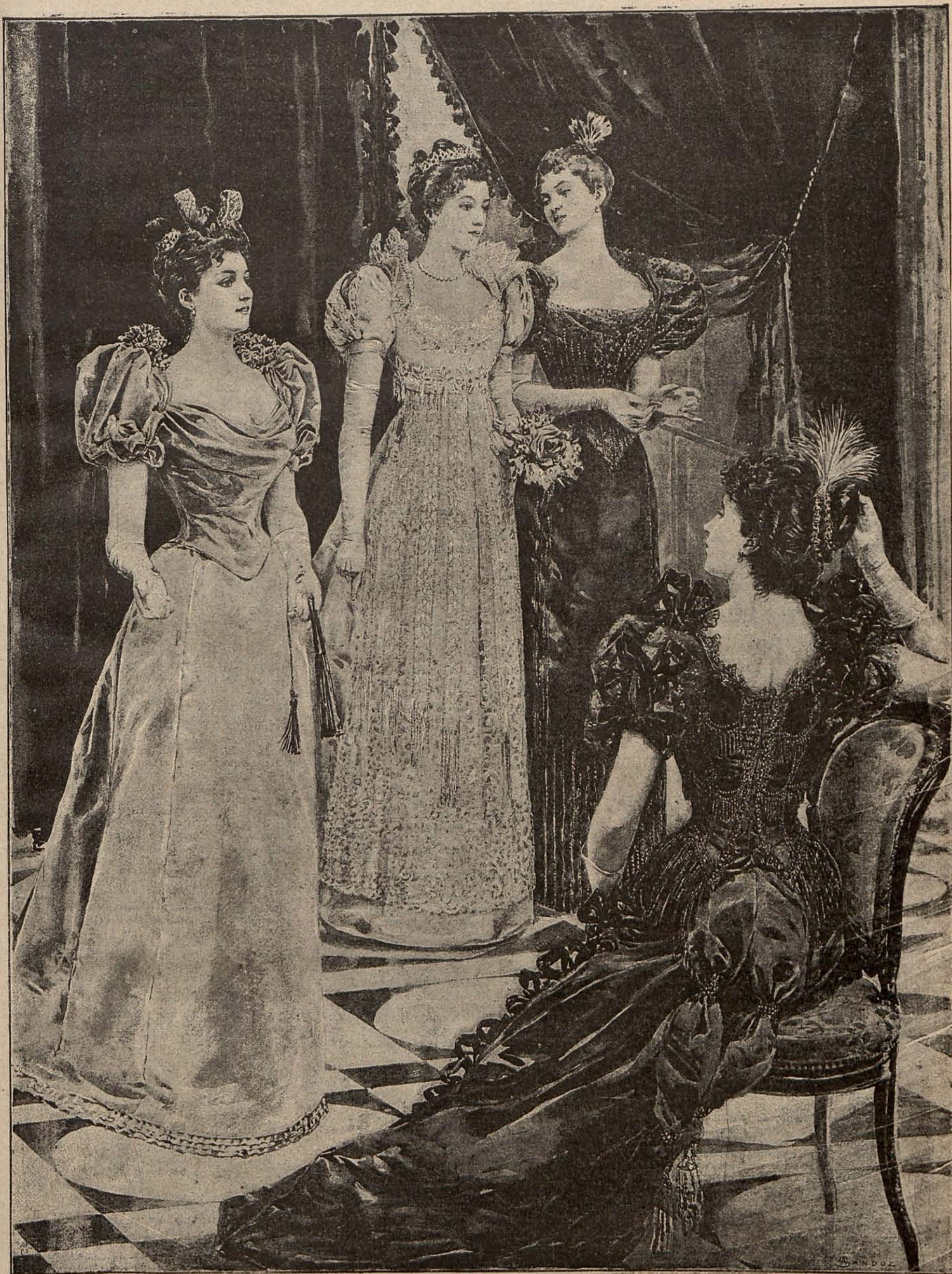
NUM. 9.—PANORAMA DE TOILETTES DE BAILE,