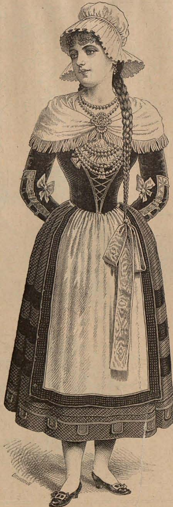
NUM. 2.—ALDEANA FANTASÍA.

Núm. 2.—Aldeana fantasía.—Corpiño de terciopelo violeta, cerrado delante con cordones de oro. La parte superior desaparece bajo un fichú drapeado de raso maiz, rodeado de flores de pasamanería de oro. Mangas de terciopelo, guarnecidas con galones de oro y lazos de cinta maiz. La falda es de seda cuadrículada y lu-