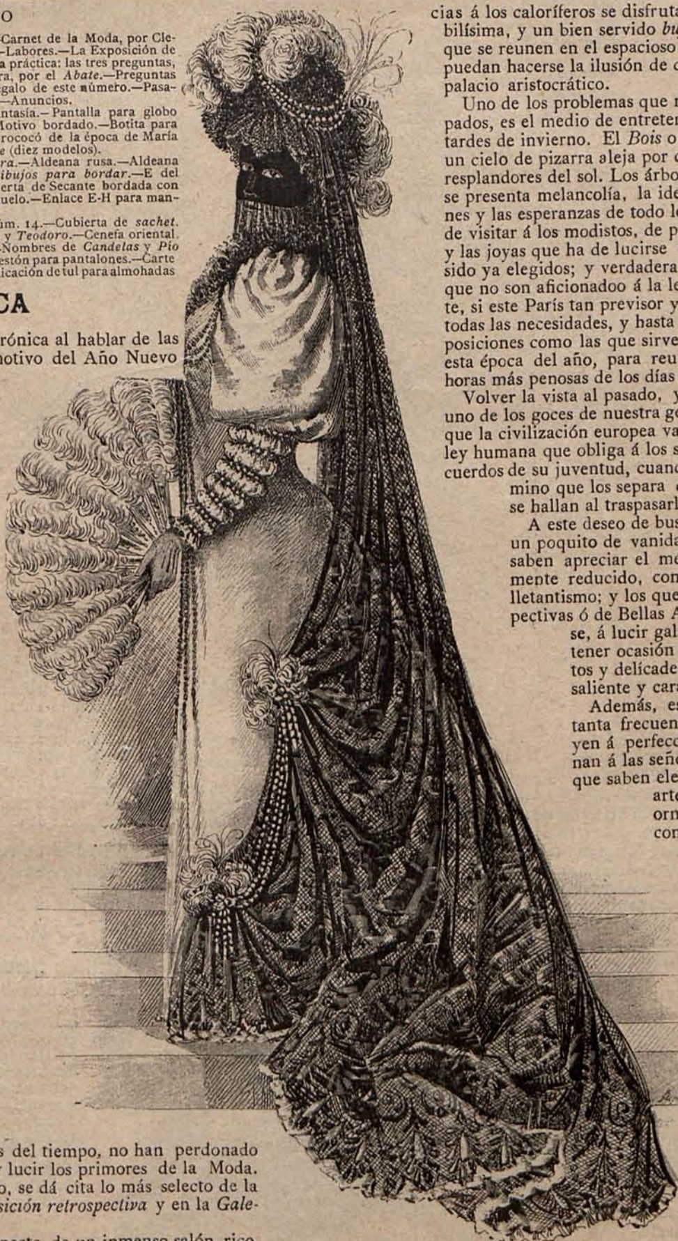
NUM. 1.—DOMINÓ FANTASÍA.

Entre los muebles más notables, se vé un clavicordio de madera esculpida y dorada, representando delfines y náyades, que sostienen el instru-