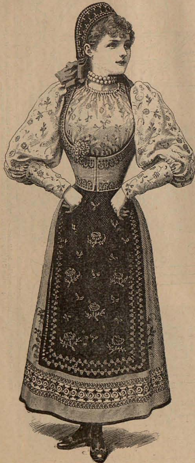
Núm. 1.—ALDEANA RUSA.

Núm. 1.—Aldeana rusa.—Falda de fino paño verde esmeralda, guarnecida en el bajo por una cenefa bordada con seda negra é hilillo de oro. Los contornos del borde inferior se ribetean con un ancho galón de terciopelo negro. Delantal de terciopelo negro bordado de oro. Justillo de igual