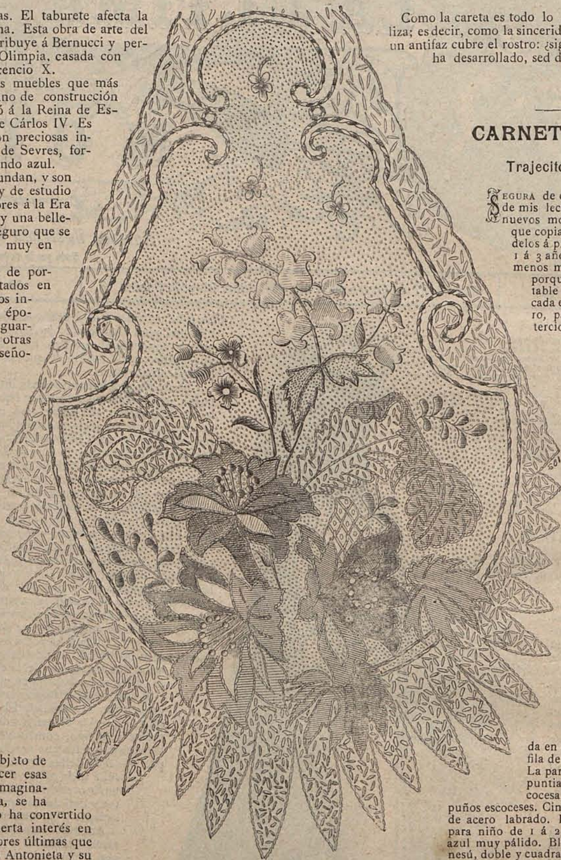
NUM. 2.—PANTALLA PARA GLOBO DE LÁMPARA.

Constituyen estas mangas la alta novedad del momento y son igualmente adoptadas para trajes de baile y para trajes de visita ó paseo, sin más alteración que la de co-