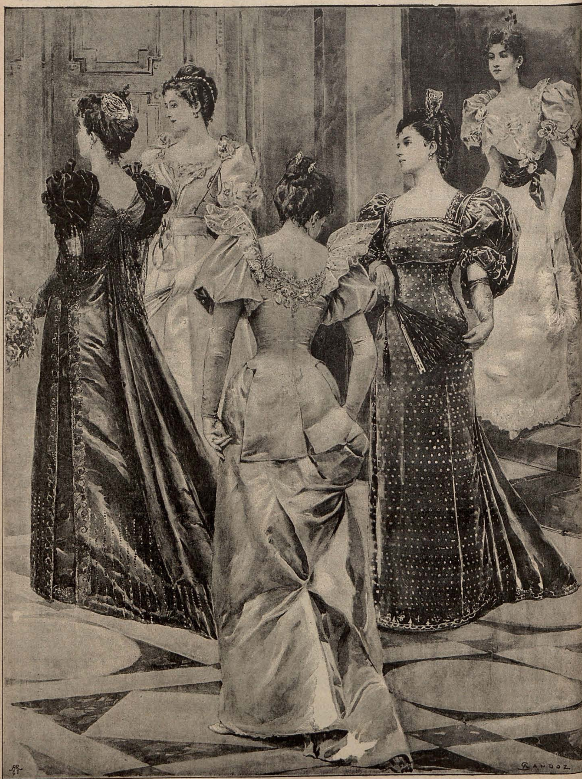
NUM. 8.—PANORAMA DE TOILETTES DE SOIRÉE.