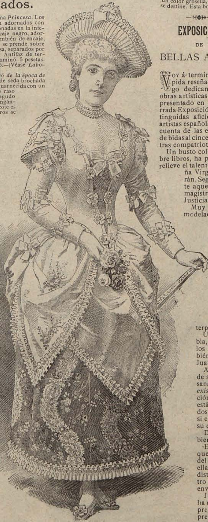
Núm. 7.—TRAJE ROCOCÓ DE LA ÉPOCA DE MARÍA TERESA.

nadas. Diadema y collar de oro y perlas. Tela necesaria para el traje, 20 metros de seda y tres de tul perlado. Precio del patrón: 5 pesetas. (3) Traje de terciopelo amatista .—Cuerpo puntiagudo, abierto sobre una camiseta de tul perlado, escotada en redondo. Las mangas son de tul y terciopelo. Falda Princesa de terciopelo, guarnecida con flecos de pasamanería perlada. El peinado se adorna con una mariposa fantasía. Tela necesaria para el traje, 22 metros de terciopelo y dos de tul perlado. Precio del patrón: 5 pesetas. (4) Traje de terciopelo tornasol .—Cuerpo corto, adornado con profusión de flecos y aplicaciones de azabache. El escote, luce en calidad de adorno, un borde de pluma rosa. Mangas abullonadas, con altas hombreras escaroladas. La falda se prolonga en majestuosa cola, guarnecida del mismo modo que el cuerpo. El delantero se separa de la cola por medio de caprichosas guirnalda de cocas de cinta, que parten de la cintura y terminan en el borde de la falda. El peinado está adornado con un círculo Diana de pedrería y un esprit de pluma rosa. Tela necesaria para el traje, 26 metros de terciopelo. Precio del patrón: 5 pesetas.