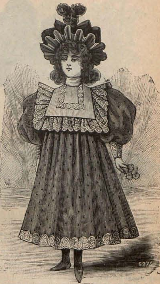
Num. 8.—Traje para niña de 2 á 4 años.

las prácticas del catolicismo, cuanto amengua las virtudes cristianas que deben ser las mejores amigas, las íntimas y asiduas compañeras de nuestra conciencia. Considerados por el Santo Evangelio los ricos como administradores de los pobres, é interpretando en su verdadero y justo sentido las hermosas palabras de Jesús: «dad á Dios lo que es de Dios y al César lo que es del César,» no oponen un dique á esa sed y placeres y de goces, que parece ser el distintivo de los afortunados de nuestra época, sino que encauzan el torrente para que convertido en numerosos arroyos, fertilicen el suelo que recorren. Es decir, la Iglesia, amantísima madre, desea para sus buenos hijos recreo y esparcimiento, siempre que al disfrutar de los bienes y grandezas del mundo piensen los dichosos en los desgraciados.