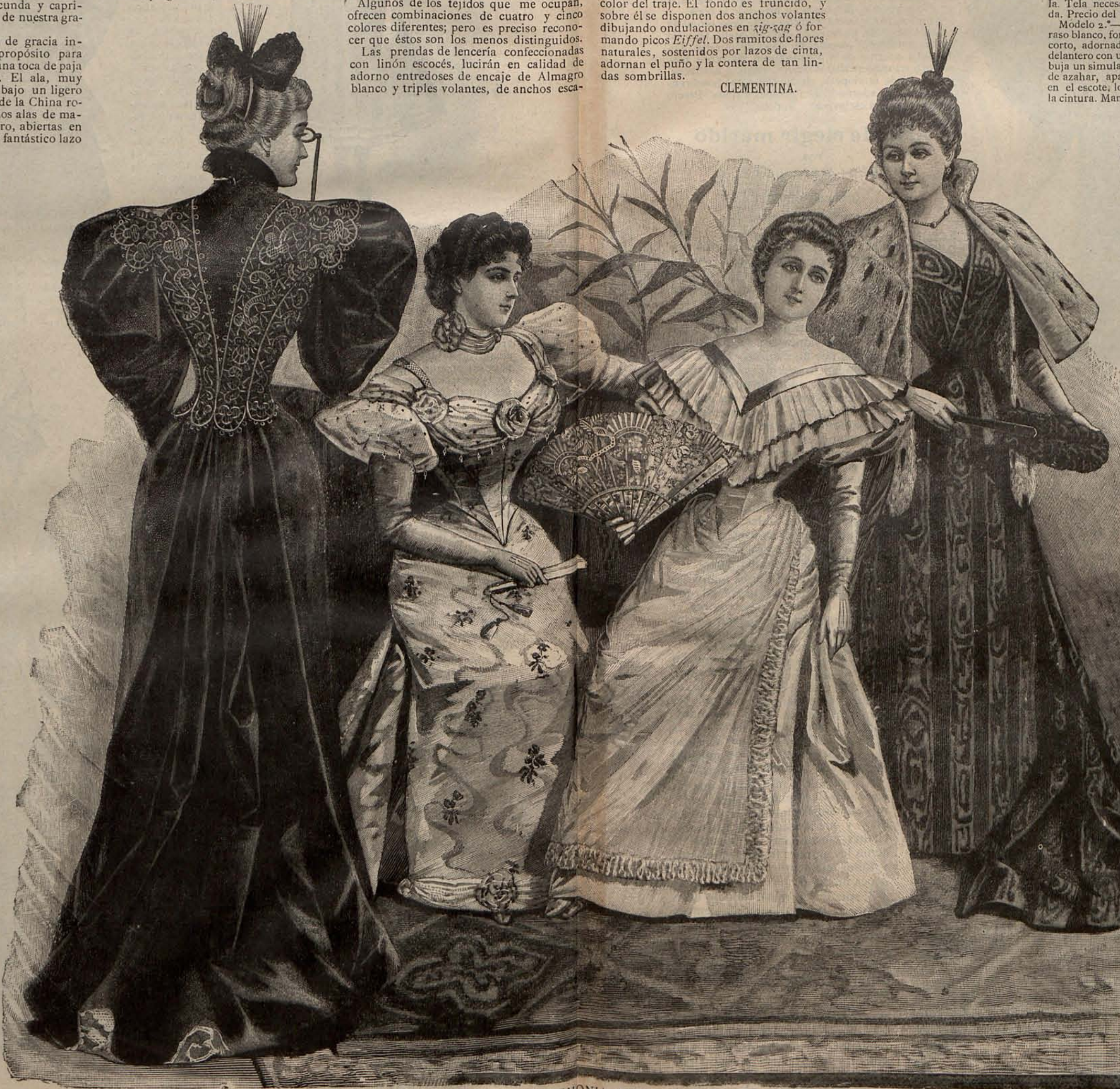
Núm. 16.—TRAJE DE CEREMONIA Y TRAJES DE SOIRÉE