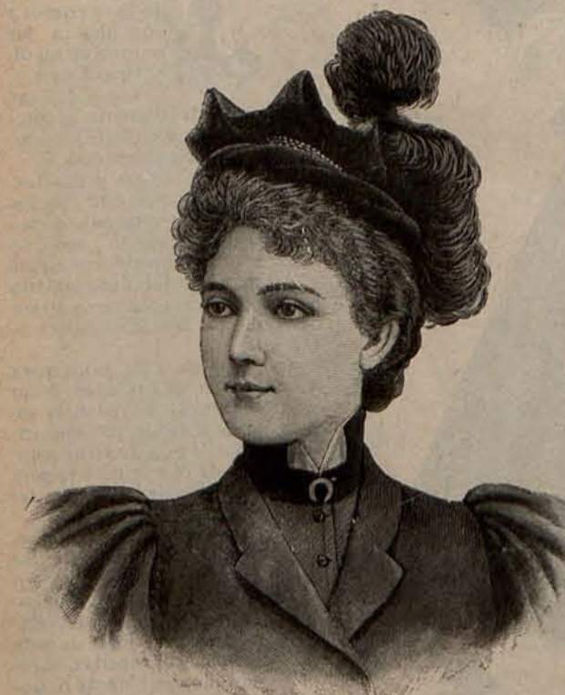
Num. 12.—Sombrero Milagros.