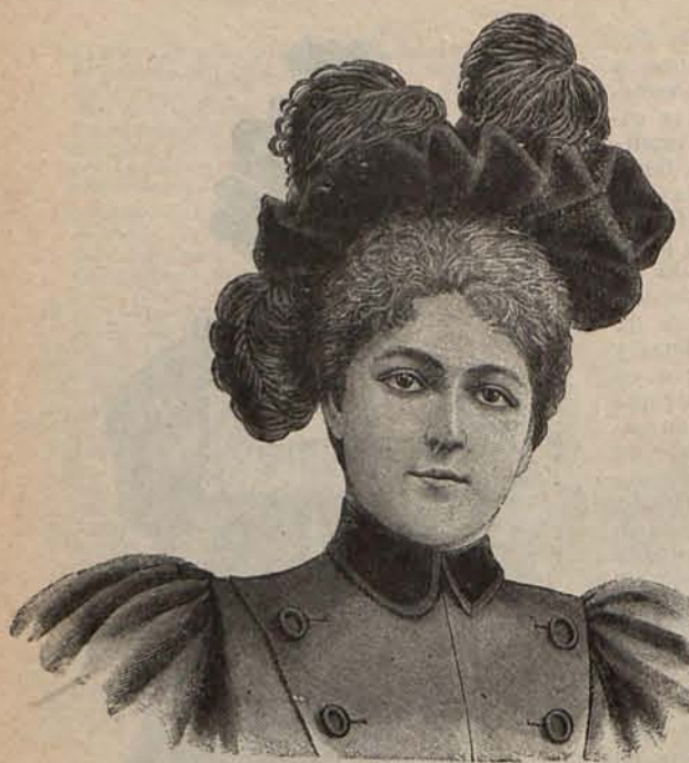
Num. 10.—Sombrero Angeles.

forma de abanico. El turbante se cierra en la parte de detrás de la toca con un fantástico lazo de encaje negro, de cuyo centro se escapan varias hortensias de rosados matices. Bidas de terciopelo negro, rematadas con grupitos de hortensias.