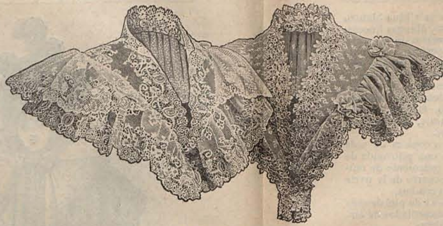
Num. 14.—Adornos sobrepuestos.

Las prendas de lencería confeccionadas con linón escocés, lucirán en calidad de adorno entredoses de encaje de Almagro blanco y triples volantes, de anchos esca-