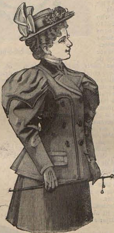
Num. 7.—Chaqueta de Primavera (Delantero)

En cuanto á los adornos, nada puede decirse en concreto: tantos y tan diferentes son los que gozan de igual favor. Veremos muchas flores de seda sueltas ó agrupadas, algunas plumas blancas ó negras sobriamente rizadas, infinidad de alas de mariposa y de fantásticos pája-