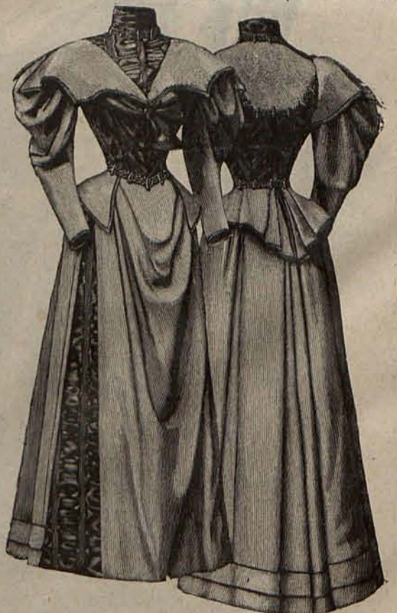
Num. 5.—Traje para visita. (Delantero y espalda)