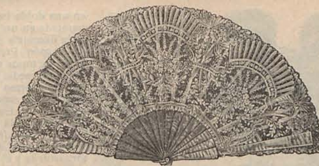
Num. 15.—Abanico de encaje.