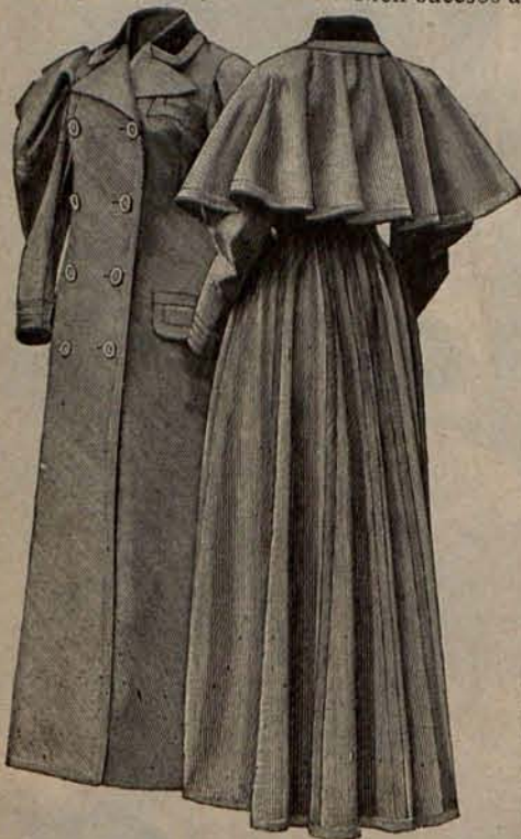
Num. 3.—Sobretudo para viaje. (Delantero y espalda)