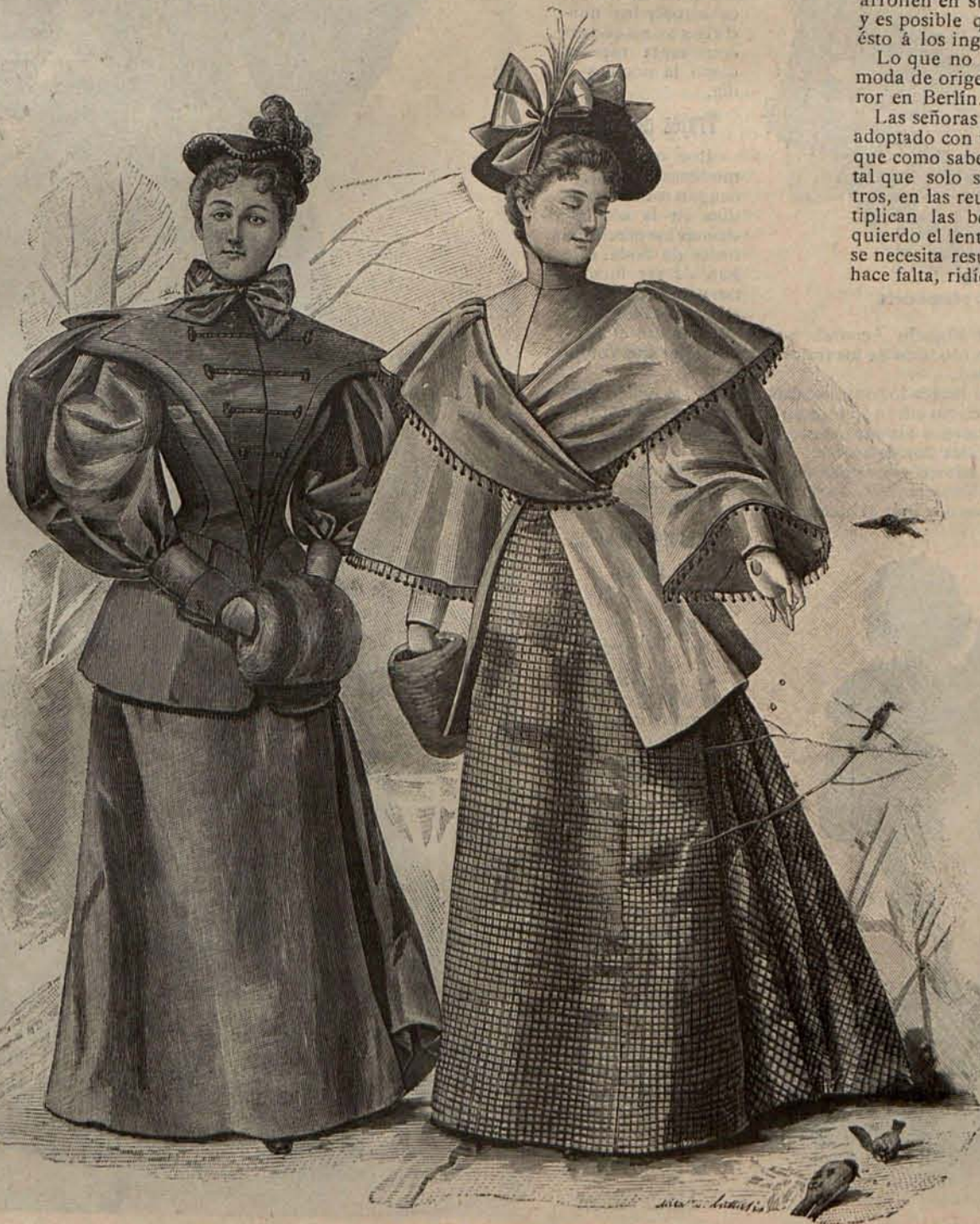
Num. 9.—Trajes para paseo.

Constituye en estos momentos novedad en el