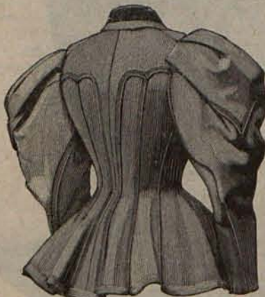
Num. 4.—Chaqueta de Primavera. (Espalda). (VÉASE EL GRABADO NÚM. 7.)