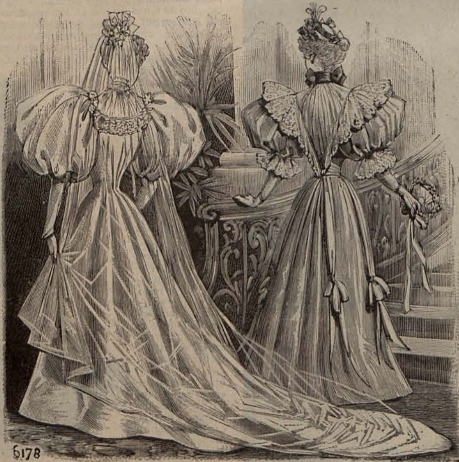
Num. 21.— Reverso del Figurin Acuarela .

como en el delantero. Mangas de pernil. Capota Mariposa , de terciopelo negro, adornada con un esprit de filigrana de oro. Tela necesaria para el traje, 24 metros de terciopelo. Precio del patrón: 4 pesetas.—2. De seda brochada de tonos maiz y rosa de Alejandría. Una ligera drapería de gasa de seda maiz, acentúa el bajo del delantero de la falda. Cuerpo puntiagudo, escotado en redondo y cerrado de un modo invisible. Los contornos del escote se cubren con draperías de gasa de seda maiz, prendidas con grandes escarapelas de lo mismo. Mangas cortas, sumamente huecas. Tela necesaria para el traje, 18 metros de seda brochada y 4 de gasa de seda. Precio del patrón: 4 pesetas.—3. De raso hoja de lirio. Un delantero de crespón de la China blanco vela el delantero de la falda. Cuerpo-coraza, escotado en forma de corazón. Su gracioso adorno consiste