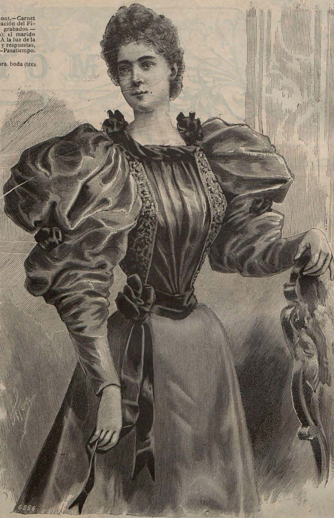
Num. 2.—Traje para Comida.

Pero no quiero aumentar la tristeza de mis lectoras con estas reflexiones. El crudo Invierno ha desaparecido; la Primavera, aunque con timidez todavía, vá cambiando el aspecto de la Naturaleza y como siempre, con sus encantos abre el corazón á la esperanza. La salud ha mejorado también, y París ofrece en medio de la austeridad de la Cuaresma, una animación que no suele notarse otros años hasta que con la Pascua comienzan las grandes fiestas sociales, las Exposiciones de Bellas Artes y los Carreras de