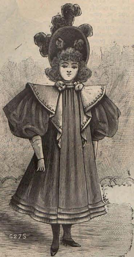
Num. 6.—Traje para niña de 2 á 4 años.

den social como de la conciencia en el individual.