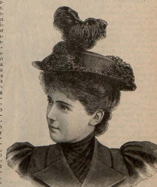
Num. 19.—Sombrero Manolita.