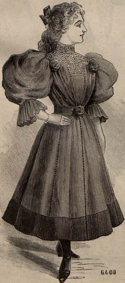
Num. 6.—Traje para niña de 8 á 10 años.

Una de las más acreditadas fábricas de corsés de París, que debe en gran parte la fama universal de que goza á sus corsés Criolla , pre-