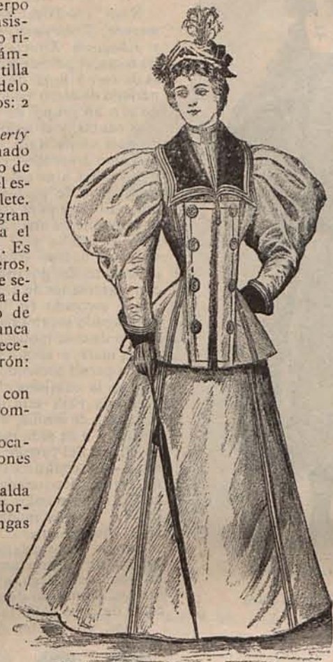
Num 19—Traje corte de sastré

Hay costumbres como las de llevar a los niños a los teatros, aunque sea por la tarde, que