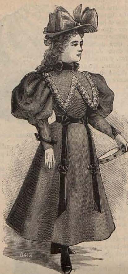
Num. 14. Traje para niña de 5 a 7 años.

En el número de los modelos de sombreros más inéditos de la actual estación, se cuenta el sombrero Mariposa , de cuya fantástica forma da exacta idea la figura 2.ª del grabado núm. 18 del presente número. La copa no tiene otra armadura que un doble círculo de alambre, en cuyo interior se coloca un