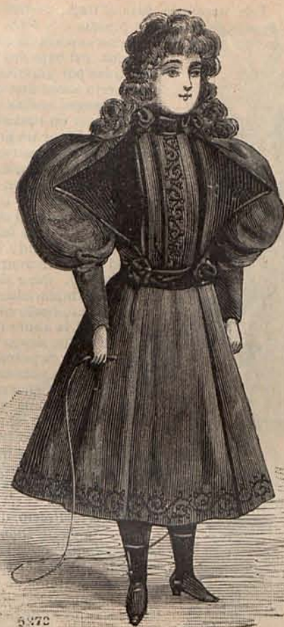
Num. 16. Traje para niña de 7 a 9 años.