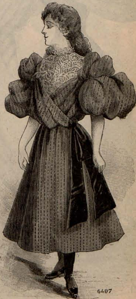
Num. 12.—Traje para niña de 9 á 11 años.