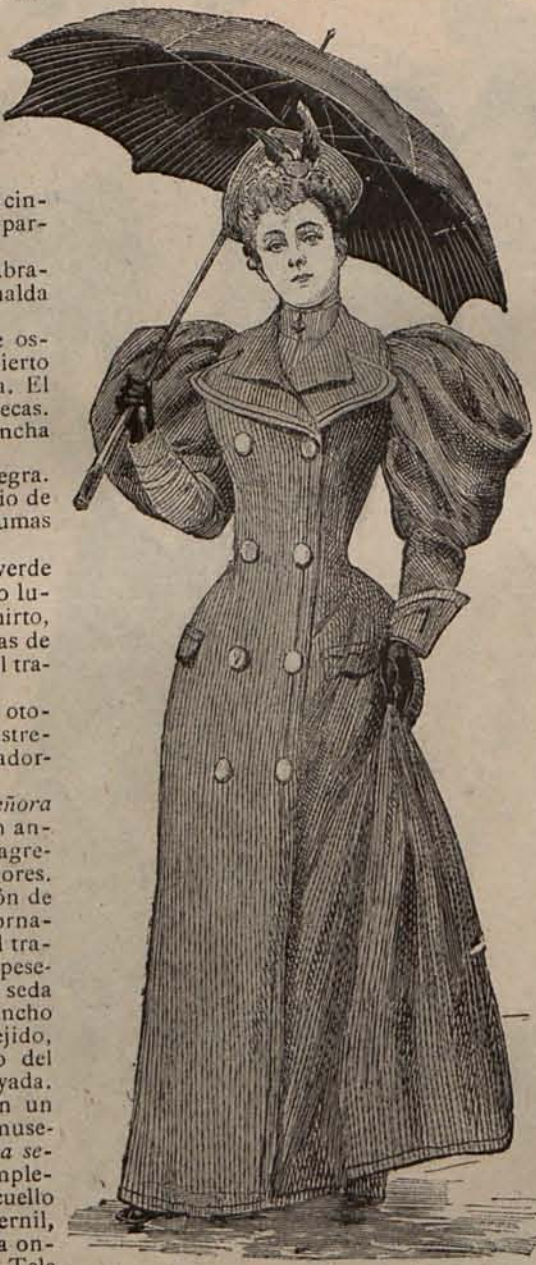
Num 20—Sobretudo de entretiempo