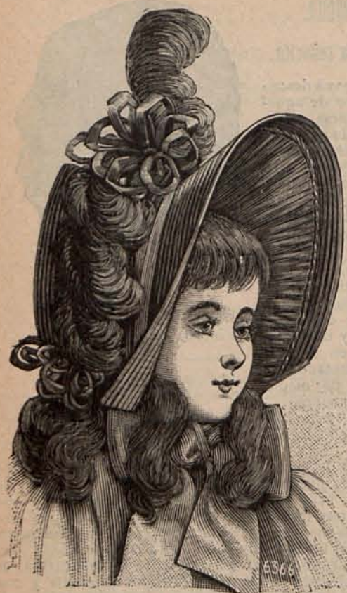
Num. 13. Sombrero para niña de 2 a 4 años.

miados en varias Exposiciones y adoptados por la mayoría de las parisienas elegantes, nos ofrece en calidad de alta novedad para Primavera y Verano el corsé Céiro, de una ligereza y flexibilidad superiores á todo elogio.