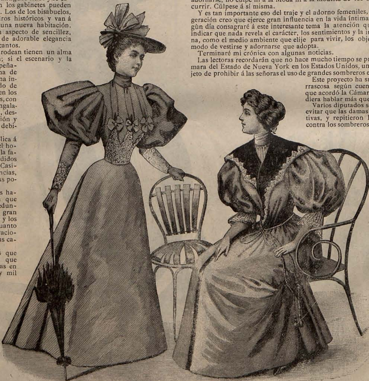
Num 3.—Traje para visita y Bata elegante.

Estamos poniendo en práctica la parábola del hijo pródigo. Los esplendores sociales, la vida exterior, han apartado de nuestra alma muchos goces que deseamos recuperar, y la necesidad del hogar, de la vida íntima, se experimenta hoy con más fuerza que nunca.