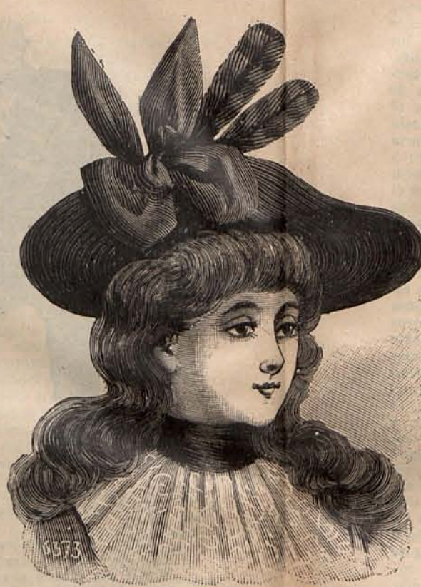
Num. 15. Sombrero para niña de 6 a 8 años.

Una casa de confección de París, especialidad en artículos para lutos, ha expuesto en sus escaparates con carácter de novedad varios modelos