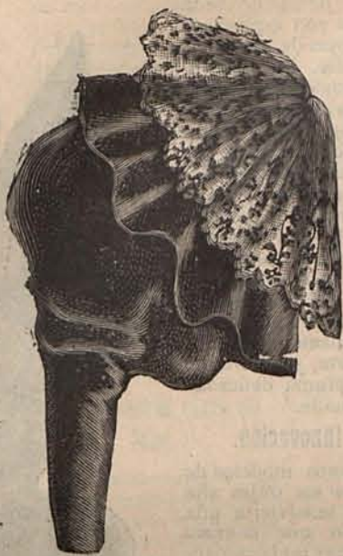
Num. 4.—Manga para traje de paseo.

zado en Europa y América, de la que todos se quejan y todos practican, ó mejor dicho han practicado, porque lo que es ahora se trata de abolirla de verdad.