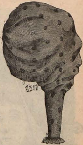
Num. 10.—Manga para traje de calle.

El tocado que se adopte con el traje que acabo de describir, debe consistir en un sombrerito masculino de paja gris, con cinta del mismo color y hebilla haciendo juego con la del cinturón; los guantes serán de cabritilla gris, y el calzado también gris, compuesto de medias de borra de seda y altas botinas cerradas con cordones de seda.