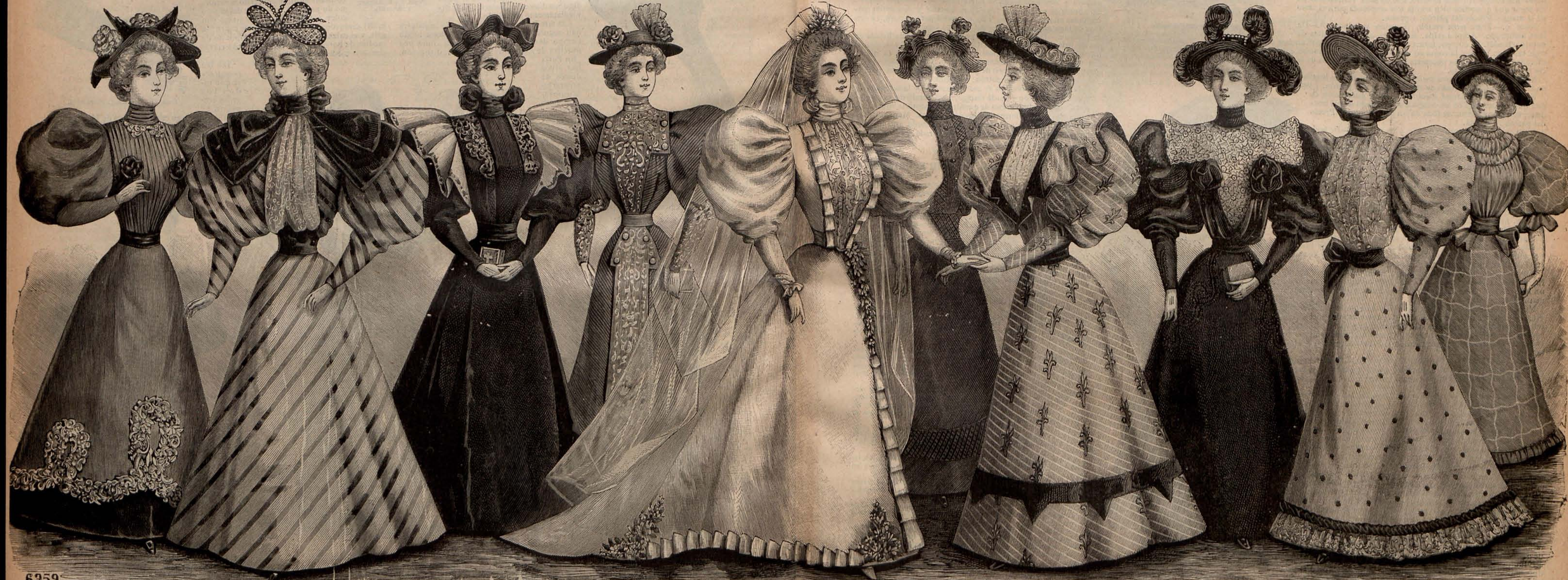
Núm. 18. GRUPO DE TOILETTES ALTA NOVEDAD.