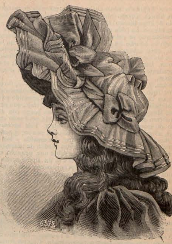
Num. 17. Capelina para niña de 3 a 5 años.

Núm. 2. — Trajes de Primera Comunión. — Modelo 1. — Es de muselina de lana