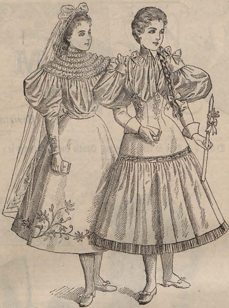
Num. 2.—Trajes para Primera Comunión.

La mujer no debe, por pereza ó temor abandonar la dirección del adorno y disposición de su casa. Los detalles al parecer insignificantes, influyen en el bienestar ó las desdichas de una familia.