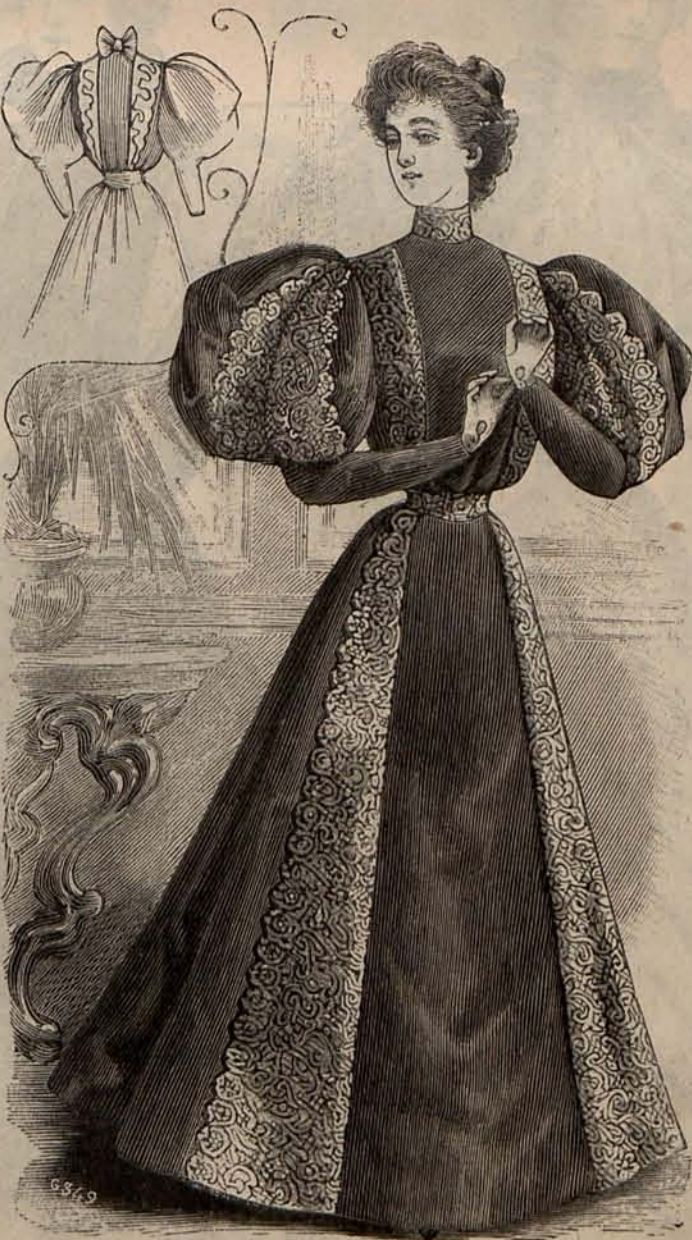
Num. 9.—Traje para recibir. (Espalda y delantero).

que me propongo describir con todos sus detalles en mi próxima Crónica, porque es un cuadro de costumbres, brillante de color y muy característico.