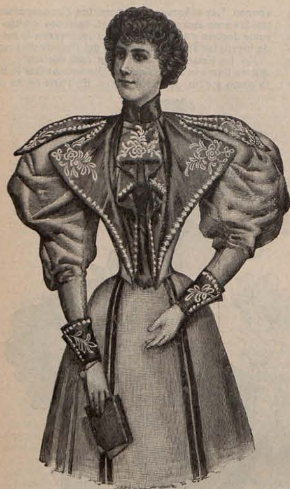
Núm. 8.—Traje para recibir.

La higiene, el decoro y la belleza ganarían, ya que es preciso perder un poco la gravedad para no quedarse atrás en la vertiginosa marcha que es la característica de nuestros tiempos.