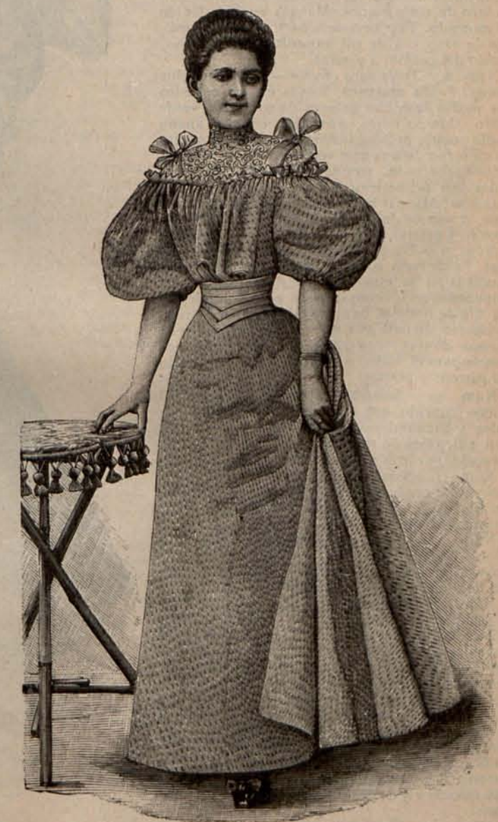
Núm. 19.—Traje de soirée para señorita.