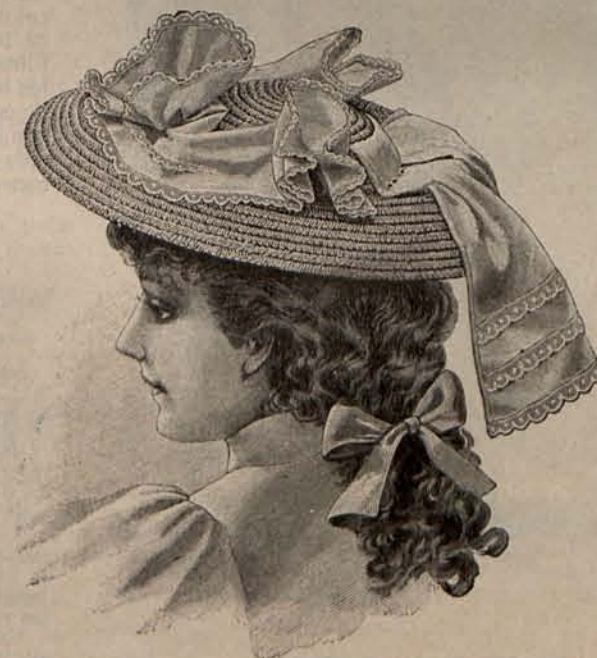
Núm. 17.—Sombrero para niña de 5 á 7 años.

seo, gozando de marcada preferencia en el mencionado tejido, los tonos rosa oscuro, fresa, dalia, coral, hortensia, azul pizarra, verde musgo y lila muy pálido. Es de advertir que los trajes de crepón de lana exigen forros de seda del mismo color y adornos frescos y vaporosos, tales como encajes, cintas y rizados ó draperías de gasa de seda.