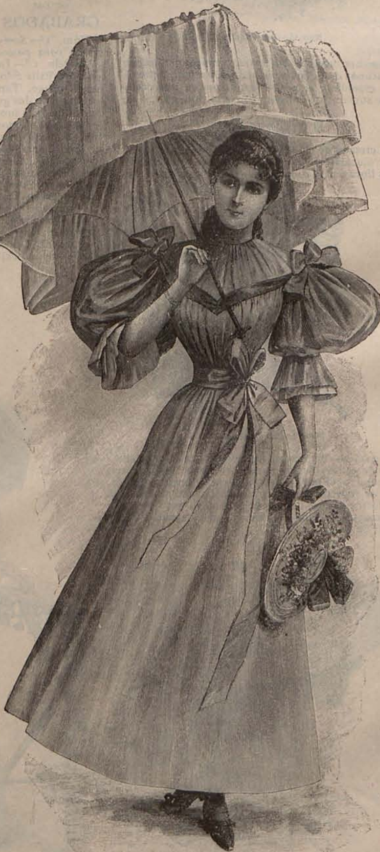
Num. 21.—Traje de paseo para señorita.

Madrid se divierte y la diosa Cibeles desde la nueva altura en que está colocada, ha podido presenciar re-