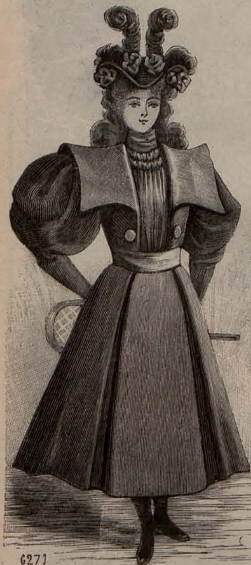
Num. 2.—Traje para niña de 8 á 10 años.