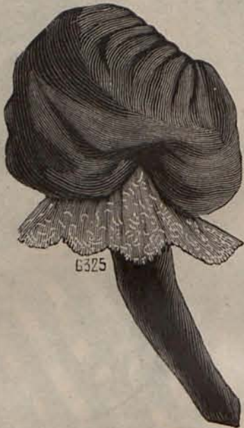
Num. 4.—Manga fantasía

de los billetes, que por estar al servicio del preñero había llevado el mueble desde la casa del pintor á la preñería, tuvo una feliz ocurrencia: —Ese dinero no es de usted ni de usted—dijo á los contendientes—es del pobre hombre que vendió el mueble ignorando que poseía esa can-