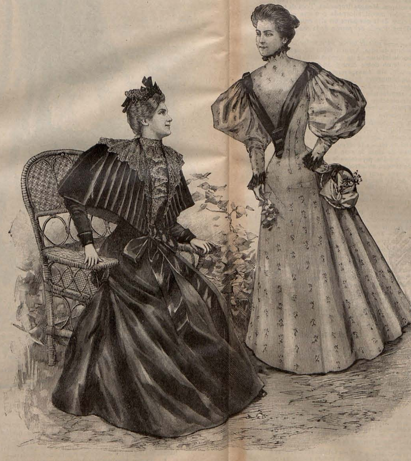
Núm. 14.—TRAJES PARA JARDIN