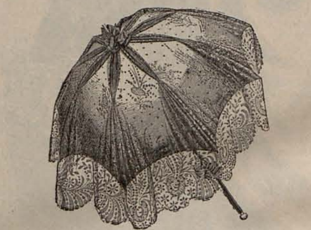
Núm. 11.—Sombrilla para paseo.

En el segundo detalle se ondula el cabello de las sienes y de detrás de las orejas, peinándolo de modo que oculte la parte superior de estas, y luego se cruzan los mechones en el centro de detrás de la cabeza fijándolos con una peineta de concha oscura simulando media estrella.