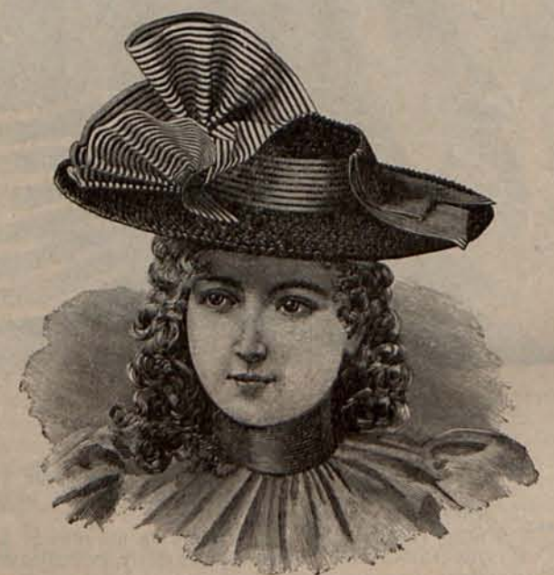
Núm. 12.—Sombrero para niña de 9 á 11 años.

El último detalle del peinado se reduce á reunir los dos mechones cruzados con el mechón que se dejó sobre la espalda, formando con ellos un retorcido que se va