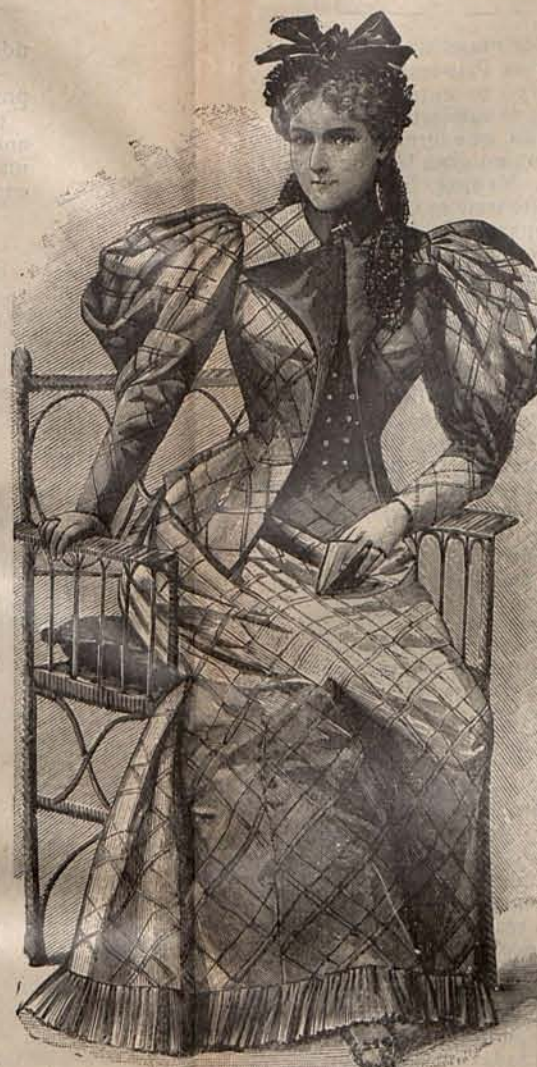
Núm. 13.—Traje de paseo para señora mayor.

Las chaquetas son bastante cortas con aldetas ligeramente