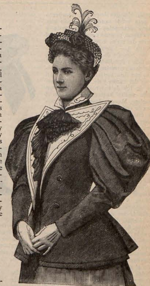
Núm. 18.—Chaqueta de Primavera.

Núm. 2.—Traje para niña de 8 á 10 años.—De lanilla verde sauce. Amplia falda formando á los lados del delantero dos palas interiores. Cuerpo corto, guarnecido con un ancho cuello vuelto de faya marfil. Los delanteros se abren sobre una camiseta de igual tejido que el cuello, del que también es el cinturón que ajusta el