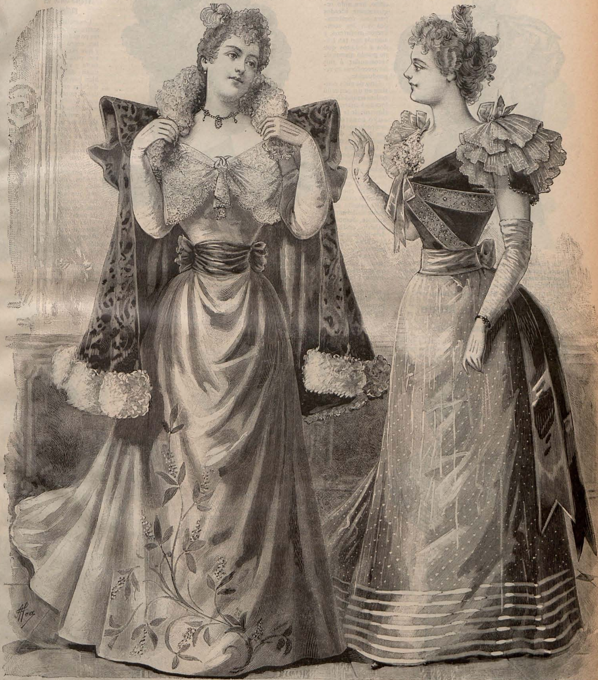
Núm. 1.—TRAJES PARA BAILE

En los Estados Unidos es ya cosa corriente, y ni siquiera llama la atención. El bello sexo utiliza la bicicleta como medio de locomoción. En París no ha pasado