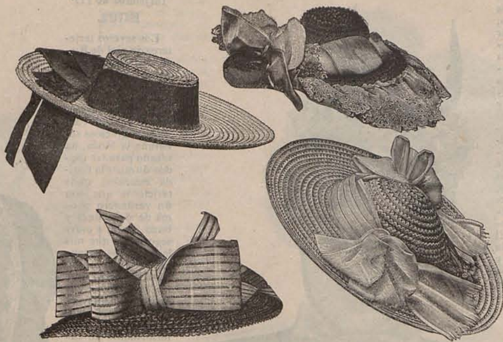
Num. 20.—Sombrero de Verano para niñas y niños.

Núm. 14.— Trajes para jardín .—Modelo 1.—