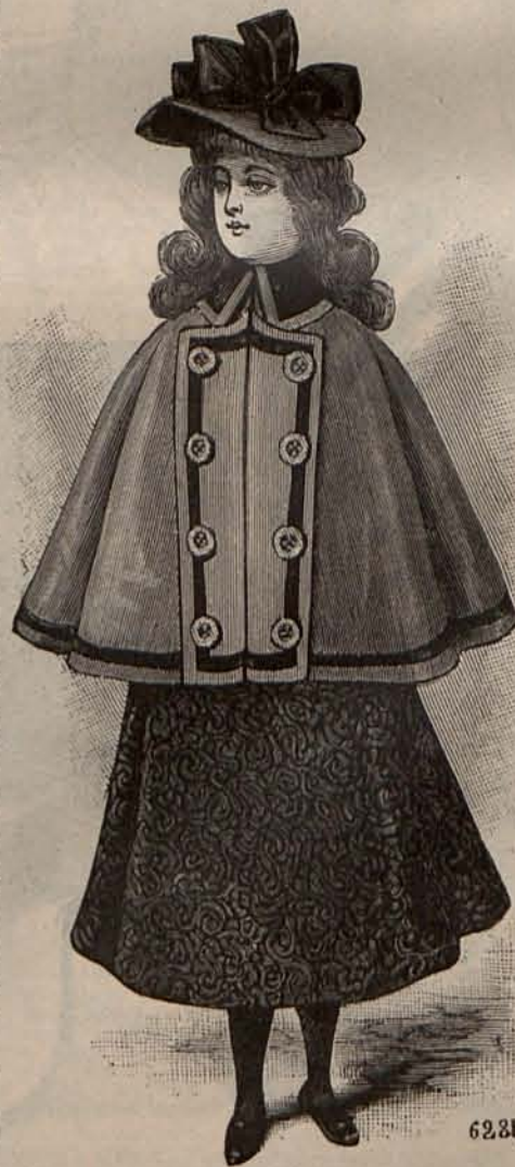
Num. 6.—Escavina para niña de 6 á 8 años.