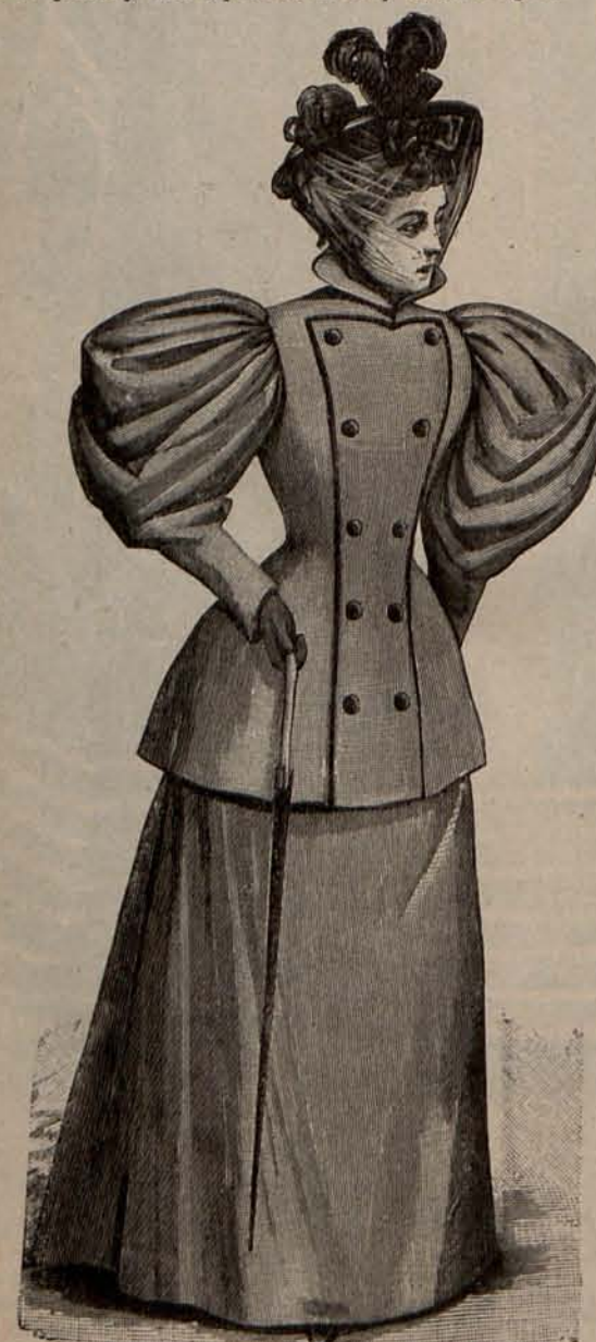
Núm. 9.—Traje para calle.