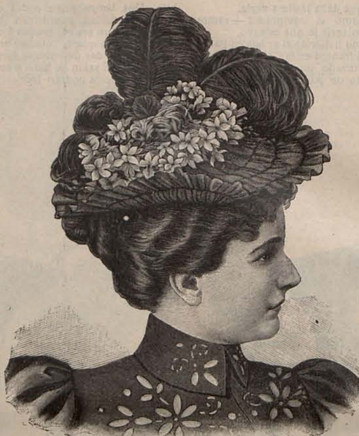
Núm. 10.—Sombrero MICELA.

El primer detalle del peinado que me ocupa, consiste en formar con la parte de cabello últimamente citada tres bucles Luis XV, que sirven de adorno á la parte superior de la frente dejando flotar momentáneamente sobre la espalda el extremo del mechón.