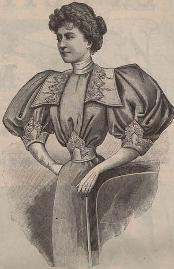
Num. 3.—Cuerpo alta novedad.

De música del porvenir fué calificada en tono de desprecio la del maestro alemán, y en efecto, el porvenir que es ya presente, ha confirmado con admiración aquel vaticinio. Temíase que ocurrieran desórdenes en el Teatro de la Opera al ponerse en escena la obra del maestro