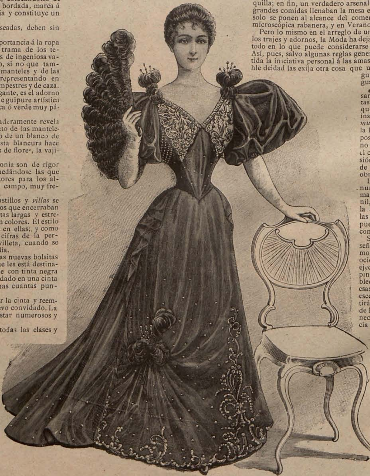
Num. 4.—Traje para soirée

recidas á las que emplean en Alemania los bebedores de cerveza. Estas jarritas evitan que haya necesidad de servir con frecuencia el vino y adornan la mesa.