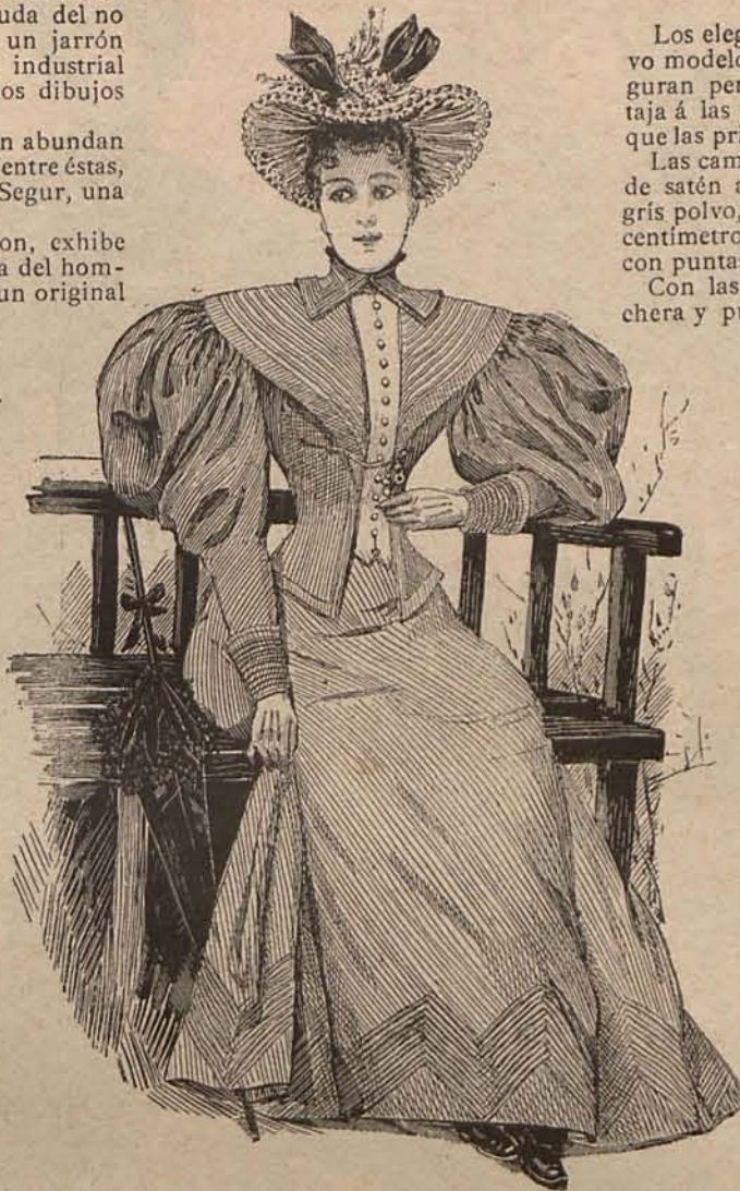
Num. 5.—Traje para paseo matinal

Complemento de éste traje, es un sombrero de paja blanca con copa redonda y ala ancha ligeramente vuelta, guarnecido con una cinta de seda listada azul y blanca, arrollada al rededor de la copa. Guantes blancos. Calcetines de idéntico color al del traje ó negros, y zapatos forma inglesa de tafilete ó charol.