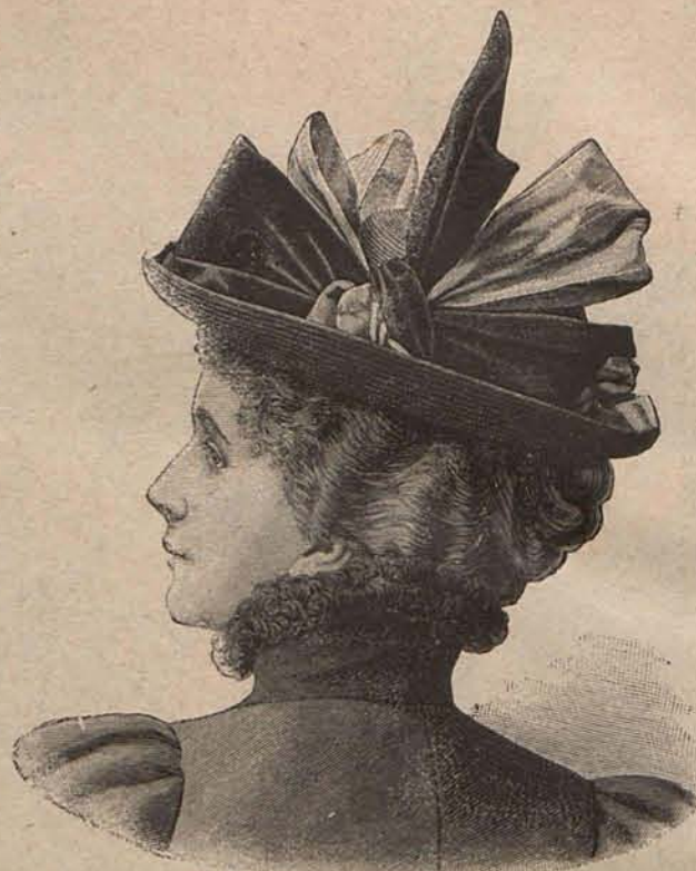
Num. 10.—Sombrero Gabriela

Núm. 8.— Sombrero ADELINA. —De paja labrada gris ceniciento. Su gracioso adorno consiste en dos lazos gemelos de cinta de pekin de tonos fresa y oro viejo. Núm. 9.— Sombrilla para paseo en carruaje. —Es de seda maíz, fondo que aparece velado en parte por tres volantes de muselina de seda blanca festoneados en los contornos. El puño, que es de esmalte azul, se adorna con una escarapela de cinta maíz. Núm. 10.— Sombrero GABRIELA. —De paja negra. El ala se abarquilla todo al rededor y la copa queda oculta bajo un gran lazo de raso rosa y terciopelo malva.