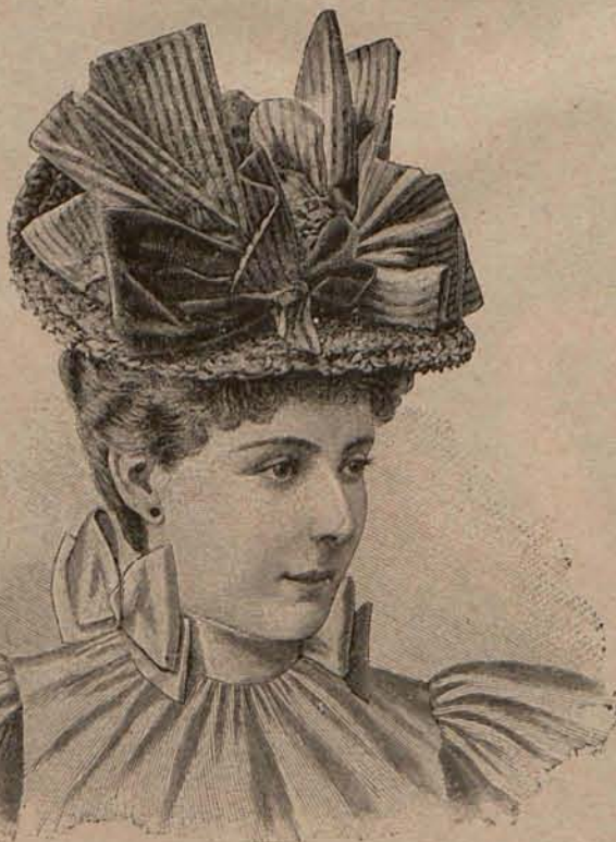
Num. 8.—Sombrero Adeline