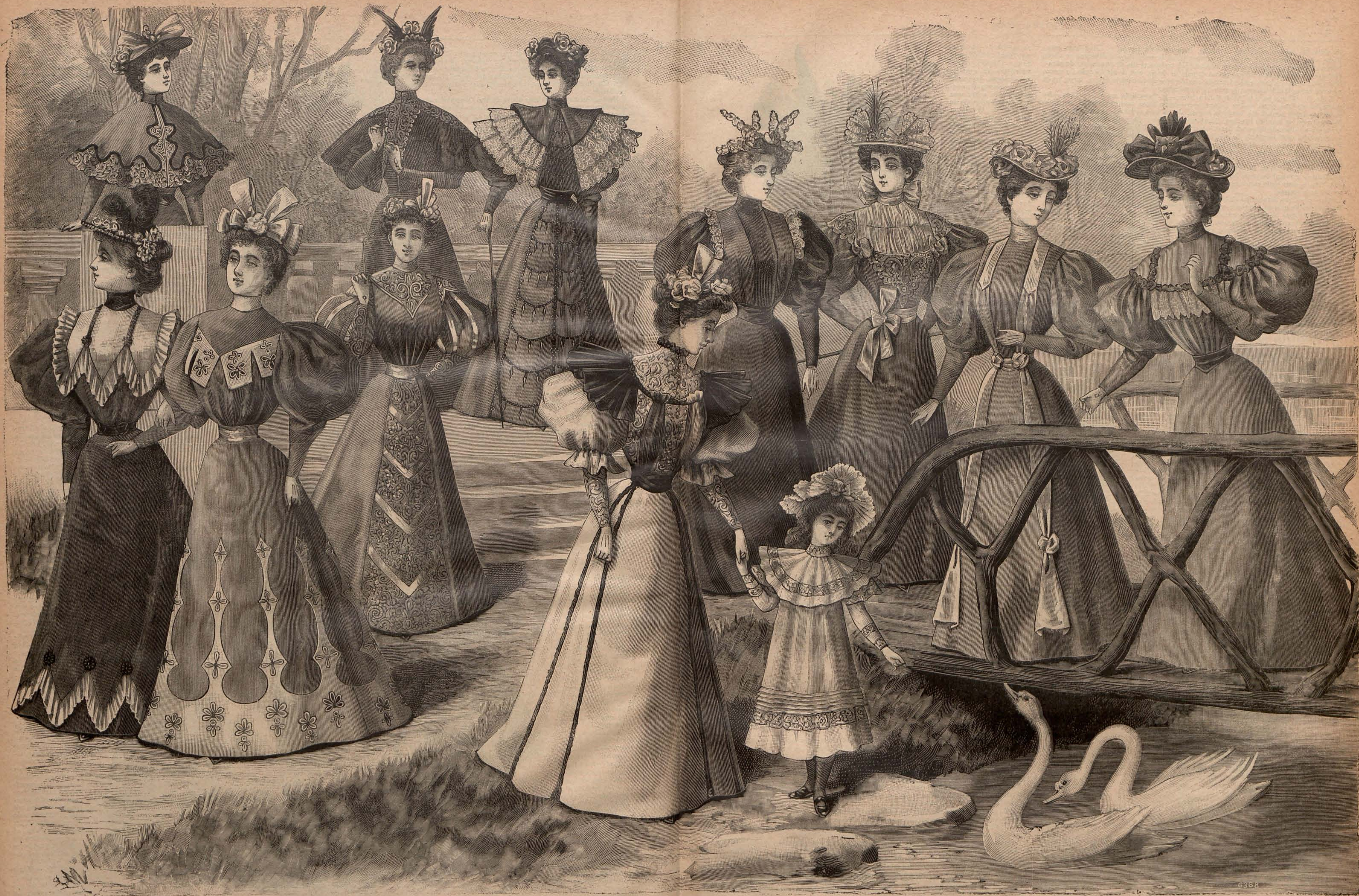
Núm. 7. - GRAN PANORAMA DE TRAJES PARA PASEO.