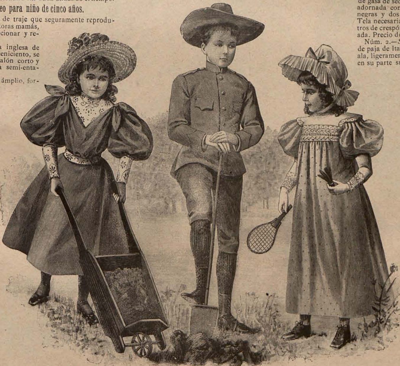
Num. 6.—Trajes para niños de 6 á 10 años

Núm. 5.—Traje para paseo matinal.—De lanilla diagonal color fresa. La falda luce en el bajo siete trencillitas