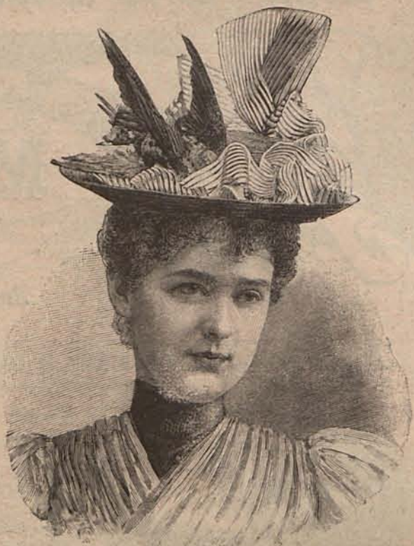
Num. 2.—Sombrero Elena

Han pasado de moda las copas de color para el vino, y solo se usan alguna que otra vez para los vinos de postre. Los vinos de pasto como el Burdeos ó el Borgoña en Francia y el Valdepeñas en España, se sirven en unas jarritas de cristal montadas en plata muy pa-