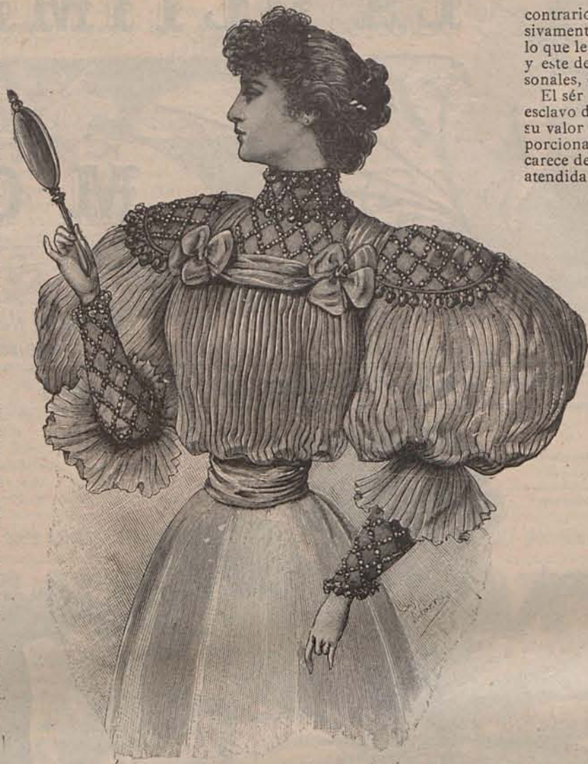
Num. 2.—Blusa para recibir.

Como ven las lectoras, aunque la pintura aparece