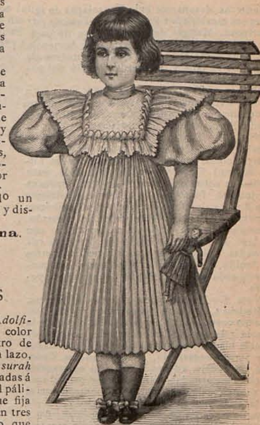
Num. 15.—Traje para niña de 2 á 4 años.

Núm. 3.—TRAJE PARA PASEO. (Delantero y espalda).—De muselina de lana beige oscuro. Falda campana, con delanteros. Chaqueta corta, cuyos delanteros de hechura Figaro , están acentuadamente abiertos sobre una camiseta abullonada de seda rosa muy pálido. La parte superior de los