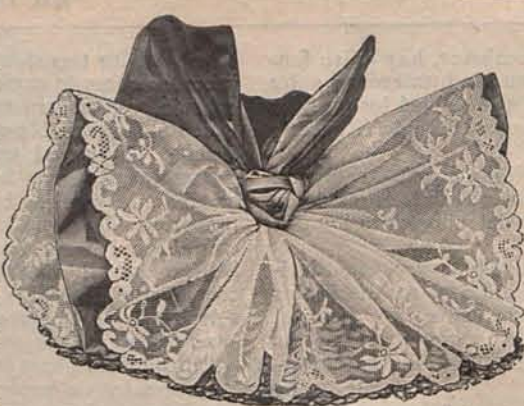
Num. 9.—Sombrero para playa.

Para playa, pantalón y americana de cheviotte color pergamino, camisa de batista rosa oscuro ó azul ceniciento, con pechera fruncida y cuello