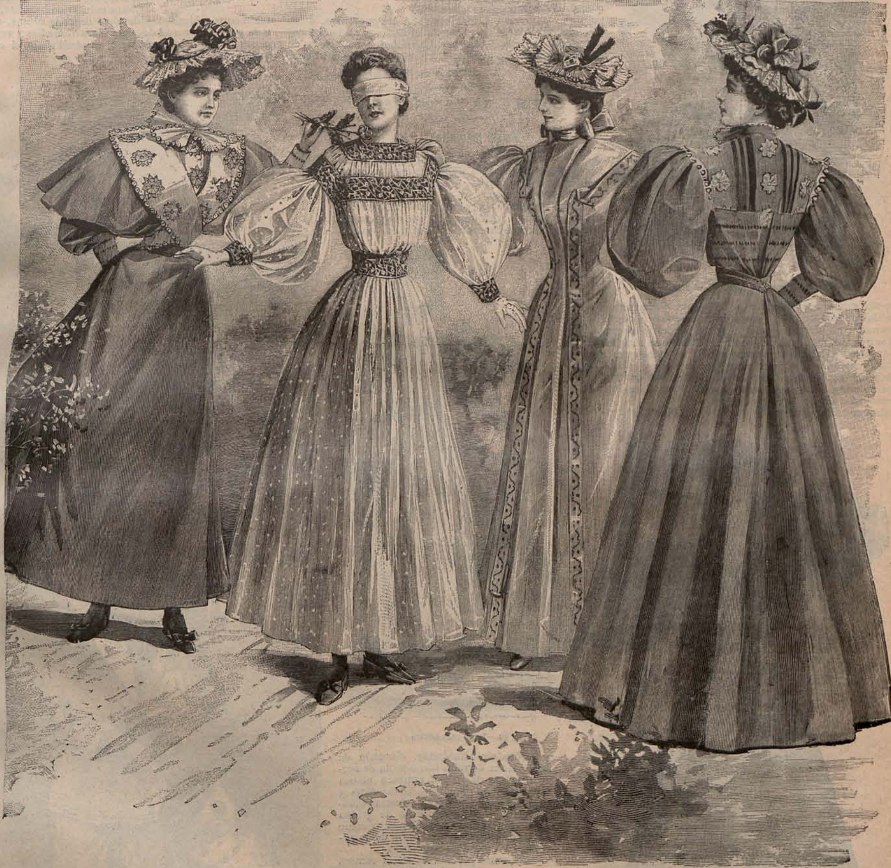
Núm. 6.—Trajes de campo para señoritas.

Mr. Wagner considera estos factores como los enemigos más temibles, por lo mismo que se nos presentan bajo el aspecto de amigos, y desea que la humanidad sea buena, entusiasta, confiada en la Providencia