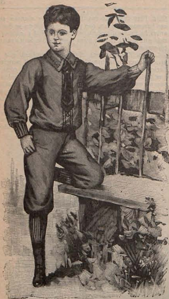
Num. 7.—Traje para niño de 7 á 9 años.

reposito, muchas aspiraciones al bien que permanecen tímidas porque no hallan apoyo; y conviene que con la misma forma literaria que el progreso moderno inspira á los que escriben y hace apreciar á los que leen los conceptos que se someten á su juicio, se demuestre á esas almas, que por la paz moral renunciarían gustosas á ciertas satisfacciones de vanidad ó de codicia, que no están solas, que hay á su lado almas hermanas impulsadas por los mismos deseos.