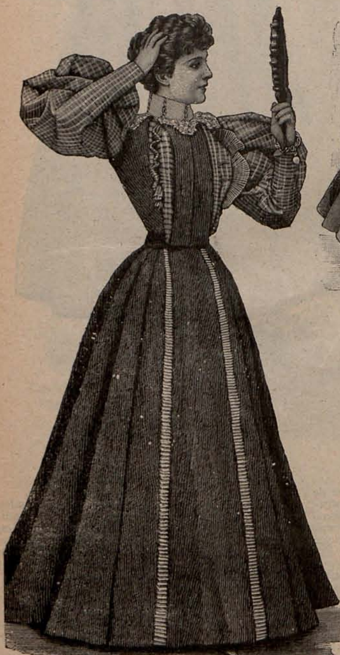
Num. 8.—Traje para recibir.