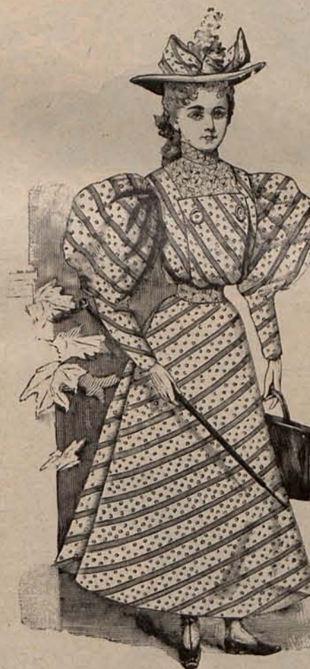
Num. 14.—Traje para niña de 12 á 14 años.

cotes novedad, se reduce á colocar en sus contornos una cinta de terciopelo ó seda, de la cual solo queda visible un centímetro. Dicha cinta es negra si el traje es claro, y de un matiz pálido si el traje es oscuro.