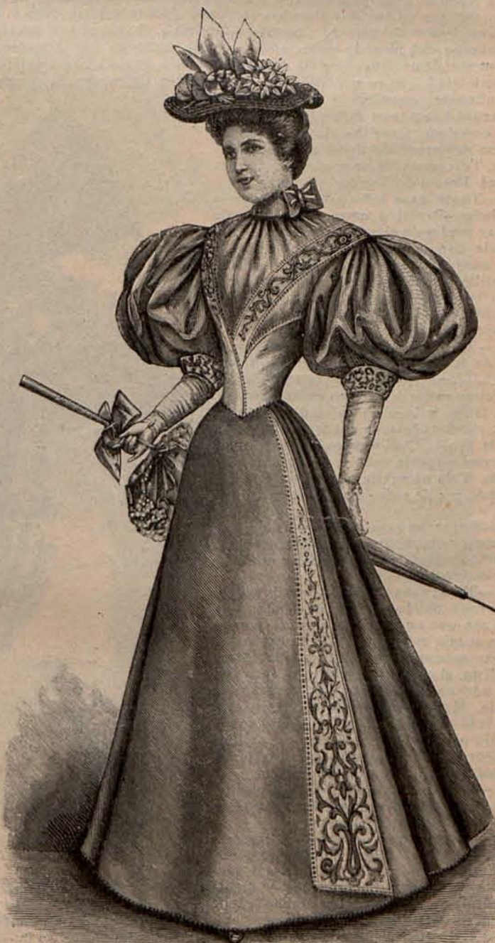
Num. 16.—Traje para visita.

Se trata de unos zapatos acentuadamente escotados de cabritilla blanca calada á estilo