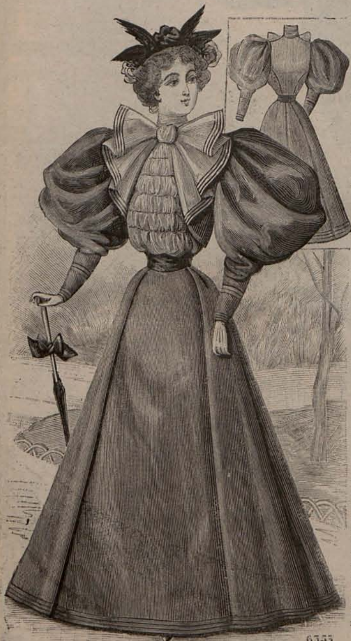
Num. 3.—Traje para paseo. (Delantero y espalda).