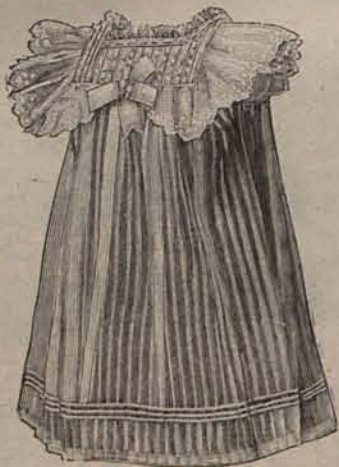
Num. 4.—Trajecito para niña (de 1 á 3 años).

rácter de los hombres, haciendo por el contrario más terrible y cruel la lucha por la existencia. «No pelean—dice—sólo los pobres contra los ricos: los privilegiados sostienen también entre ellos encarnizados combates por conquistar las distinciones, los honores, los altos puestos, las satisfacciones de la vanidad. La pasión por lo superfluo, produce más disgustos y hasta guerras, que el deseo de lo legítimamente necesario.»