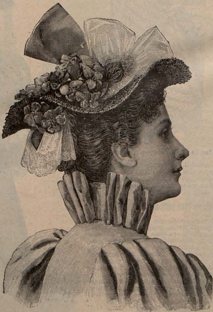
Num. 18.—Sombrero Justina.