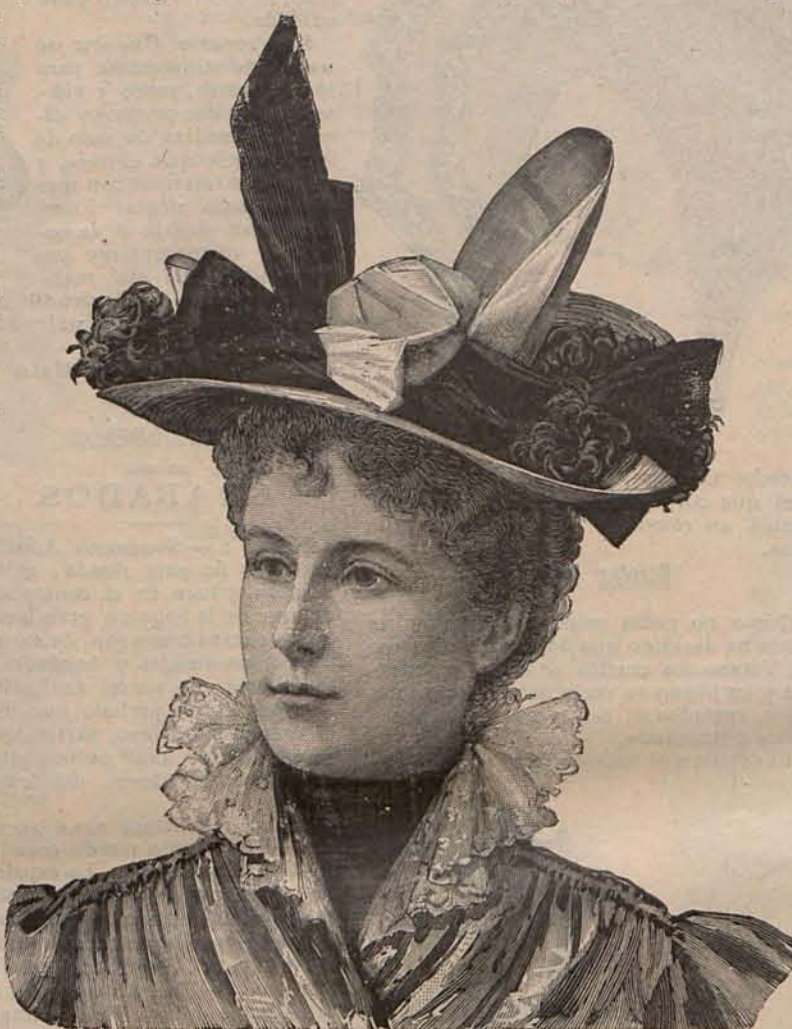
Num. 17.—Sombrero Clarisa.

Se ven mujeres, muy jóvenes todavía, más pálidas que la blanca toca que las