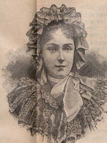
Num. 11.—Colla de mañana.

Para montar en bicicleta, pantalón corto y blusa plegada, de dril gris. La última, ajustada por un cinturón de cuero blanco. Medias y zapatos grises. Chalina de seda azul anudada bajo el cuello vuelto de la blusa.