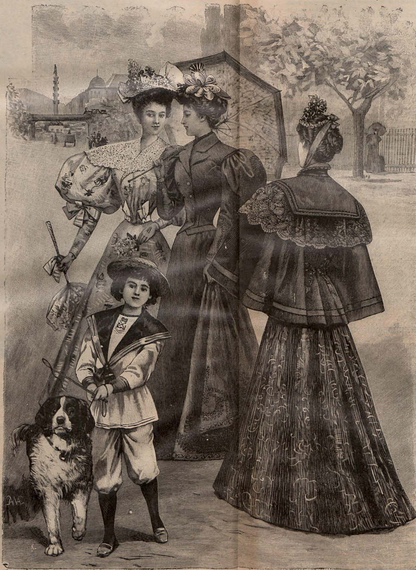
Núm. 12. Toilettes para paseo.