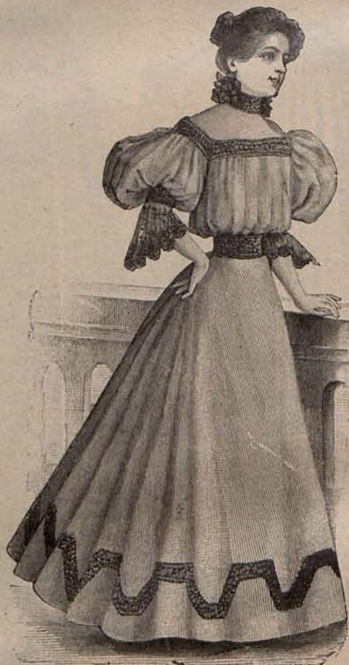
Num. 10.—Traje para Casino.

y puños sin almidonar; cinturón de faya blanca cerrado con hebilla de acero, chalina de fulard también blanca formando un gran lazo, cuyas cocas y caídas deben ser simétricamente iguales. Como tocado, sombrero de gruesa paja con cinta de faya blanca; y como calzado, calcetines del color de la camisa y zapatos de lona blanca.