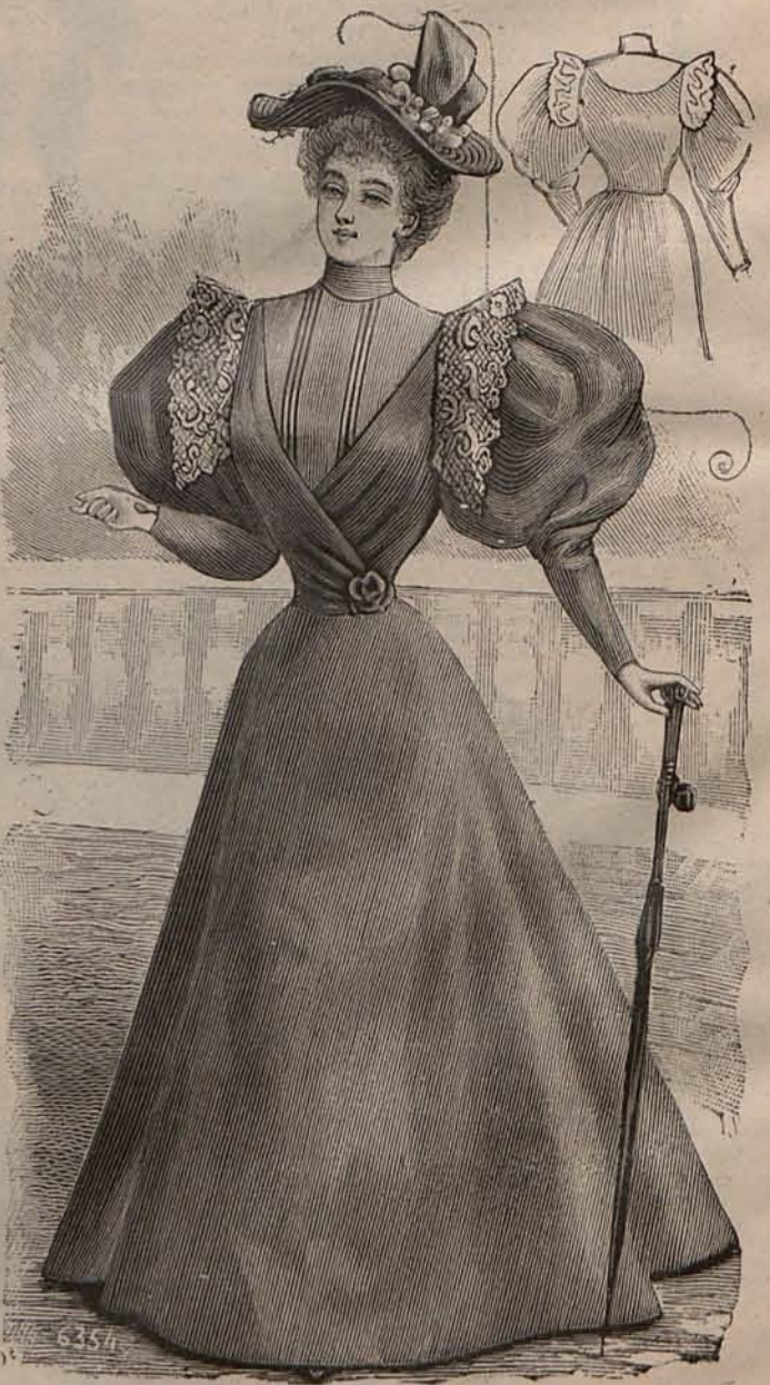
Núm. 5.—Traje para paseo. (Delantero y espalda).

La humanidad, según el autor cuyo libro doy á conocer á las lectoras, no ha mejorado; antes por el