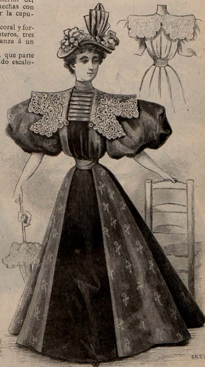
Núm. 6.—Trajes para paseo (Delantero y espalda).