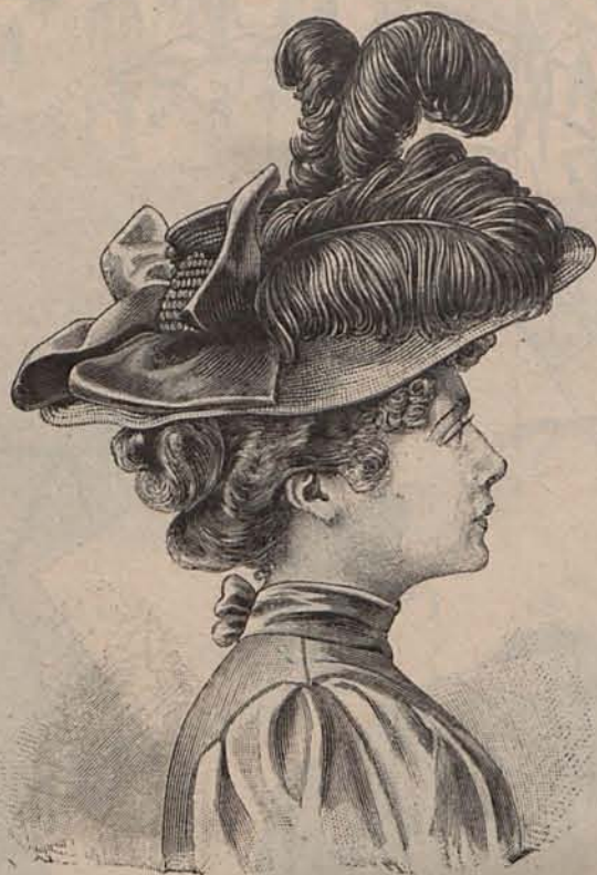
Núm. 9.—Sombrero Aurora.

Núm. 2.—TRAJE PARA SOIRÉE DE CASINO.—De seda color girasol. La falda luce en el bajo una ancha cene-