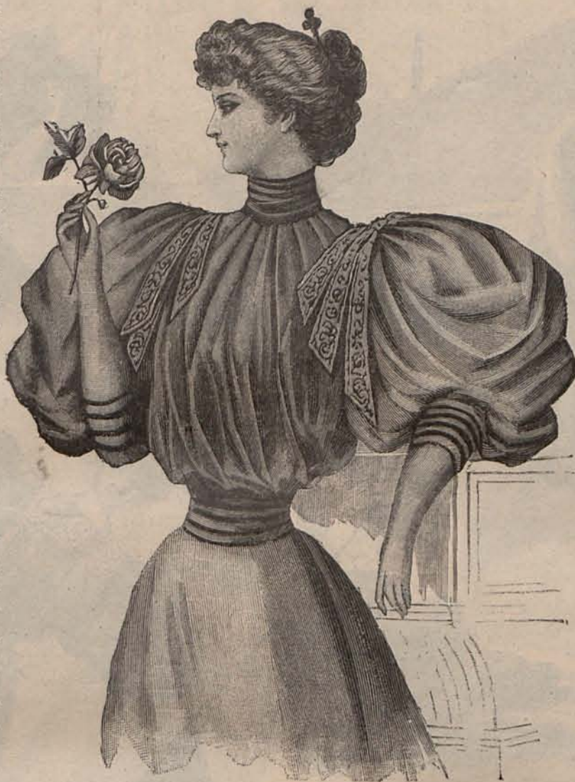
Núm. 4.—Blusa para recibir.

En este último, se monta una amplia capucha del mismo tejido, hueca en su nacimiento y fruncida en el centro superior por medio de un elástico de seda, cosido interiormente de modo que resulte una cabecita de