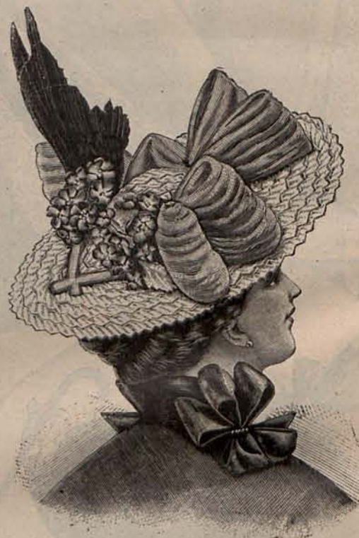
Núm. 12.—Sombrero Engracia.

—Modelo 5. Toilette para paseo .—De crespón de lana amapola. Cuatro entredoses de encaje crudo listan los costados de la falda, dibujando un simulado delantero. Cuerpo corto, en el que se reproduce el adorno de la falda, montado en un ancho canesú de encaje. Mangas huecas. Sombrero de paja, adornado con cuatro grandes cocas de cinta crema y una guirnalda de rosas encarnadas. Tela necesaria para el traje, 10 metros de crespón de lana. Precio del patrón: 3 pesetas.—Modelo 6. Toilette para visita en el campo .—Está confeccionada con crespón verde musgo. Falda y cuerpo fruncidos, el último adornado con un ancho cuello vuelto de encaje. Mangas fruncidas, formando hombreras abullonadas. Sombrero de paja verde musgo, adornado con un lazo de terciopelo negro y una guirnalda de rosas blancas. Tela necesaria para el traje, 12 metros de crespón. Precio del patrón: 3 pesetas.—Modelo 7. Toilette para Casino .—De muselina de lana azul bleuet . Dos anchas quillas de encaje crema adornan los costados de la falda, y el cuerpo ofrece la particularidad de estar guarnecido, mitad con encaje blanco y mitad con encaje negro. Mangas huecas. El sombrero es de paja blanca. La copa desaparece bajo un grupo de plumas