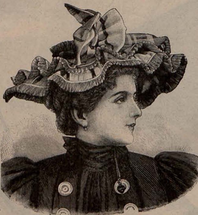
Núm. 11.—Sombrero Inés.

Mangas huecas. Gorra de seda impermeable azul. Sandalias de piel. Capa de peluche de lana blanco. Precio del patrón del traje: 4 pesetas. Precio del patrón de la capa: 1,50 pesetas.—Modelo 2. Toilette para jugar al lawn tennis .—De piqué blanco. Falda lisa. Chaquetilla entallada en la espalda, con delanteros redondeados, adornados con puntiagudas solapas y sueltos sobre una camiseta de batista moteada de tonos blanco y rosa. Mangas de pernil. Sombrero de paja blanca, sencillamente adornado con una cinta rosa dispuesta en torno de la copa. Tela necesaria para el traje, 11 metros de piqué. Precio del patrón: 3 pesetas.—Modelo 3. Toilette para jugar al lawn tennis .—Es de franela listada de tonos beige y azul. Falda lisa y cuerpo blusa, sencillamente adornado con dos volantes cortados al