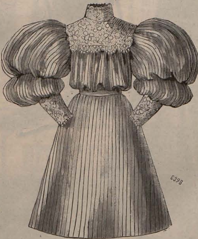
Núm. 3.—Traje para niña de 8 á 10 años.

Pero ahora descubren lo que no han visto al princi-