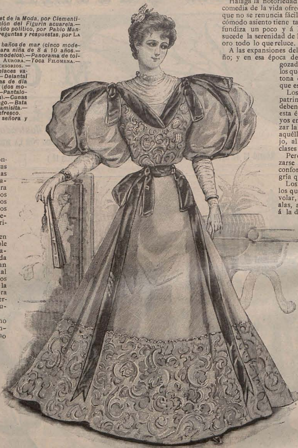
Núm. 2.—Traje para soirée de Casino.

Estas naturalezas apasionadas son dignas de lástima; porque sin recrear su ánimo, padecen tanto ó más que las que sacrifican su salud, su fortuna y su independencia al convencionalismo que se escuda con el pretexto de que la Moda exige el sacrificio que hacen.