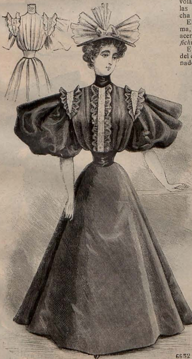
Núm. 5.—Traje para paseo (Delantero y espalda).

—Modelo 1. Es de piqué gris azulado. Falda lisa y cuerpo-blusa adornado con aplicaciones Eiffel de encaje irlandés. Mangas huecas. Capelina de surah crema, adornada con un grupo de margaritas y espigas.