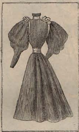
Num. 10.—Espalda del modelo, grabado num. 13

Núm. 12.—TRAJE PARA PASEO.—Es de lana rizada color bronce. Cuatro quillas de grueso encaje irlandés, adornan los costados de la falda. El cuerpo es seme-