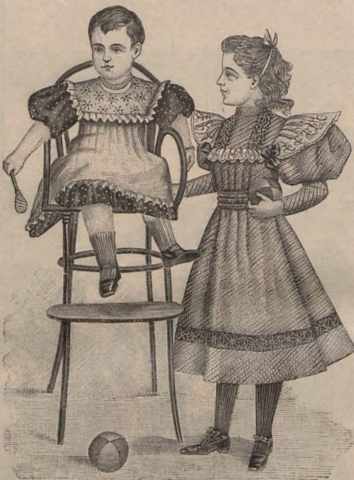
Núm. 15.—Delantal para niño de 2 años y traje para niña de 5 á 7 años

está abierta sobre un pequeño plastrón y se adorna con un cuello vuelto de franela encarnada que luce en sus cuatro puntas otras tantas ancoras bordadas con torzal blanco. Mangas huecas. Sombrero de paja, con cinta encarnada. Modelo 2. Para niño de 6 á 8 años. —De sarga azul oscuro. Pantalón corto y blusa semilarga ajustada con un cinturón de terciopelo negro. El cuello que rodea el escote está bordeado con un galón de terciopelo negro, adorno que se repite en los delanteros. Gorra de sarga azul, con cinta y pompón negros. Modelo 3. Para niña de 8 á 10 años. —De tisú escoces. Falda fruncida. Cuerpo blusa montado en un canesú