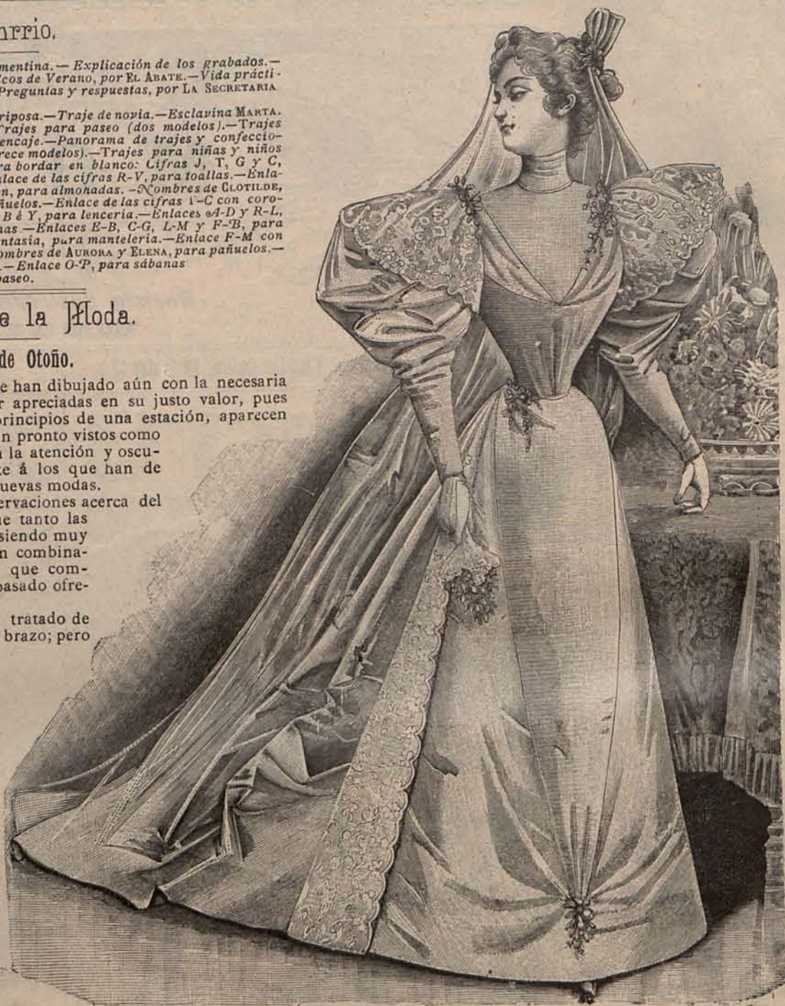
Num. 3.—Traje de novia

Las mangas y el cuello se vuelven como unos cuatro centíme-