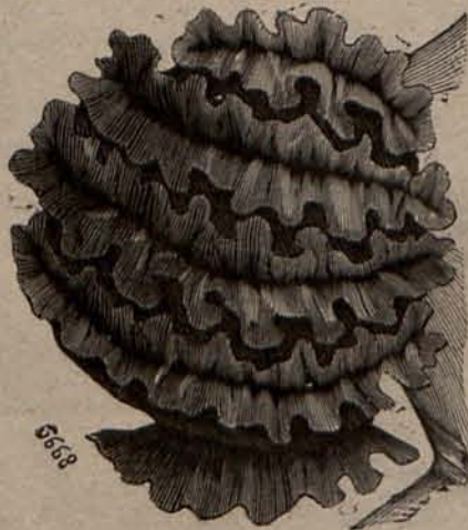
Num. 5.—Manga novedad