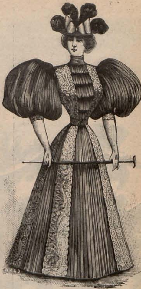
Num. 12.—Traje para paseo

beige y rosa, con canesú plegado, cuello y puños de seda beige. Mangas de pernil. Sombrero canotier de paja beige, con cinta rosa. Tela necesaria para el traje, 6 metros de sarga, 6 de seda estampada y 1 de seda lisa. Precio del patrón: 3 pesetas.—Modelo 5.—Traje para señora joven.—De seda liberty color guinda. Falda lisa y cuerpo corto, velado por un segundo cuerpo blusa de muselina de seda color guinda, que forma en su parte superior un canesú abullonado, en torno del cual se coloca un cuello Eiffel de encaje irlandés. Mangas de igual tejido que la falda. Sombrero de muselina de seda color de ciruela, adornado con un doble lazo de cinta de