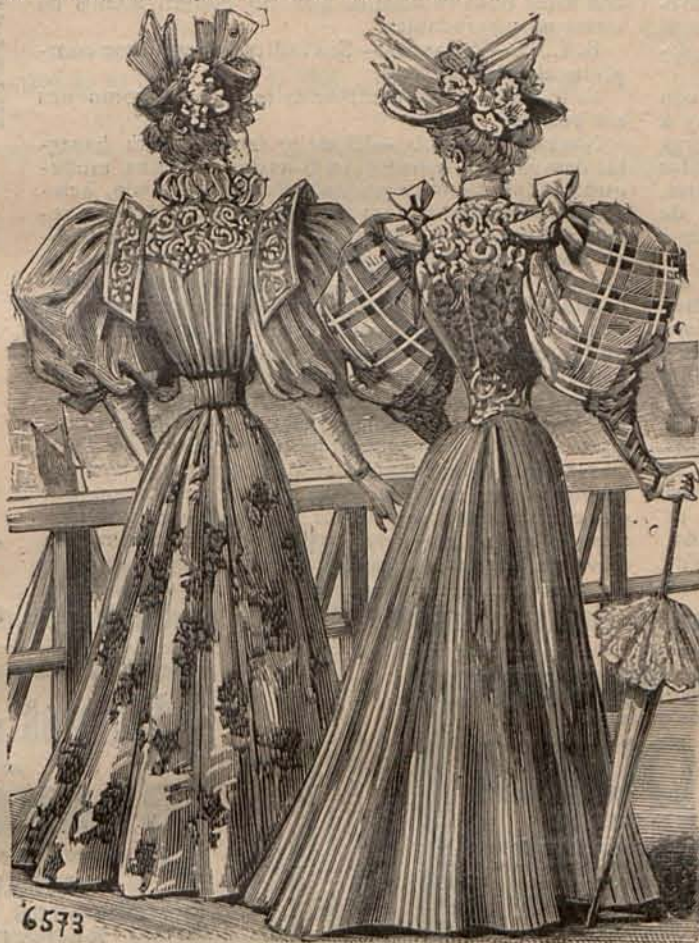
Num. 17.—Reverso del Figurín acuarela

Donde no hay medios de obtener libranzas hay que pagar en sellos, y cuando esto sucede es necesario certificar la carta, pues la experiencia demuestra que de no ser así se pierde la carta con frecuencia.