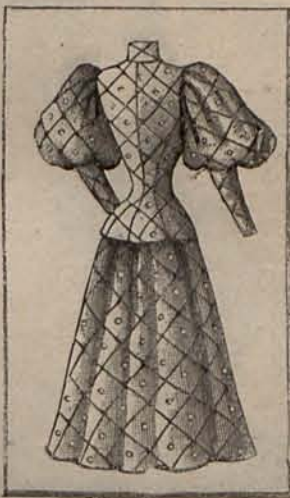
Num. 11.—Espalda del modelo, grabado num. 8

Núm. 14.—PANORAMA DE TRAJES Y CONFECCIONES PARA SEÑORAS, SEÑORITAS Y NIÑAS.—Modelo 1. Traje para señorita. La falda es de franela azul y el