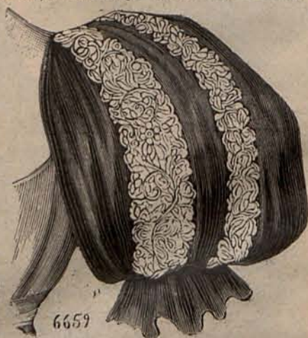
Num. 6.—Manga novedad