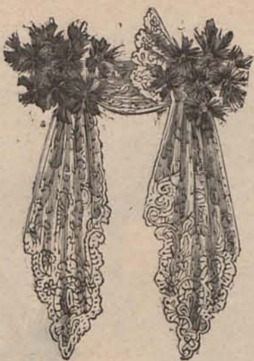
Num. 9.—Corbata de encaje

Núm. 9.—CORBATA DE ENCAJE.—Este modelo de corbata no forma lazo, y si dos caídas fruncidas sostenidas á los lados de la drapería de encaje que