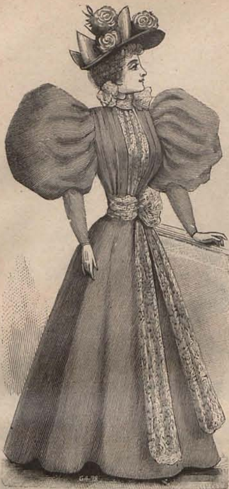
Num. 7.—Traje para paseo

rodea el cuello, con grupitos de bluetes artificiales ó naturales. Precio del patrón de la corbata: 1 peseta.