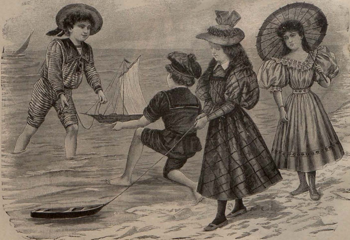
Núm. 16.—Trajes para niños de 6 á 10 años

cuadrado rodeado de un rizado de cinta de raso. Mangas huecas. Sombrero de paja adornado con una guirnalda de cocas de cinta cerrada con un lazo de lo mismo. Modelo 4. Para niña de 6 á 8 años. —De velo hoja de rosa. El bajo de la faldita, el cinturón que ajusta el cuerpo, el escote de este y los puños de las amplias mangas lucen cenefitas cuyos motivos representan estrellas bordadas á punto lanzado con torzal negro. El adorno del cuerpo se completa con una berta y unos vuelillos de encaje blanco. Precio del patrón de cada uno de los modelos: 2 pesetas.