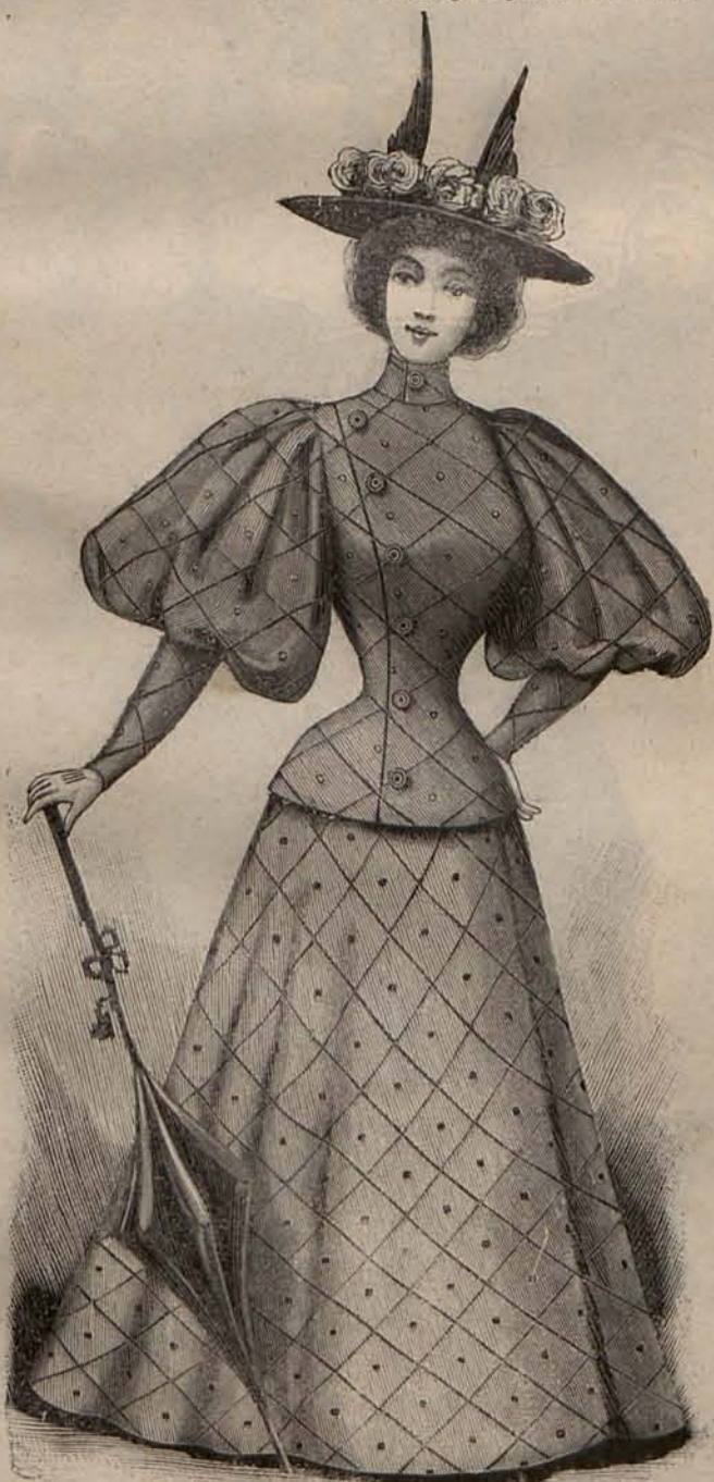
Num. 8.—Traje para calle