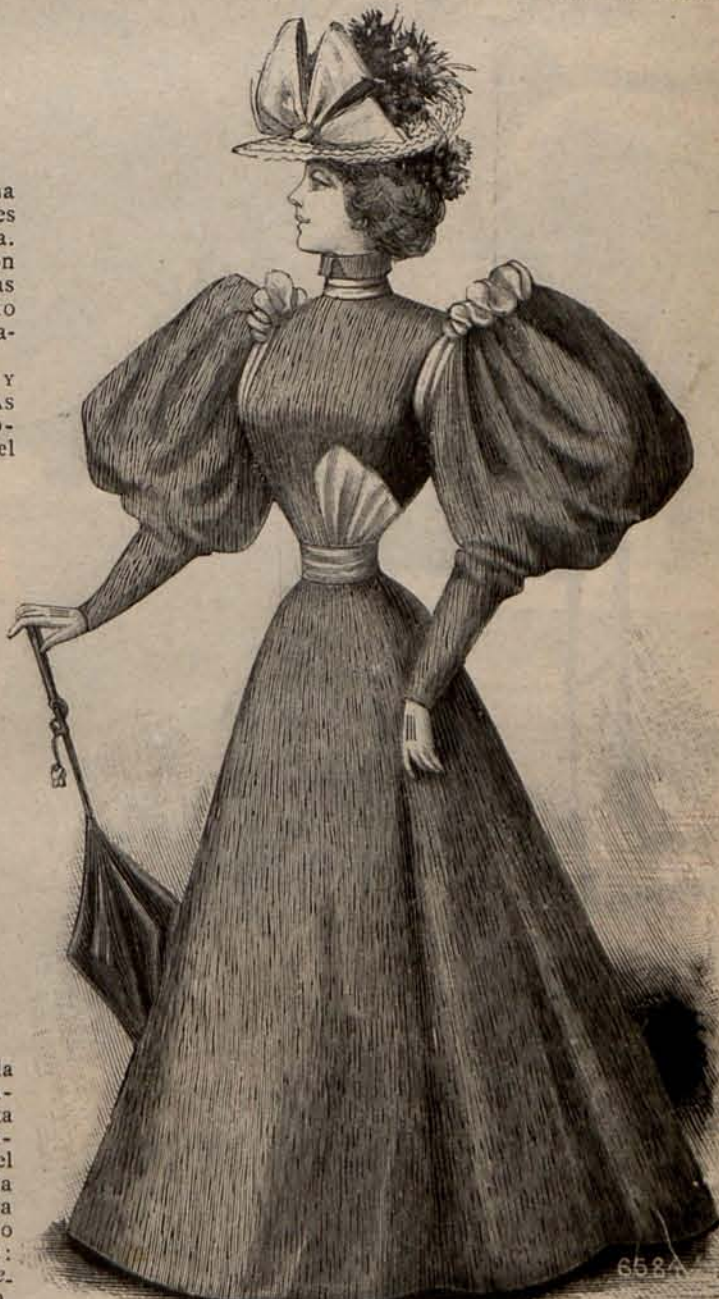
Num. 13.—Traje para calle