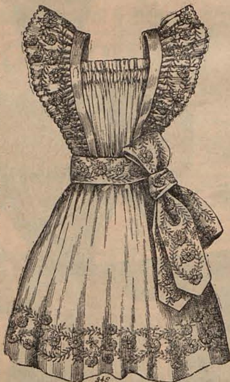
Núm. 4.—Delantalito para niña de 2 á 4 años.

En medio de los entusiasmos y de las alegrías, han causado honda pena la muerte del veterano general Mac-Mahón y la del insigne compositor Carlos Gounod.