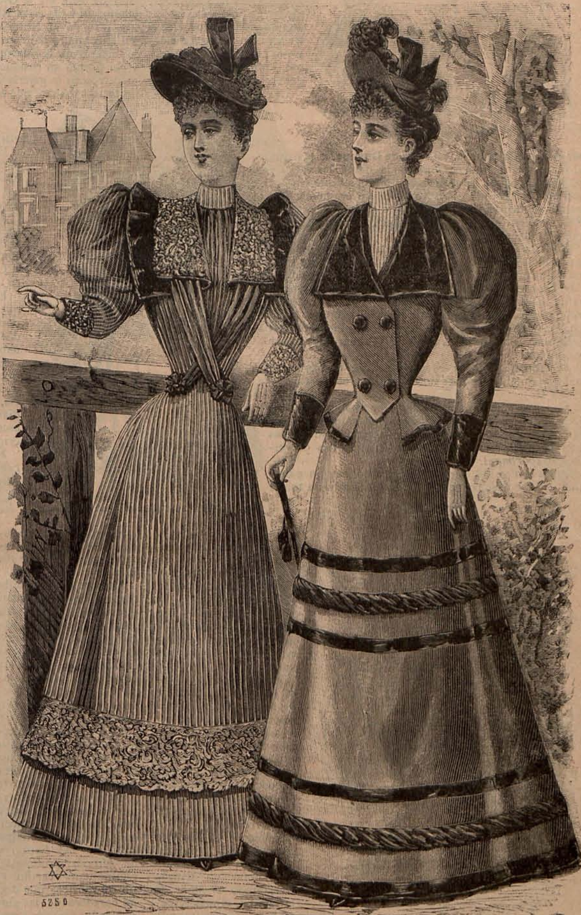
Núm. 1.—Trajes para paseo.

El edificio es de estilo Luis XVI, más vasto que imponente. En el primer piso habita la familia del Czar, en el entresuelo se hospedan los soberanos de Dinamarca. En este mismo piso habitan el Príncipe de Gales, la Princesa y sus hijos.