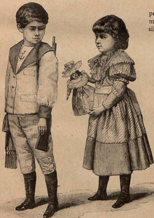
Núm. 4.—Traje para niño de 7 años y traje para niña de 5 años.

Núm. 5.—Delantales para niñas de 3 á 9 años.—El primer modelo es de percal azul pálido y se sostiene por medio de hombreras de las que parte un cuello esclavina. Los contornos del delantal, los bolsillos, las hombreras y el cuello, lucen bonitas cenefas bordadas á la inglesa con algodón blanco. El segundo modelo, de nansú blanco, se frunce en la cintura, y se adorna con un bonito canesú bordado á realce y rodeado de encajes.—Precio del patrón de cada uno de los delantales: 1,50 pesetas.