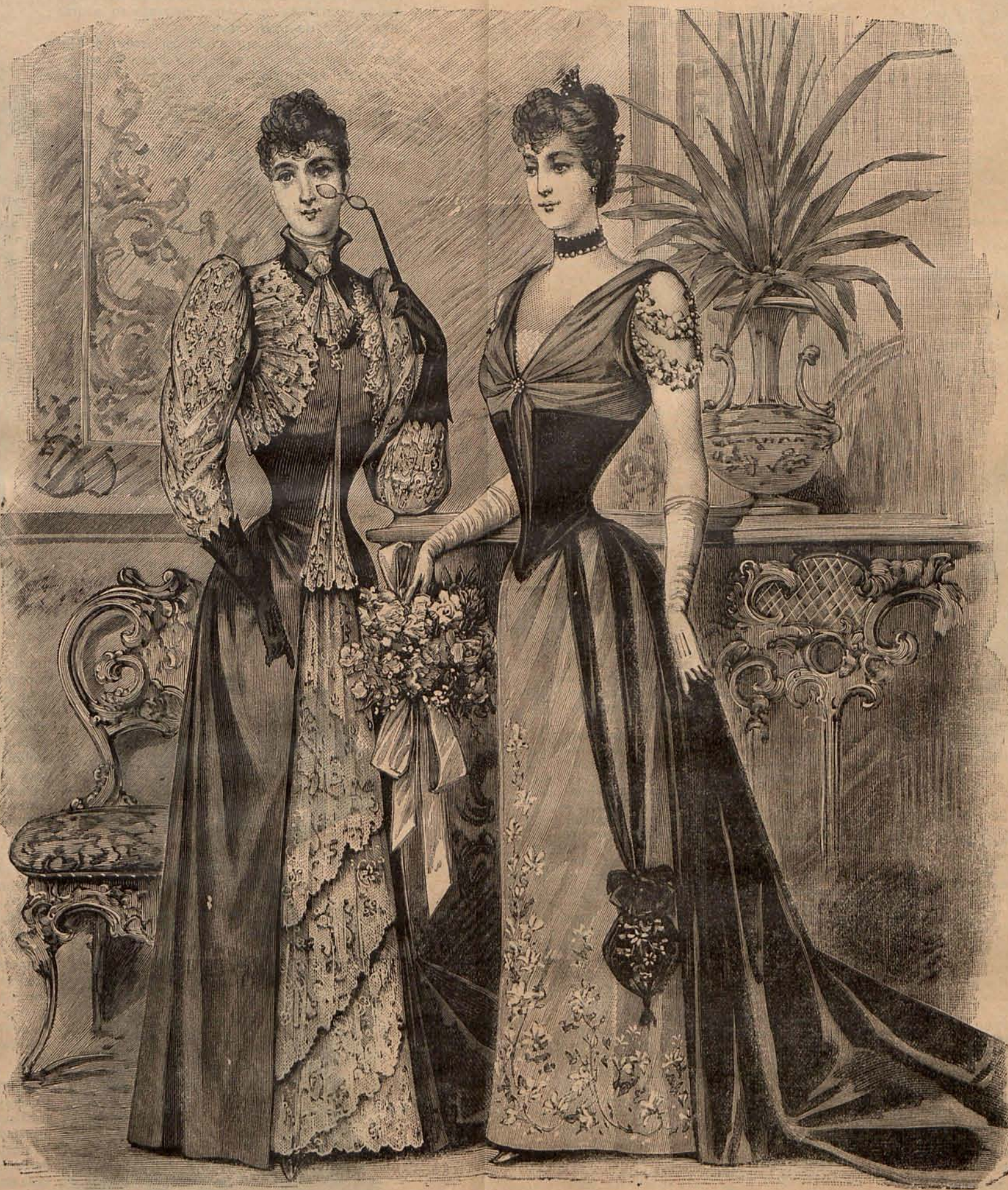
Num. 12.—Trajes de ceremonia.

Num. 10.— Traje para niño de 1 á 2 años. —De lanilla coral. El delantero y la espalda se pliegan en su parte superior y están unidos á un canesú cua-