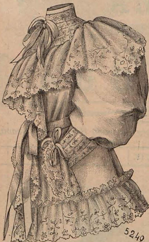
Núm. 2.—Matinée de surah (Delantero.)

sas en aquella estancia. La reina de Dinamarca se sienta al piano y el Czar acompaña con la flauta los vales y polkas que bailan las princesas y príncipes que allí no son más que primos que se quieren sinceramente, llenando de alegría á sus abuelos y á sus padres, y constituyendo entre todos el más perfecto dechado de la familia fundada en el cariño.