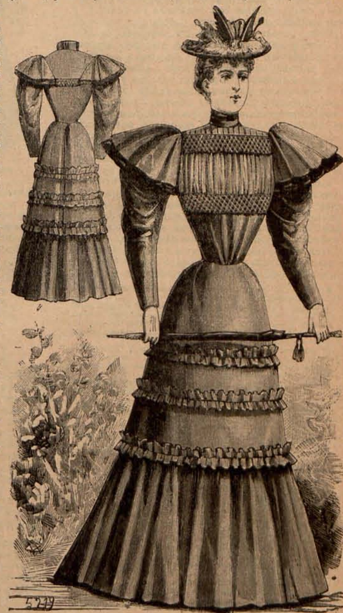
Num. 14.—Traje para señorita.

La Administración de LA ULTIMA MODA, tiene el mayor gusto en evacuar cuantos encargos se sirvan encomendando las señoras suscriptoras. Estas deberán, al hacer el pedido, abonar el importe de los artículos que deseen.