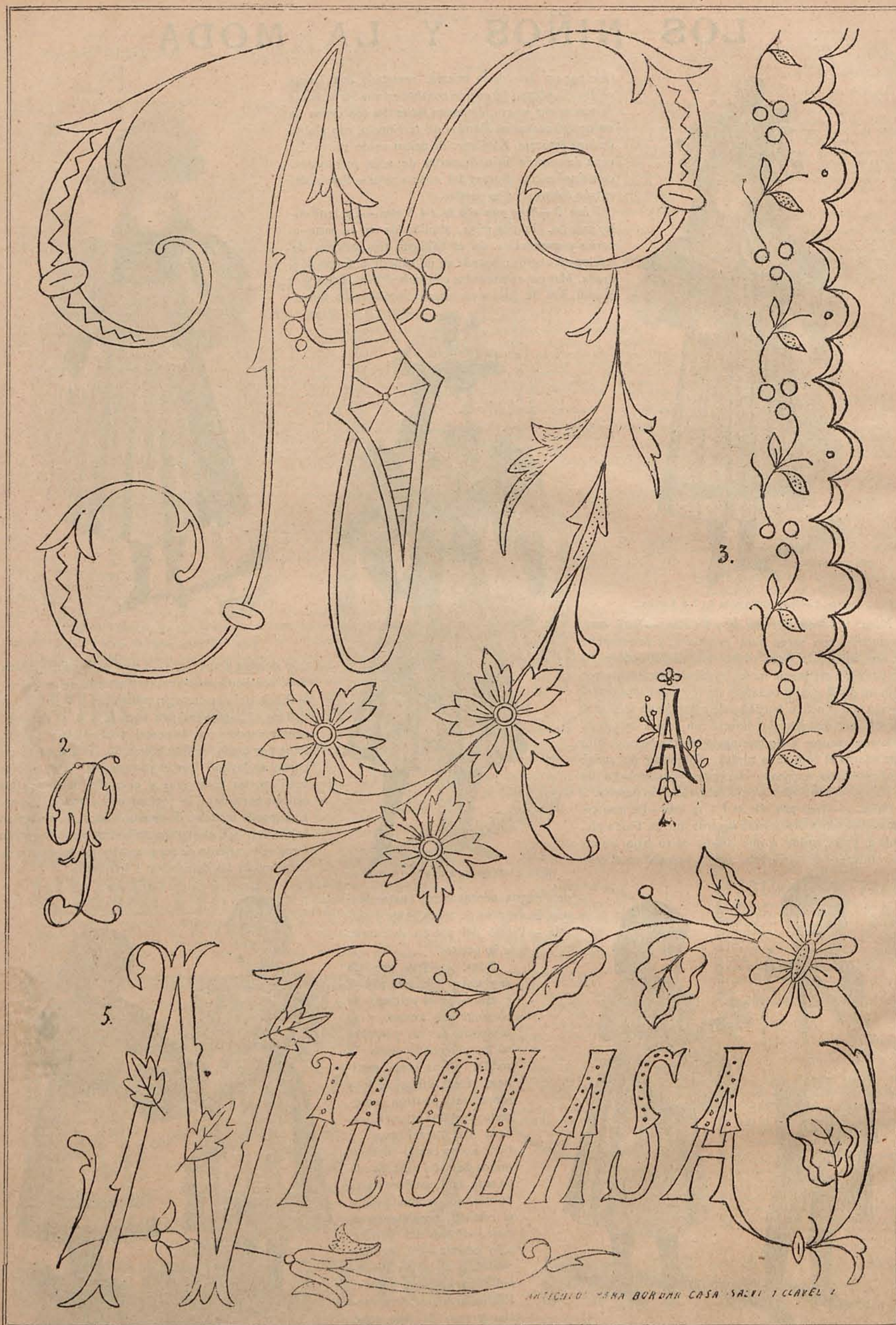
Número 1. Cifra N: continuación del abecedario para bordar sábanas.—2. Cifra P para pañuelos.—3. Fesón para camisas.—4. Cifra A para pañuelos.—5. Nombre de Nicolasa para almohadas.