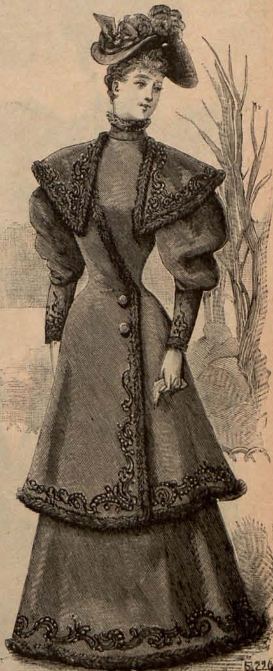
Núm. 9.—Traje para visita.

Núm. 1.—Trajes para paseo.—(1) De lana color corinto, con listas de seda plata. Falda campana, con ancha guarnición bordada, dispuesta á unos 15 centímetros del borde inferior. Cuerpo corto. Su adorno