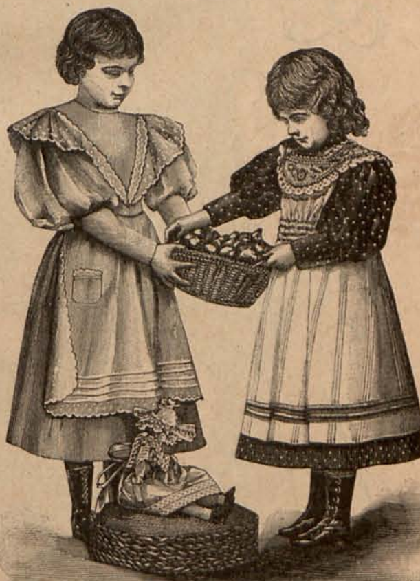
Núm. 5.—Delantales para niñas de 3 á 9 años.