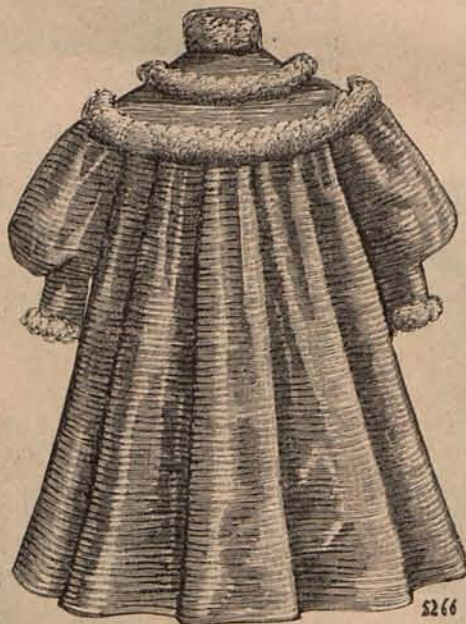
Núm. 17.—Abriguito para niño de 1 á 2 años.

Como manifesté oportunamente, el Jurado se compone de los tres literatos que hayan obtenido mayor número de sufragios; y si por cualquier motivo renuncian al cargo uno ó más de los elegidos,