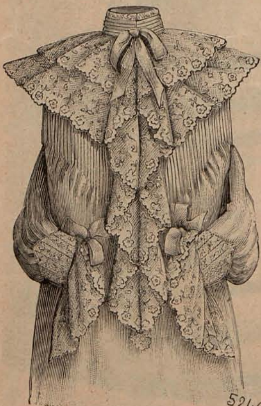
Núm. 5.—Camisa de dormir.

La noticia de la muerte de Gounod, ha causado sentimiento á mis lectoras. No solo las aficionadas al divino arte si no cuantas hayan experimentado la dulce emoción que producen en el alma las melodías del autor del Fausto y de Mirella , profesarían seguramente cariño al ilustre músico, que digno heredero de las glorias de los grandes maestros ha llegado á tener