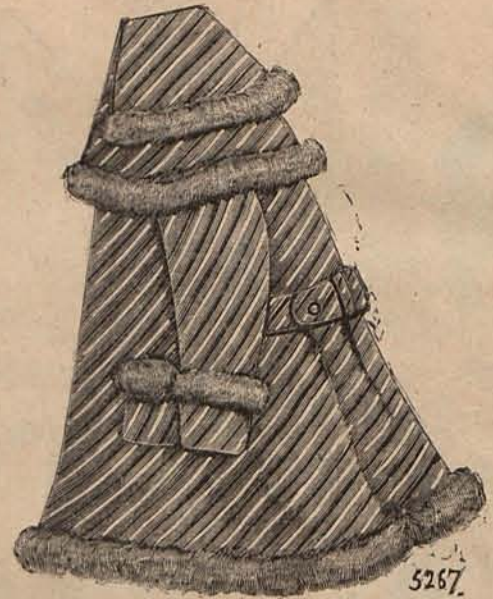
Núm. 16.—Abriguito para niño de 2 á 3 años.

La estancia en Madrid de la gran duquesa Wladimiro, esposa del hermano mayor del emperador