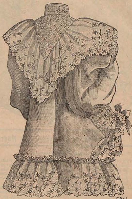
Núm. 3.—Matinée de surah (Espalda.)

Tolón ha festejado á los marinos con bailes y banquetes; París que sabe y puede hacer los honores mejor que ninguna otra ciudad, porque tiene á su favor el lujo y el placer, les ha ofrecido un banquete oficial, una representación de gala en la Gran Opera, un baile en el Elíseo, otro en el Hotel de Ville, comida y baile en el Ministerio de la Marina, y por último un banquete monstruo en la galería de los treinta metros, que tan