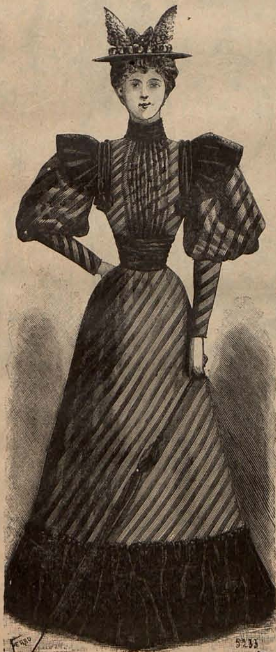
Núm. 8.—Traje para paseo.

Daré hoy principio á mi grata tarea ocupándome de las toilettes de teatro, tanto por ser asunto muy de actualidad como por tratarse de una de las toilettes más difíciles y que requieren mayor esmero. Como modelo de distinción y elegancia indiscutibles, citaré un precioso traje á propósito para ser lucido en un palco del Real. Es de crespón de la China azul nube, y se compone de una falda campana, graciosamente adornada con tres volantes del mismo tejido cosidos con casi imperceptibles rizados de cinta de seda plata, y de un cuerpo corto prolongado por aldetitas de seda plata bordadas al pasado con seda azulina. Grandes solapas haciendo juego con las aldetas adornan los delanteros que están abiertos en punta sobre un fichú de gasa de seda plata escotado en forma de corazón. Las mangas, cortas, se forman por amplios bullones de crespón rematados con estrechos vuelillos de seda plata bordada. Este cuerpo se cierra con una hebilla de gran tamaño de plata