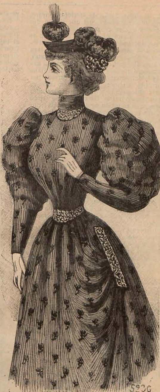
Núm. 7.—Traje para calle.

cinzelada. Para ir á una butaca de la Comedia, resulta muy distinguido un traje de seda verde hoja seca, igual ó parecido al siguiente modelo. Falda campana, con quillas de terciopelo del mismo color realizadas por bordados espirales hechos con hilillo de oro. Cuerpo chaqueta con costuras visibles y cuello escarolado de terciopelo bordado. Los delanteros se abren sobre un chalequito de moaré blanco cerrado por botoncitos de oro, cuyo complemento es una corbata Luis XV de encaje blanco prendida con un alfiler de pedrería. Mangas de terciopelo forma pernil bordadas en las bocamangas con hilillo de oro. Capota de terciopelo verde hoja seca, drapeado y prendido con hebillas de oro. El centro de delante se adorna con un gran lazo de moaré blanco, de cuyo centro parte un alto esprit de oro. Las bridas son también de moaré blanco y forman graciosas escarapelas á unos tres centímetros de su nacimiento. Prometo á mis favorecedoras volver á ocuparme de otros muchos lucidísimos trajes ideados por la Moda exclusivamente para teatro, pero por el momento me veo obligada á dejar este asunto, que amenaza invadir todo mi Carnet, porque tengo que dar cuenta de algunas novedades interesantes.