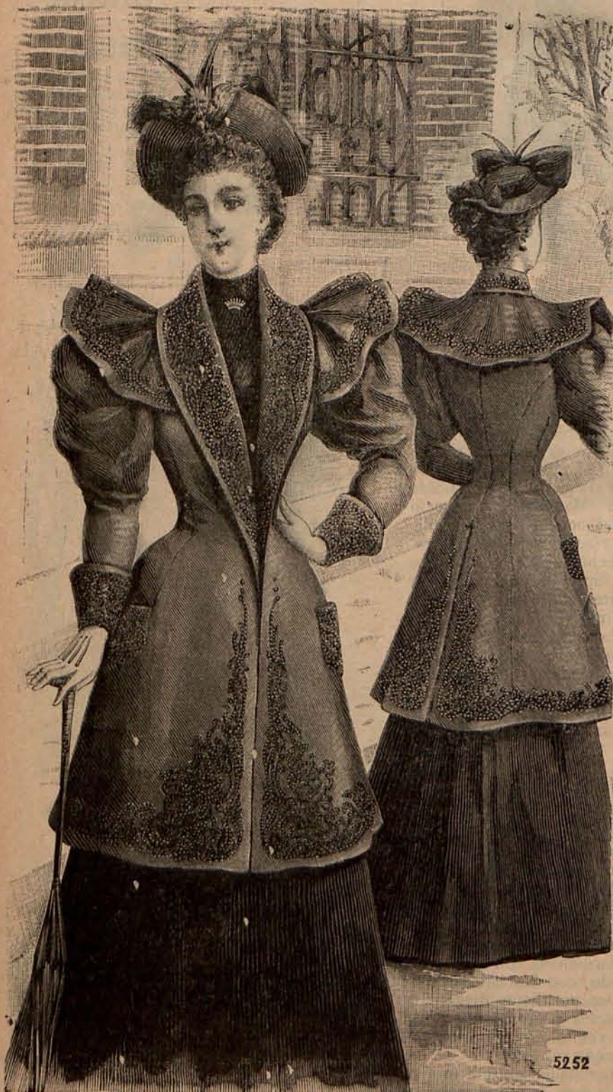
Num. 11.—Chaqueta elegante (Delantero y espalda.)

Números 2 y 3.— Matinée de surah. —(Delantero y espalda.)—Este elegante modelo de matinée está confeccionado con surah azul pálido. Tanto los delanteros que son fruncidos, como la espalda, que forma una doble pala, se montan en un canesú de encaje, rodeado de una berta de lo mismo que termina en chorrera. El bajo de la prenda y las bocamangas de las amplias mangas, están guarnecidos por anchos volantes de encaje. Lazos de cinta azul cierran el escote y adornan el delantero. Precio del patrón: 2 pesetas.