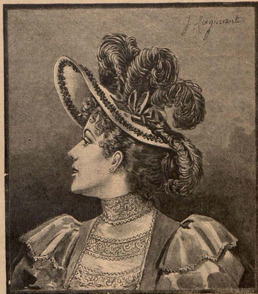
Num. 13.—Sombrero Aurora.

vés sobre un fondo de faya. El cuerpo se adorna con delanteros Figaro y corbata Luis XV de encaje. Mangas de encaje. Tela necesaria para el traje, 18 metros de faya. Precio del patrón: 3 pesetas. —(2) Es de terciopelo negro y seda hoja de rosa. Falda de seda, adornada con guirnal- das de flores bordadas sobre el delan-