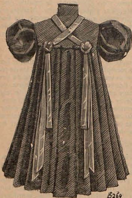
Num. 10.—Traje para niño de 1 á 2 años.

Num. 4.— Delantalito para niña de 2 á 4 años. —De batista rosa pálido, con pechero fruncido, montado en estrechas hombreras. Los volantes que adornan estas últimas, el cinturón y el bajo de la faldita, lucen anchas cenefas bordadas á estilo ruso con algodones de colores. El patrón de este delantalito figura en la Hoja de patrones que acompaña al presente número.