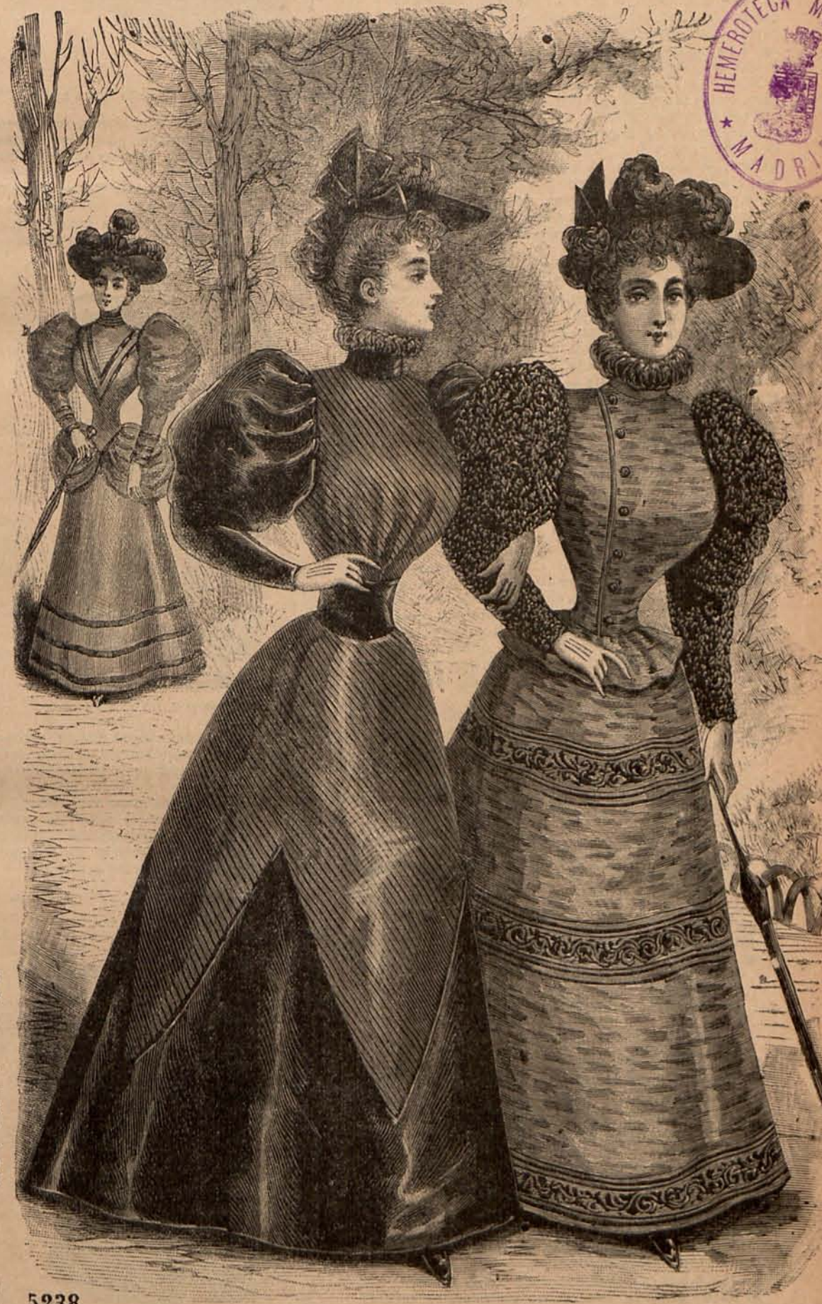
Núm. 8.—TRAJES PARA VISITA

Núm. 6.— Trajes para calle .—(1) Es de paño azul gen-darme. Falda campana. El bajo se guarnece con dos an-