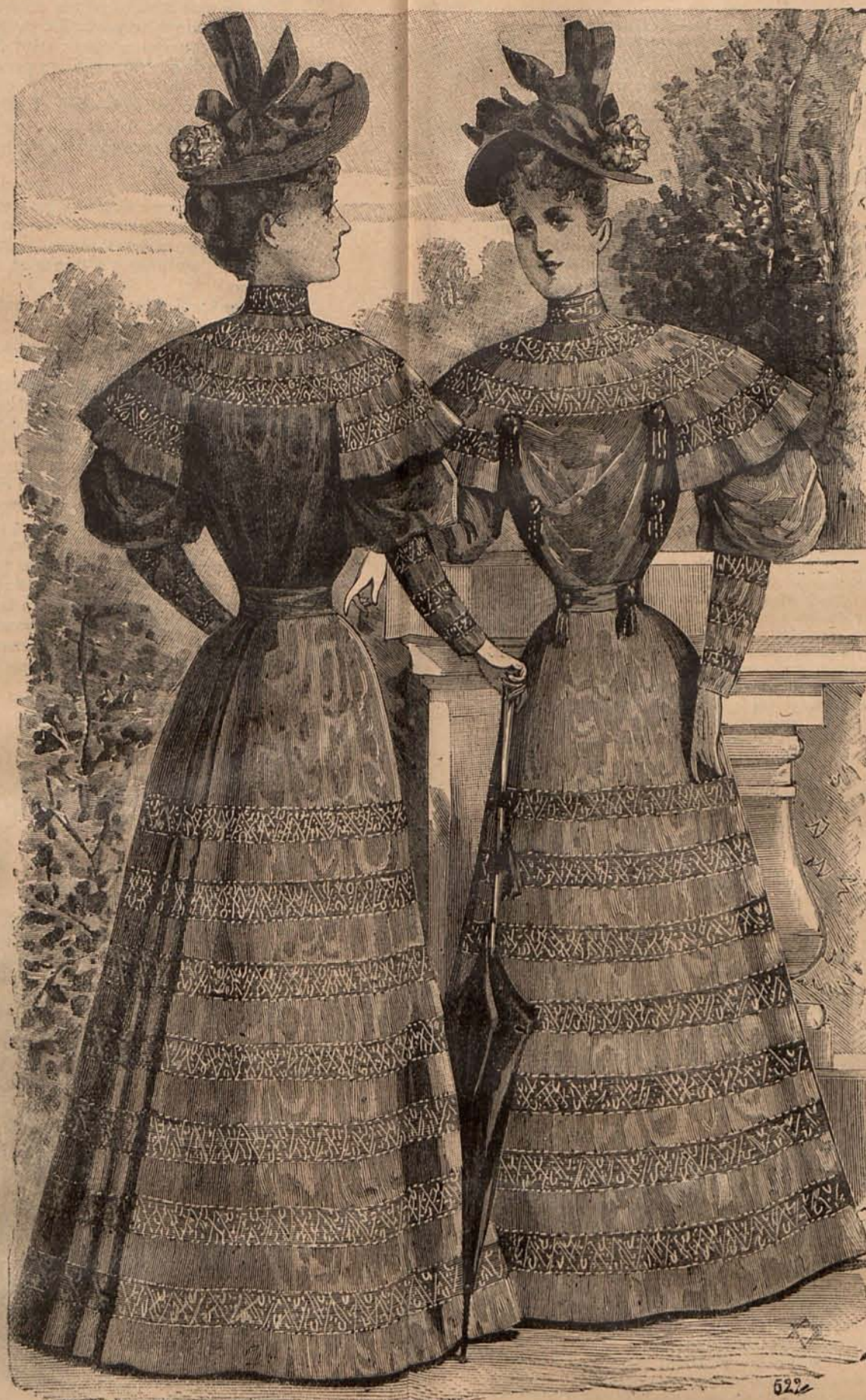
Núm. 7.—TRAJE PARA CARRERAS DE CABALLOS (Espalda y delantero.)

dalia y se fija con un rosetón de seda musgo. El segundo es de terciopelo musgo; pero el rosetón está reemplazado por un lazo de cinta dalia de largas y desiguales caídas. Otro modelo se compone de dos rizados y dos abullonados de terciopelo tornasol, separados entre sí por volantes de encaje perlado; y otro no menos lindo, es de encaje negro y seda esmeralda, adornado con una gran flecha de azabache.