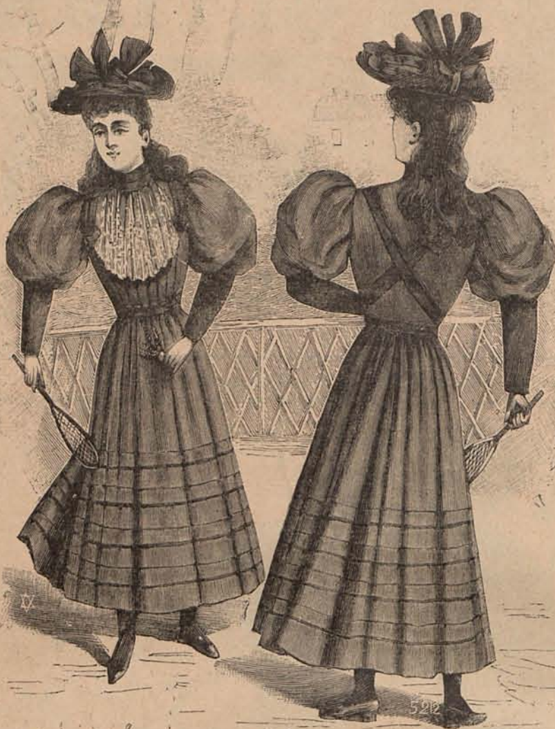
Núm. 2.—Traje para niña de 11 á 13 años (Delantero y espalda)

Estos agradables interrogatorios, contribuyen grandemente al desarrollo de