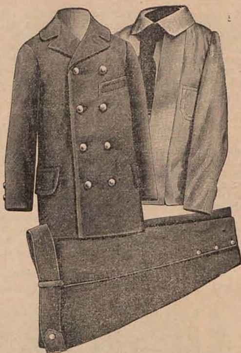
Núm. 9.—Traje y blusa para niño de 6 á 8 años.

El ilustre poeta D. Ramón de Campoamor está en la Corte y ha sido informado del Concurso y de