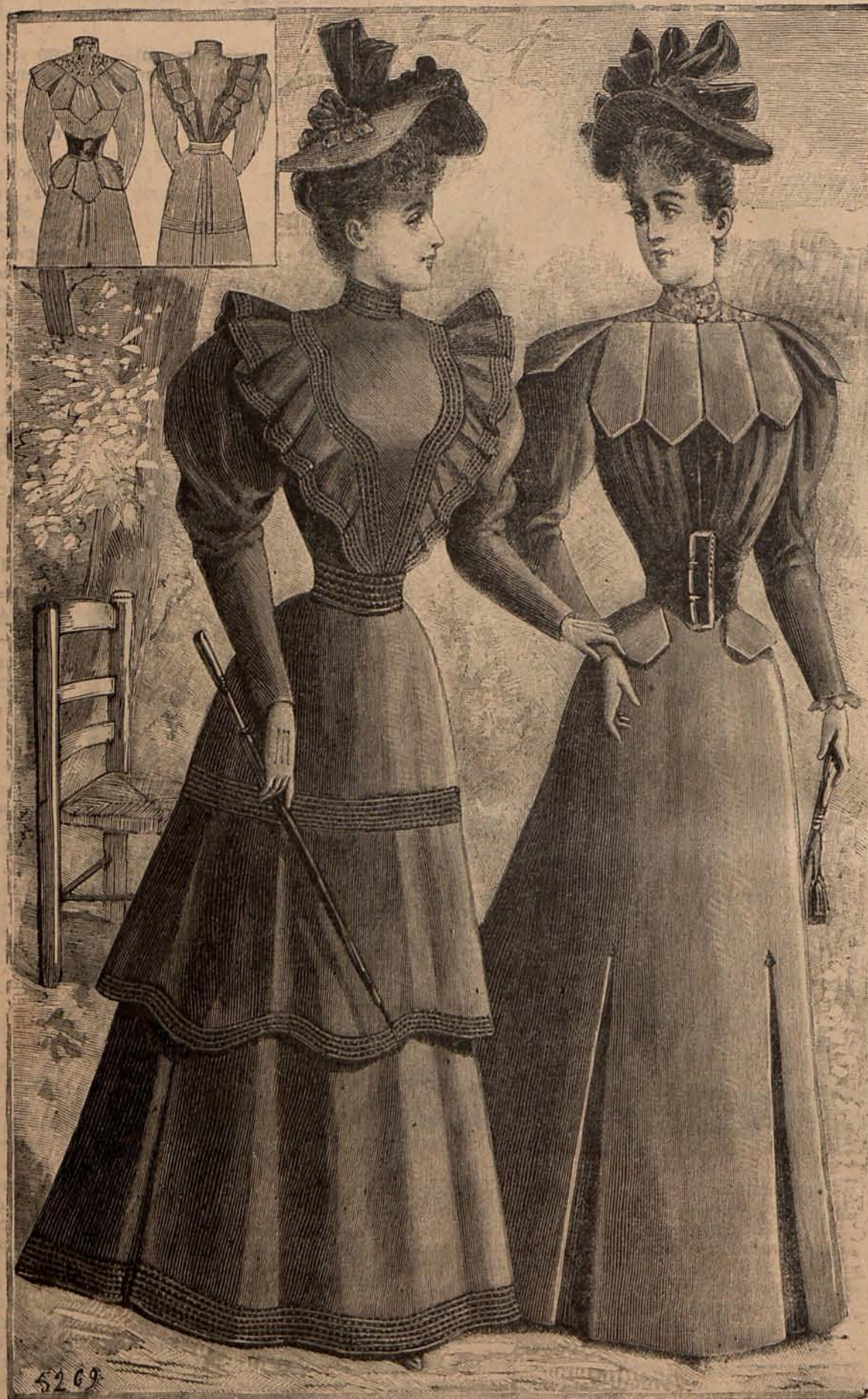
Núm. 6.—TRAJES PARA CALLE

En espera de que las nieves y los fríos del rigoroso Invierno nos obliguen á refugiar nuestras manos en los confortantes manguitos de piel, la Moda nos ofrece una serie de manguitos fantasía de seda, terciopelo y encaje, que si no ganan á los primeramente citados, en cuanto á la riqueza y el severo buen gusto, en cambio pueden competir con ellos por lo que á gracia se refiere. Uno de los modelos más lindos, se forma con dos escarolados de terciopelo, cosidos á una armadura de linón y seda. El primer escarolado es de terciopelo