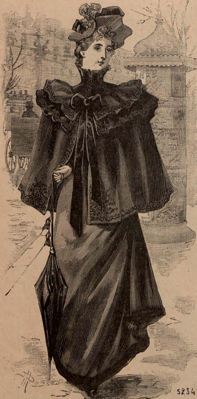
Núm. 3.—Esclavina de paño.

Coincide además con la doctrina de otro sabio, Stuart Mill, en su famosa obra La esclavitud de la mujer . El célebre filósofo inglés sostiene que la inferioridad intelectual del bello sexo, no