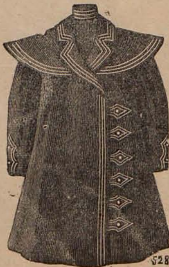
Núm. 11.—Sobretudo para niño de 2 á 4 años.