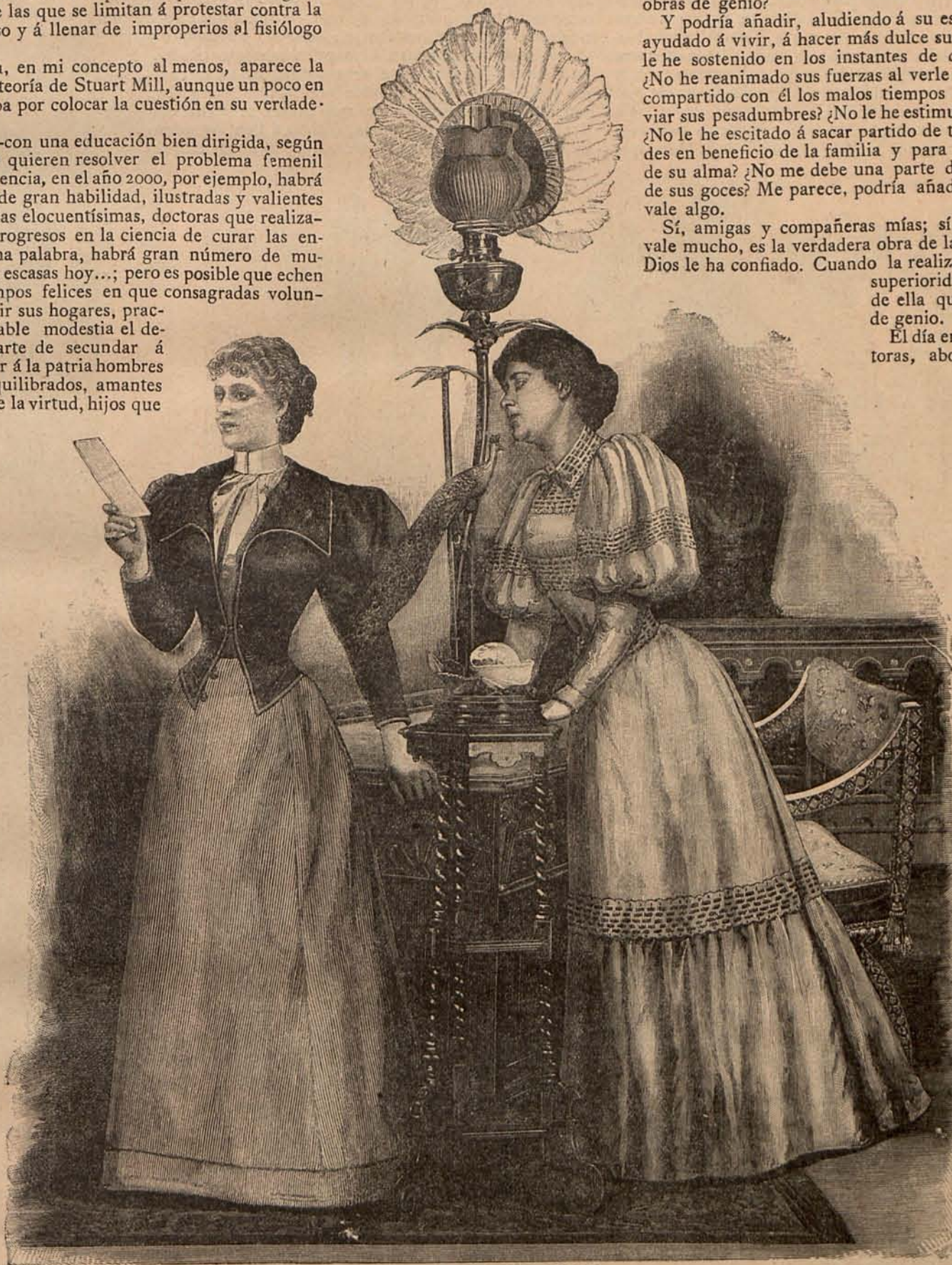
Num. 5.—TRAJES PARA RECIBIR

sin necesidad de patrón. Se corta un cuadro de terciopelo, lana ó seda, que mida de 60 á 70 centímetros, de una sola pieza si el ancho del tejido lo permite, y de dos pedazos en caso contrario, unidos por una costura al hilo, hecha en la mitad justa del cuadro. Después se dobla éste en cuatro, cuidando de que las puntas guarden completa simetría, y se dá forma al escote en la parte doblada que corresponde al centro del cuadro, rodeando también sus puntas. La abertura indispensable se obtiene fácilmente, cortando al hilo el centro de uno de los lados si el cuello es de una sola pieza, ó descosiendo una de las costuras en caso de no ser así. Para armar los cuellos que me ocupan, es necesario una entretela de linón fuerte y un forro de tafetán de seda. Se montan en frunces ó palas, formando con el vuelo de la parte inferior pliegues acanalados que se sostienen perfecta-