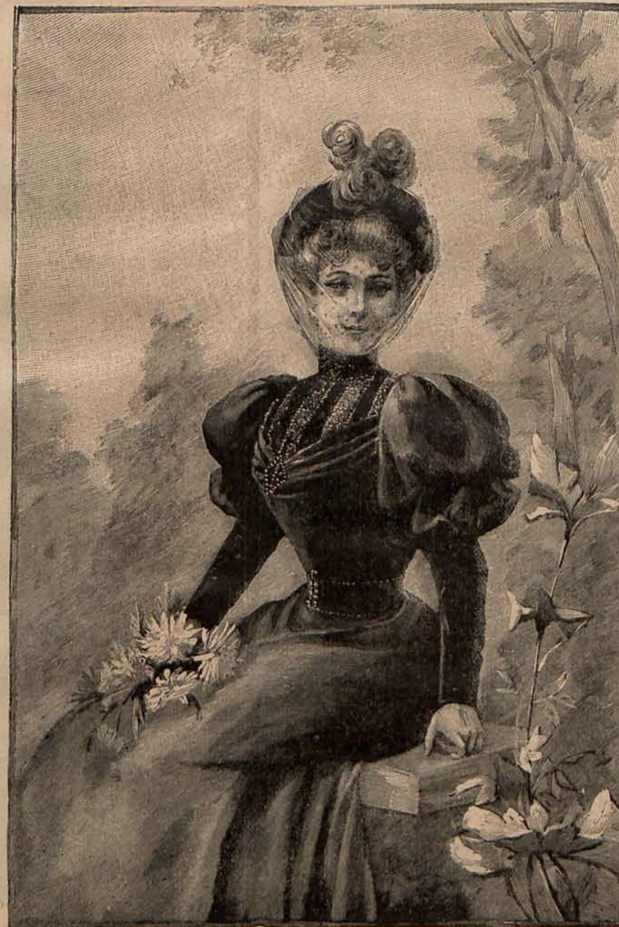
Núm. 10.—Traje para visita.

años.—Es de paño de damas, azul marino. Un galón rodea toda la prenda, como así mismo los 4 cuellos que forman la esclavina. Los 4 cuellos pueden hacerse si se quiere de raso ó terciopelo del mismo color. Los cuellos están abiertos por la espalda. Cinturón de faya con un gran lazo al lado derecho. Sombrero de fieltro con lazo del color del cinturón y de los galones que adornan la prenda. Precio del patrón del abrigo: 2,50 pesetas.