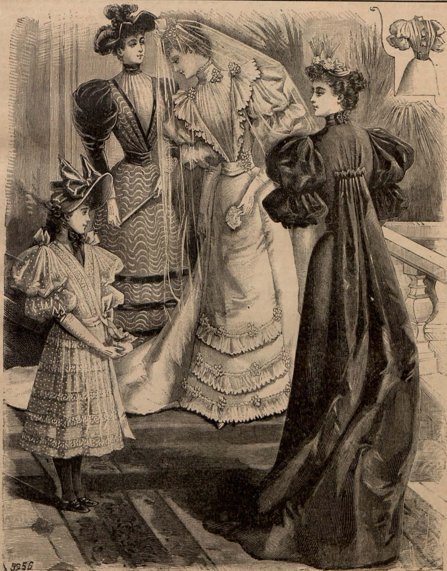
Núm. 1.—Traje de novia y toilettes de ceremonia.