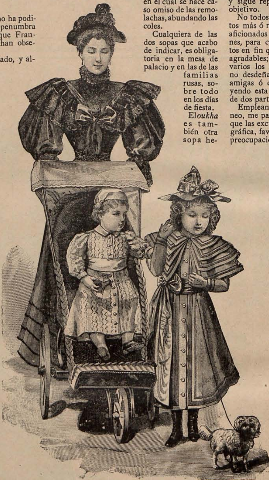
Núm. 2.—Traje para calle.—Trajeito para niño de 2 á 3 años.—Abriguito para niña de 6 á 8 años.

cha con pescado, exclusivamente rusa. La calabaza, las ortigas y el queso blanco, sirven también de base á otras sopas no menos originales.