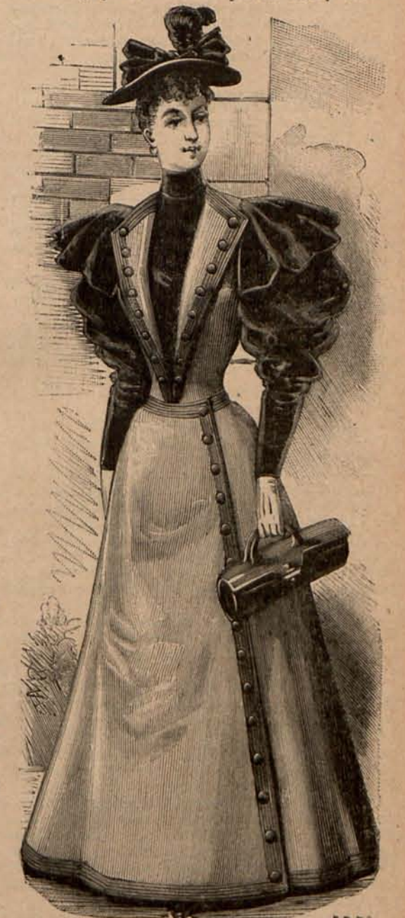
Núm. 13.—Traje para viaje.

Núm. 10.—Traje para visita.—De piel de seda y terciopelo