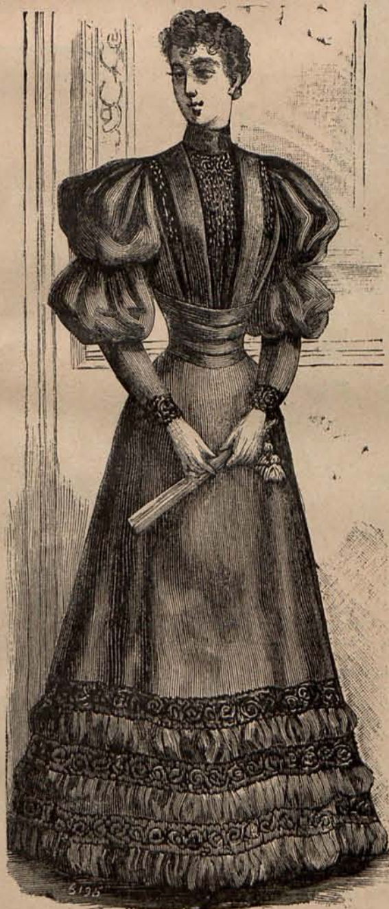
Núm. 4.—Traje para recibir.