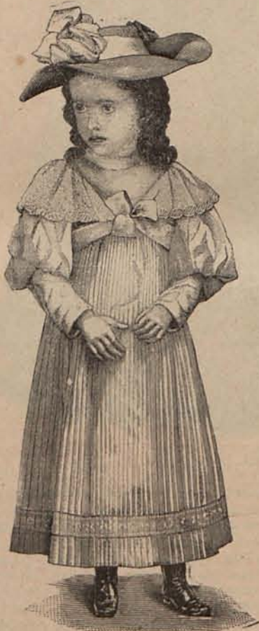
Núm. 15.—Traje para niña de 6 á 8 años.

Ofrecer el baño, era un deber de hospitalidad. La civilización romana comprendía mejor que la nuestra las ventajas higiénicas de la hidroterapia.