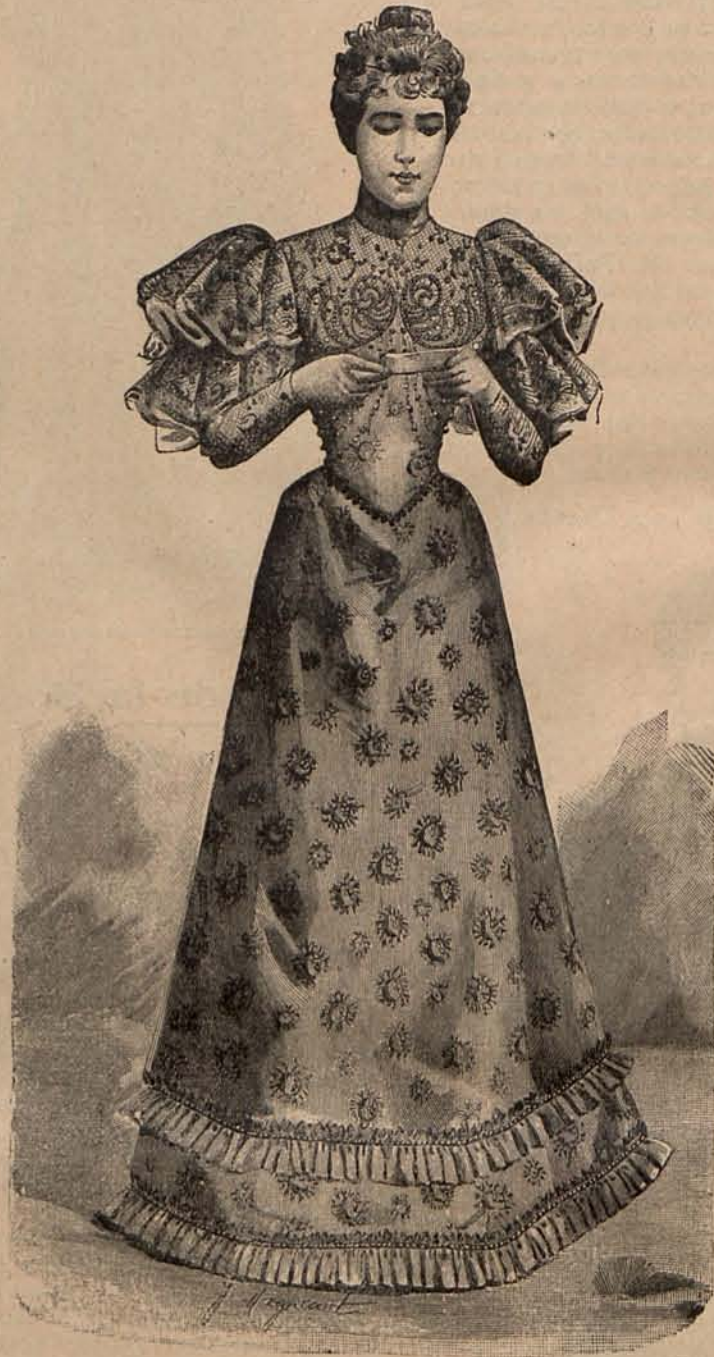
Núm. 8.—Traje para recibir.

Núm. 1.—TRAJE DE NOVIA Y TOILETTES DE CEREMONIA.—(1) Traje para niña de 12 á 14 años.—De seda blanca moteada. Cuerpo cruzado sobre una camiseta de surah rosa. Mangas de doble globo. Falda con entredoses de encaje, sujeta por un cinturón cerrado delante con un lazo. Sombrero de fieltro blanco adornado con un lazo de cinta rosa. Precio del patrón: 2 pesetas 50 céntimos.—(2) Traje para asistir á la boda.—De crespón ondulado rosa y blanco. Cuerpo cruzado sobre una camiseta de muselina de seda. Mangas pernil de terciopelo rosa. Falda campana, adornada con tres biesses de terciopelo rosa. Sombrero ondulado de castor blanco, forrado de terciopelo rosa y adornado con plumas de avestruz. Tela necesaria para el traje, 9 me-