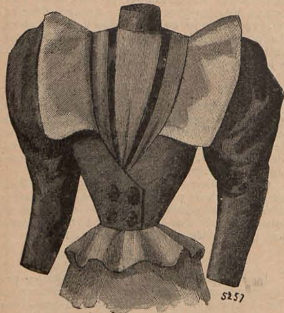
Núm. 6.—Cuerpo novedad.

son de terciopelo y de piel, alternando los primeros con los segundos. También las levitas, que vuelven á estar muy de moda rejuvenecidas por los cuellos esclavinas, lucirán las pieles que han de figurar como adorno y abrigo en la mayor parte de los trajes y accesorios femeniles.