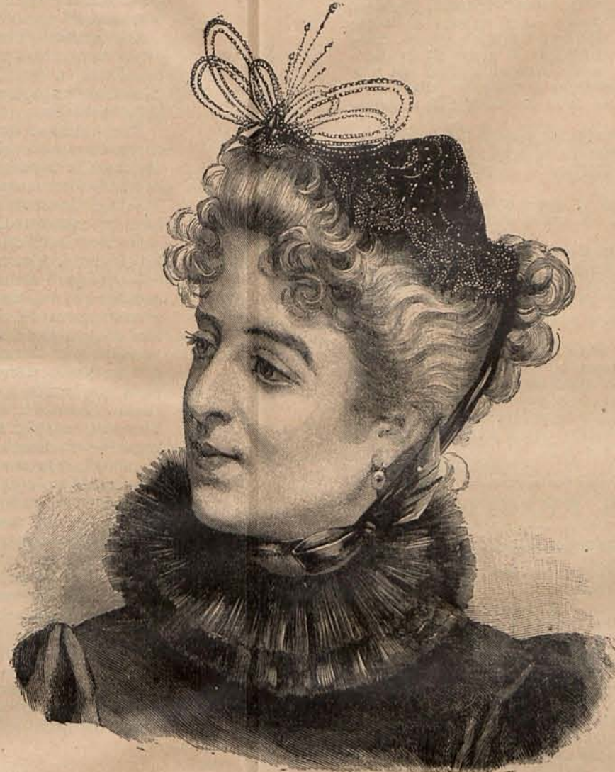
Núm. 9.—Capota para teatro.

Núm. 2.—Traje para calle.—De lanilla marrón claro, adornado con terciopelo marrón oscuro. Cuerpo corto sujeto al talle por un cinturón de pasamanería, y alto en la parte superior, con cuello de piel nutria. Un volante en forma de berta, con almenitas de terciopelo y un lazo alsaciano adorna la parte superior del cuerpo, formando hombreras. Mangas de pernil. En la falda se colocan cinco galones de terciopelo marrón oscuro. Sombrero de terciopelo marrón con plumas crema. Precio del patrón del traje: 3 pesetas.—(2) Trajecito para niño de 2 á 3 años.—De franela listada, con cinturón, carteras de las mangas y cuello de raso, de un color que armonice con el del traje. Mangas huecas. El trajecito ó blusa, se cierra con una fila de botones. Caprichosa gorrita de terciopelo del punto del color de los adornos del traje. Precio del patrón del trejecito: 2 pesetas.—(3) Abriguito para niña de 6 á 8