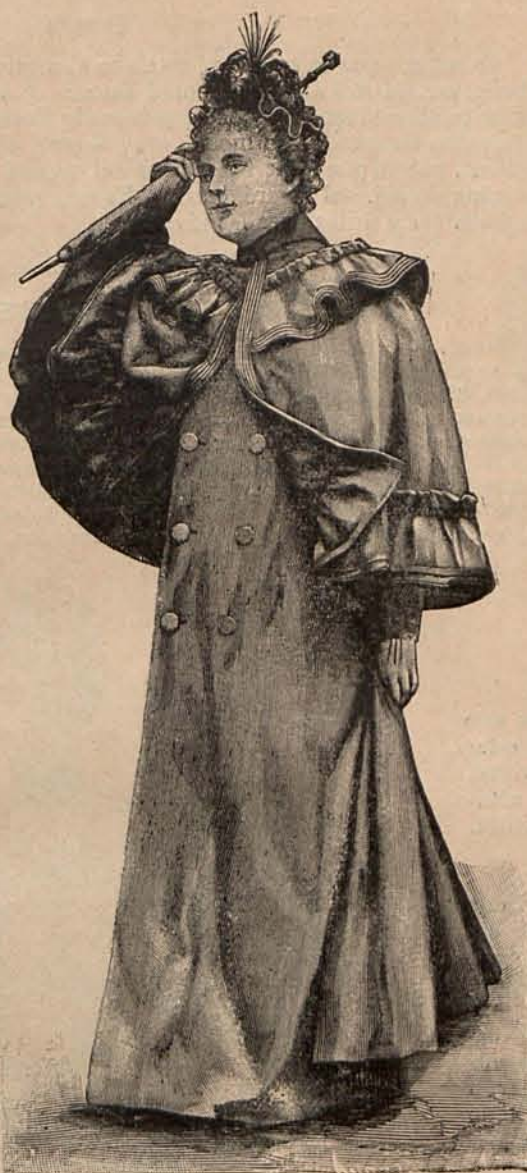
Núm. 3.—Impermeable con esclavina.