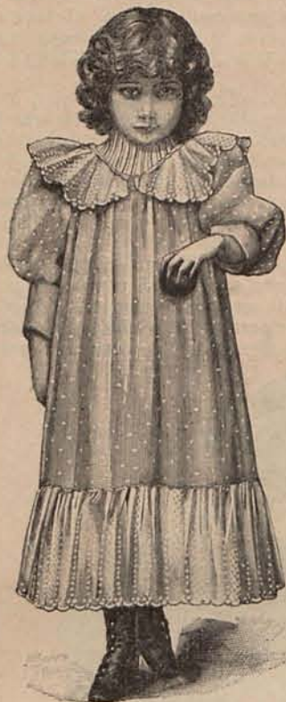
Núm. 14.—Trajecito para niña de 4 á 6 años.

Entre infinitos ejemplos que citan los libros de Medicina, hay el de un tal Juan Lafite que murió en 1766 á la edad de 136 años, el cual desde la infancia adquirió la costumbre de tomar dos ó tres