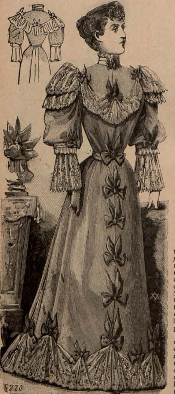
Núm. 7.—Bata elegante.

Es más bien un abrigo, puesto que se compone de una especie de capa que llega hasta muy cerca del borde del traje, y se adorna con tres ó cuatro cuellos-esclavina. Se confecciona con paño ó gruesa sarga, y se forra primero de franela y sobre ésta de seda. Se ciñe al talle por medio de una cinta, y como ven las lectoras abriga y sirve de impermeable contra las lluvias. Algunas señoras prefieren el capuchón á los cuellos-esclavina; pero con los cuellos resulta la prenda más elegante y sobre todo más de moda.