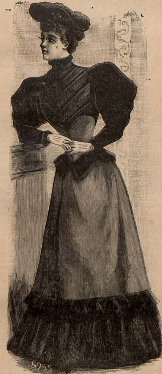
Núm. 11.—Traje para visita.

Núm. 5.—Traje para paseo.—De lanilla cuadrículada amarilla y granate. Cuerpo drapado, con solapas de terciopelo granate y triple cinturón con lazos de terciopelo granate. Plastrón de terciopelo idéntico. Mangas de pernil. Falda campana, adornada en el bajo con un volantito, sobre el que aparece una drapería