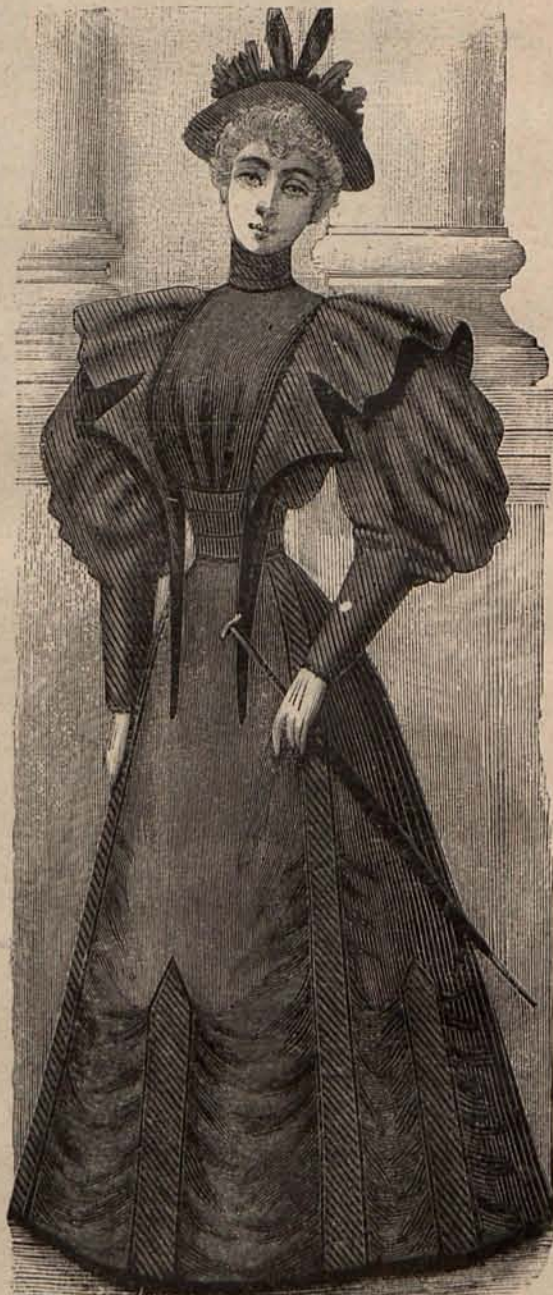
Núm. 4.—Traje para calle.