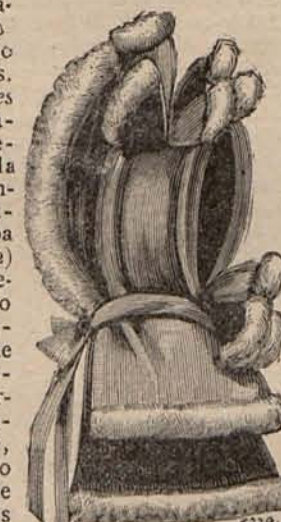
Núm. 14.—Capota para niña de 3 á 5 años.

ciopelo negro, rodean el bajo. Cuerpo chaqueta, con cuello vuelto, escotado en punta sobre un plastrón terciopelo. Dos grandes botones de terciopelo, cierran los delanteros. Mangas de terciopelo. Capota de terciopelo, adornada con un pájaro fantasma. Tela necesaria para el traje: 6 metros de lana, doble ancho, y 4 de terciopelo. Precio del patrón: 3 pesetas.