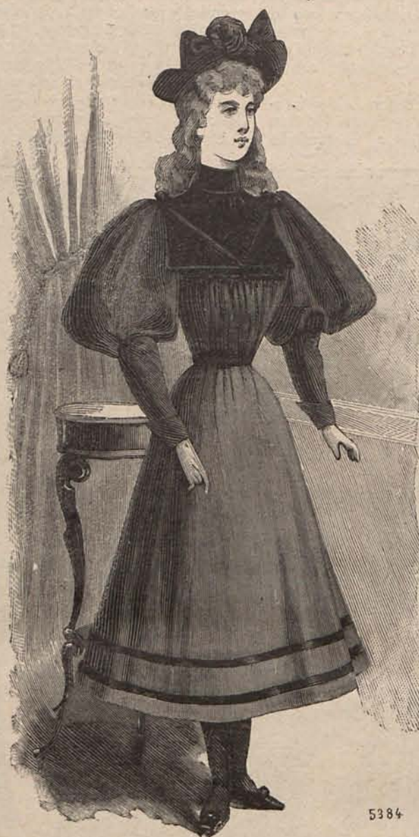
Núm. 7.—Traje para niña de 10 á 12 años.

el Invierno del uso de lencería especial confeccionada con tejidos, tales como franela y muletón, tejidos que ofrecen el inconveniente muy sensible para las señoras gruesas, de abultar mucho más de lo que sería de desear. Teniendo esto muy en cuenta, las lencerías francesas han ideado modelos exclusivamente para esta clase de prendas, que como mis lectoras juzgarán porque voy á tener el gusto de describirlas, resultan en extremo prácticas. Salvo contadas escepciones, de franela ó muletón no suelen confeccionarse otras prendas que el pantalón, una enagua interior y una almilla ó cubre-corsé. Pues bien, en los modelos á que aludo, el primero y la segunda están cortados y cosidos aisladamente, y luego montados juntos en una ancha cintura de percal francés que forma acen-