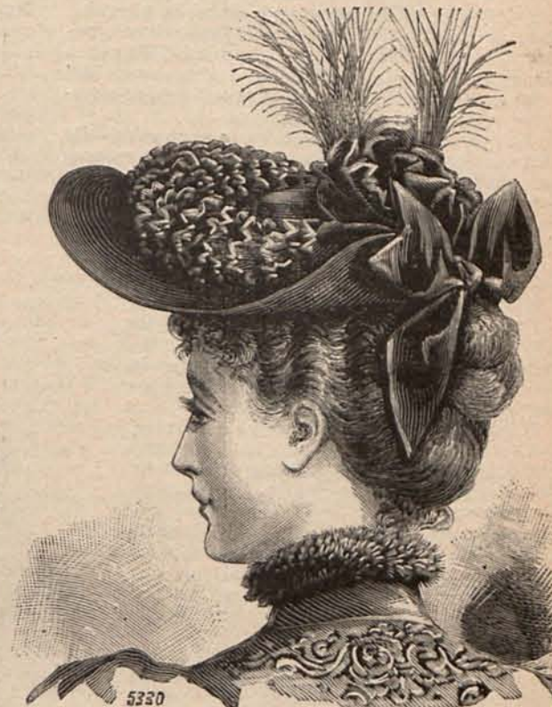
Núm. 10.—Sombrero Gabriela.

Núm. 5.—Abrigos de Invierno.—(1) Largo sobretodo, de paño diagonal verde