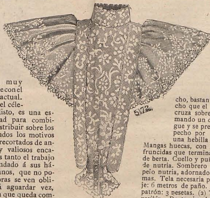
Núm. 8.—Adorno sobrepuesto para teatro.

Las aplicaciones de encaje, sembradas á capricho sobre fondos de terciopelo y raso, constituyen un adorno de traje de baile, teatro ó comida de cere-