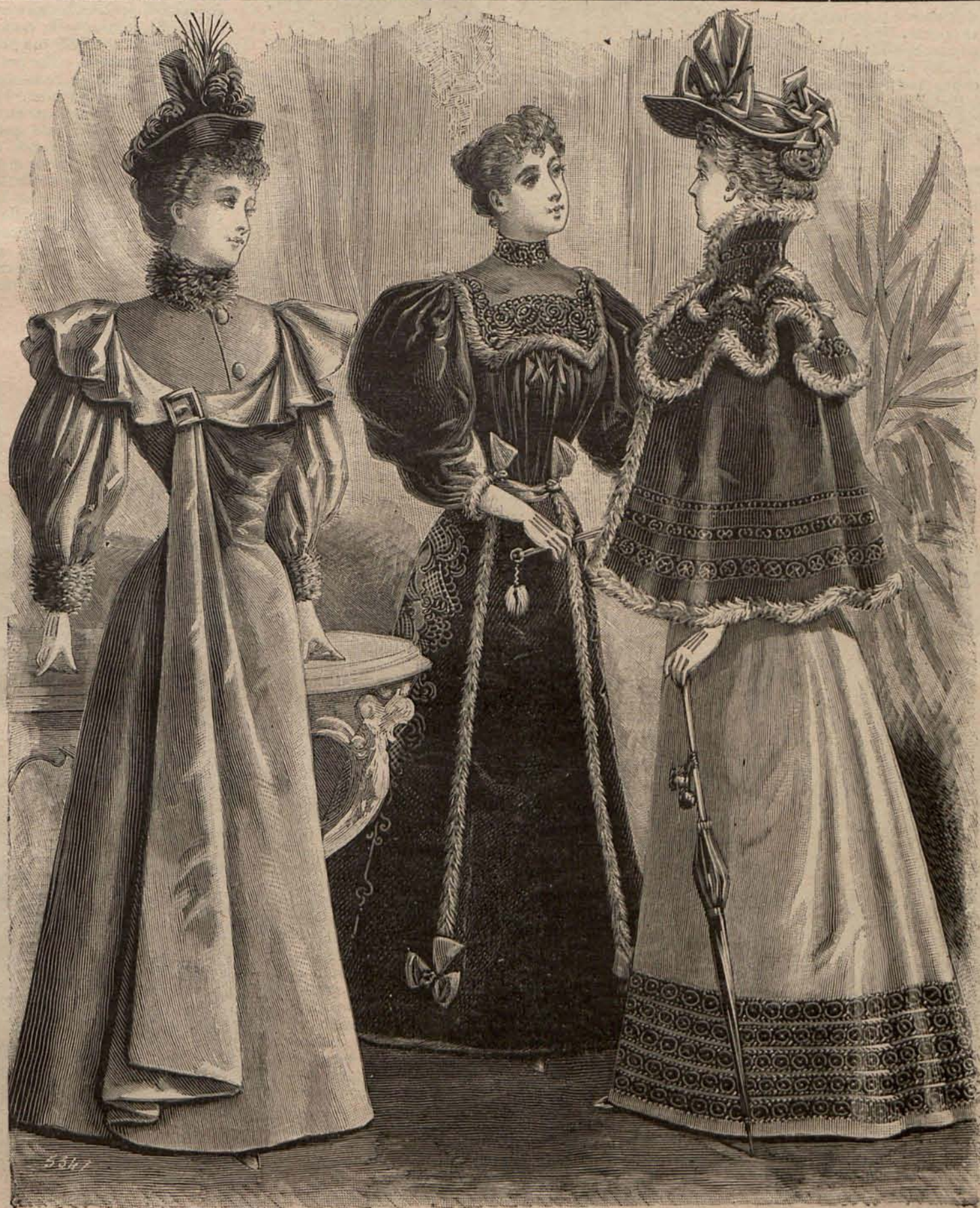
Núm. 1.—Trajes para visita y traje para recibir.