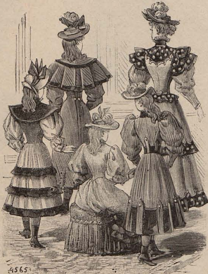
Reverso del Figurín acuarela.

se abren ligeramente sobre una camiseta de lana. Mangas abullonadas. Sombrero de fieltro gris, adornado con lazos de terciopelo azul. Modelo 2.º, para niña de 9 á 11 años. De lana diagonal de tonos cobre y negro. Larga túnica muy entallada en el cuerpo, cerrada delante con una fila de botones de terciopelo negro. Un cuello vuelto formando puntigudas solapas bordeado de galones de terciopelo negro, adorna la parte superior de la espalda y los delanteros. En el bajo de la falda se disponen galones de terciopelo simulando almenas, y filas de tres botones también de terciopelo. Mangas huecas, con