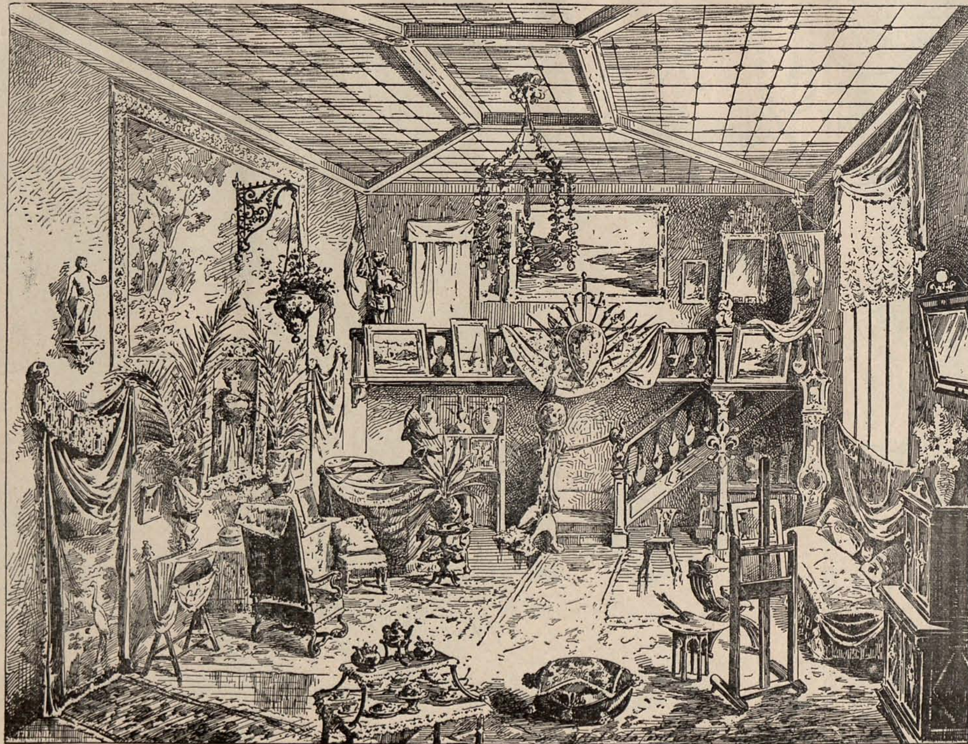
Estudio de pintora.

Frente por frente del diván hay una mesa cuadrada, cubierta por un tapete de estilo oriental, y en torno suyo se agru-