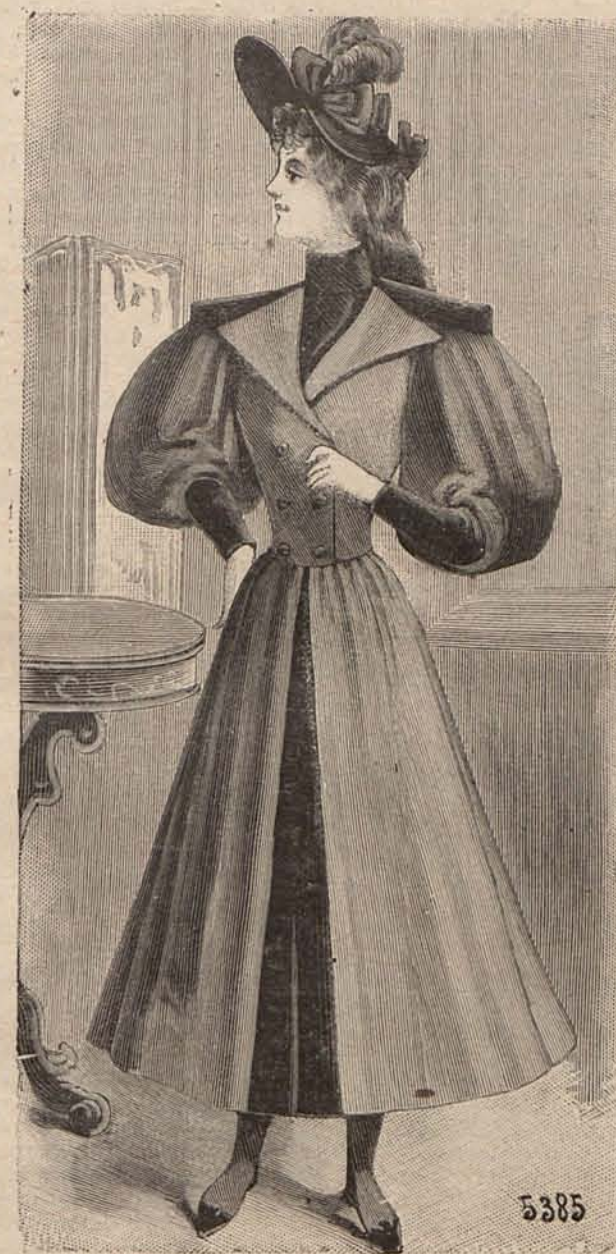
Núm. 4.—Traje para calle.

Núm. 3.—Traje para calle.—De lana y terciopelo marrón. Falda campana de lana; cuatro galones de ter-