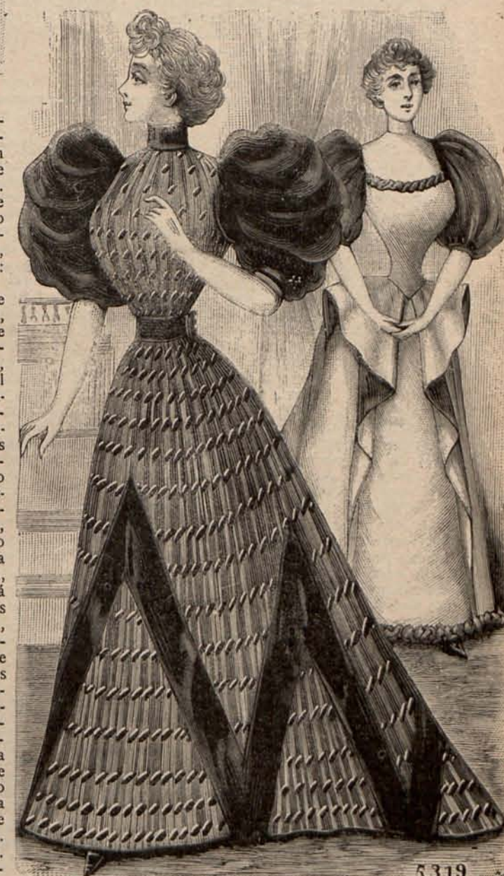
Núm. 15.—Trajes para recepción.

musgo. La espalda está plegada, y los delanteros que no tienen pinzas, quedan completamente sueltos. Un cuello vuelto, unido á un cuello Médicis, adorna la parte alta del cuerpo y oculta las hombreras de las mangas, que son de forma perdida. Bandas de piel negra rodean los contornos de la prenda. Sombrero de terciopelo negro, adornado con plumas y lazos de cinta. Precio del patrón: 3 pesetas.—(2) Chaqueta de paño masilla, con espalda muy ajustada y delanteros rectos. Las mangas, el cuello escarlado, el cuello vuelto y las solapas, son de terciopelo negro, galoneados de plata. Sombrero de fieltro, color masilla, adornado con plumas negras. Manguito de terciopelo y piel. Precio del patrón de la chaqueta: 2,50 pesetas.