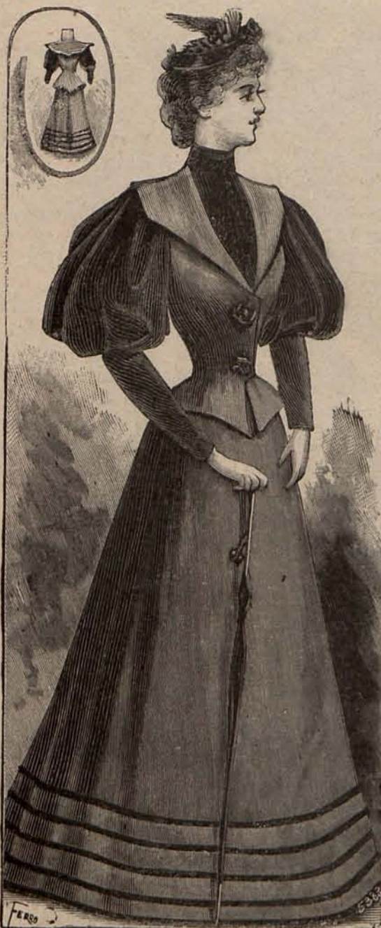
Núm. 3.—Traje para calle.

Y completaba estas hermosas consideraciones con la siguiente afirmación: «No tratemos de analizar la causa de esos actos de honradez, de generosidad, de