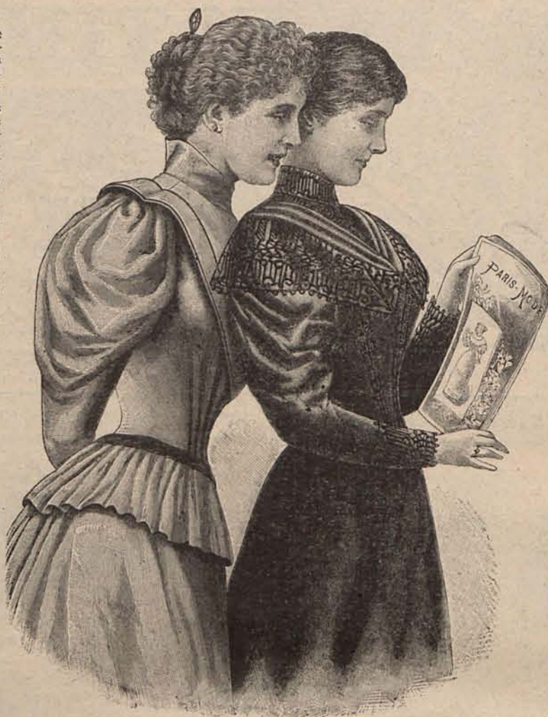
Núm. 2.—Cuerpos para traje de casa.

Los ilustres académicos examinan tranquilamente durante el año las producciones del ingenio que aspiran á los diversos é importantes premios que se deben á inteligentes y generosas fundaciones, y reciben de todos los puntos de Francia noticia de los actos de virtud ejecutados por personas que ignoran que