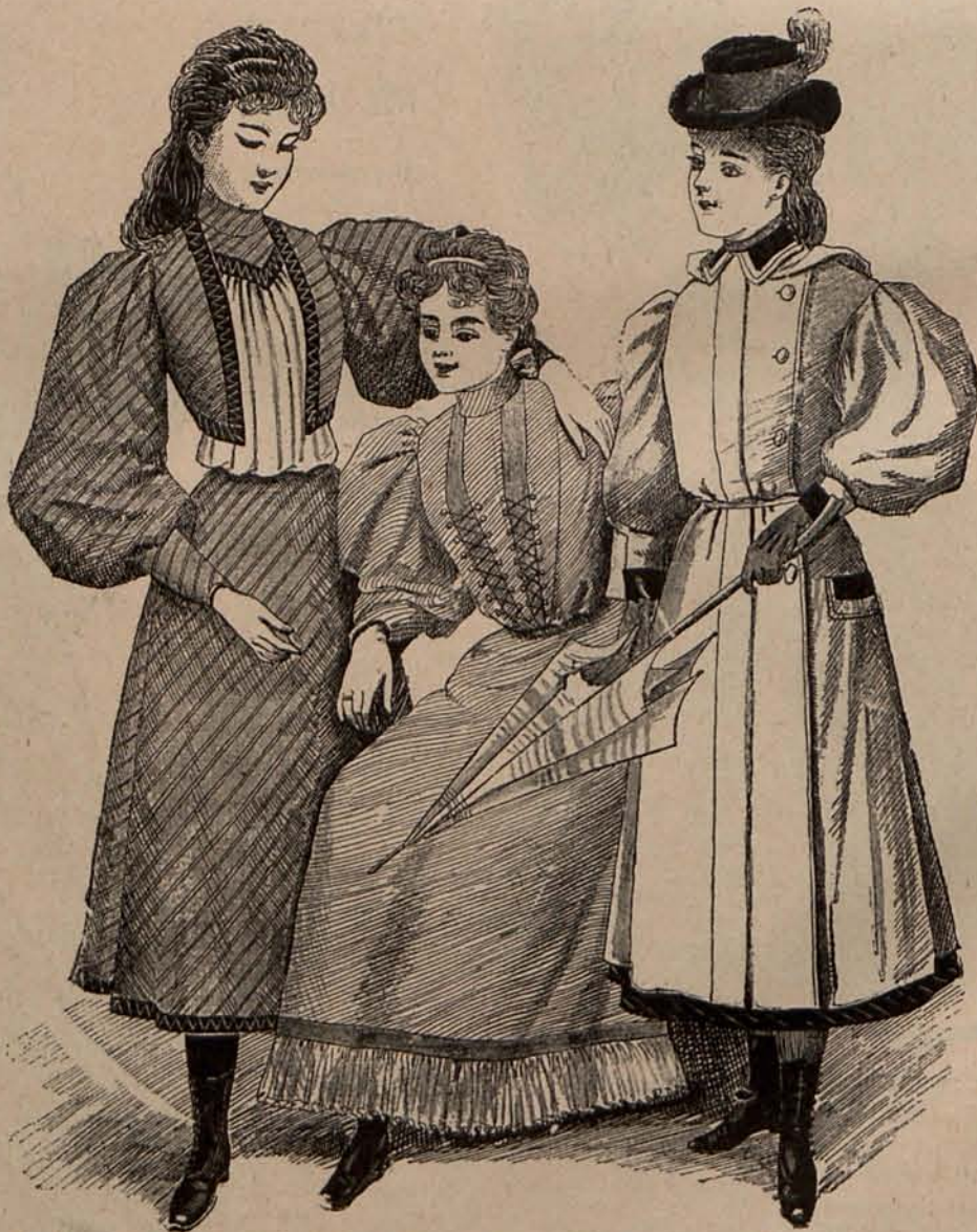
Núm. 16.—Traje para niña de 11 á 13 años.—Núm. 17.—Traje para niña de 12 á 14 años. Núm. 18.—Impermeable para niña de 10 á 12 años.