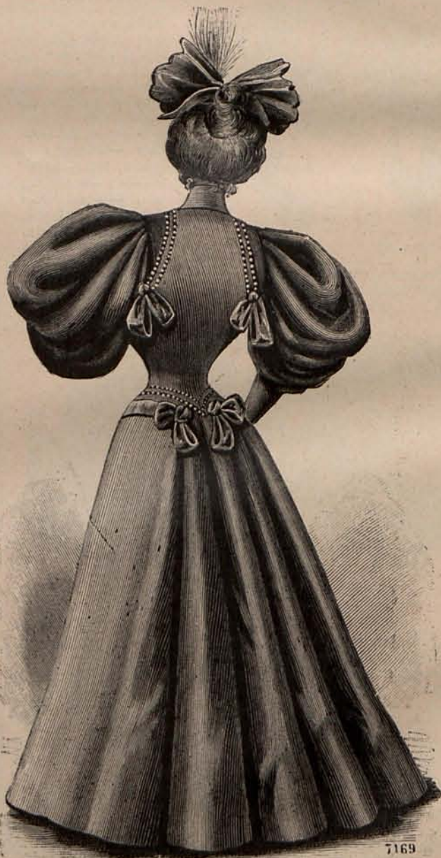
Núm. 8.—Espalda del traje para visita, grabado núm. 6.