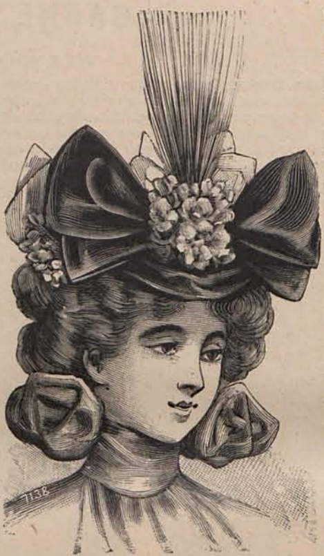
Núm. 7.—Sombrero Aliana.