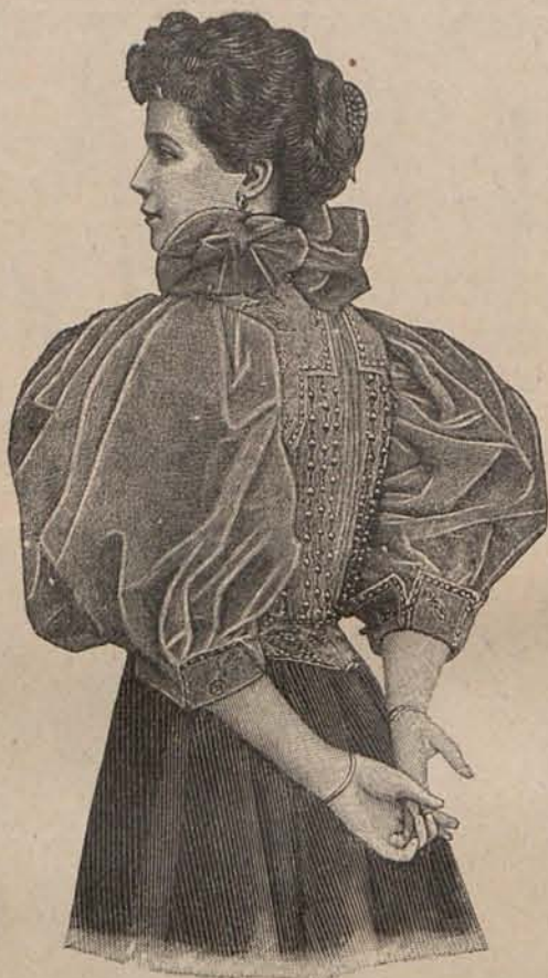
Núm. 2.—Cuerpo para traje de recibir

Lo peor en este caso es que en vez de preguntarnos la causa del mal que sufrimos, en vez de escudriñar los misterios de nuestro propio pensamiento, aceptamos el tedio como una cosa fatal, irremediable; y mientras dura el ac-