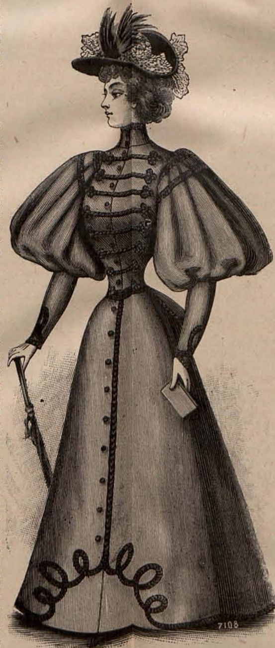
Núm. 10.—Traje para calle.