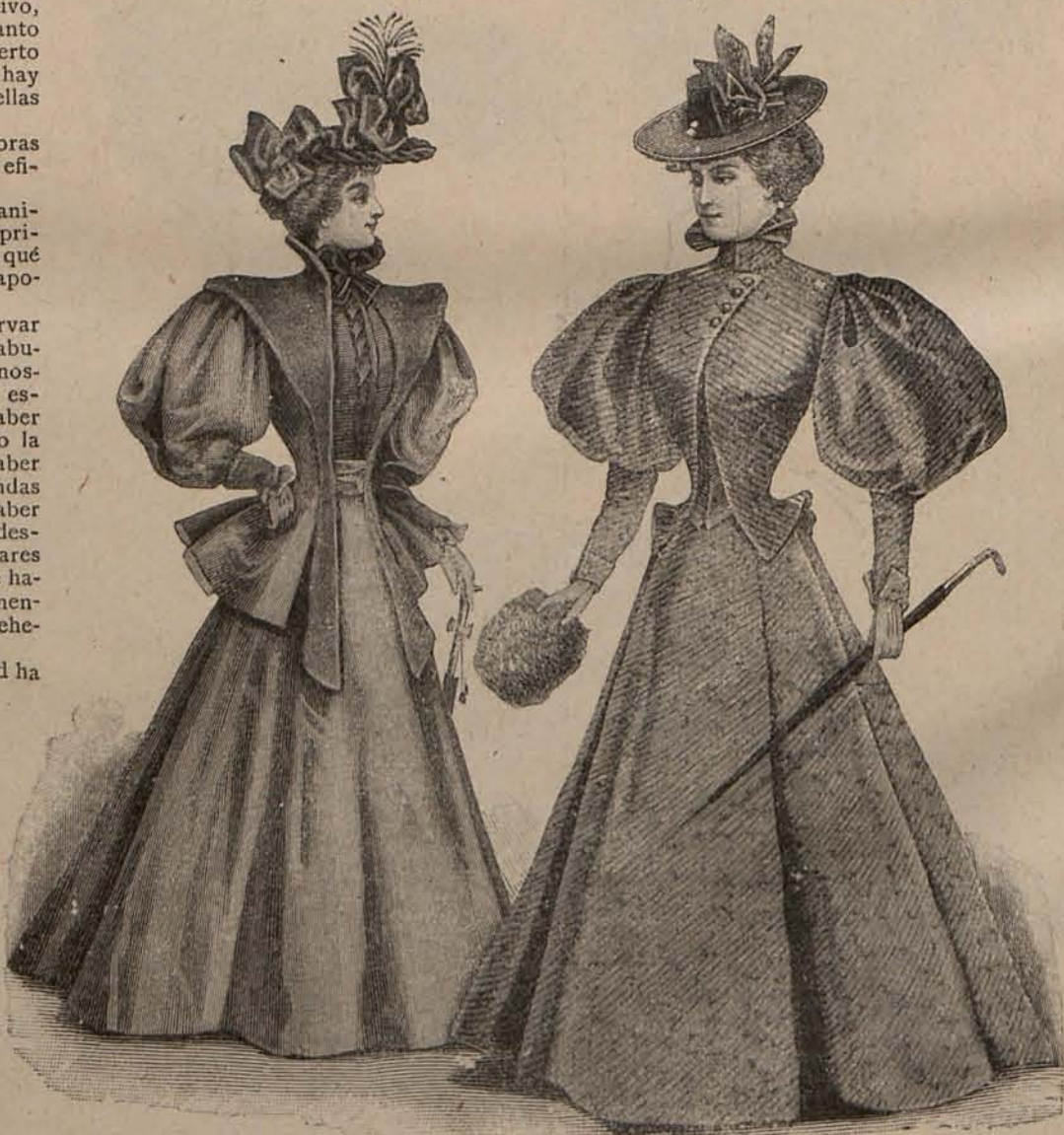
Núm. 3.—Traje para visita.—Núm. 4.—Traje para calle.

Con el amor en el alma, un buen libro á mano, una labor útil y bella, un quehacer que redunde en beneficio de alguien; con el deseo vivo de realizar un fin bueno, la noción fija y constante de la necesidad de cumplir un deber, y la armonía entre los dos elementos esenciales de nuestra existencia, no hay medio de aburrirse.