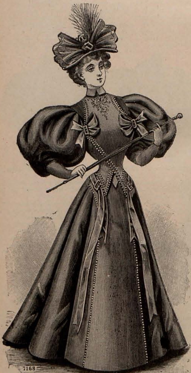
Núm. 6.—Traje para visita.