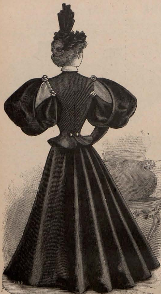
Núm. 5.—Espalda del traje para visita grabado núm. 13.

Por haber llegado tarde a mis manos la carta de D. Ormer, y no por culpa de esta amable señora si no por la del Correo, no pude incluir sus respuestas en la lista general publicada en el número extraordinario. Doy cuenta de ellas en el escrutinio general que inserto a continuación, y copio dos párrafos de su epistola que dan idea de su claro talento y de su hermoso corazón. En el primero después de aprobar estos estudios, dice: «Creo como usted, que el mayor goce para un corazón expansivo es manifestar lo que siente, porque a veces somos muy débiles para sobrellevar sólo una desgracia o una alegría, y necesitamos una persona con quien compartir nuestro dolor o nuestra felicidad. Pero así como no nos ocasiona perjuicio esta manifestación de nuestros sentimientos, confiándolos a nuestra querida revista LA ULTIMA MODA, ocultas bajo el velo del seudónimo, en el trato social sería inconveniente y peligrosa. Es, pues, de la mayor importancia elegir un buen confidente; y digo un, porque