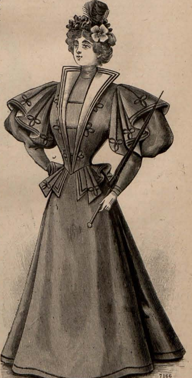
Núm. 14.—Traje para paseo.