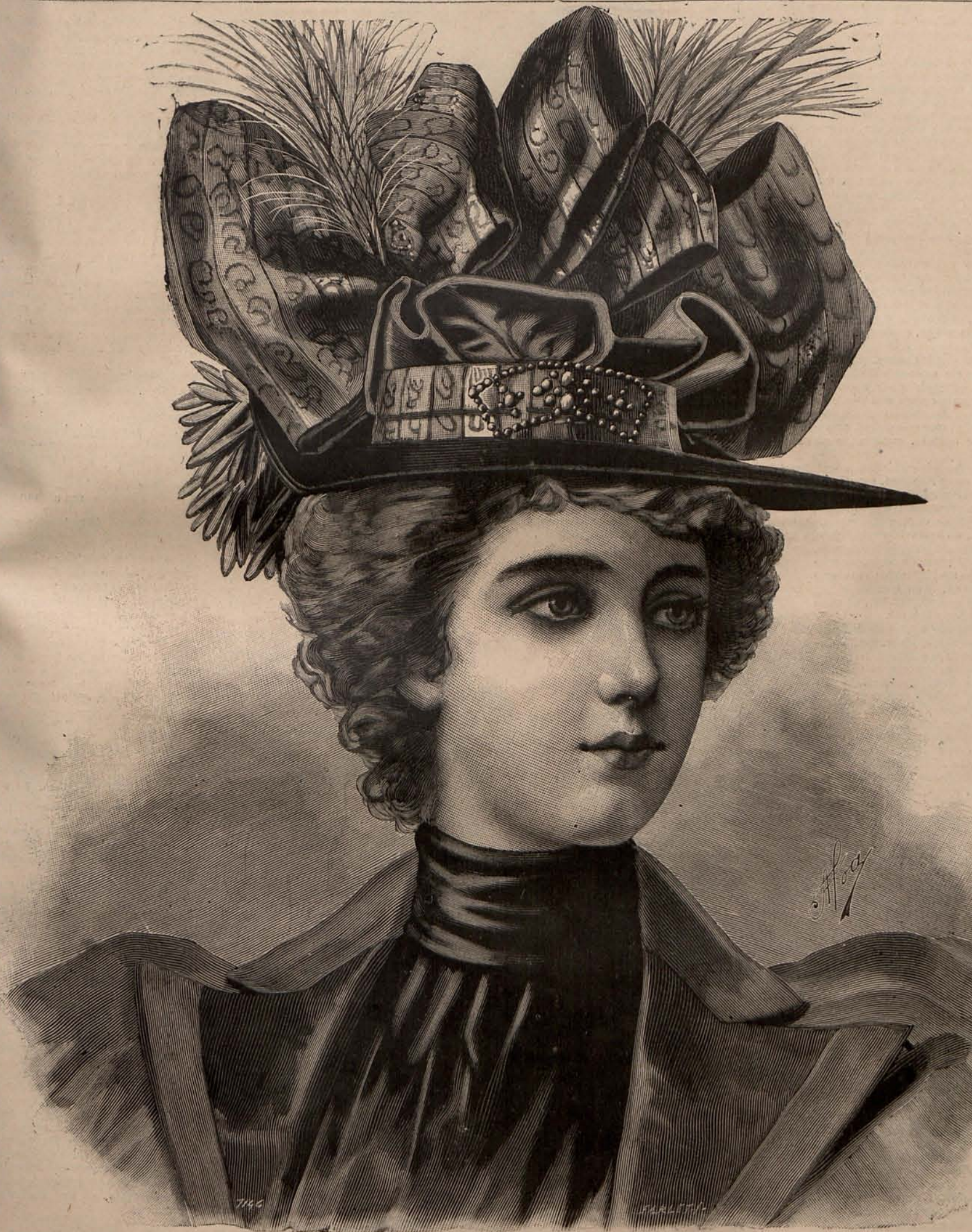
Núm. 1.—Sombrero de Primavera.