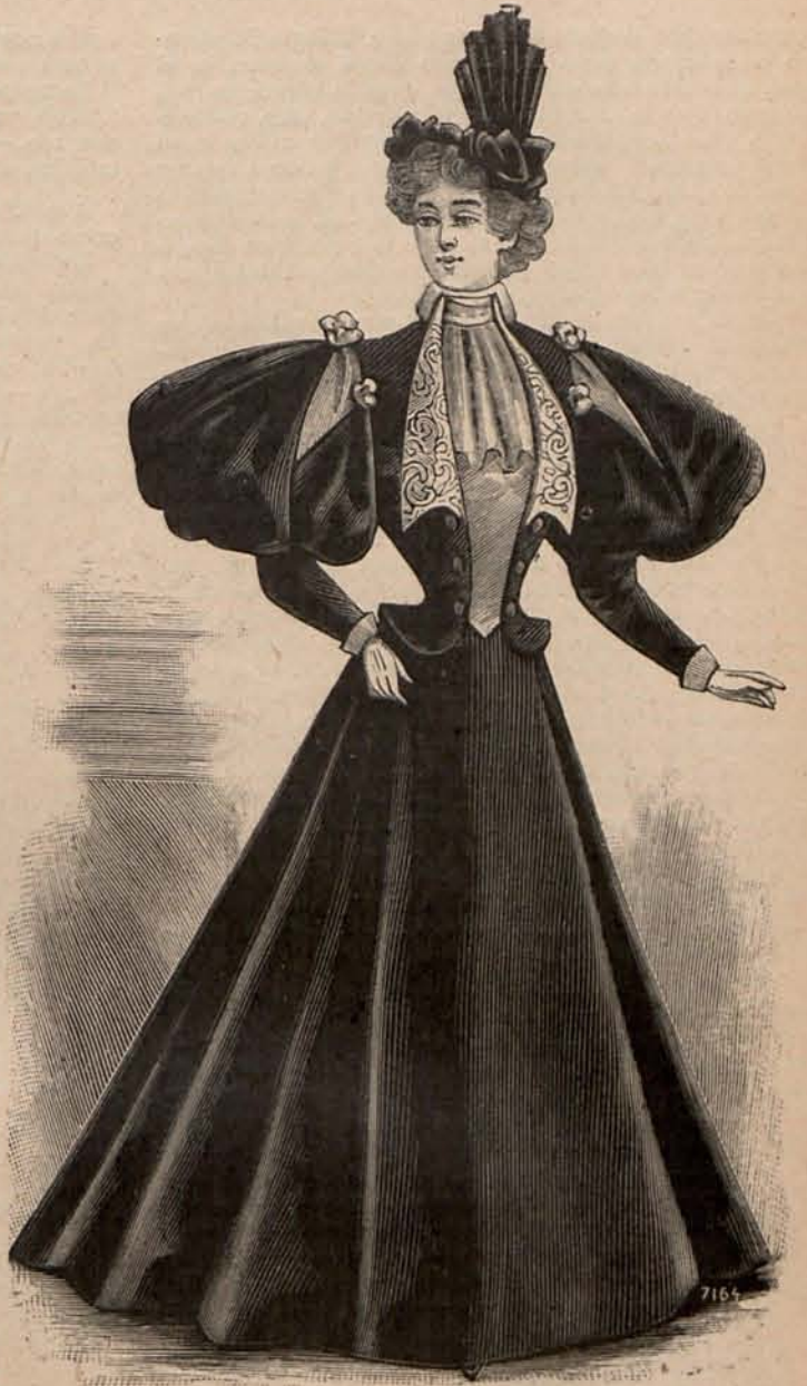
Núm. 13.—Traje para visita.