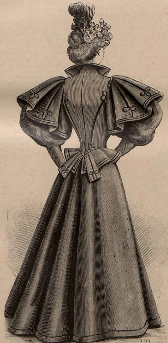
Núm. 12.—Espalda del traje para paseo, grabado núm. 14.