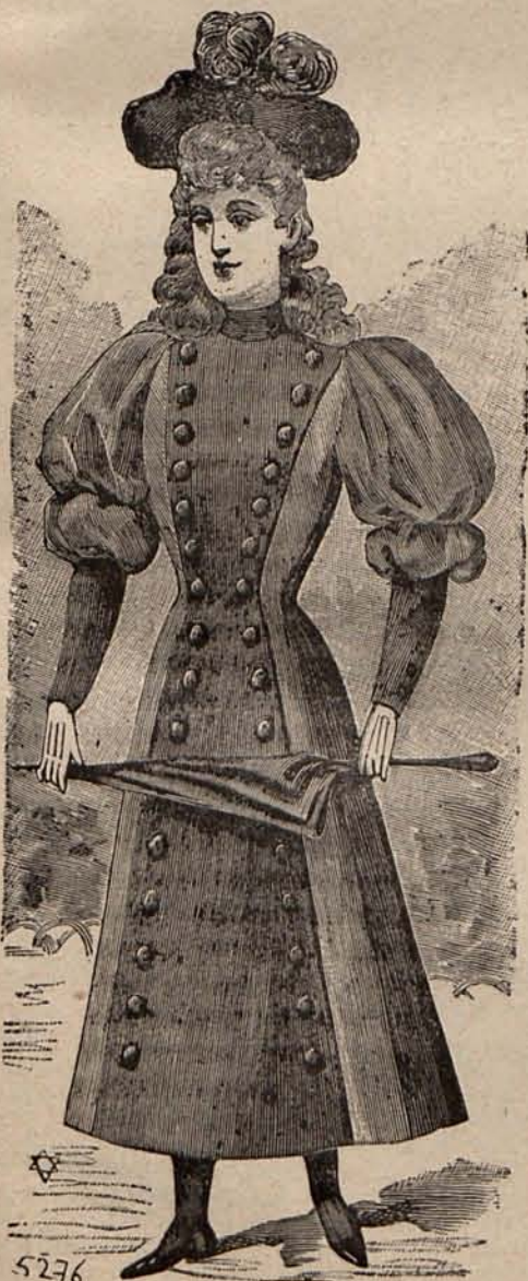
NÚM. 3.—TRAJE PARA NIÑA DE 11 Á 13 AÑOS.