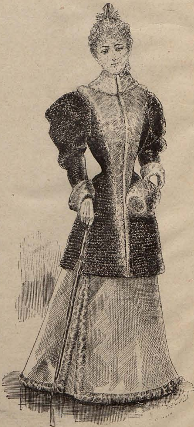
Num. 4.—Traje para visita.