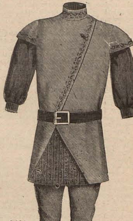
Num. 15.—Traje para niño de 6 á 8 años.

Núm. 5.— Traje para soirée. —De seda plata con reflejos heliotropo. Falda campana muy amplia, colocada sobre un cuerpo corto escotado en redondo. De los costados de este parten dos anchas bandas de crepón de la China plata con flecos de perlas en los extremos; bandas que se anudan sobre el pecho, y caen á lo largo del delantero de la falda. Mangas cortas, abullonadas. Tela necesaria para el traje: 18 metros de seda. Precio del patrón: 4 pesetas.