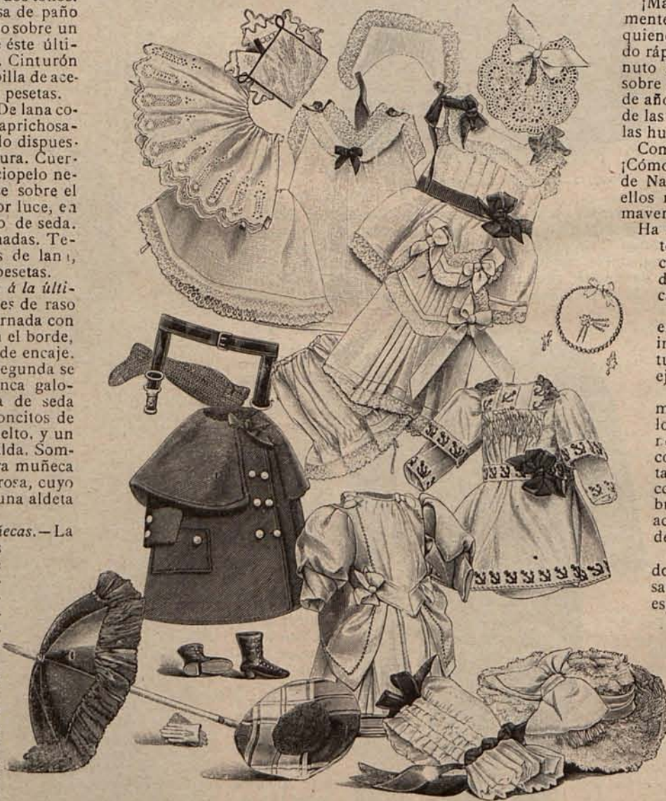
Núm. 18.—Trousseau para muñeca.