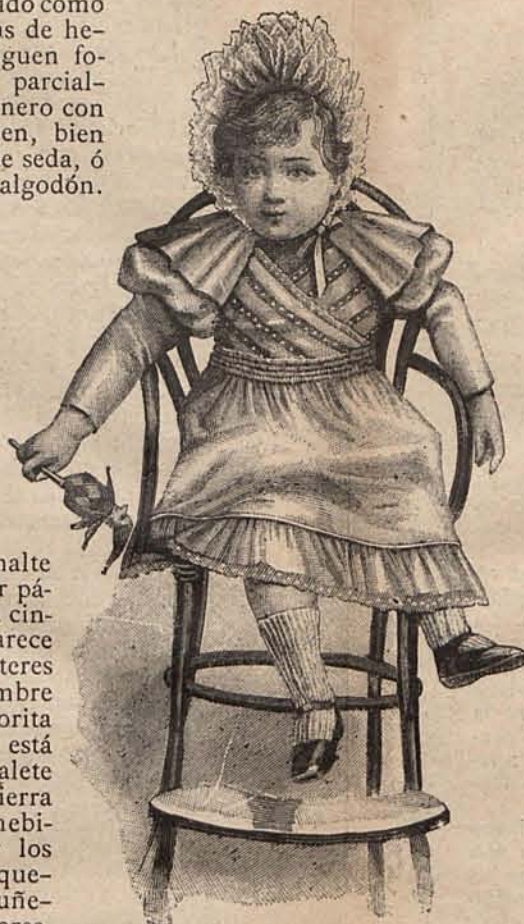
Num. 11.—Trajecito para niño de 1 á 3 años.

en la plana 6. a de este número, tres lindas muñecas con trajes alta novedad y un modelo de trousseau también para muñeca. Recomendando á las niñas la reproducción de unos y