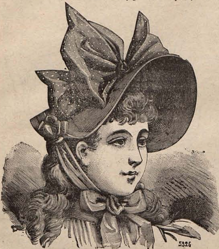
NÚM. 1.—SOMBRERO PARA NIÑA DE 7 Á 9 AÑOS.

Núm. 5.— Traje para niña de 10 á 12 años. —Doble falda campana de lana color pensamiento. Cuerpo corto, con triple cucillo acanalado. Los delanteros están sueltos sobre un plastrón de seda brochada color marfil, cortado al tra-