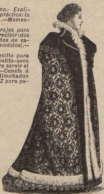
Num. 2.—Salida de baile.

Sin ir más lejos, se ha formado recientemente una asociación, cuyos propósitos deberían imitarse en todas las poblaciones y en todos los países. Los asociados son familias representadas por sus jefes; cada familia con arreglo a sus recursos, se encarga de una o más familias pobres, y su misión es procurar que no falte a sus protegidos lo necesario para vivir. La familia protectora ha de cuidar de que los individuos de la familia o familias protegidas tengan trabajo, asistencia si están enfermos, recursos si carecen de ellos contra su voluntad; y además proporcionarán educación a los niños hasta que aprendan un