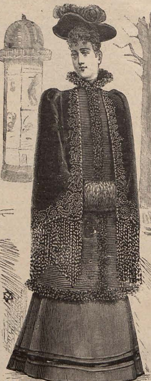
Num. 9.—Abrigo de terciopelo (Delantero.)

Los forros de seda lisa ó tornasolada, siguen desempeñando importante papel en esclavinas y chaquetas. Algunas señoras han adoptado este Invierno para forrar abrigos largos y salidas de baile ó teatro, los antiguos mantones de cachemir de la india, y preciso es reconocer que este forro