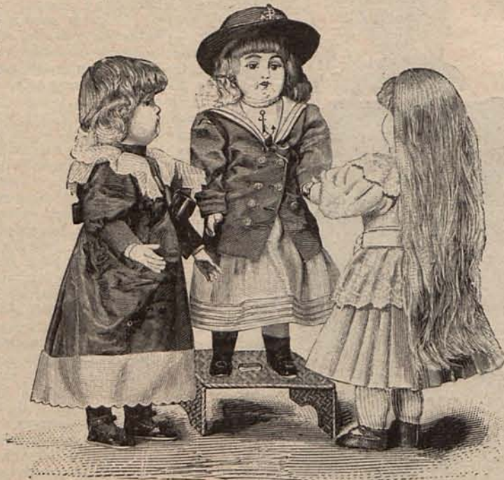
Núm. 17.—Tres muñecas vestidas á la última moda.

En cuanto á los accesorios de toilette, las medias son de seda, las botitas y guantes de fina cabritilla, la sombrilla de surah tornasolado, y el aderezo de perlas.