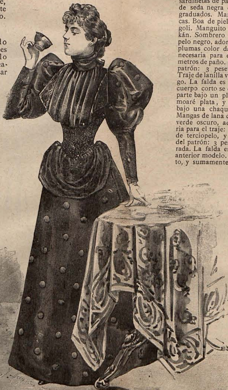
Num. 12.—Traje para recibir.

otro; pues esta amena tarea ha de serles muy agradable para el presente, y no menos útil para el porvenir.