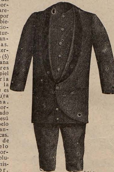
Num. 14.—Traje para niño de 7 á 9 años.

Núm. 6.— Traje para novia. —Es de raso blanco. Falda recta en el delantero formando larga cola plegada en abanico. Grupos de flores de azahar sostienen ligeras draperías de gasa blanca que adornan los costados de la falda. Cuerpo fruncido, velado por ricos encajes. Mangas lisas, con hombreras de encaje. Cinturón de raso blanco. Velo de tul ilusión prendido con una diadema de flores de azahar. Tela necesaria para el traje: 24 metros de raso. Precio del patrón: 5 pesetas. —(7) Traje para niño de 5 á 7 años.—De lana nutria. Pantalón corto. Blusa muy larga, fruncida en la cintura. Su adorno consiste en un cuello vuelto y un plastrón de seda beige, el último con áncora bordada. Mangas lisas. Precio del patrón: 2,50 pesetas. —(8) Traje para visita.—De faya mordorada. Falda campana, guarnecida con dos volantes