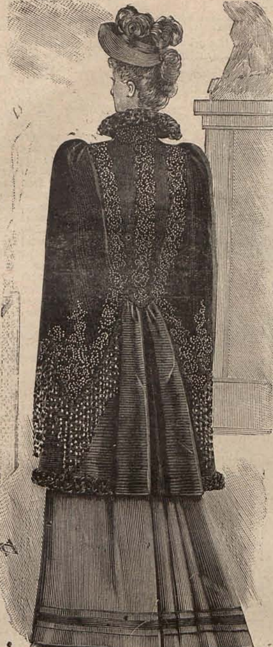
Num. 13.—Abrigo de terciopelo (Espalda.)