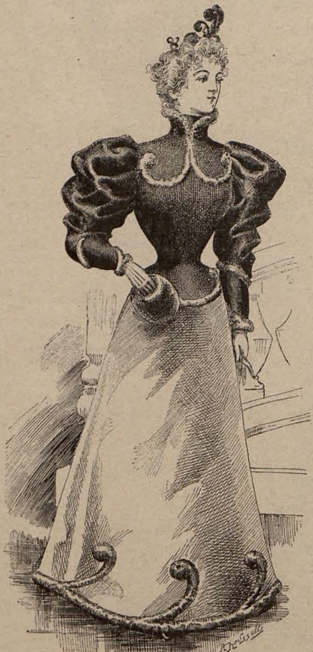
Num. 3.—Traje para