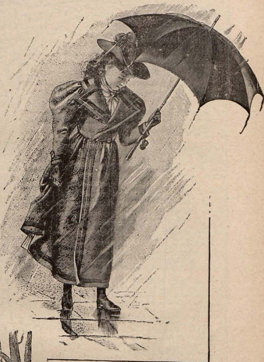
NÚM. 2.—SOBRETUDO PARA NIÑA DE 12 Á 14 AÑOS.