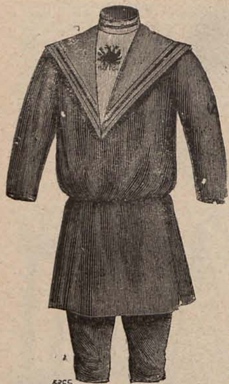
Num. 7.—Traje para niño de 5 á 7 años.

Toilettes para visita y toilettes para recibir.