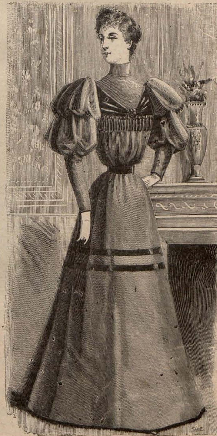
Num. 16.—Traje para recibir.