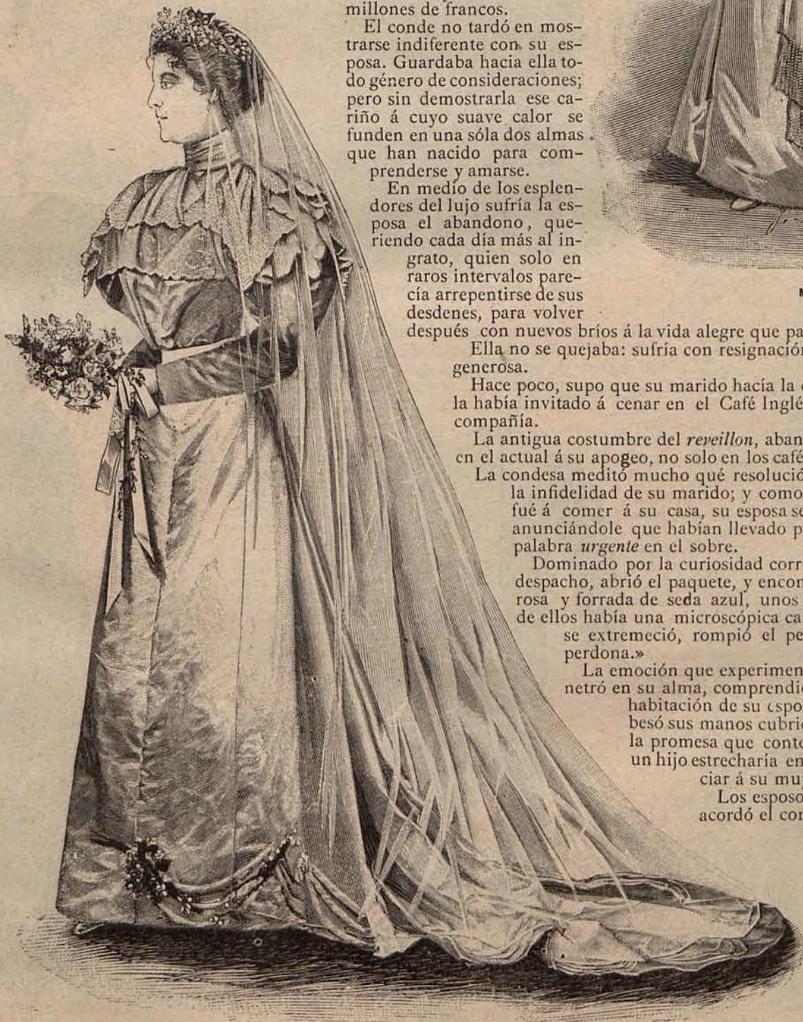
Num. 6.—Traje de novia.