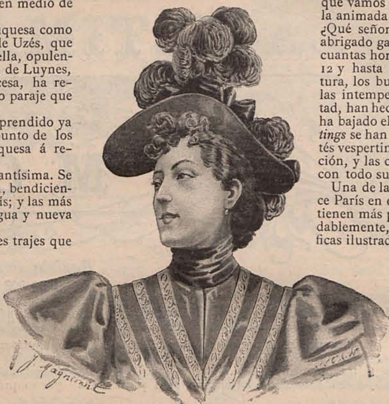
Núm. 2.—Sombrero Julietta.

Después de la bendición nupcial, se celebró el lunch en el palacio de la duquesa de Chevreuse, en cuyos salones había estado expuesto días antes el equipo de la novia, uno de los más ricos que puede soñar la imaginación más ambiciosa y fantástica. ¡Qué profusión de ric