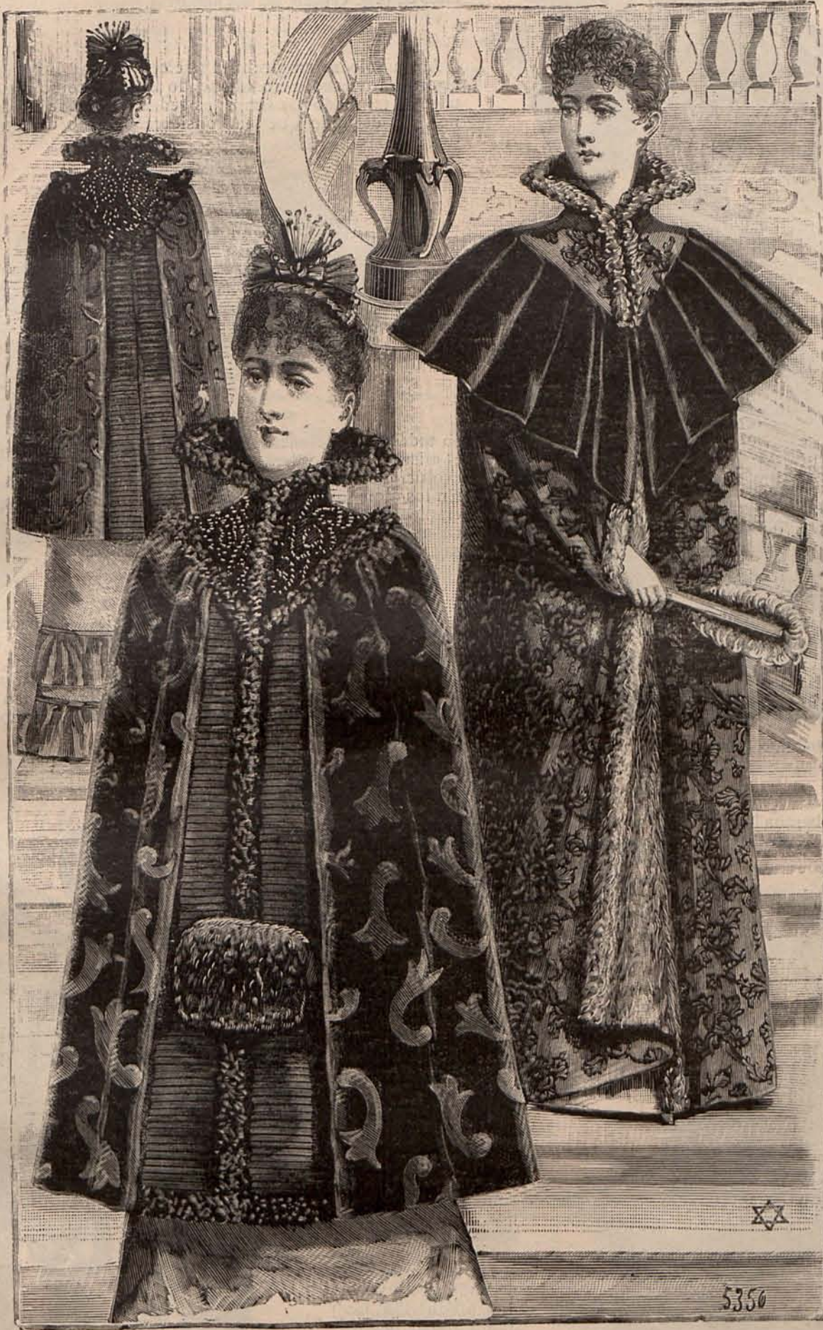
Núm. 5.—Salidas de teatro.

les no consienten, ni aún pagando el hospedaje al más alto precio, que ocurran en sus casas aumento de familia, ni enfermedades graves, ni defunciones.