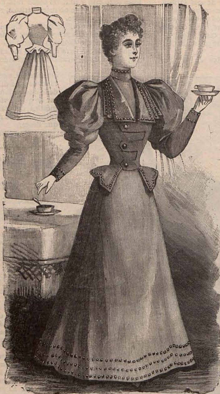
Núm. 6.—Traje para recibir (Espalda y delantero).