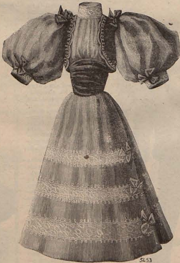
Núm. 15.—Traje para niña de 10 á 12 años.