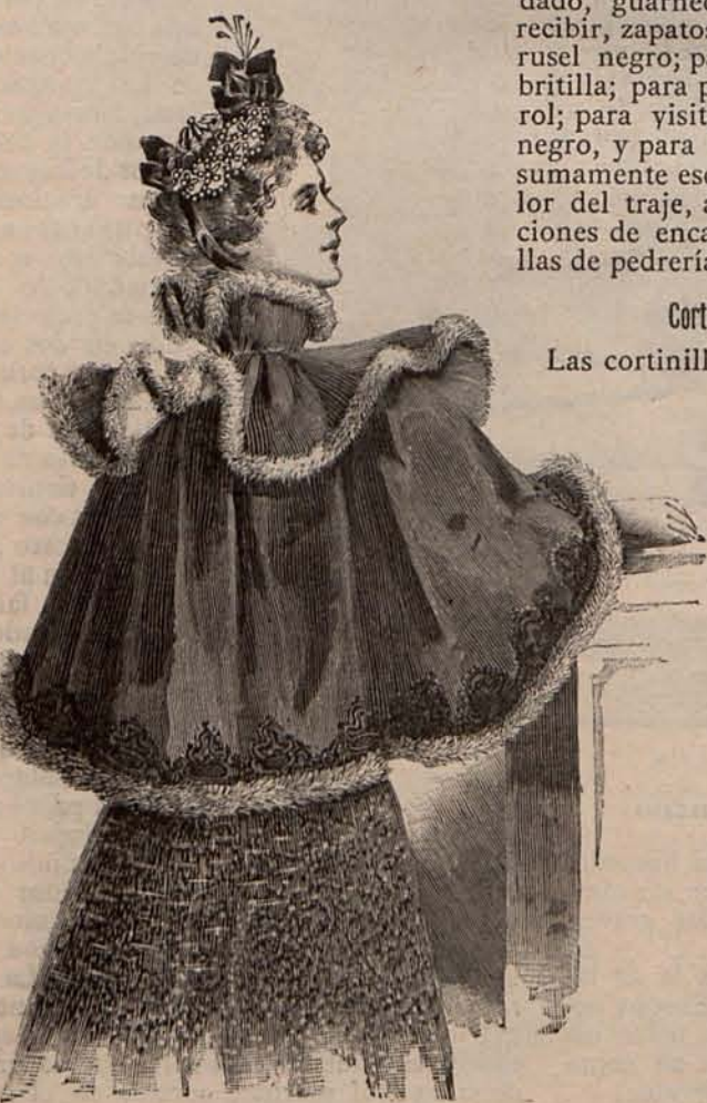
Núm. 7.—Esclavina Mignon.

forma de dientes de sierra, cuyos contornos aparecen marcados por tres filas de fina soutache , también azul. La aldeta ondulada que prolonga la chaqueta, confeccionada con igual tejido que la segunda falda, está forrada de moaré; y de moaré son también las exageradas solapas Directorio que adornan los delanteros y ofrecen la particularidad de estar guarnecidas á su vez por compactas filas de casi invisibles botoncitos de oro. Mangas de sarga ocultas hasta la sangría por amplios bullones de la misma tela, rematados por segundos bullones muy estrechos de moaré. Bises de moaré, sujetos por filas de botoncitos de oro, cruzan las bocamangas.