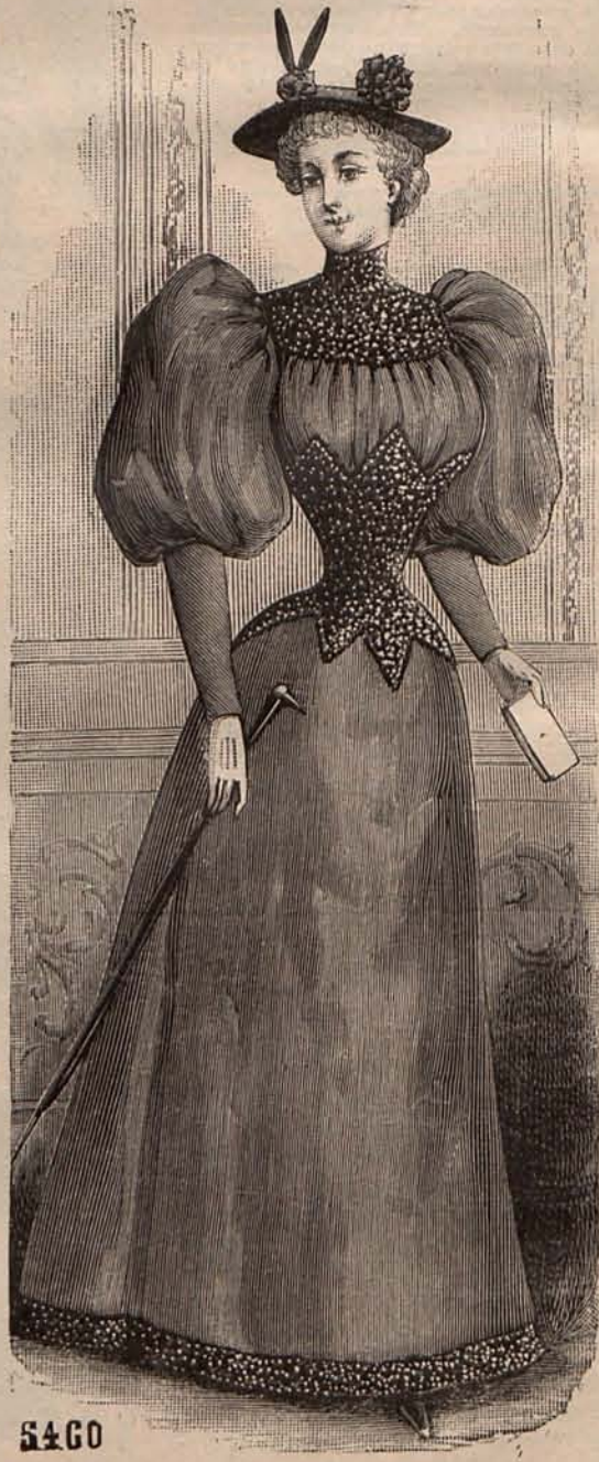
Núm. 4.—Traje para visita.