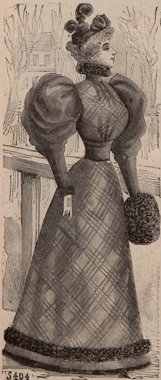
Núm. 3.—Traje para paseo.

y espléndidos encajes! ¡Cuántas joyas! Un collar de rubíes, regalo de la duquesa de Uzés; un servicio de té de plata sobredorada estilo Luis XVI, regalo de los príncipes de Galtzine; un sol de rubíes rodeado de diamantes, regalo de los duques de Luynes; un lazo de diamantes, un brazalete de rubíes y diamantes, otro con perlas blancas, perlas negras y diamantes, otro con una esmeralda rodeada de diamantes, un nécessaire de plata repujada, un abanico de plumas con cifra de brillantes, un servicio de té de plata estilo Luis XV, un collar figurando una cinta cuajada de chispas de brillantes, otro collar de perlas de Oriente con borlas de diamantes, y multitud de objetos artísticos, de muebles preciosos, de abanicos, sombrillas... qué se yo!