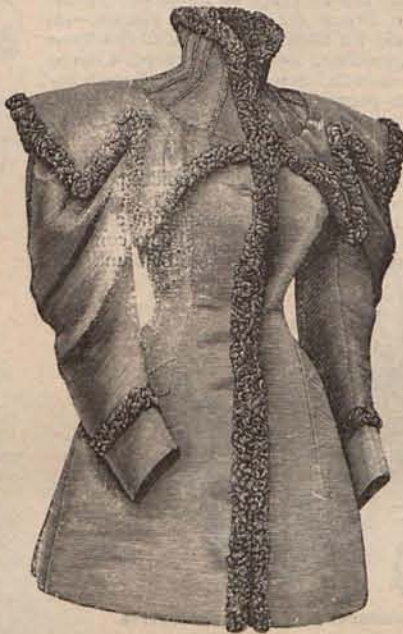
Núm. 14.—Chaqueta de paño.

«Procediéndose á abrir los sobres correspondientes á los artículos premiados, resultó ser el primero titulado Mi sueño , de una señorita de Cádiz, que manifiesta el deseo de que se firme su trabajo con el seudónimo de Violeta ; el segundo titulado Mis tres vestidos blancos , de una señora que como la