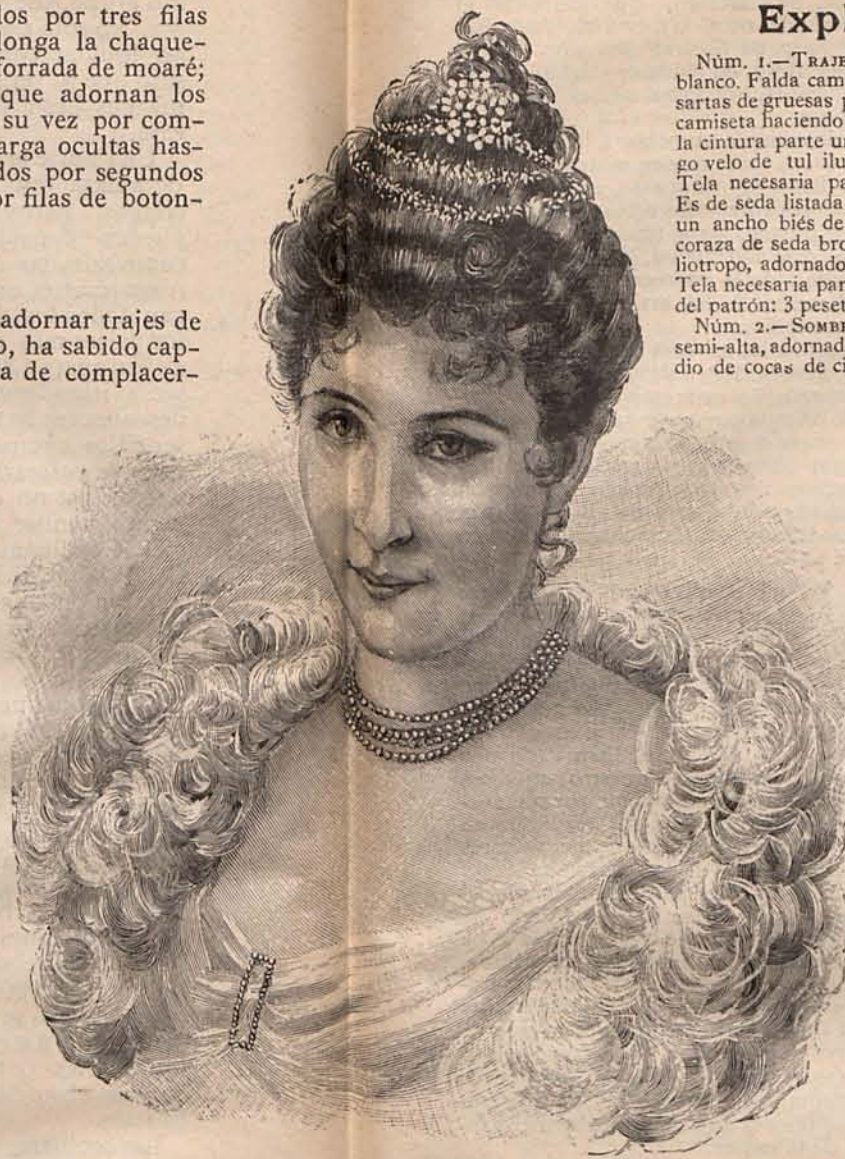
Núm. 9.—Peinado para baile.