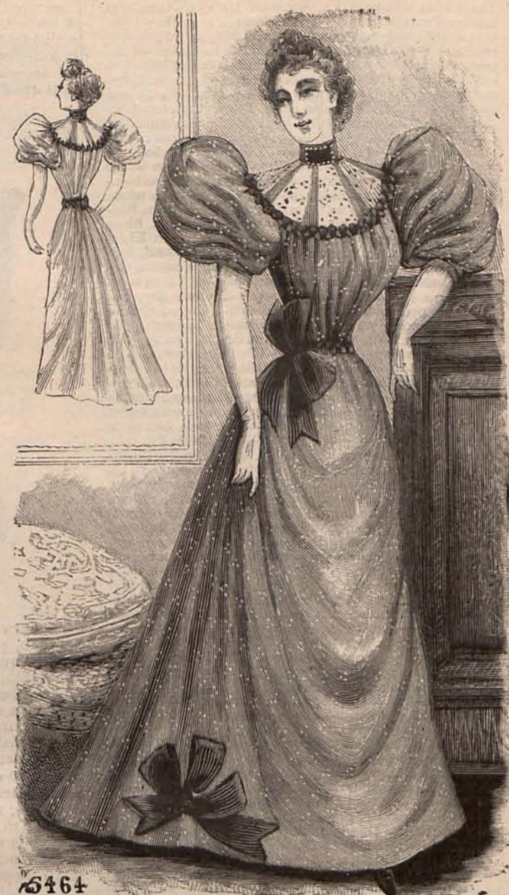
Núm. 12.—Traje para teatro. (Espalda y delantero).

Núm. 10.—PANORAMA DE TRAJES PARA NIÑOS.—(1)