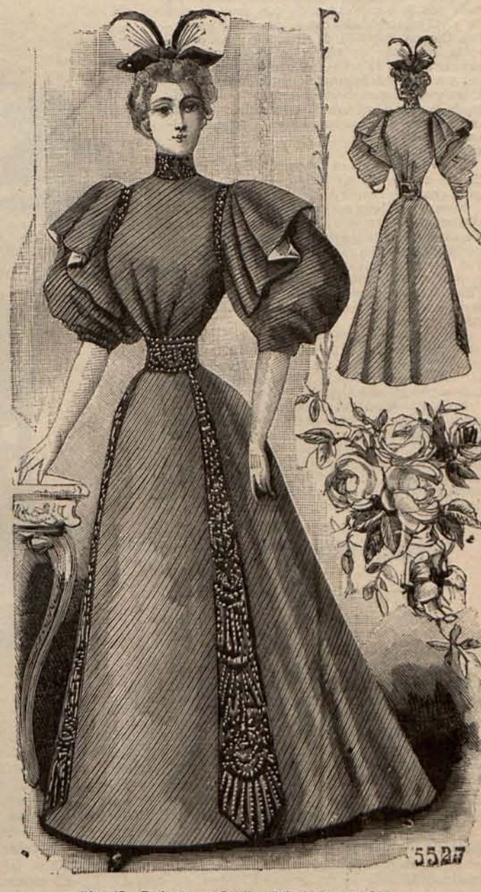
Núm. 15.—Traje para señorita. (Delantero y espalda.)

Núm. 10.—PANORAMA DE TRAJES PARA NIÑAS.—(1) PARA NIÑA DE 7 Á 9 AÑOS.—Fal-