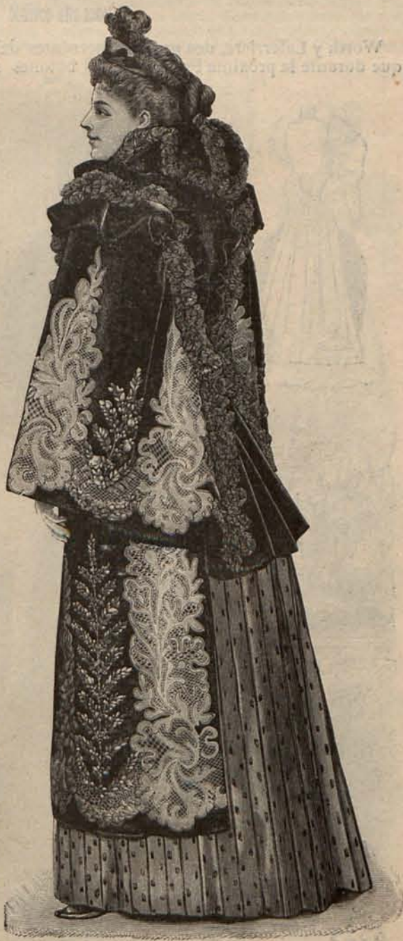
Núm. 7.—Abrigo de terciopelo.