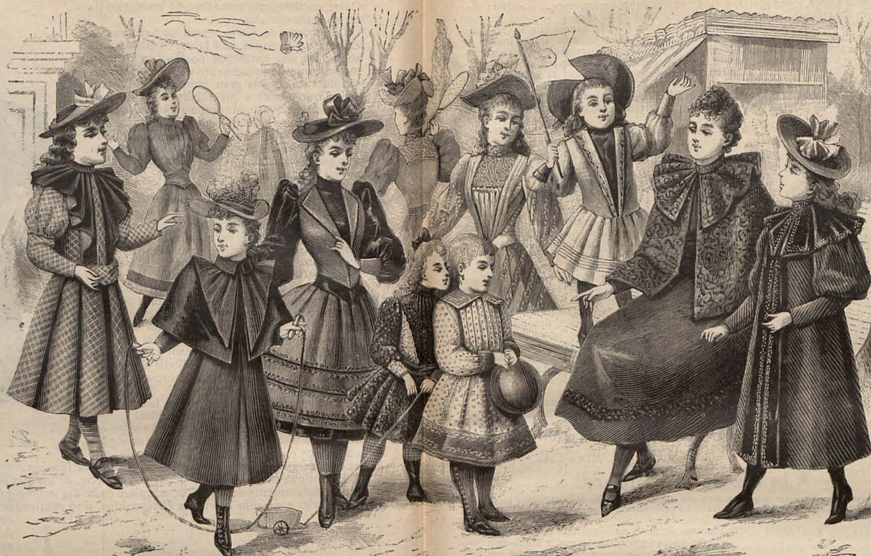
Núm. 10.—Panorama de trajes para niñas.

¡Pobres violetas! De nada les ha servido su encantadora modestia: hoy figuran en los escaparates de los floristas de París á título de novedad. Pero ¿qué puede consistir la novedad de una flor que nos es tan conocida? se preguntarán algunas de mis favorecedoras. Pues nada menos que en que han variado de color, convirtiéndose su tono violeta en verde, blanco ó rojo. Si no estuviera en el secreto, pensaría que deben á la vergüenza este último color; pero lejos de ser así la transformación puede ser onseguida por cualquiera que aplique los sencillos procedimientos que indico á continuación. Para conseguir violetas blancas, basta quemar sobre un platillo un poco de flor de azufre, exponiendo al gas que se desprende el ramo de violetas prontas al sacrificio. Para conseguir violetas verdes, se impregna el ramo