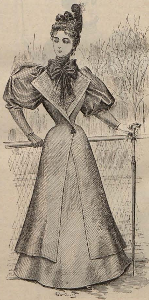
Núm. 11.—Traje para calle.