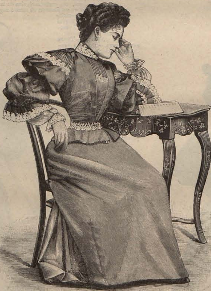
Núm. 17.—Traje para recibir.