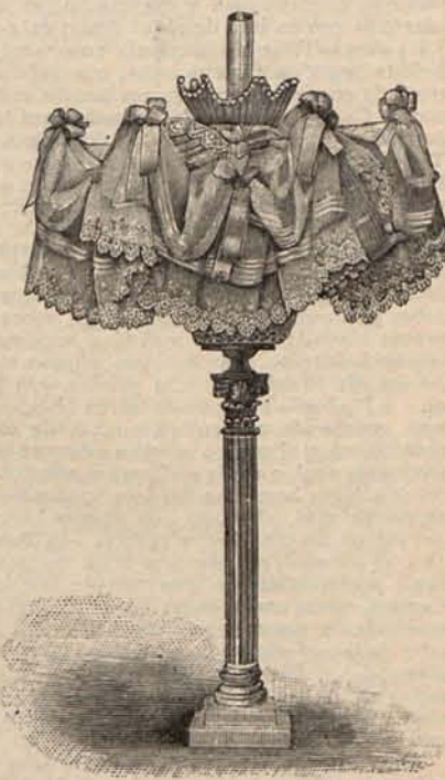
Núm. 14.—Pantalla Mignón.

Núm. 1.—TOILETTES PARA TEATRO.—(1) Traje de seda maíz. La falda está guarnecida en el bajo con una doble guirnalda de margaritas, bordadas con seda plata y hilillo de oro. Cuerpo corselete escotado en forma de corazón. En torno del escote se disponen graciosas draperías de seda, bordadas como el bajo de la falda. Mangas huecas. Salida de teatro de seda brochada, de tonos malva y negro, adornada con un doble cuello esclavina, que se prolonga en dos plegados escalonados que bajan á lo largo de los delanteros. El cuello y los plegados aparecen bordados por tiras de piel de armiño. Tela necesaria para el traje, 14 metros de seda. Precio del patrón: 3 pesetas. Precio del patrón del abrigo: 2,50 pesetas.—(2) Traje de terciopelo moaré color lirio, forma Princesa. El cuerpo está adornado con un plastrón de encaje blanco, rodeado de solapas de terciopelo anudadas sobre el pecho, y unidas á un cuello Medicis . Del borde inferior de ésta parte un ancho cuello vuelto de encaje blanco. Mangas abullonadas. Tela necesaria para el traje, 18 metros de terciopelo moaré. Precio del patrón 3 pesetas.