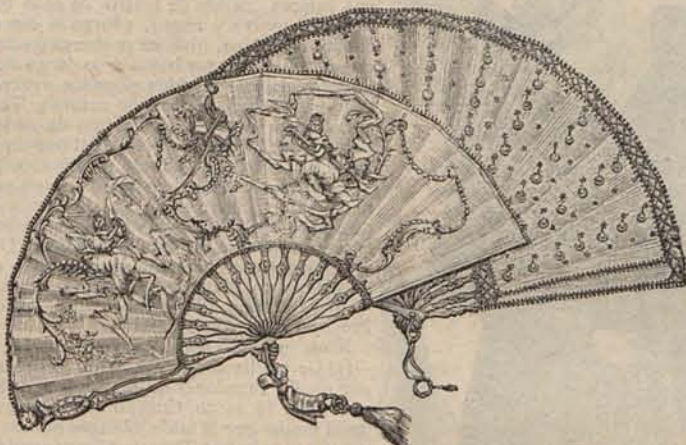
Núm. 16.—Abanicos para teatro o concierto.

El duque de Valencia es entusiasta partidario de ellas, y las ha reanudado en su elegante hotel de la calle de Mendizábal, donde todos los sábados se reúne lo más distinguido de la sociedad cortesana, con la infanta Doña Isabel a la ca-