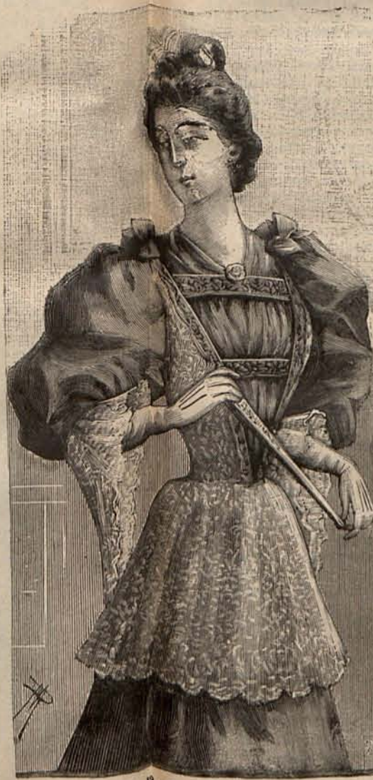
Núm. 12.—Cuerpo para teatro.