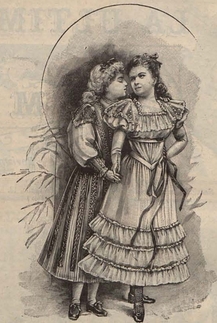
Núm. 2.—Trajes para niñas de 8 á 10 años.

telillo, ni una mísera copa de Jerez ó Madera. Las pastelerías están de pésame; pero no así los pobres, porque las señoras que hacen ayunar á sus invitados, en tregan religiosamente á las asociaciones benéficas el importe de las facturas que de ordinario pagan á los pasteleros.