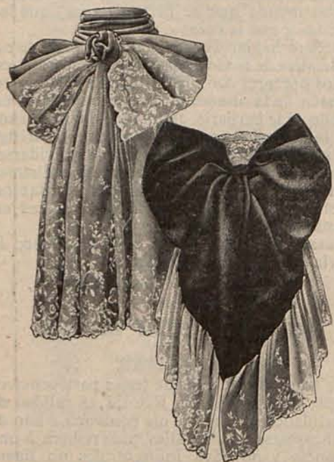
Núm. 8.—Corbatas novedad.

Las cofias de mañana que ahora están de moda, son tan graciosas como fáciles de confeccionar. Se componen de un fondo de surah liso ó bordado, del color predilecto, abullonado sólo en los contornos, de manera que resulte en el centro una especie de copa hueca. En torno del abullonado se dispone uno, dos ó tres volantes de encaje, completando el adorno de la cofia con dos lazos gemelos de ancha cinta de moaré del color del fondo.