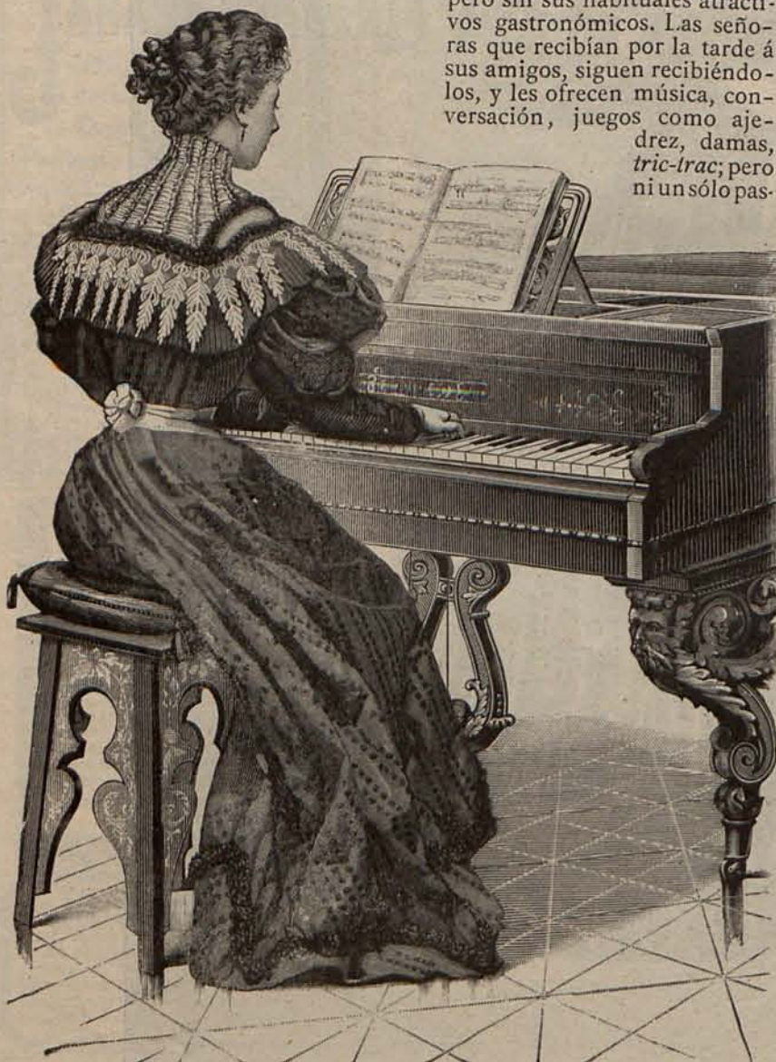
Núm. 3.—Traje para recibir.

Verán mis queridas lectoras las mortificaciones que se han impuesto. Como los five o'clock no se comprenden sin intermedios de pastas, té, licores y vinos generosos, han decidido que estas reuniones se celebren, pero sin sus habituales atractivos gastronómicos. Las señoras que recibían por la tarde á sus amigos, siguen recibiendo-los, y les ofrecen música, conversación, juegos como ajedrez, damas, tric-trac; pero ni un sólo pas-