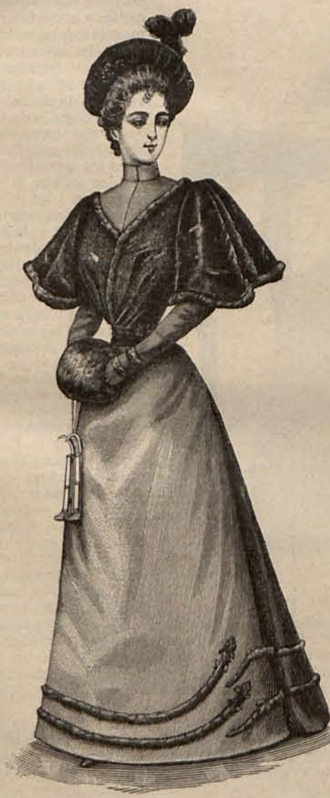
Núm. 13.—Traje para palmar.

en amoniaco y el ácido clorídrico las vuelve encarnadas. No sé si las lectoras participarán de mi opinión; pero después de leer esto, sólo se me ocurriría una idea: comprar un ramo de violetas y prendérmelas sobre el pecho, sin tratar de enmendar la obra de la Naturaleza.