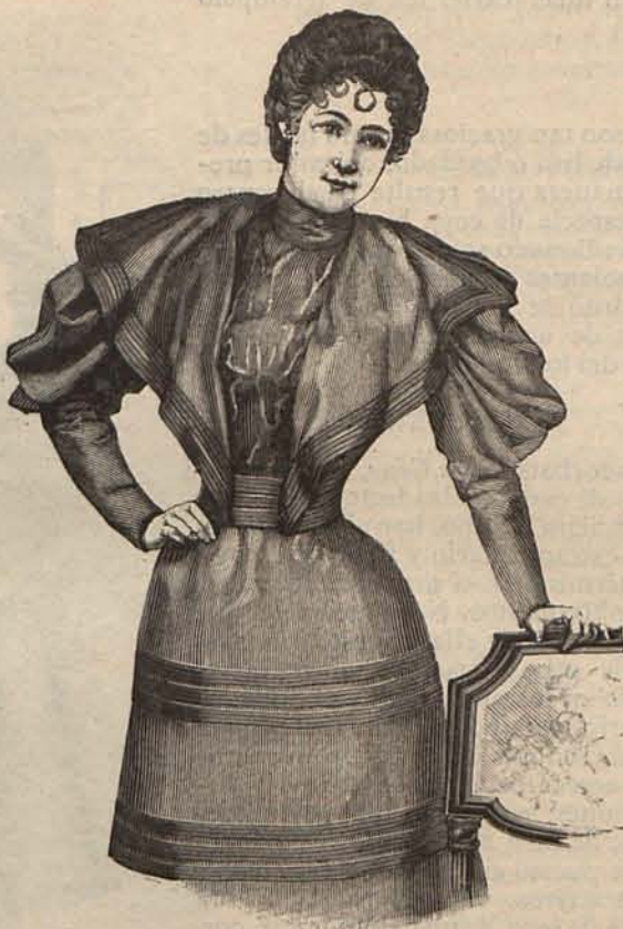
Núm. 5.—Delantero del traje de mañana núm. 4.

Este tema es demasiado importante y trascendental para ser tratado á la ligera, y me limito á referir, en mi calidad de cronista, que varias damas de las que más figuran, están poniendo en práctica el vegetarianismo para convidar á sus amigos á comer de vigilia á la usanza de los antiguos ascetas. Por su puesto hasta cierto punto; porque si bien es verdad que el pescado no aparece en las mesas, sirven á sus comensales las más raras y sabrosas legumbres, las fru-