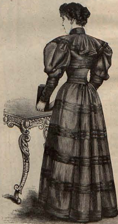
Núm. 4.—Traje de mañana. (Espalda).

No por eso deja de desempeñar con acierto y dignidad su papel de princesa heredera. Hace un verdadero sacrificio al abandonar su habitual retiro, porque padece desde hace años una enfermedad nerviosa, y además la desgracia que llora la estimula á refugiarse en la soledad, en el seno de su familia. Pero como la reina Victoria, su madre política, tanto por su avanzada edad como por sus aficiones, pasa la mayor parte del año ausente de su