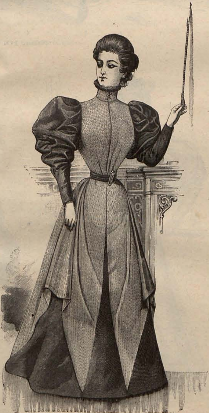
Núm. 16.—Traje para visita.

la índole de los que me ocupan. El primer modelo está confeccionado con lana y terciopelo color reseda de un mismo tono. Falda campana de terciopelo, sobre la que se coloca una segunda falda de lana de corte sumamente original, que deja al descubierto el delantero, uno de los costados y el bajo de la primera falda. Cuerpo corto, de terciopelo, cerrado de un modo invisible. De los hombros donde están montadas formando una cabecita rizada, parten dos largas draperías de lana reseda, forradas de seda nácar, draperías que se cruzan sobre el pecho y se anudan en el centro de detrás de la cintura formando un lazo Robespierre prendido con una hebilla de acero cincelado. Mangas abullonadas de terciopelo, con hombreras flotantes de lana, forradas de igual modo que las draperías del cuerpo. El modelo segundo es un traje Princesa de moaré coloreado. Los costados de la falda aparecen acentuados por quillas plegadas en escalerilla, de terciopelo mordorado, forradas de raso blanco. La parte de forro que queda visible, está salpicada de menudos azabaches. Dos grandes solapas de terciopelo, plegadas y forradas de igual modo que las quillas, adornan los delanteros del cuerpo, y quedan veladas por una corbata Sans Gêne de gasa de seda y encaje blanco. Las mangas son de moaré, muy anchas en la parte superior y ceñidas al brazo desde las san-