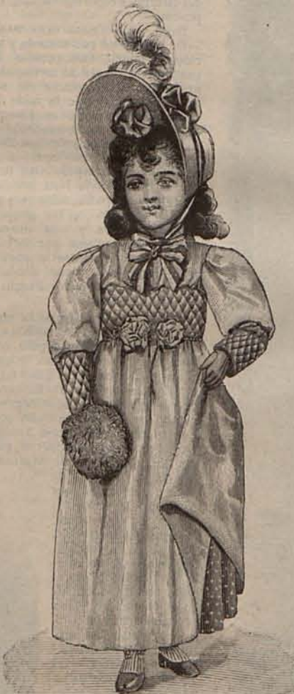
Núm. 15.—Traje para niña de 3 a 5 años