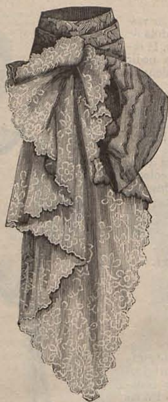
Núm. 9.—Adorno sobrepuesto para traje de soirée ó teatro.

Como quiera que no pocas señoras se han dirigido á la Secretaria deseando in-