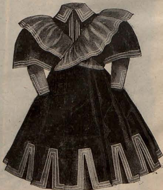
Núm. 6.—Traje para niña de 3 á 5 años.