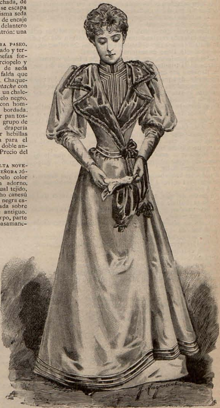
Núm. 13.—Traje para recibir.

zos de faya violeta y un alto esprit de oro. Tela necesaria para el traje, 15 metros de faya. Precio del patrón: 3 pesetas.—(3) TRAJE PARA SEÑORITA.—De lana mil rayas. Falda campana. Cuerpo sin costuras ajustado con un estrecho corslete de terciopelo mordorado. Sobre este cuerpo se coloca una chaquetilla Figaro de lana, con solapas Robespierre de terciopelo. Mangas de terciopelo con triples hombreras fruncidas de lana. Toca de surah mordorado adornada con plumas. Tela necesaria para el traje, 11 metros de lana, doble ancho, y 3 de terciopelo. Precio del patrón: 3 pesetas.—(4) TRAJE PARA SEÑORITA.—Es de crepón de lana color hueso. La falda está guarnecida con un ancho volante de encaje blanco prendido á intervalos con cuatro cocas de raso color hueso. Cuerpo blusa velado por un doble plastrón de encaje montado en un cuello recto de terciopelo heliotrop tornasolado. Ancho cinturón de lo mismo, ceñido en el centro con una bonita hebillas. Mangas huecas, con hombreras de encaje formando rizadas crestas. Tela necesaria para el traje, 10 metros de crepón de lana, doble ancho. Precio del patrón: 3 pesetas.