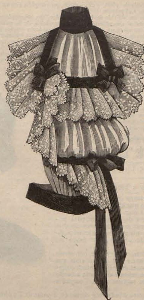
Núm. 12.—Adorno sobrepuesto para traje de soirée ó teatro.

Núm. 11.—TRAJES ALTA NOVEDAD.—(1) TRAJE PARA SEÑORA JÓVEN.—Falda de terciopelo color hoja seca, sin ningún adorno. Cuerpo drapado, de igual tejido, montado sobre un ancho canesú de pasamanería de seda negra escotado en forma cuadrada sobre una camiseta de encaje antiguo. De las draperías del cuerpo, parte una lluvia de flecos de pasamanería negra perlada de acero, que oculta por completo la parte superior de la aldetas. Mangas de terciopelo, de hechura perñil . Sombrero de terciopelo sencillamente adornado con un doble lazo de lo mismo. Tela necesaria para el traje, 14 metros de terciopelo. Precio del patrón: 3 pesetas.—(2) TRAJE PARA SEÑORA DE MEDIANA EDAD.—De faya violeta. Tres anchos galones de pasamanería de seda negra separados entre sí por espacios de 5 centímetros rayan el bajo de la falda. Cuerpo corto, con cinturón y berta acanalada, mitad de terciopelo labrado y mitad de pasamanería. Cuello recto de pasamanería. Mangas forma perñil. Capota cónica de pasamanería, adornada con dos la-