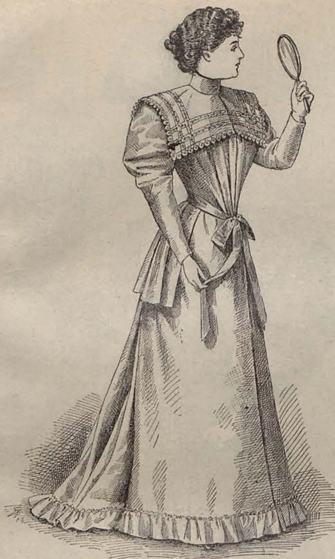
Núm. 6.—Deshabille de franela rosa.

distas y modistos, es necesaria. Los que en ella adquieren notoriedad, inventan las modas, es cierto; pero ¿quién las sanciona? Todos los años al comenzar la Primavera y el Otoño aparecen las nuevas creaciones. ¿Y qué sucede? Que prosperan las que las señoras elegantes aceptan, las que verdaderamente merecen la predilección femenil, y las otras desaparecen y se olvidan.