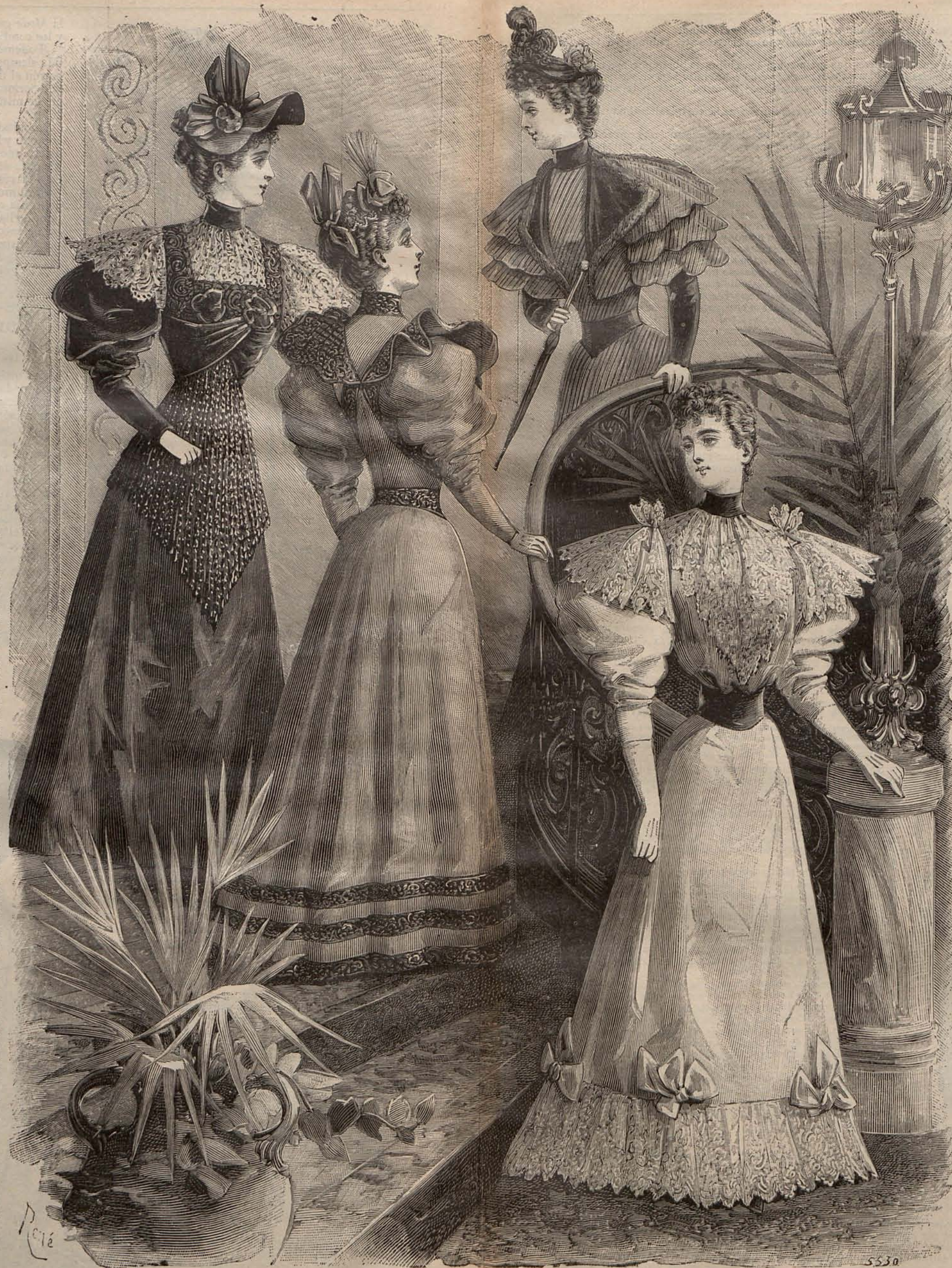
Núm.—11. TOILETTES ALTA NOVEDAD

Núm. 5.—TRAJE PARA NIÑA DE 3 Á 5 AÑOS.—Faldita de terciopelo