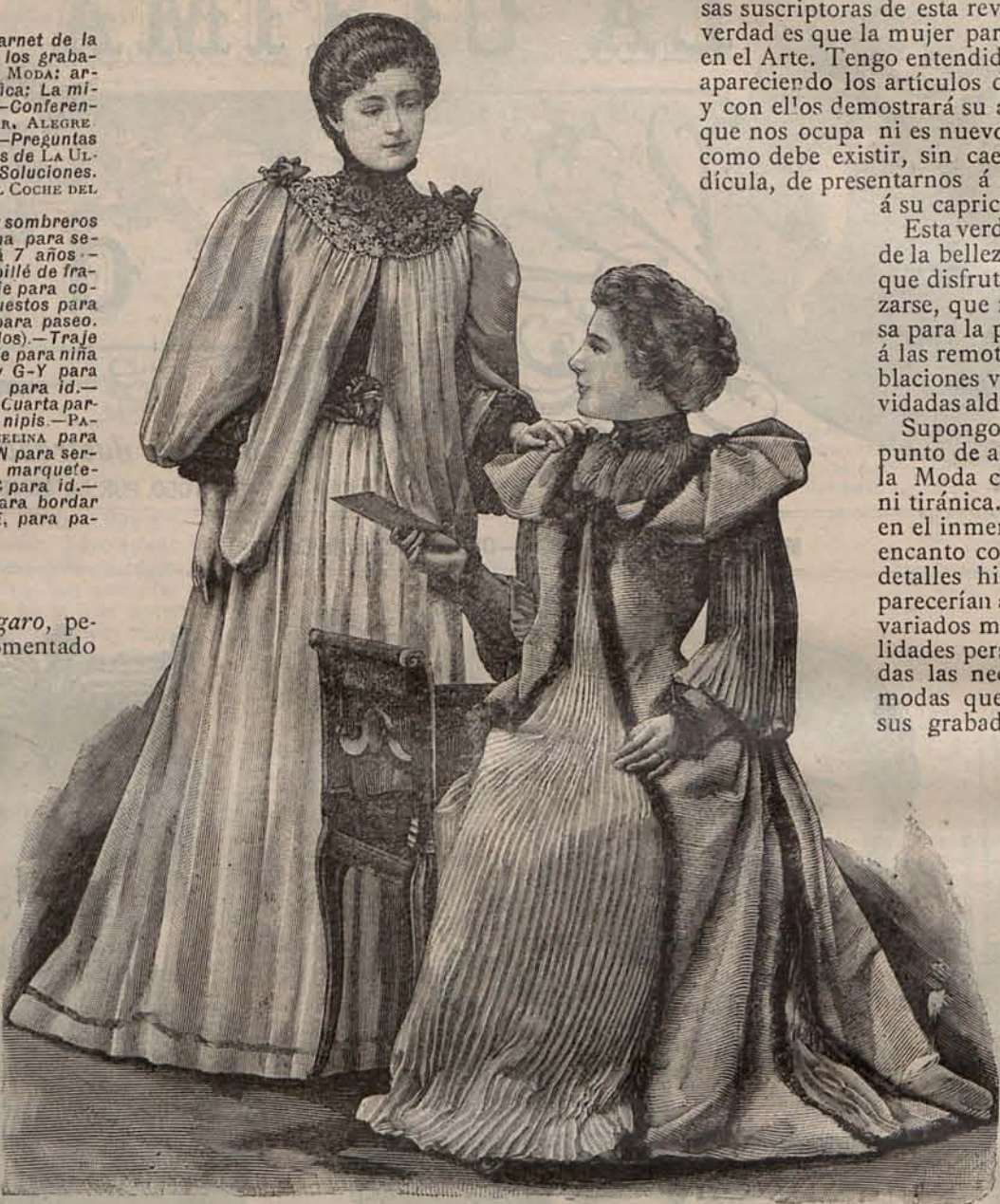
Núm. 2.—Batas de mañana para señoras jóvenes.

La baronesa Staffe se subleva contra las modistas y modistos, que según dice, imponen las Modas para enriquecerse. ¿Qué pensaríamos de un caballero particular que se indignase contra los pintores que ilustran los Museos con sus creaciones, y los arquitectos que enriquecen las ciudades con los edificios que idean, y pretendiera pintarse él los cuadros para adornar su sala y se construyese la casa destinada á hospedarle, todo esto sin ser pintor, ni arquitecto de profesión? Pues de seguro pensaríamos que era un excéntrico; y no ya solo por infringir las reglas del arte, sino por no amoldarse á las Ordenanzas, á las grandes lí-