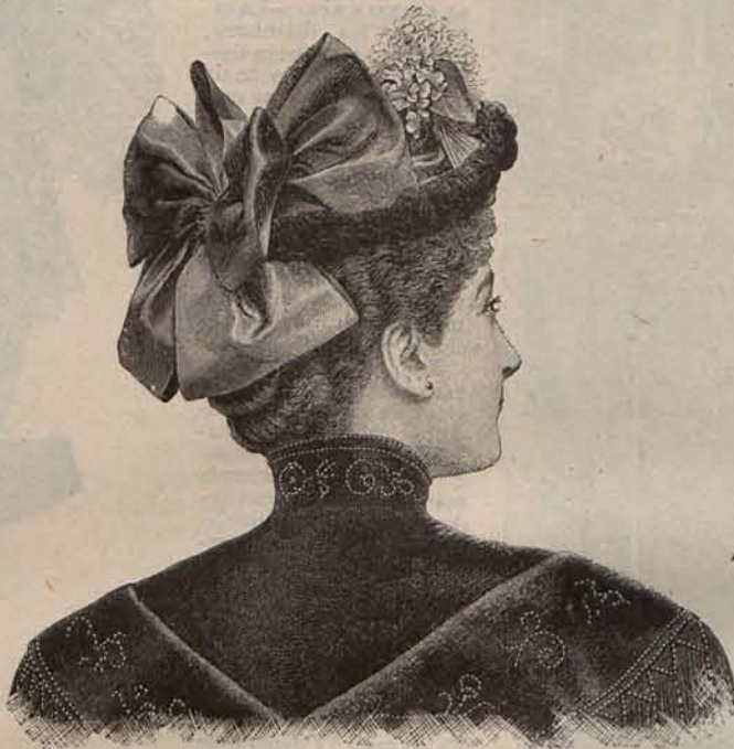
Núm. 14.—Sombrero (Eulalia.)