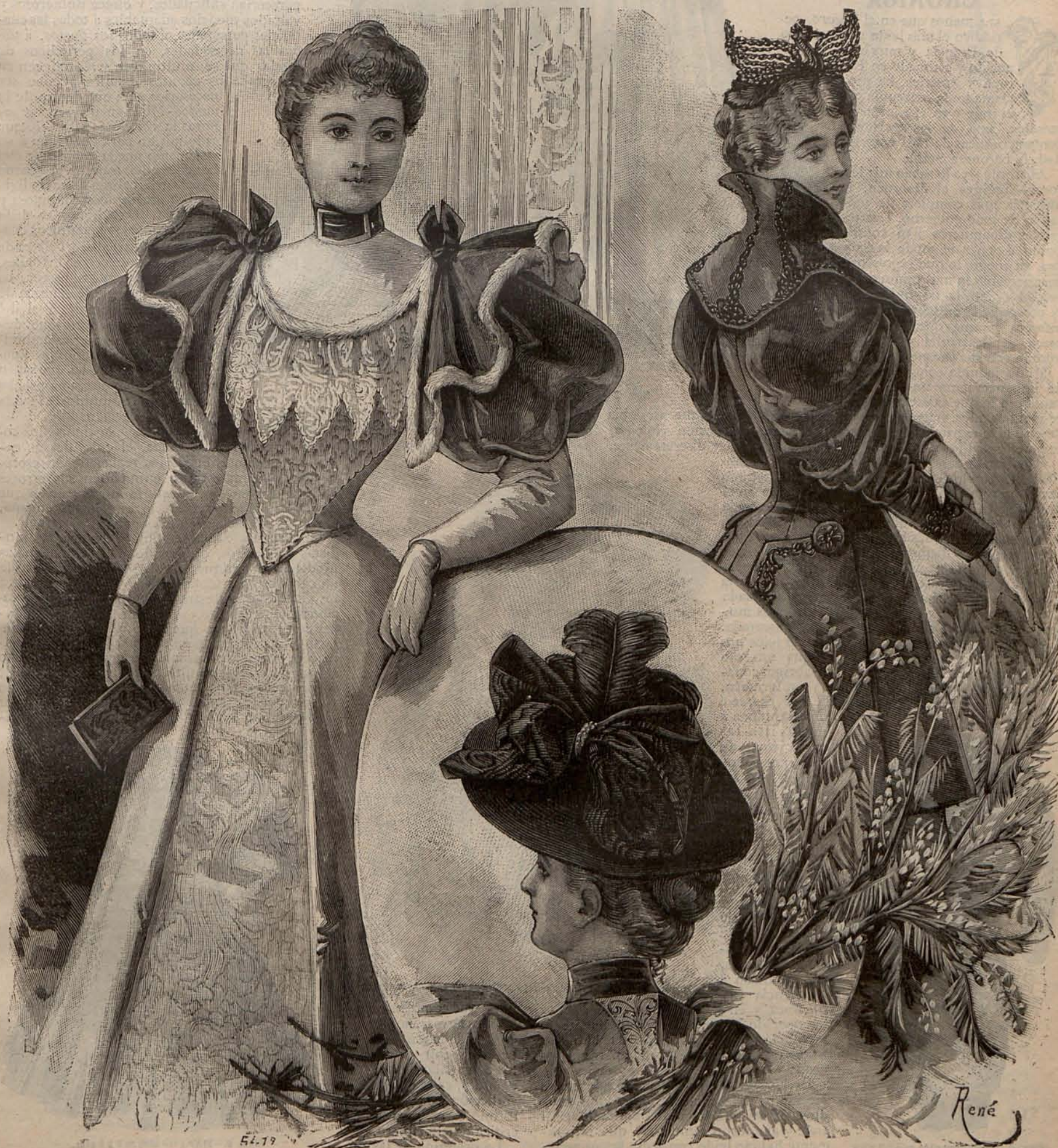
Núm. 1.—Traje para soirée y sombreros y chaqueta para visita.