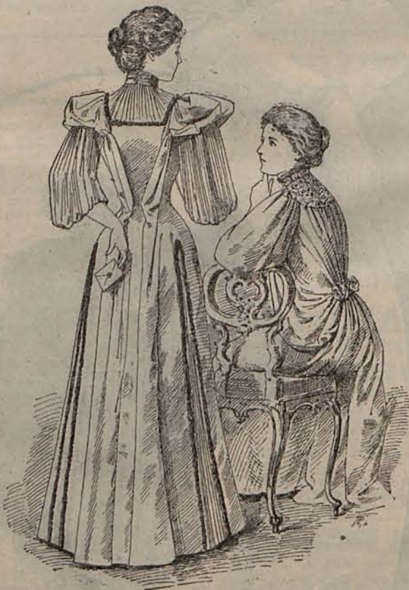
Núm. 3.—Espalda de los modelos representados por el grabado núm. 2.