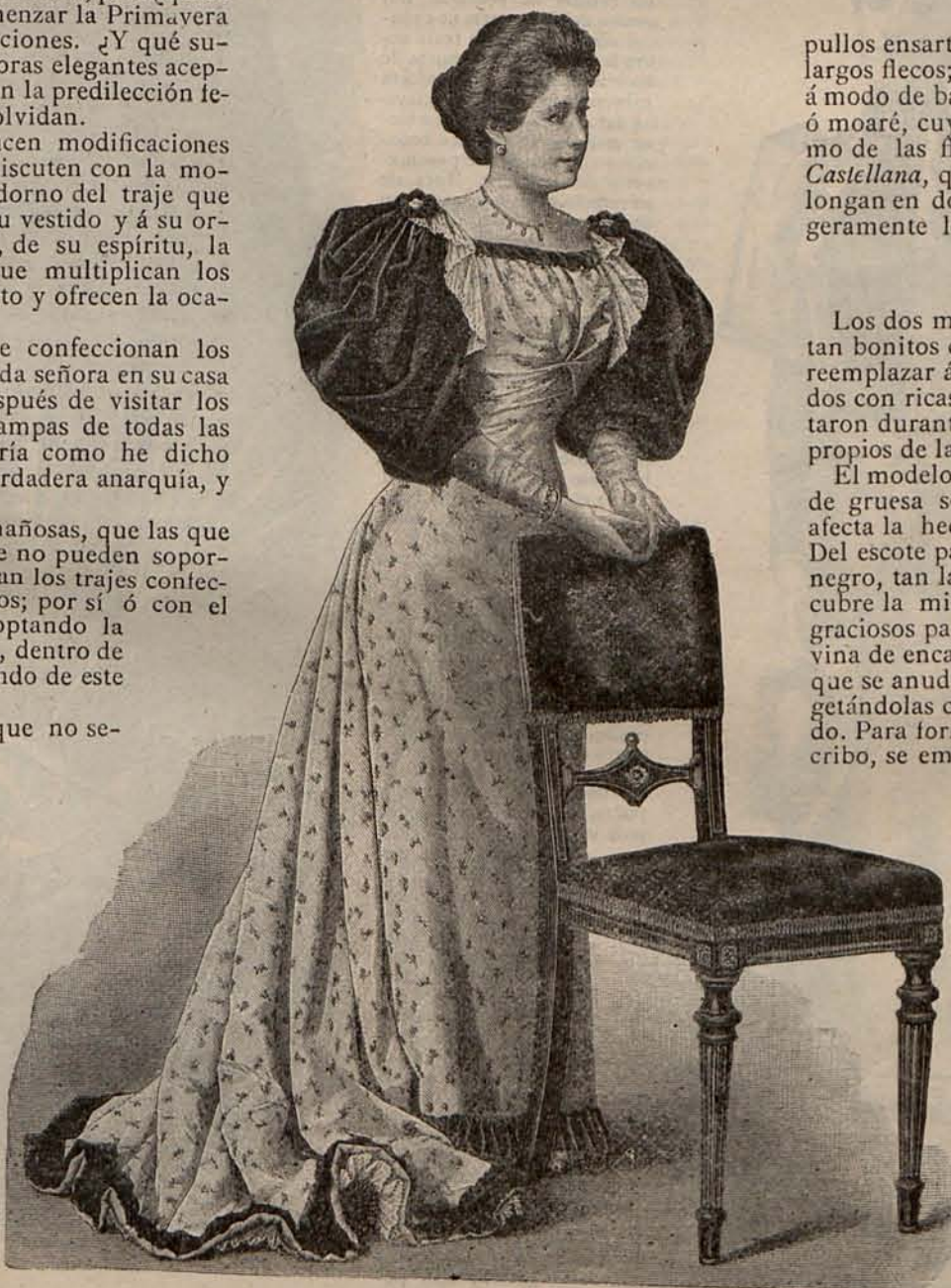
Núm. 8.—Traje para comida de ceremonia.

Los trajes, sombreros y abrigos de luto, no por constituir la más triste y sombría de las toilettes, dejan de experimentar la influencia de la Moda; razón que me obliga á dedicarles algunas líneas, desean-