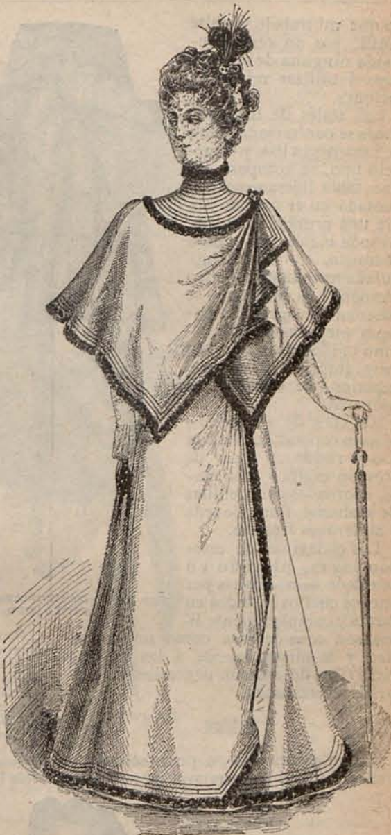
Núm. 7.—Sobretodo para calle.

En los cuerpos se ven corseletes de flores de azahar; bertas, hombreras y aldetas, de ca-