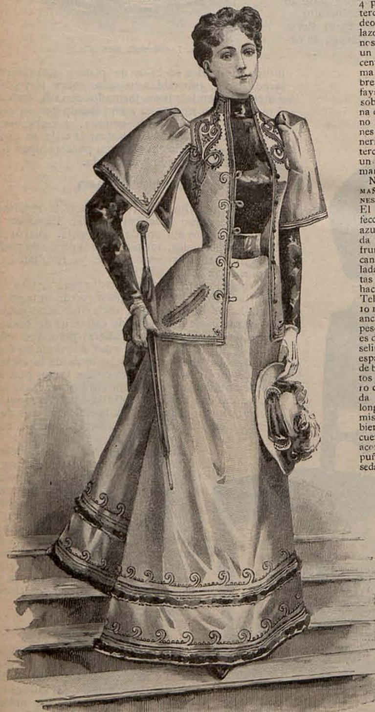
Núm. 10.—Traje para paseo.

formarse de la aplicación que se dará al fulard en el próximo Verano, voy á tratar de satisfacer en lo posible su justificada impaciencia, adelantando cuantas noticias circulan acerca del particular, sin perjuicio de ampliarlas y modificarlas á su debido tiempo. El fulard se usará muchísimo: de éste no hay la menor duda, y parece ser que gozarán de marcada preferencia los trajes de combinación, confeccionados con fulard liso y fulard moteado, floreado ó jaspeado, el primero del mismo tono que el fondo del segundo. En cuanto á los colores que han de dominar en éste tejido, que con tantas partidarias cuenta entre nosotras, se dice que figurarán en primer término los tonos verde gris, azul porcelana, violeta rojizo, beige azulado y lila rosado.