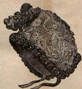
Núm. 16.—Gorrito para niño de 6 meses á 1 año.