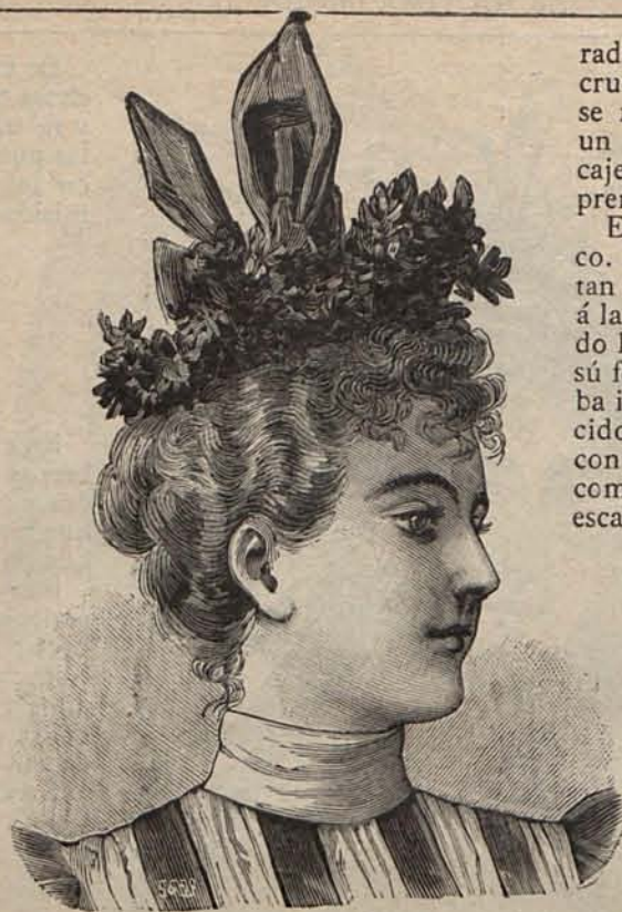
Núm. 11.—Sombrero Graziella.