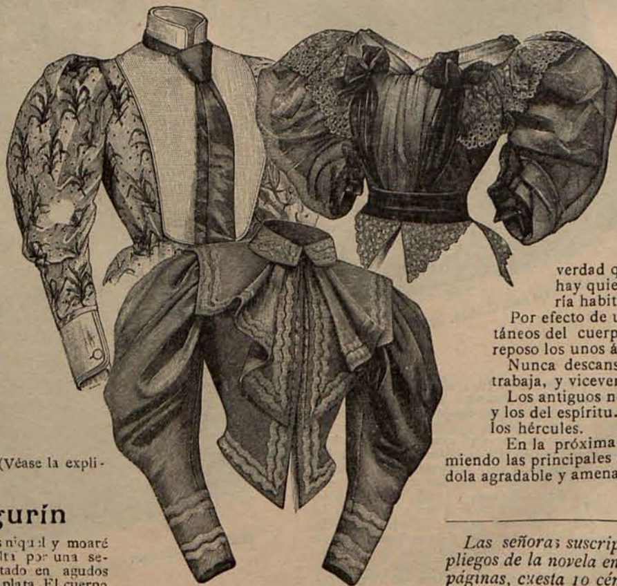
Núm. 24.—Blusas novedad.

una camiseta de crespón de seda lila, a la que sirven de marco dos grandes solapas de moaré. Mangas de pernil. El cuello, la camiseta, la aldetita y las bocamangas, están guarnecidas con cenefas de pasamanería de plata. Capota de paja gris, adornada con grupos de lilas. Tela necesaria para el traje, 8 metros de lanilla, doble ancho, 6 de moaré y 1 de crespón. Precio del patrón: 3 pesetas.—Modelo 2.º—De lana labrada y terciopelo de dos tonos color Suecia. Doble falda de forma campana, y cuerpo corto de lana, ajustado por un cinturón de terciopelo cerrado con una hebilla de oro y velado por una esclavina de encaje montada en un cuello-esclavina de terciopelo. Una corbata de encaje cierra el escote. Mangas de terciopelo. Sombrero de paja color Suecia, adornado con florecitas azules. Tela necesaria para el traje, 10 metros de lana y 5 de terciopelo. Precio del patrón: 3 pesetas.