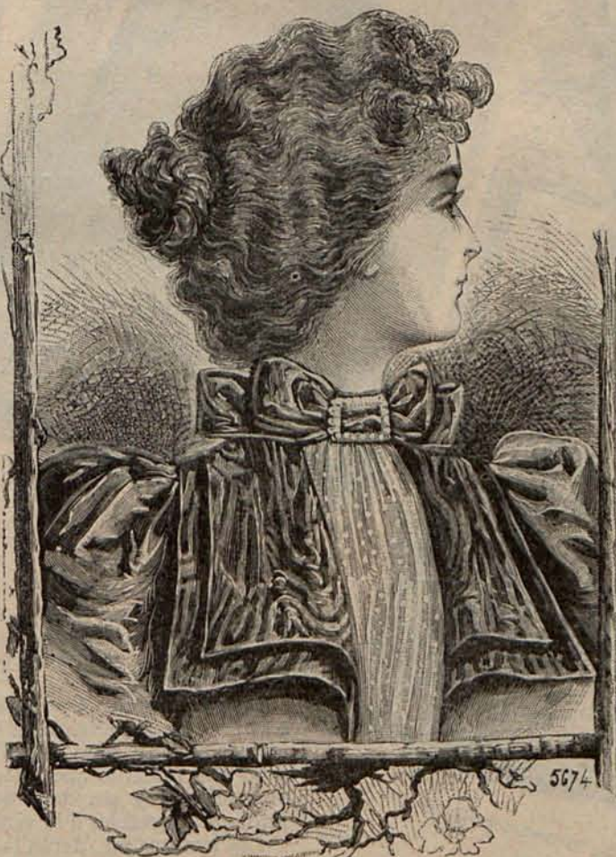
Núm. 9.—Peinado para calle y paseo

Otra señora ostentaba un traje de fulard, cuadrado de tonos verde agua y violeta. Falda muy ceñida en las caderas, ensanchada en el bajo por medio de un amplio volante del mismo fulard, con cabeza de cinta de moaré negro. Este volante tenía en el bajo tres en-