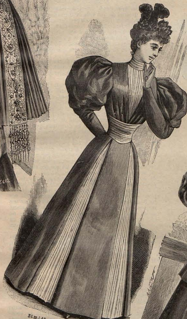
Núm. 18.—Traje para visita.