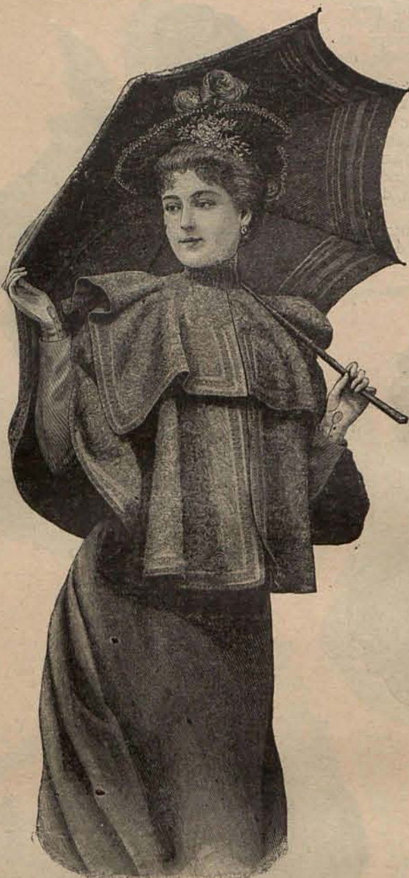
Núm. 23.—Esclavina bordada.

TRAJES PARA PASEO.—Modelo 1.º—De lanilla gris níquel y moaré verde prado. Primera falda de moaré semi oculta por una segunda falda de lanilla, cuyo bajo aparece cortado en agudos picos acentuados por cenefas de pasamanería de plata. El cuerpo es corto, con aldetita ondulada y se abre acentuadamente sobre