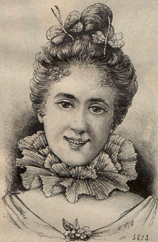
Núm. 7.—Peinado para comida.