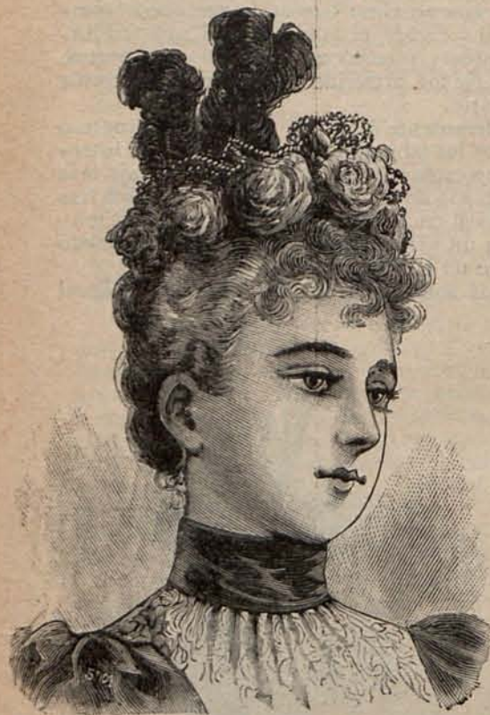
Núm. 10.—Sombrero Isabel.

Hace bien nuestra graciosa soberana en ex-