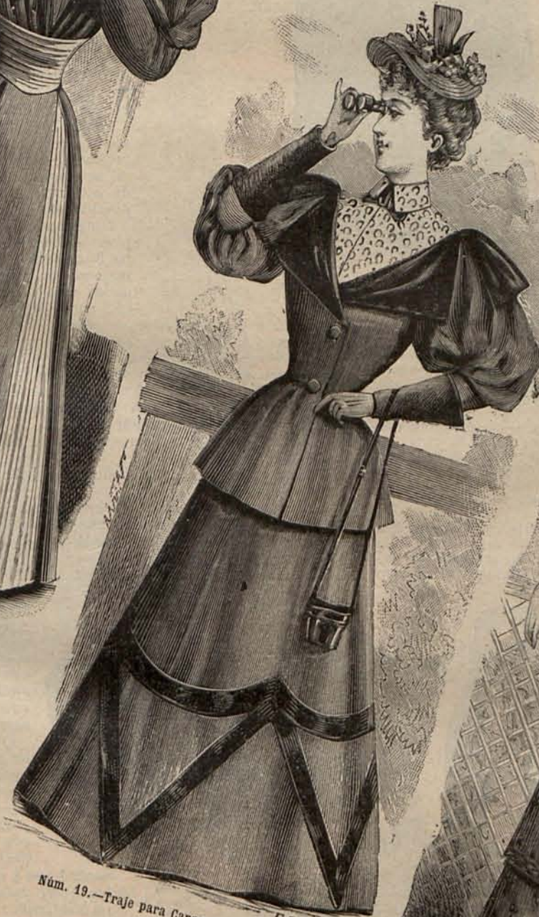
Núm. 19.—Traje para Carreras de caballos.