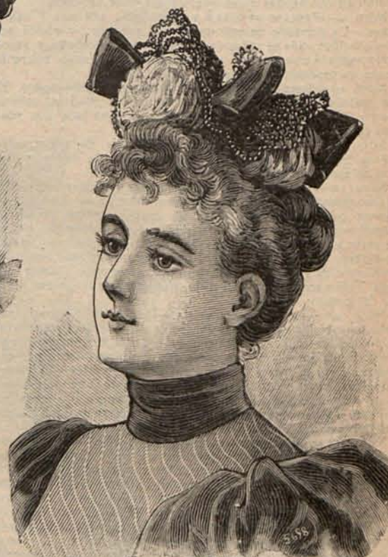
Núm. 22.—Sombrero MIRELLA.