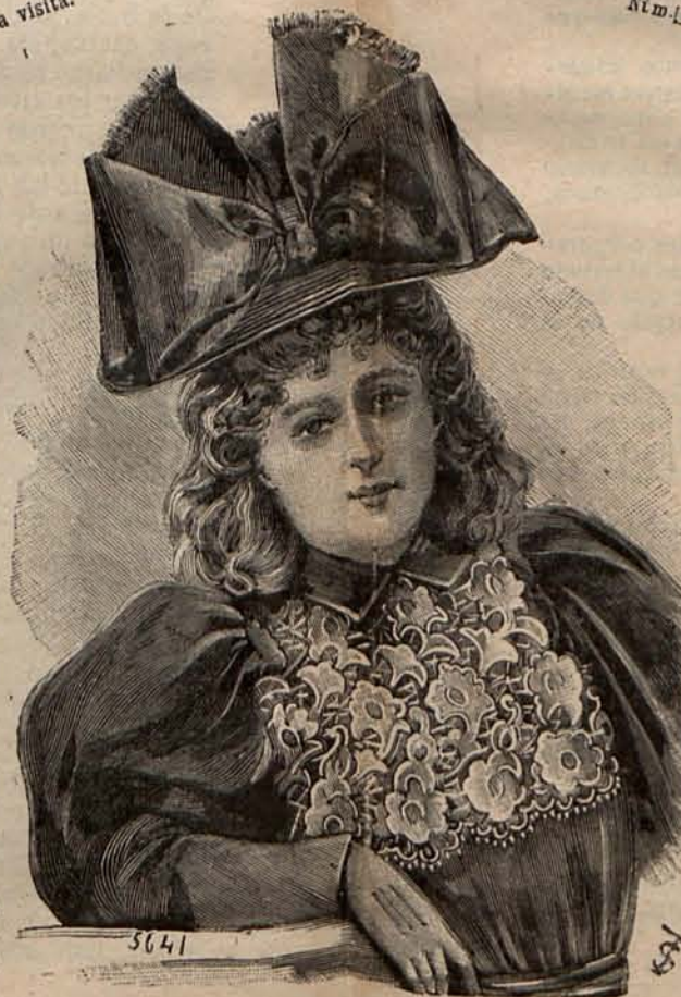
Núm. 17.—Sombrero para niña de 6 á 10 años.