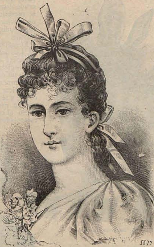
Núm. 6.—Peinado de soiree para señorita

También se han visto y admirado los vaporosos trajes que se confeccionan con un nuevo tejido, espu-