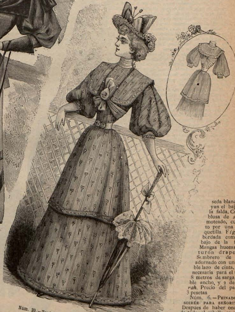
Núm. 20.—Traje para calle (Delantero y espalda).

Núm. 5.—TRAJE PARA CALLE.—De sarga color pan tostado. Dos cenefas bordadas con soutache del