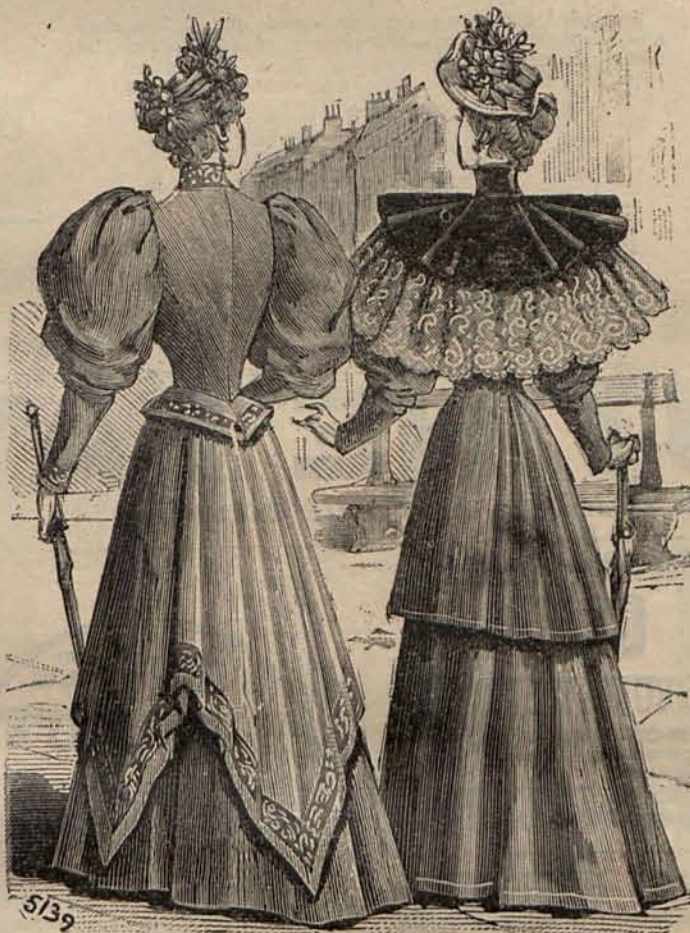
Núm. 25 — Reverso del Figurín acuarela.