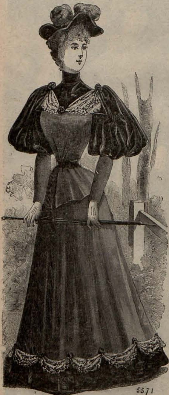
Núm. 3.—Traje para paseo.