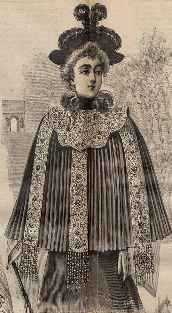
Núm. 15.—Esclavina alta novedad.

El segundo modelo es de nansú blanco. Los delanteros y la espalda se montan sobre un canesú cuadrado bordado á la inglesa con seda malva, disimulando la unión con un escarolado de nansú festoneado en los contornos. Olvidaba indicar que los delanteros son fruncidos, y se ajustan á la altura del talle con un medio cinturón ruso, bordado como el canesú. Mangas perdidas, con escarolados en torno de las bocamangas.