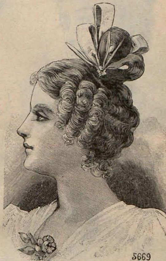
Núm. 8.—Peinado de soiree para señora joven.

En clase de sombreros de paja gozarán de igual