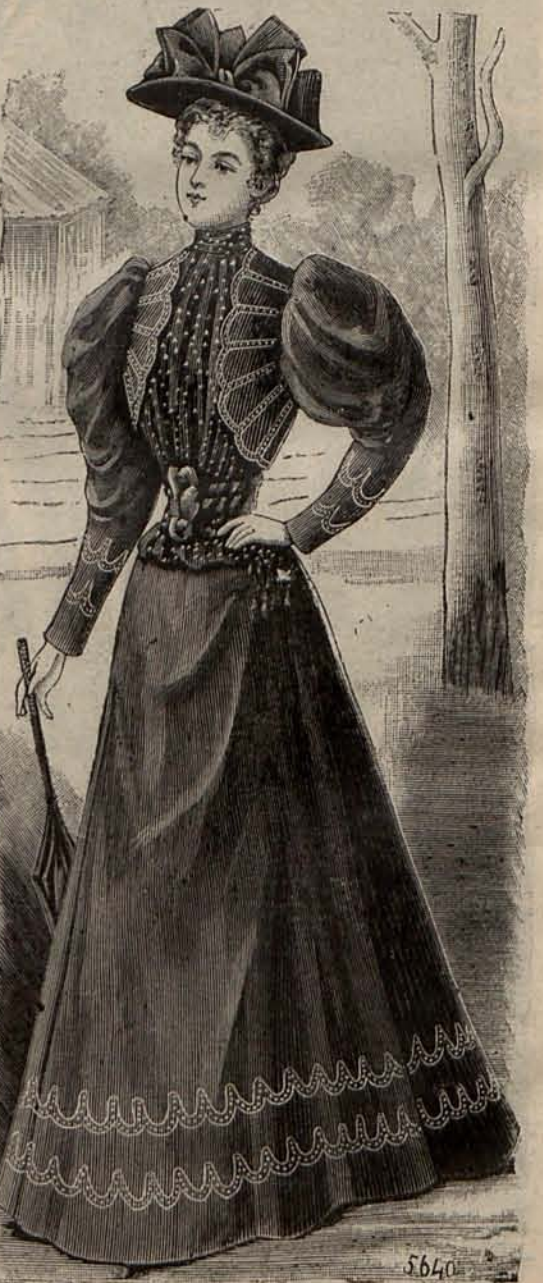
Núm. 5.—Traje para calle.

La baratura es su sistema, y la lucha parece que debía serles favorable en una época como la actual, en la que la economía se impone; pero el arte y la industria parisienses, que sin temor á la competencia sino dormían, dormitaban á la sombra de sus pasados triun-