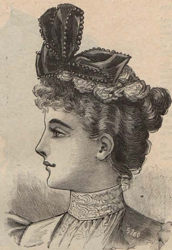
Núm. 21.—Sombrero ANGELITA.