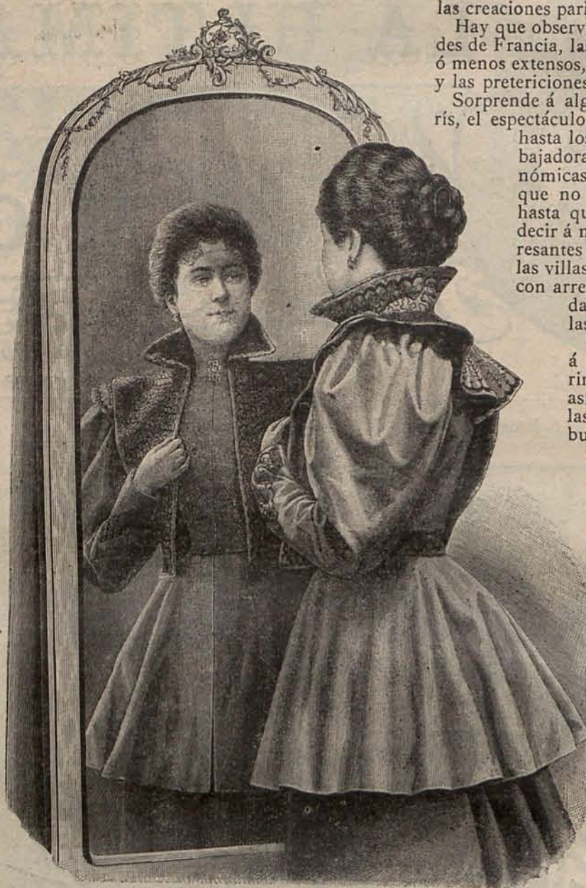
Núm. 2.—Chaqueta OLIMPIA.

en todas sus manifestaciones intelectuales y materiales puede ser idéntica en todos los países. Los pueblos como los individuos, tienen cualidades peculiares, especiales disposiciones, y sobre todo un carácter sui generis. Jamás podrá confundirse un inglés con un francés; la raza latina es marcadamente distinta de la sajona; y poseyendo cada cual virtudes y méritos, estos méritos y estas virtudes son diversas, pudiéndose apreciarlos á la simple vista.