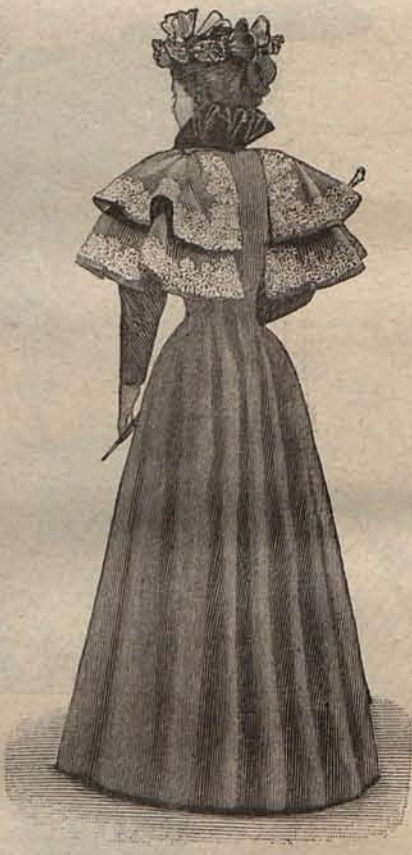
Núm. 5.—Espalda del modelo núm. 2.