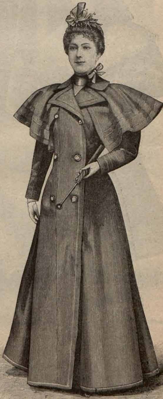
Num. 10.—Cubre-polvo para viaje.