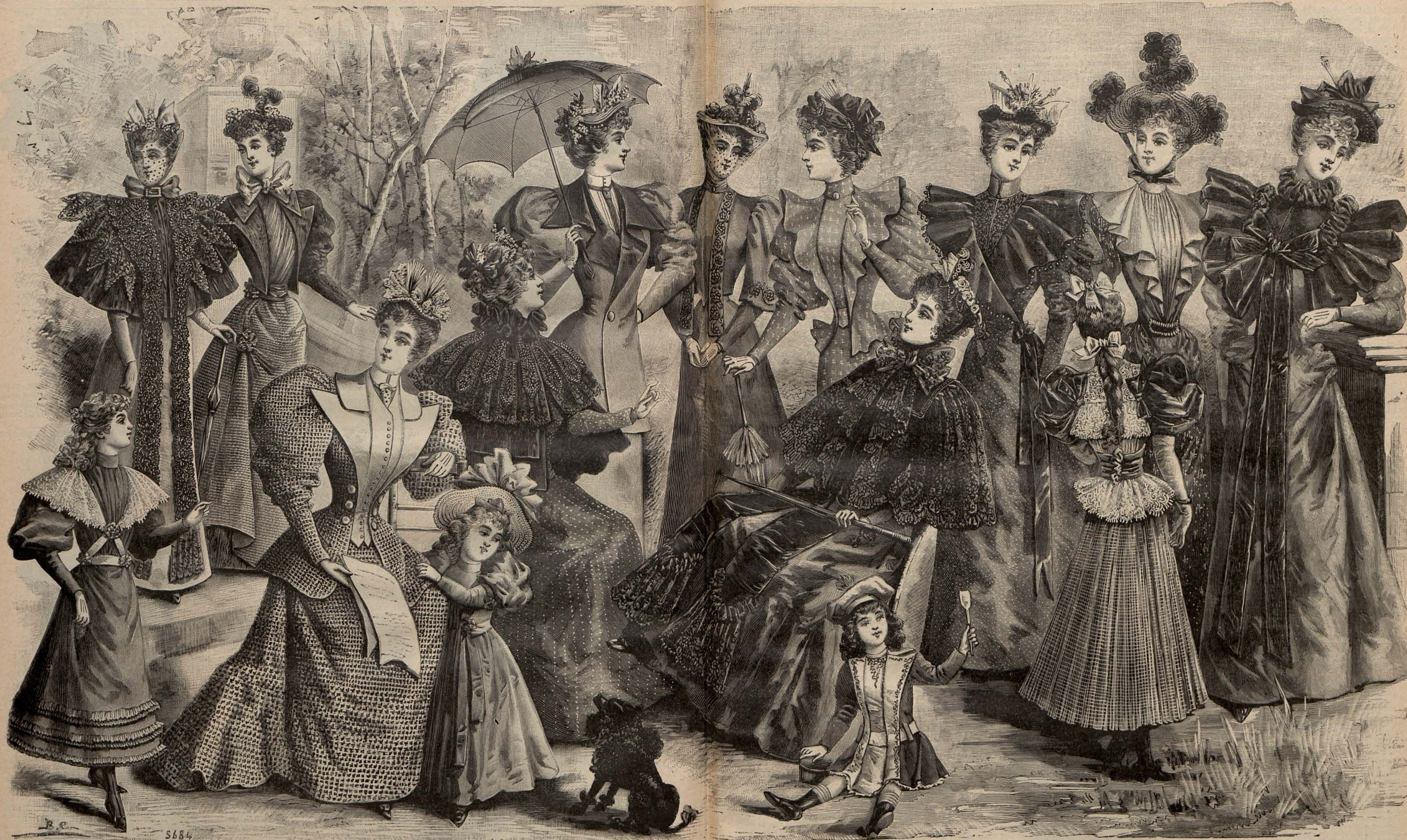
Núm. 11.—PANORAMA DE MODAS DE VERANO PARA SEÑORAS, SEÑORITAS Y NIÑOS

favor de las mamás elegantes, con los trajecitos ingleses compuestos de un pantalón corto y una chaquetita recta colocada sobre una camiseta de punto, una camisa de batista con pechera plegada ó una blusa de surah de un color pálido.