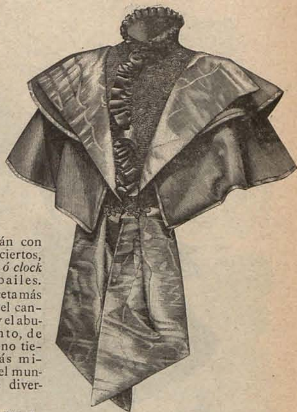
Num. 8.—Esclavina AURELIA.