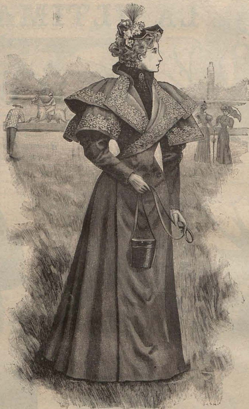
Núm. 2. Cubre-polvo para viaje.

El tiempo es delicioso, París se encuentra en todo el apogeo de la animación, los extranjeros afluyen y dan un interesante carácter cosmopolita á los boulevares, los paseos, los teatros y las fiestas públicas. Los parisienses y sobre todo las parisienses, lucen las últimas preciosas creaciones de la Moda en las