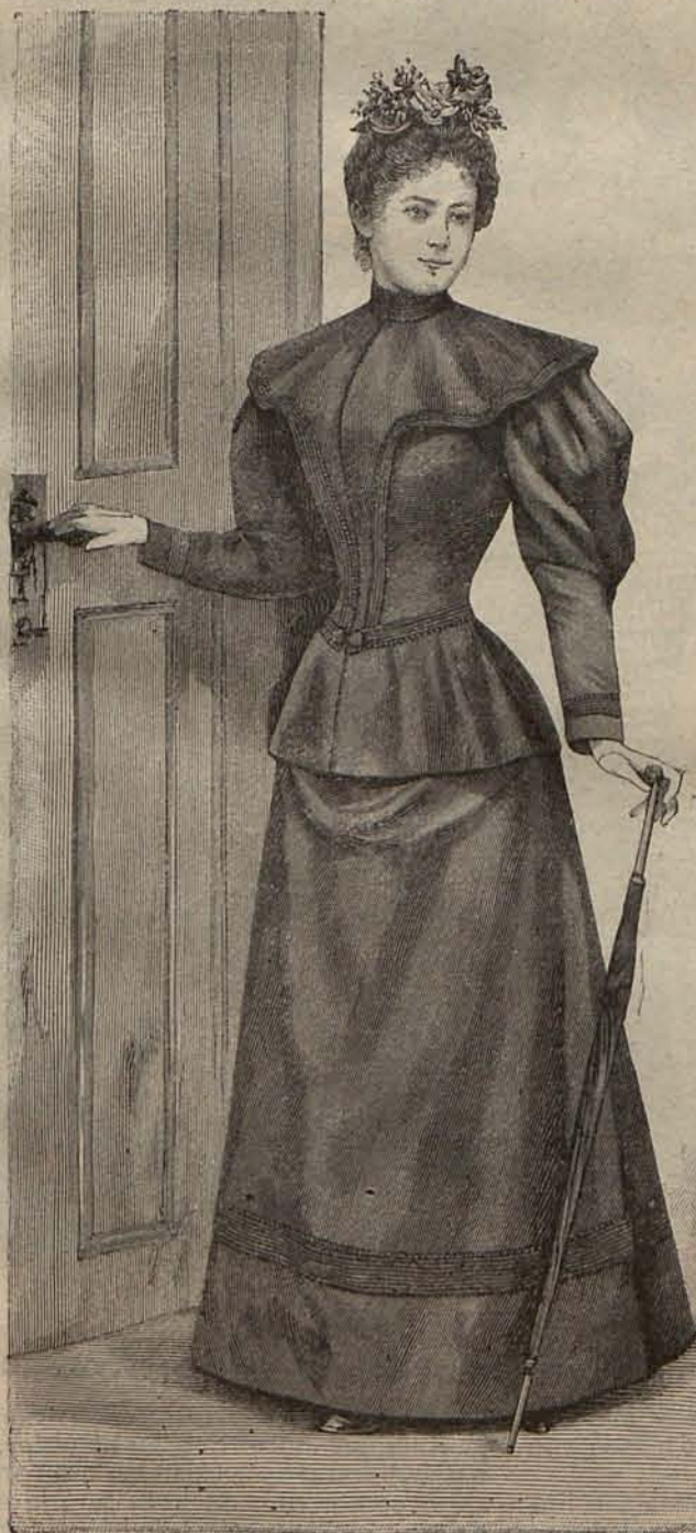
Num. 9.—Traje para viaje.

Pero de todos modos creo, que aunque sólo sea para conocer lo que París practica en el importante detalle de las joyas, no parecerán ociosas á las amables lectoras las breves líneas que les he dedicado.