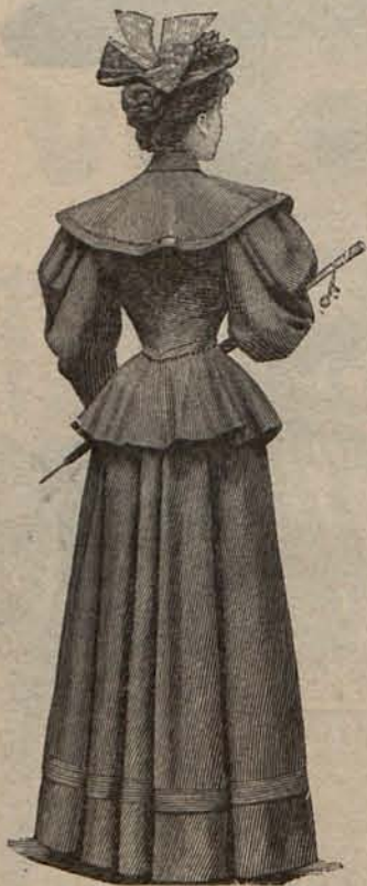
Núm. 3.—Espalda del modelo núm. 7.

nos hallamos en el país de la felicidad.