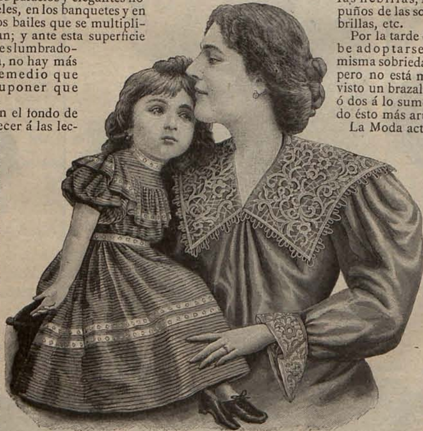
Núm. 4.—Blusa de surah para señora y trajecito para niña de 1 a 3 años.

Para esas brillantes fiestas sociales, pueden y deben las señoras que pueden, adornar su cabeza, sus torneados brazos, sus alabastrinos cuellos y hasta los artísticos cuerpos de sus trajes, con nacaradas perlas, relucientes brillantes, rubíes maravillosos, y toda la magnífica escala en luces, tonos y matices de