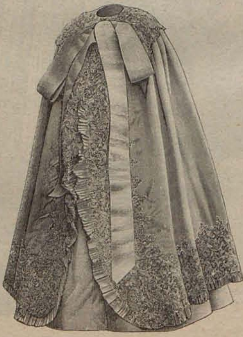
Núm. 13.—Capa para recién nacido.

consiste en un cuello de pasamanería perlada, que se prolonga en dos largas caídas rematadas por volantes de encaje. Capota de encaje de paja beige, adornada con grupos de azuleas y lazos de cinta. Precio del patrón de la esclavina: 2 pesetas.—Modelo 3.º TRAJE DE PASEO PARA SEÑORITA.—De crespón liso y rizado, de tonos madera y reseda. Falda de crespón rizado, recogida en el costado por medio de una escarapela de cinta sobre una primera falda de crespón liso. Chaquetilla de este último tejido, con solapas y cuello vuelto de moaré reseda. Los delanteros de la chaquetilla quedan sueltos sobre una camiseta drapada de crespón marfil. Mangas de pernil. Sombrero de paja mosaico de los colores del traje, adornado con un grupo de plumas. Tela necesaria para el traje, 7 metros de crespón liso, 6 de crespón rizado, uno de moaré y uno de crespón marfil. Precio del patrón: 3 pesetas.—Modelo 4.º TRAJE DE CALLE PARA SEÑORA JÓVEN.—De lanilla juego de damas. Falda de hechura campana. Chaqueta larga y entallada, con pun-