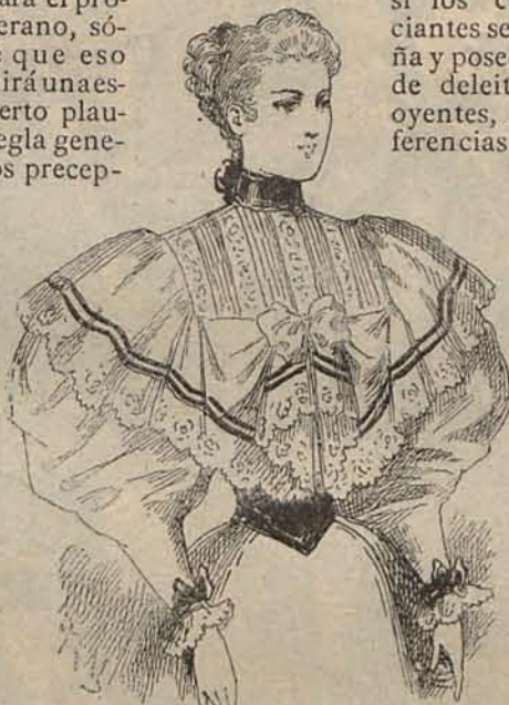
Num. 7.—Blusa para señorita.

Este año se celebran muchos ballets blancs , en los que son protagonistas las niñas que ya han hecho su primera Comunion y no han llegado á los cuatro lustros; también son muy frecuentes los ballets roses dedicados en primer término á las jóvenes, y digo en primer término porque solo ellas bailan, limitándose al papel de espectadoras las que han pasado de la Primavera al Verano ó al Otoño de la vida.