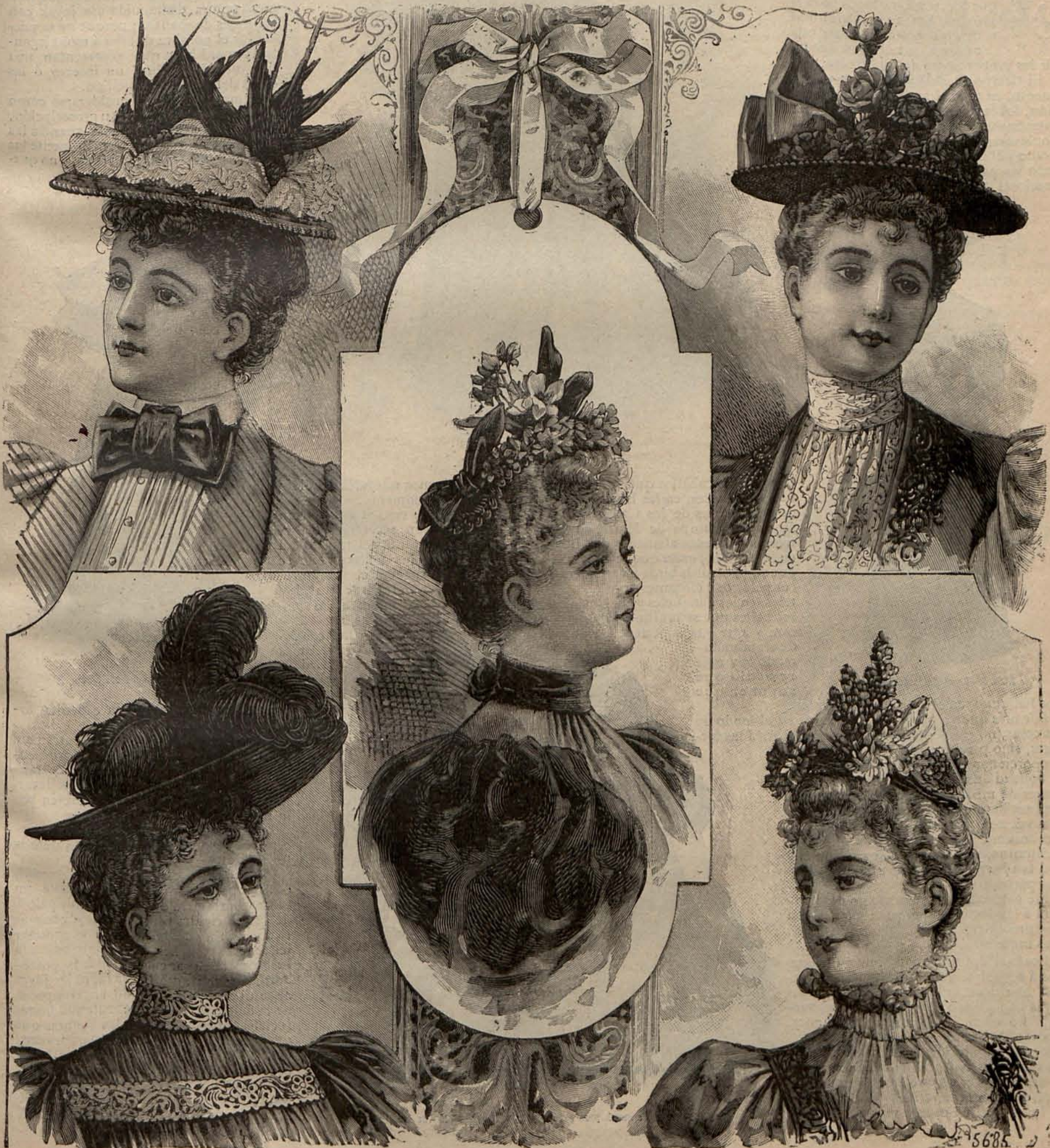
Núm. 1.—Grupo de sombreros alta novedad.