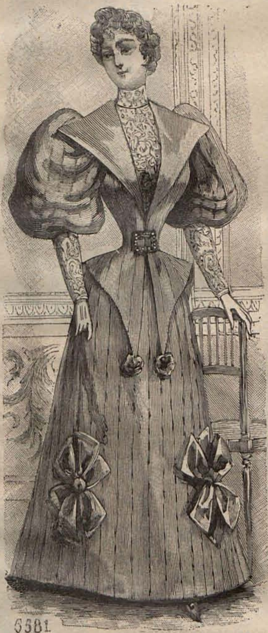
Núm. 6.—Traje para paseo

Los dos modelos de blusas que cito á continuación, deben usarse combinados con faldas de muselina de lana negra. El primer modelo es de surah violeta, con espalda fruncida y delanteros fichú , cruzados sobre un