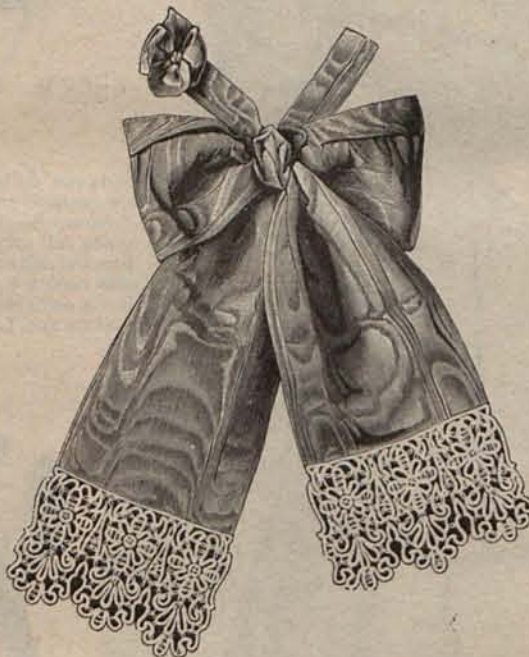
Núm. 20.—Corbata Luis XV.

La plenitud de la fuerza y la armonía completa de las funciones, constituyen la excepción. La regla general es el término medio en la salud como en todo.