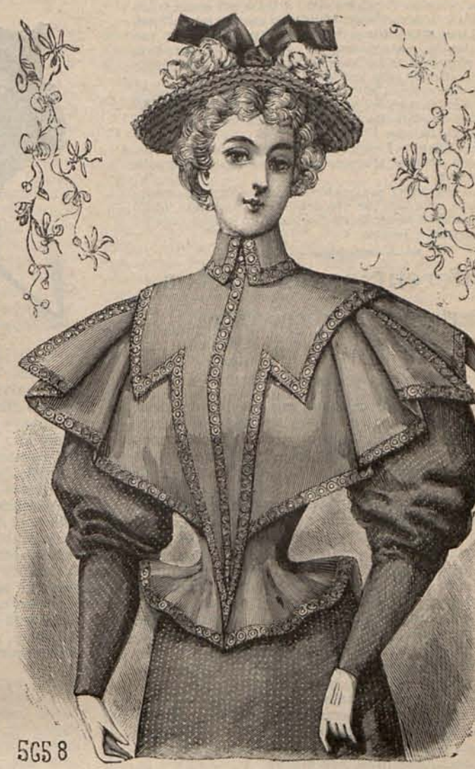
Num. 17.—Chaquetilla AMPARO.

Num. 27.—CHAQUETILLA AMPARO.—Es de lana color guinda, con aldetita ondulada y sin mangas. Del cuello vuelto que rodea el escote, parte una especie de plastrón puntiagudo bajo el cual se monta un volante plegado simulando una esclavina. Galoncitos de pasamanería de plata, acentúan todos los contornos de ésta prenda. Sombrero de paja, adorno