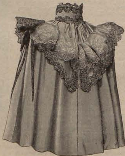
Núm. 21.—Esclavina para señora mayor.