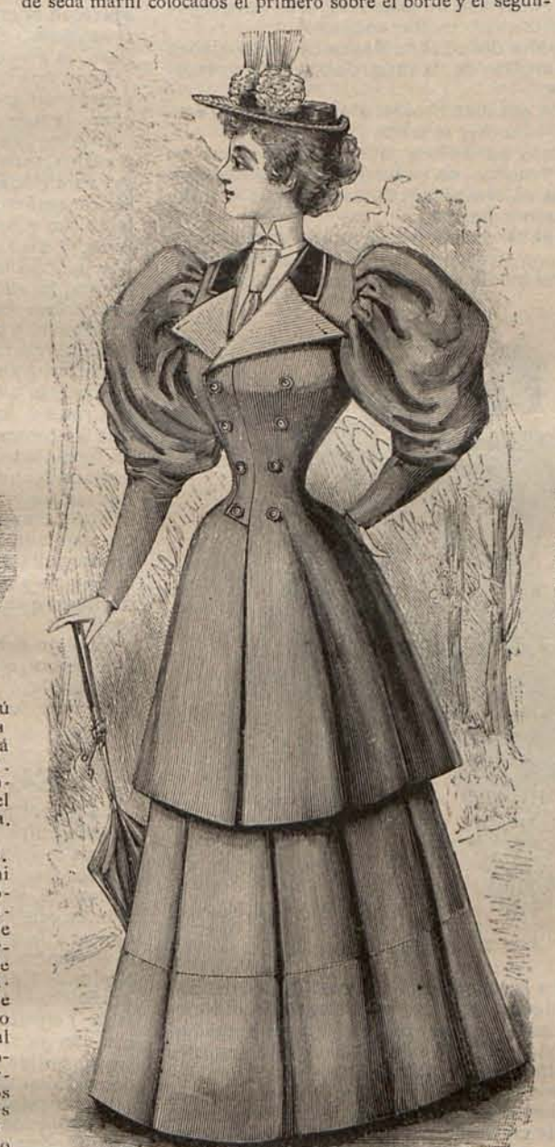
Num. 16.—Traje corte sastré.

Num. 11.—TRAJE PARA PASEO.—De muselina de lana de tonos beige y azul. Falda campana, guarnecida con dos bieses de seda marfil colocados el primero sobre el borde y el segun-