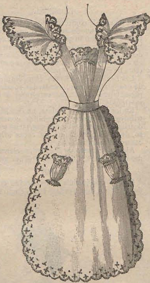
Núm. 7.—Delantal para señorita.

Por mi parte procuro estudiarla siempre que la ocasión se presenta; porque verdaderamente el matrimonio es lo que con razón interesa más y debe interesar á la mujer. Comprendo el éxito que ha alcanzado el nota-