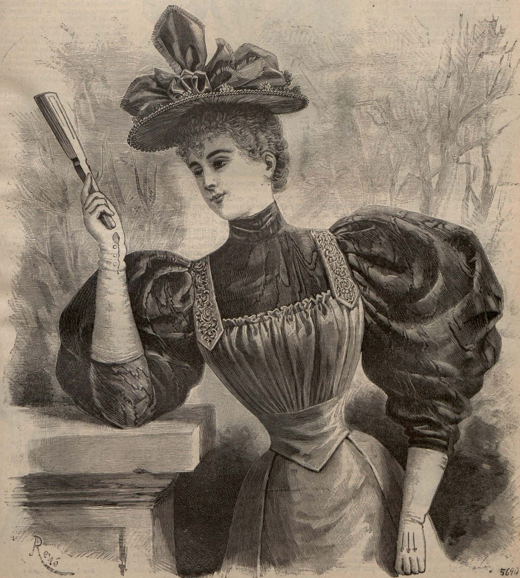
Núm. 1. Traje para paseo.