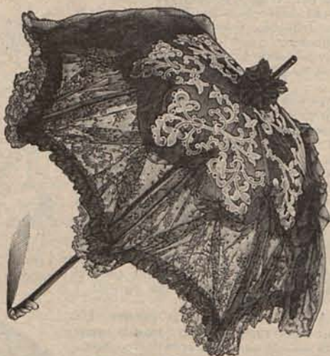
Núm. 19.—Sombrija novedad.

Esto parece una humorada, una utopía; pero en el fondo tiene algo de verdad.