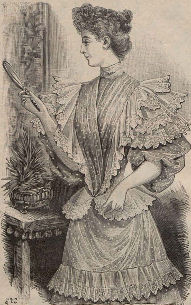
Núm. 2.—Matinée AURORA.

Pero se dice en los altos círculos que todas estas magnificencias quedarán eclipsadas por las que han de admirarse en el