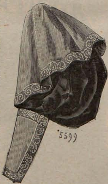
Núm. 4.—Manga novedad.