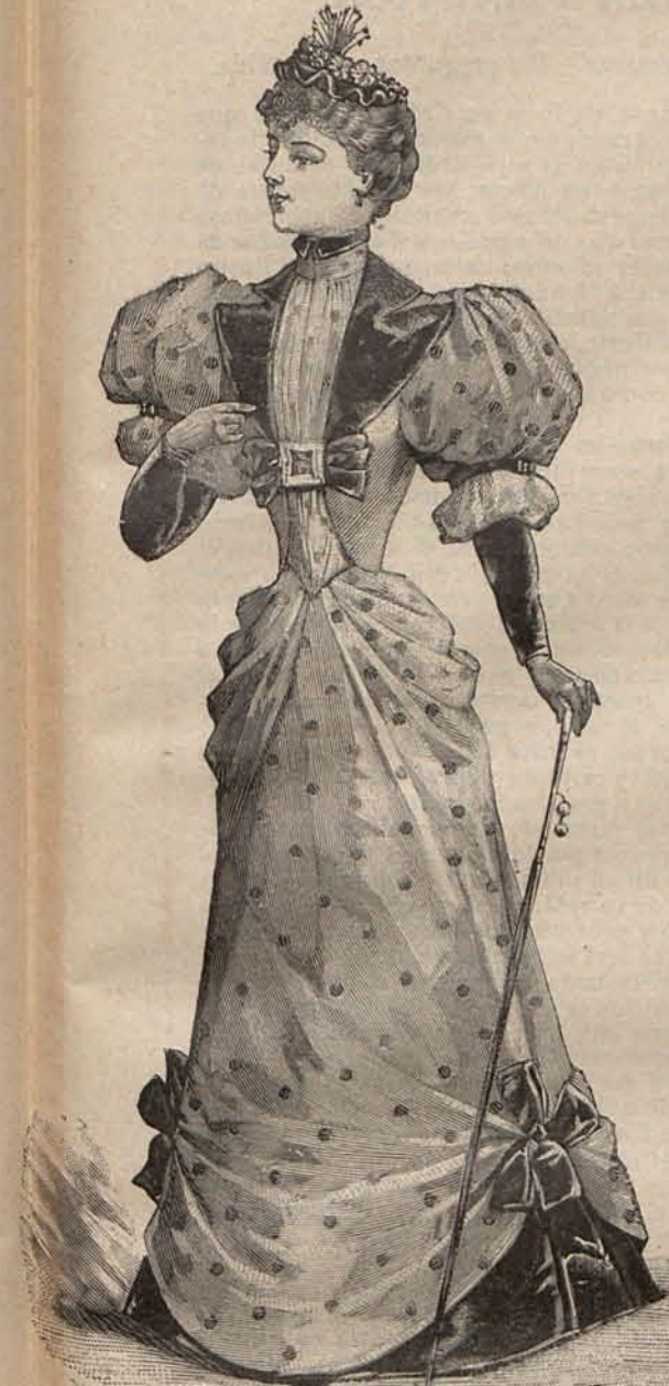
Num. 14.—Traje para visita.

Num. 11.—TRAJE PARA PASEO.—De muselina de lana de tonos beige y azul. Falda campana, guarnecida con dos bieses de seda marfil colocados el primero sobre el borde y el segun-