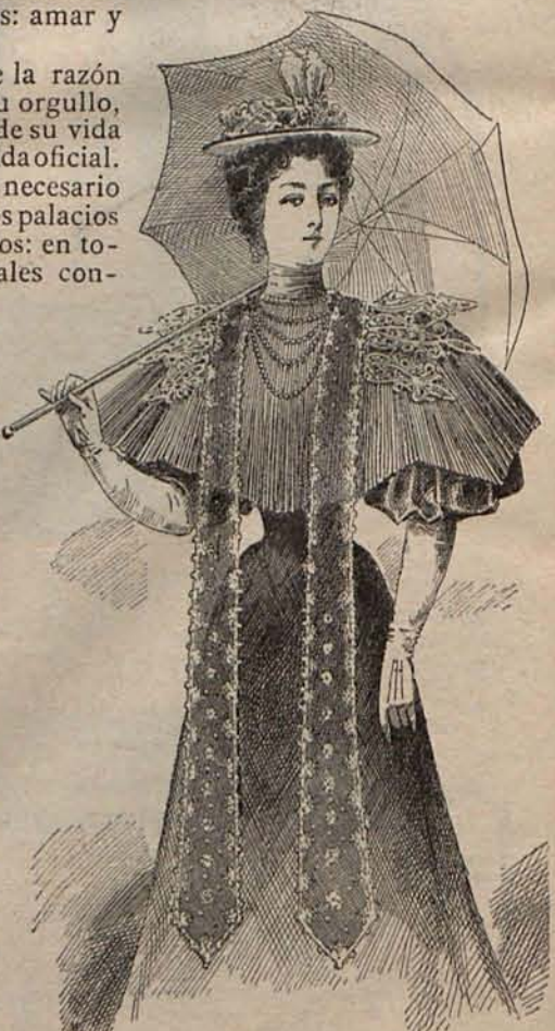
Núm. 5.—Esclavina ZULIMA.