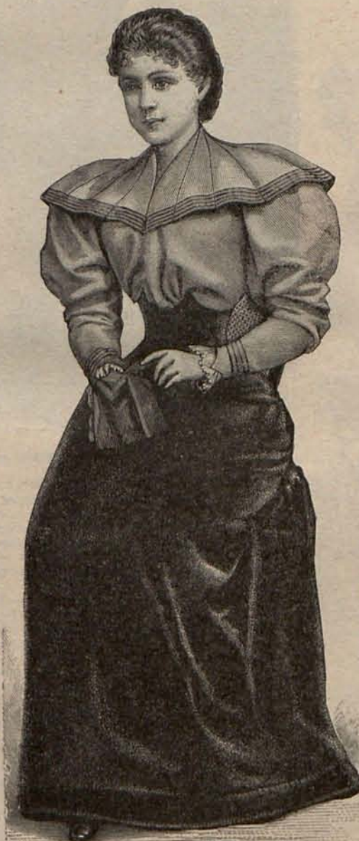
Núm. 8.—Traje de casa para señorita.

La elección y confección de los trajes que han de formar el equipo de Verano ocupa y preocupa poderosamente en estos momentos la atención de todas las señoras y señoritas que se disponen á pasar la estación calurosa en una playa ó balneario de moda. Ahora bien, como de todos los trajes que componen el equipaje de una señora elegante, los más importantes son sin duda los que han de ser lucidos en los bailes que se celebran en los Casinos, espero agradar á mis lectoras dedicando el primer párrafo de mi Carnet á la descripción de al-