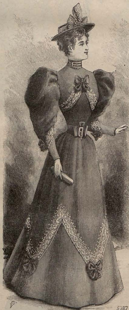
Num. 12.—Traje de mañana.

La que con justicia es reconocida como reina de las flores, desempeñará éste Verano en el adorno