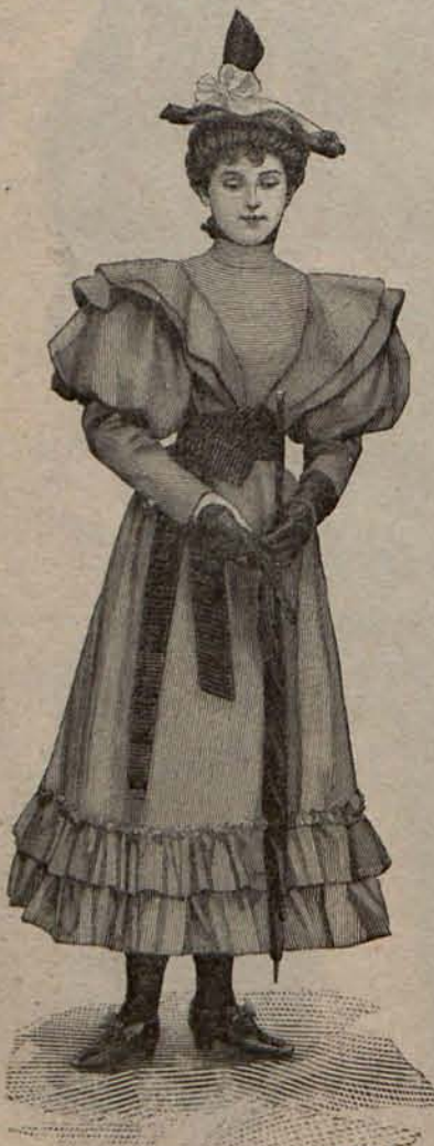
Núm. 3.—Traje para niña de 11 á 13 años.

minan á nuestra generación, un periódico de tanta importancia y circulación como Le Figaro de París, haya creído oportuno preguntar á sus lectores en la sección que dedica al estudio de los problemas morales y sociológicos más interesantes, su opinión