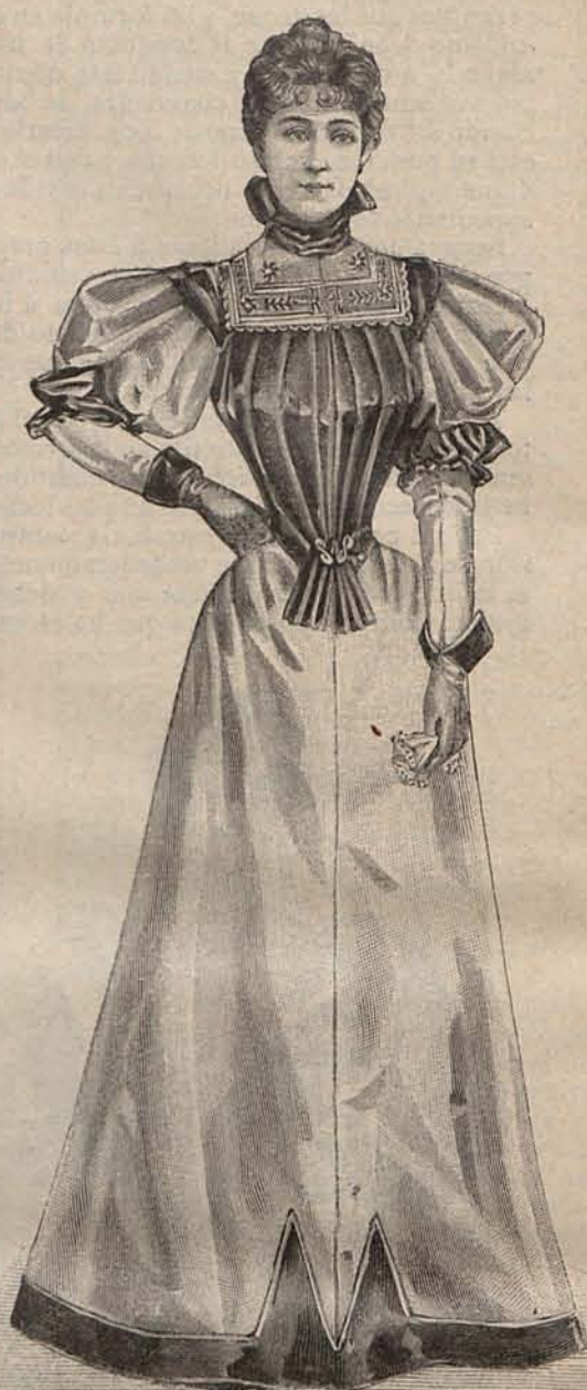
Num. 13.—Traje para recibir.

Num. 6.—TRAJE PARA PASEO.—De lanilla listada de tonos beige y grana. Falda lisa, caprichosamente adornada con dos grandes escarapelas de cinta tornasolada. Cuerpo chaqueta entallado prolongándose en agudas puntas rematadas con escarapelas de cinta. Los delanteros forman solapas forradas de seda tornasolada y están abiertos sobre un plastrón de encaje. Mangas mitad de encaje y mitad de lanilla. Tela necesaria para el traje, 9 metros de lanilla, doble ancho, y 50 centímetros de seda tornasolada. El patrón del cuerpo de éste traje figura en la Hoja de patrones que acompaña al pre-