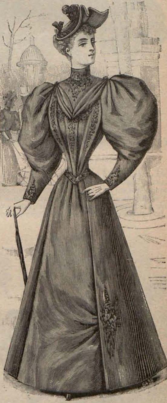
Núm. 9.—Traje para calle.

plastrón del mismo tejido que desaparece bajo una corbata chorrera de encaje negro. Las mangas, ajustadas, tienen en su parte superior amplios bullones rematados con cabecitas rizadas á unos seis centímetros de la sangría.