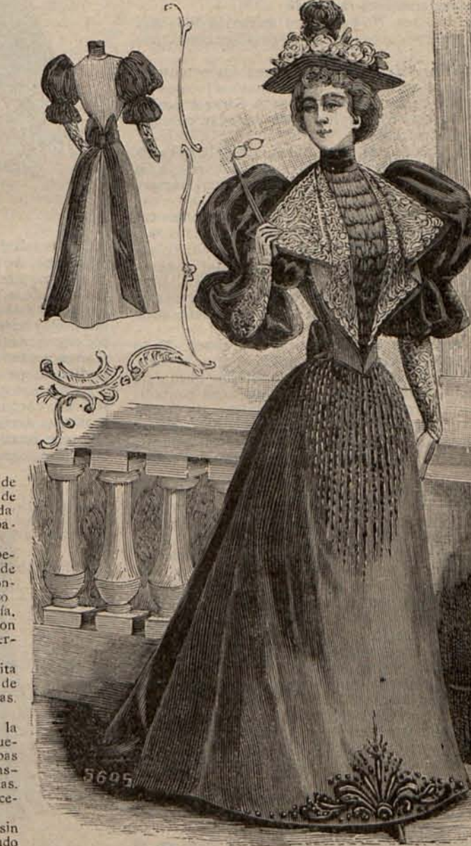
Num. 18.—Traje de ceremonia (Espalda y delantero.)

Num. 18.—TRAJE DE CEREMONIA.—(Espalda y delantero).—De seda de dos tonos del color madera de rosa. Falda de tono más claro, adornada en el bajo del delantero con un motivo de aplicación recortado en seda del tono más oscuro y perlado de azabache. Cuerpo corto, rematado delante por una lluvia de flecos de seda y detrás con un lazo Robesierre de seda del tono más oscuro. Las solapas plegadas colocadas á los lados de la camiseta abun-