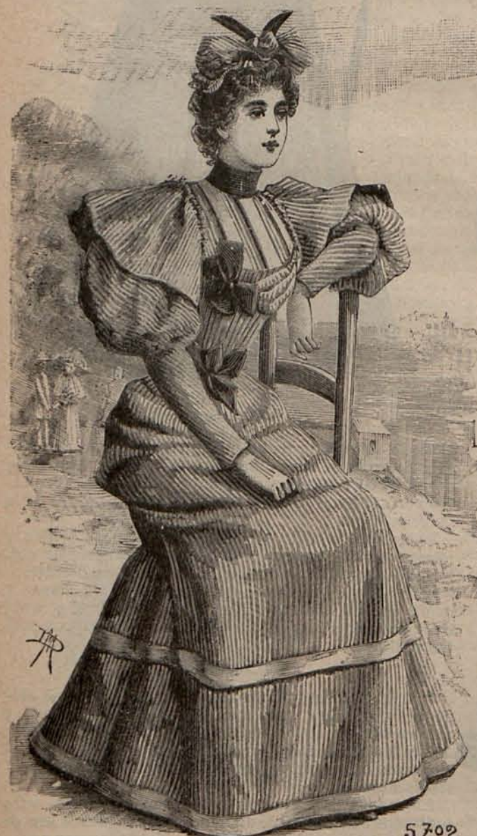
Num. 11.—Traje para paseo.

El modelo de uno de estos últimos delanteros, figura en la página 3.ª de este número y en la Hoja de patrones, hallarán las lectoras el de esta sencilla y elegante prenda.