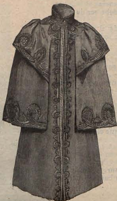
N.º 4.—Española del modelo grabado núm. 8.

azul celeste ó gris azulado y cereza, completan estas frescas y ligeras toilettes .