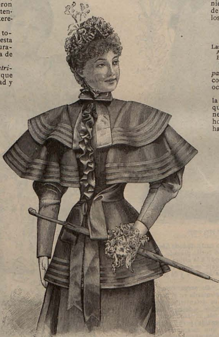
Núm. 19.—Chaqueta Miss DOLLY.

La obra termina con dos sentidas composiciones de Teodoro Guerrero y de Ricardo Sepúlveda, que jus-