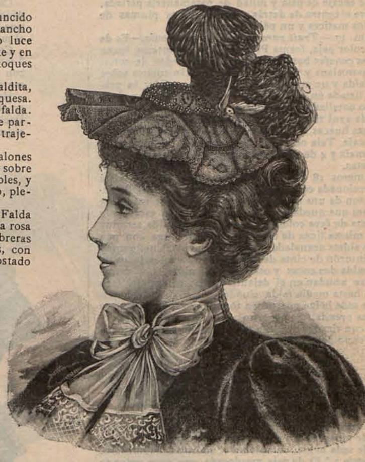
Núm. 16.—Sombbrero ADOLFINA.

Núm. 14.— Sombbrero GLORIA .—Este lindo sombrero se