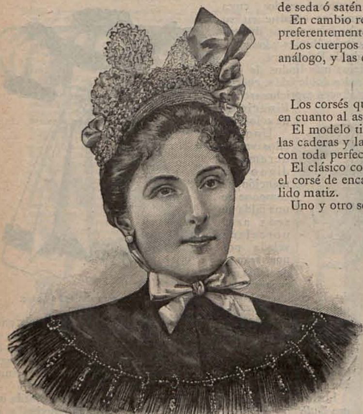
Núm. 10.—Sombbrero ARMANDA.

tra disposición, muselinas de lana moteadas, jaspeadas, Luis XV, sombreadas, con las que podrán hacerse trajes muy lindos y económicos.