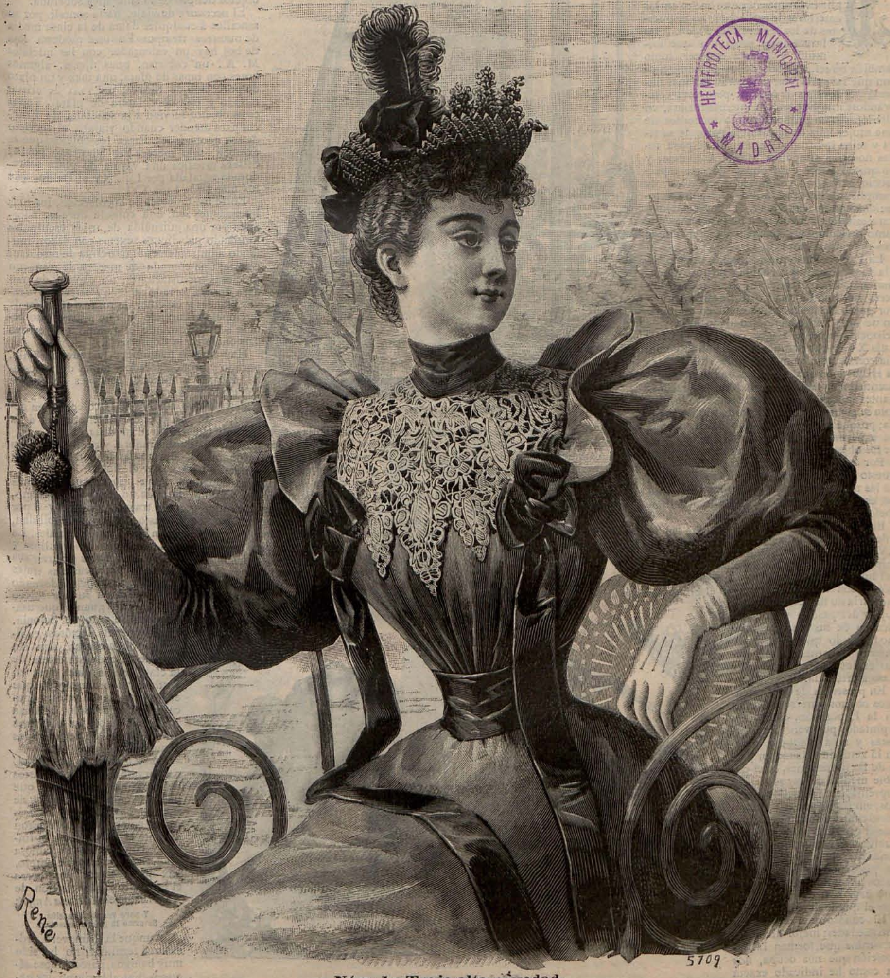
Núm. 1.—Traje alta novedad.