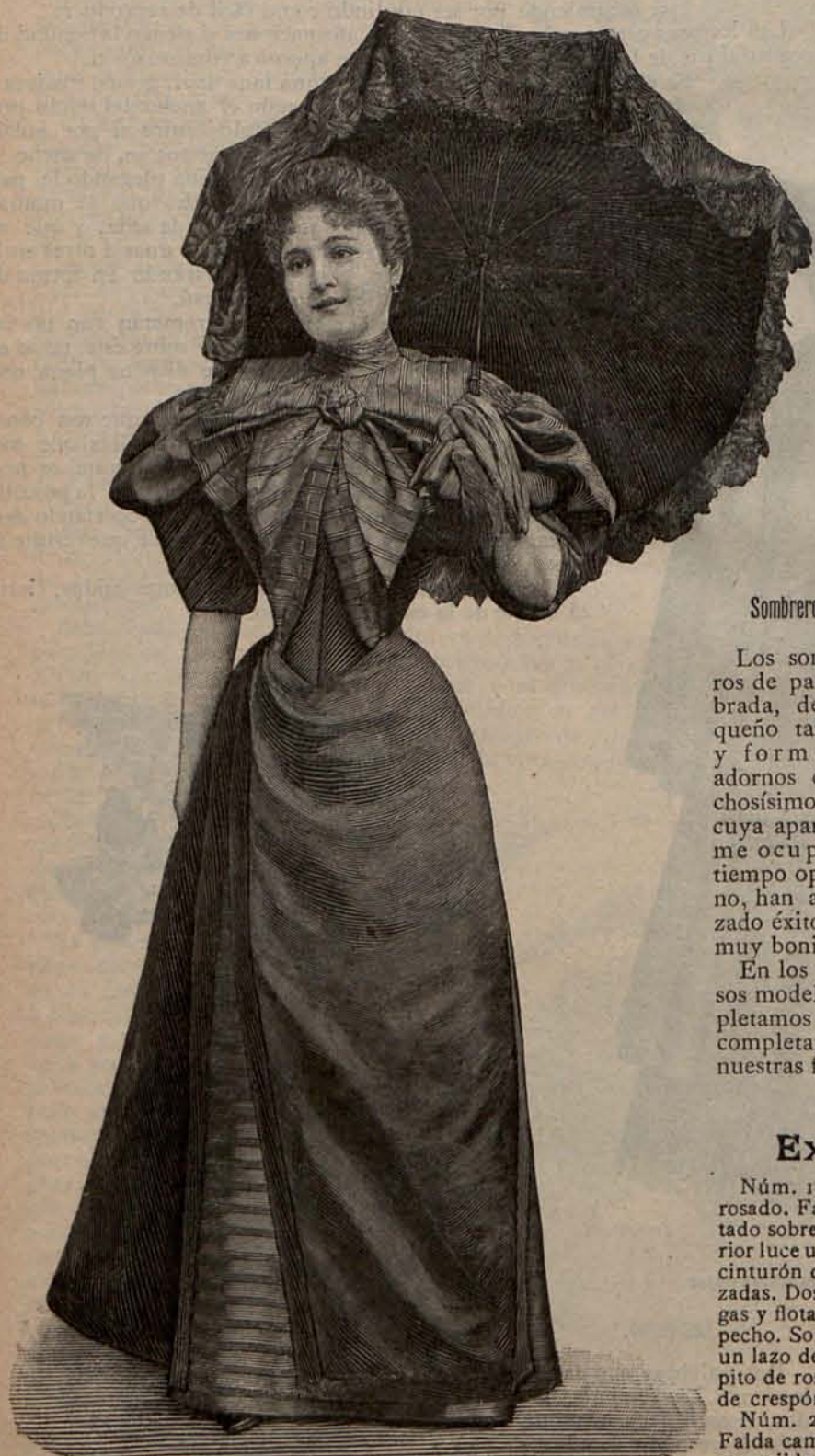
Núm. 11.—Traje para paseo.

tra disposición, muselinas de lana moteadas, jaspeadas, Luis XV, sombreadas, con las que podrán hacerse trajes muy lindos y económicos.