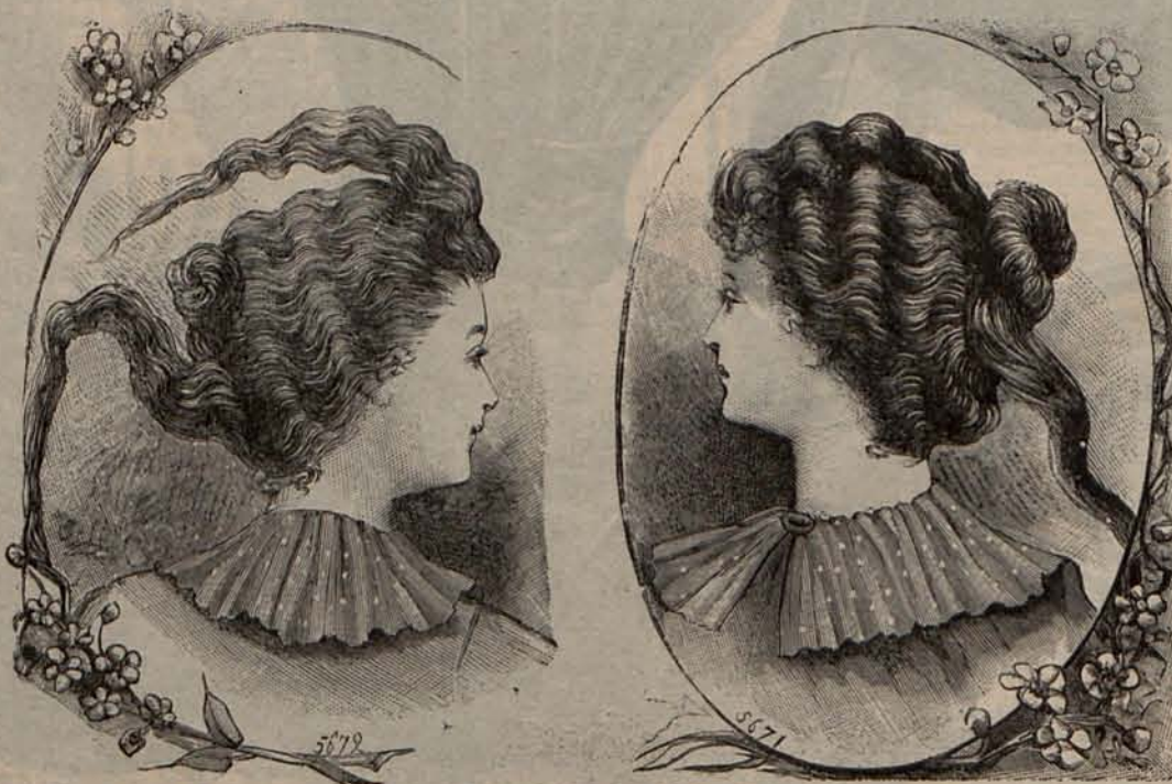
Núm. 3.—Peinado para diario.

idea de las magnificencias que creyó destruir el huracán revolucionario, y que vuelven ahora al cabo de un siglo a inspirarnos admiración y piedad.