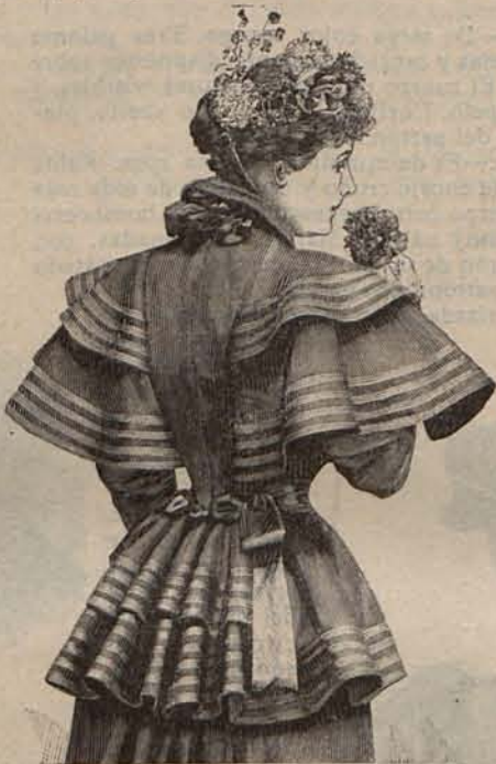
Núm. 18.—Espalda del modelo, grabado núm. 19.

Haga su agosto el demonio en el solteril estado.... Declaro que soy casado y que aplaudo el matrimonio.