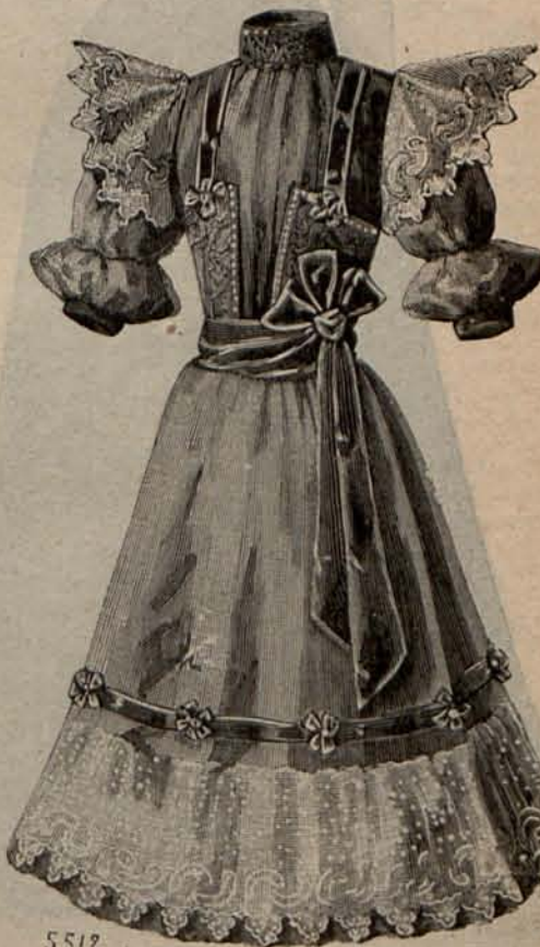
N.º 9.—Traje para niña de 9 á 11 años.

Dos palabras acerca de los forros. Las segundas faldas, lisas ó drapeadas, de fulard, crespón y demás tejidos ligeros, no se forran, porque las primeras faldas