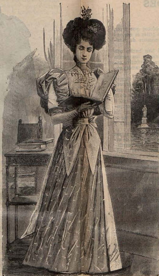
Núm. 13.—Traje para paseo.

gro y estrechas puntillas de encaje crudo completan el adorno del matinée . Tela necesaria para el traje, 12 metros de muselina de lana. Precio del patrón: 3 pesetas.