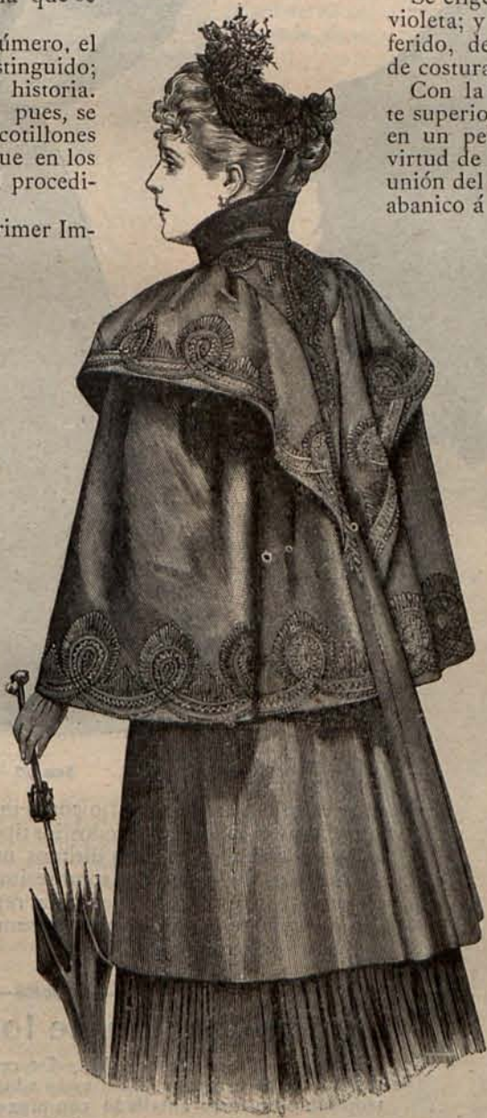
N.º 8.—Abrigo de viaje para señora mayor.

Un lazo de moaré con largas y flotantes caídas, cierra el escote de la esclavina Nilson.