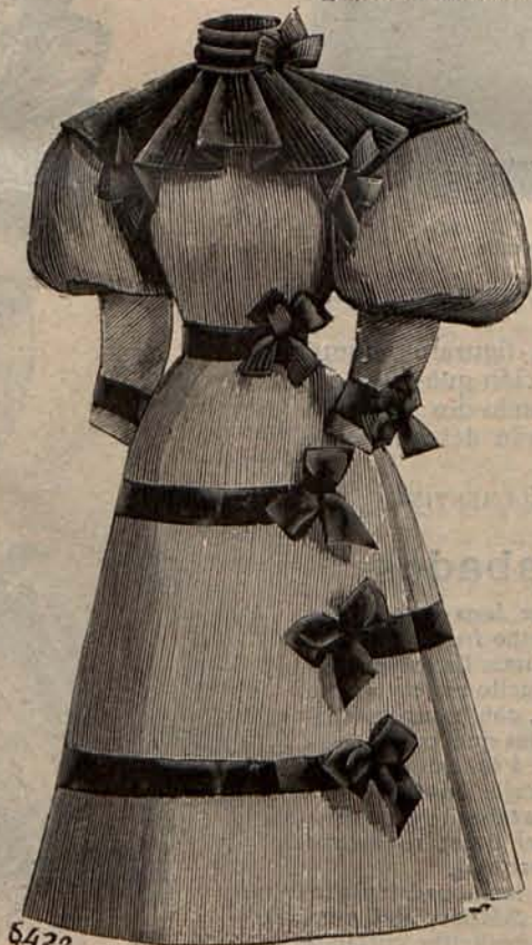
N.º 7.—Traje para niña de 8 á 10 años.

risienses ávidos de respirar aire puro, de ver flores y de esparcir el ánimo, han comenzado á santificar las fiestas trasladándose al campo, y muchas familias aristocráticas han organizado giras, prefiriendo á los ferrocarriles los mails coaches y los demás vehículos á propósito para expediciones.