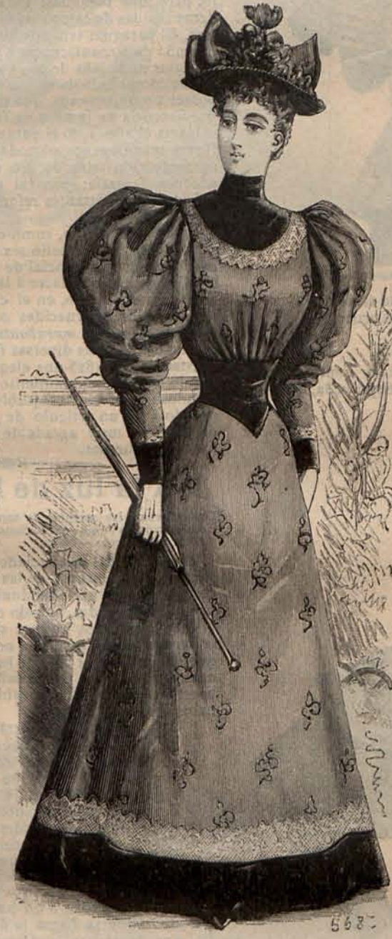
Núm. 15.—Traje para campo.

Núm. 11.— Traje para paseo .—De seda liberty de tonos azul y mandarina. Falda recta, abierta sobre un delantero de seda rayada, de to-