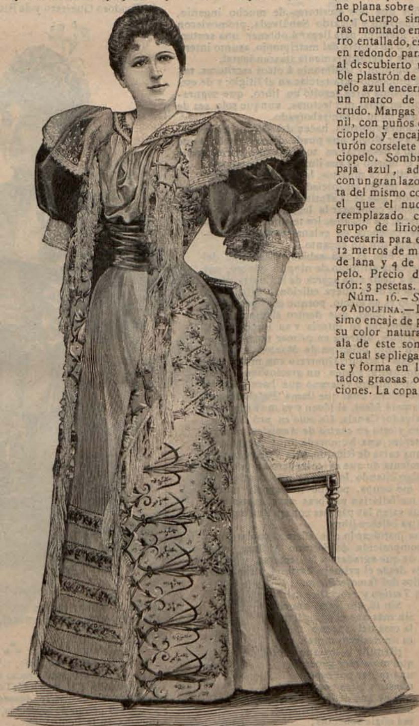
Núm. 17.—Traje para comida de ceremonia.

Núm. 16.— Sombbrero ADOLFINA .—De finísimo encaje de paja, de su color natural, es el ala de este sombrero, la cual se pliega delante y forma en los costados graciosas ondulaciones. La copa es mi-