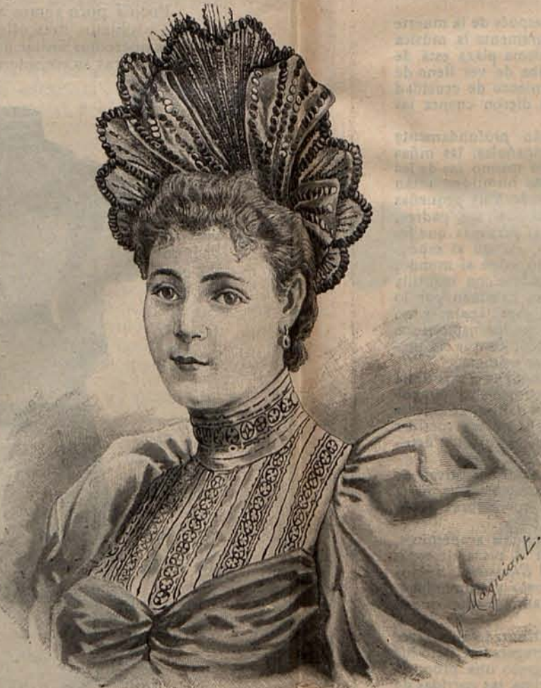
Núm. 14.—Sombbrero GLORIA.

Números 4 y 8.— Abrijo de viaje para señora mayor .—Es de lanilla verde mirtito, con espalda entallada y delanteros rectos. Las mangas de esta prenda están reemplazadas con una doble esclavina que parte de la espalda. Esta, los delanteros y la parte superior de la espalda, están guarnecidos con bonitas cenefas de aplicación de pasamanería de seda negra. Capota de paja negra, adornada con