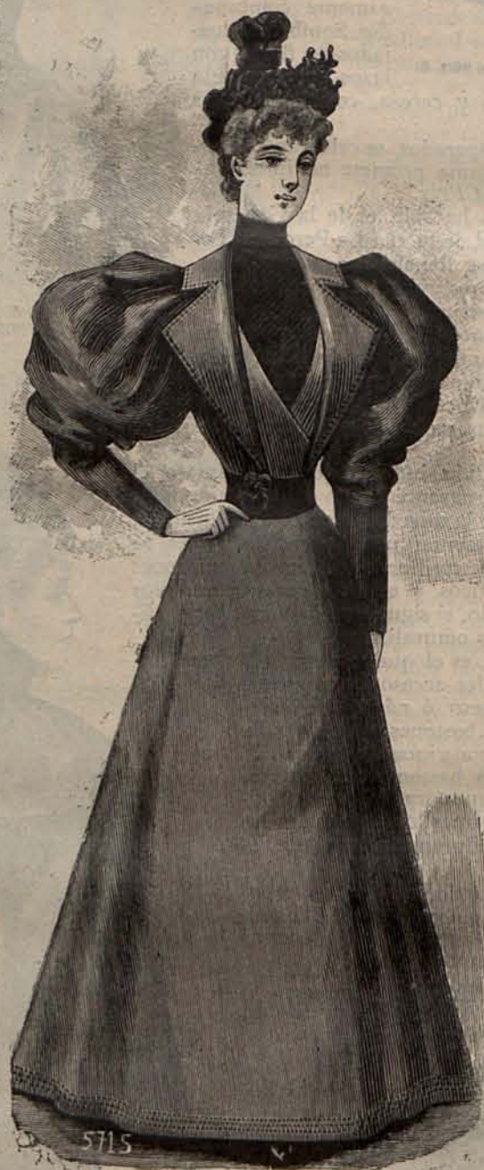
Núm. 12.—Traje para calle.