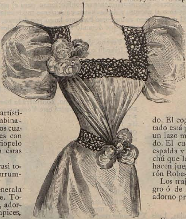
N.º 5.—Cuerpo para traje de baile.

En estas fiestas campestres lucen las damas elegantes y vaporosos trajes de fulard claro, adornados con encaje Isigny, de piqué blanco ó cheviottes graciosos y artísticamente combinados. Sombreros cuajados de flores con lazos de terciopelo