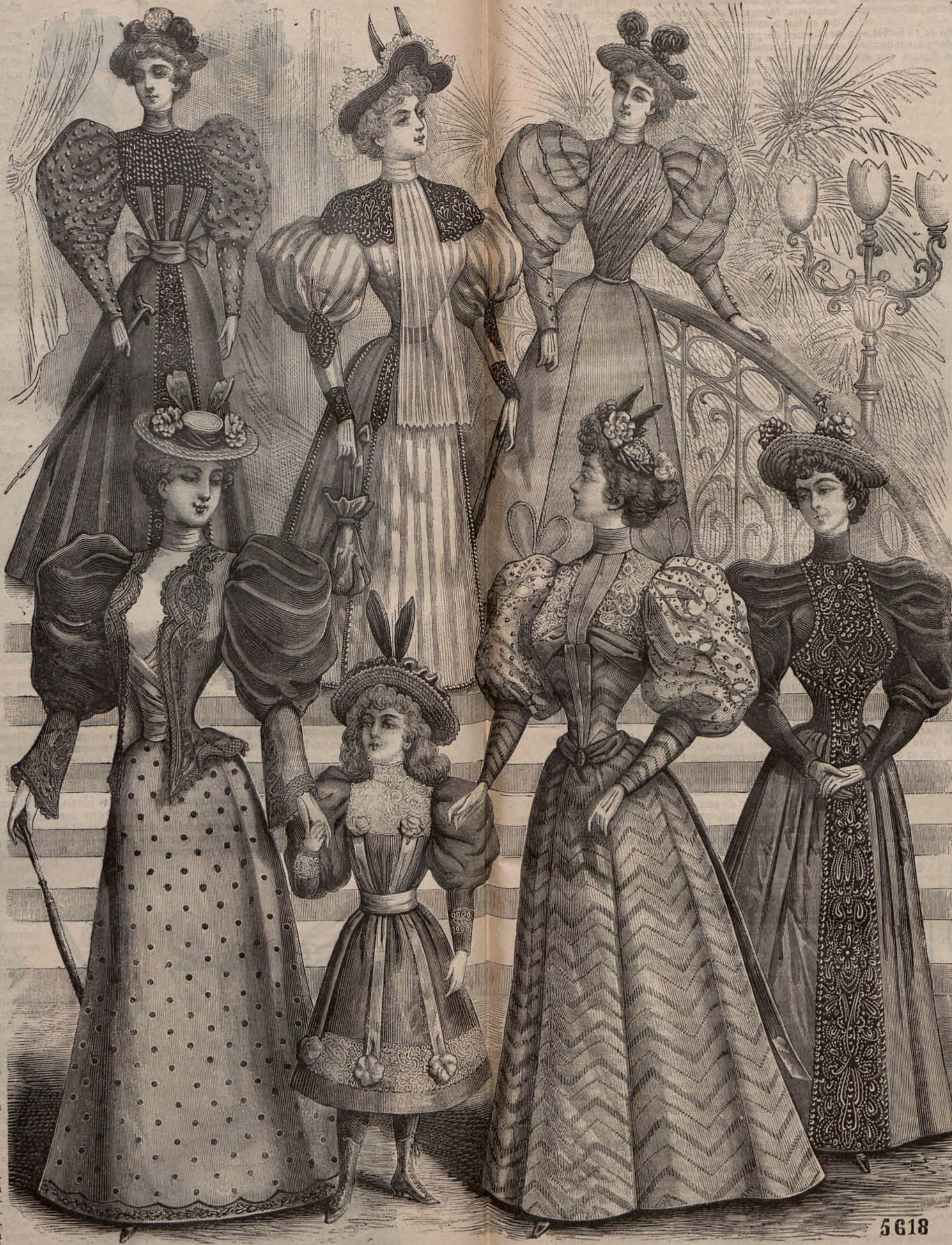
Núm. 13.—Trajes alta novedad.