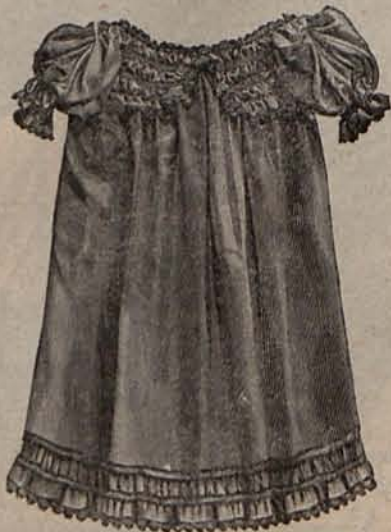
N.º 5.—Traje para niño de 6 meses á 1 año.