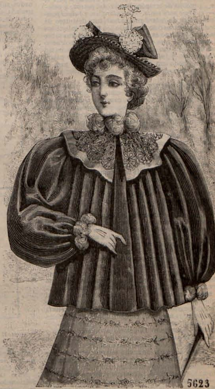
Núm. 15.—Chaqueta rusa.