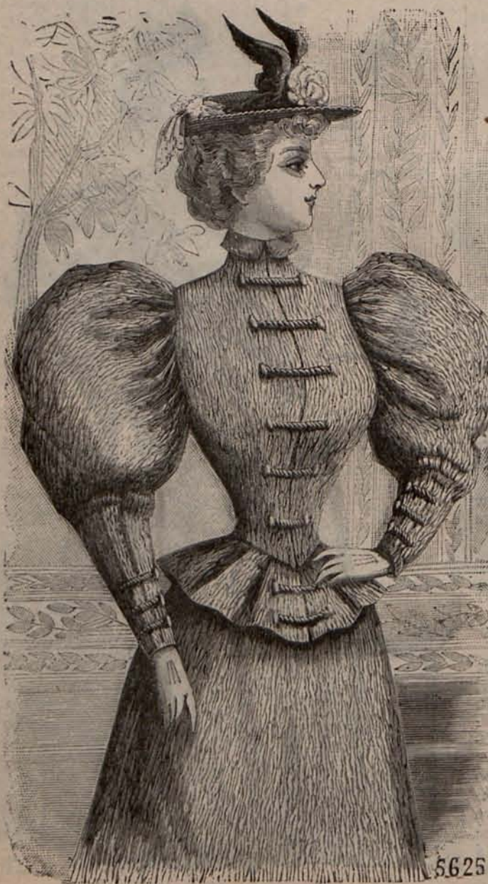
Núm. 12.—Traje de mañana.

guas y demás prendas que componen la leuceria infantil de Verano, no admiten otros elementos de confección que la batista, el nansú y el fino percal, ni otros adornos que bordados á la inglesa, alternando con menudos plegados.