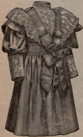
Num. 4.—Traje para niño de 2 á 4 años.