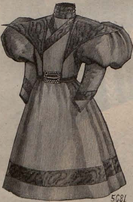
Num. 3.—Traje para niña de 3 á 5 años.