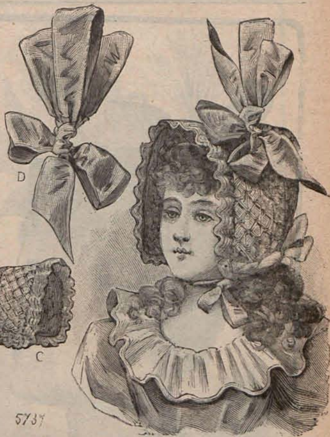
Núm. 9.—Sombrero Beguín para niña de 3 á 5 años.

—Sí, señor... hace tiempo estuvo muchos días, muchos días en la cama... me daba muchos besos y lloraba... Una tarde se durmió y no volví á verla. Mi papá, abrazándome y llorando también, me de-