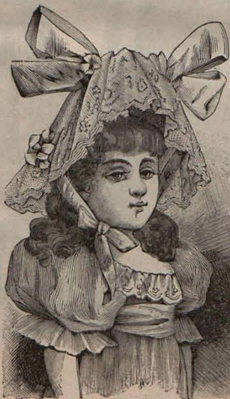
Núm. 7.—Sombrero Directorio para niña de 5 á 7 años.