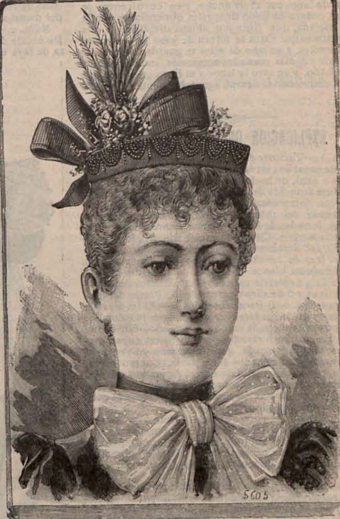
Núm. 14.—Sombra MERCEDES.

El modelo tipo es de etamine cruda, lisa ó tramada de oro, adornada con cenefas y arabescos bordados con sedas matizadas, y su hechura es cuadrilonga, como la de las bolsas ordinarias; pero ofrece la particularidad, de que en vez de cerrarse con dos costuras hechas en uno de los lados y en el bajo respectivamente, el pedazo de etamine de que se compone, se monta en torno de una base del mis-