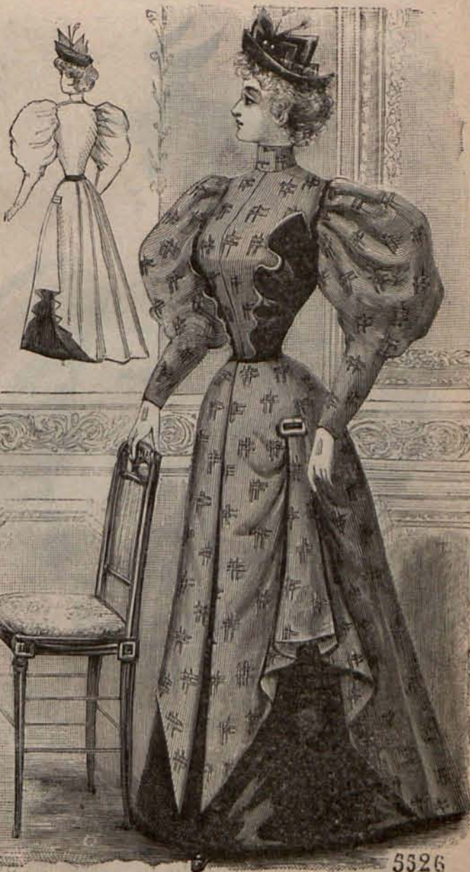
Núm. 10.—Traje para calle. (Esalda y delantero).