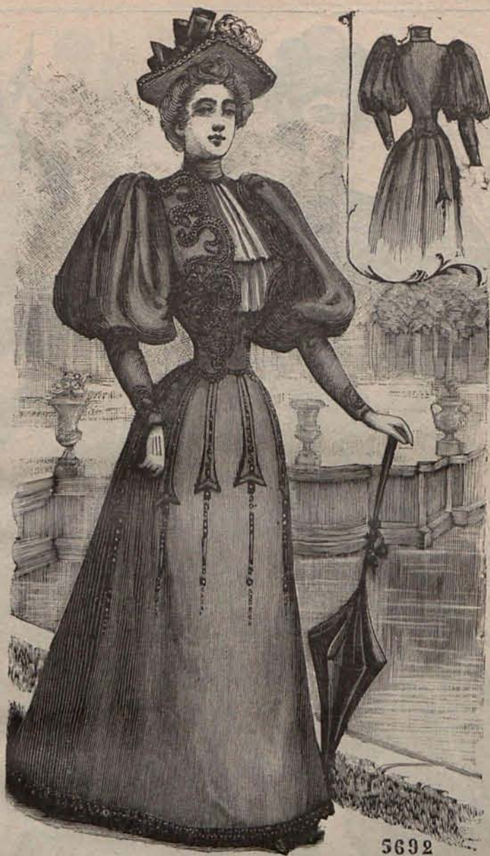
Núm. 6.—Traje para paseo. (Delantero y espalda).

maño á los fresones, y por el sabor á la más fina y delicada de cuantas variedades se cultivan; las manzanas Gigantes , los melones Prescott y otras muchas, que como observarán las lectoras no aspiran á recordar afectos sino á tributar homenajes. Nada más natural: las flores son más á propósito para representar sentimientos que las frutas que solo despiertan apetitos.