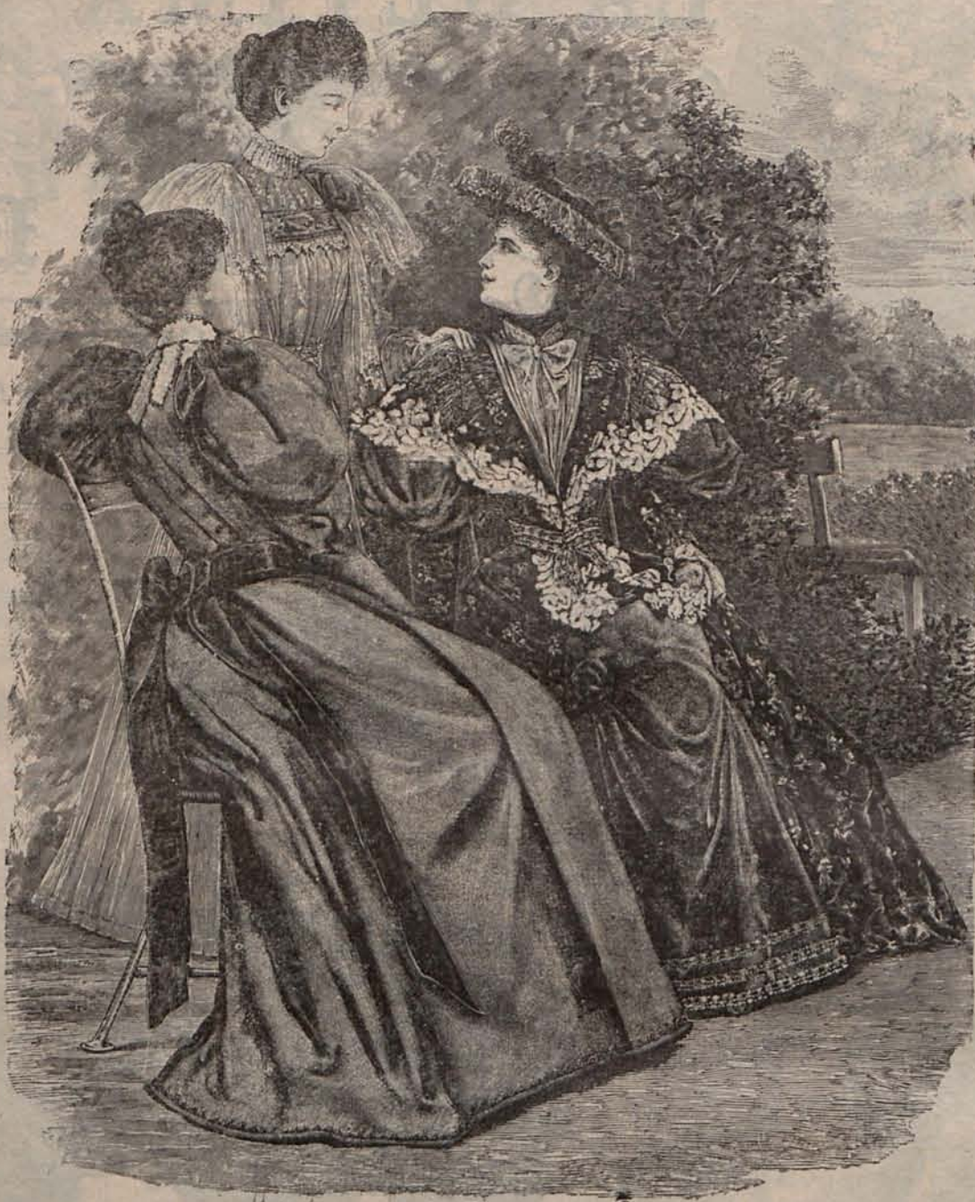
Num. 2.—Trajes para recibir y traje para visita.

También los horticultores dan nombres á los frutos, que á fuerza de observación, de perseverancia y de desvelos, consiguen ofrecer á la admiración de la vista y á la satisfacción del paladar. Y si no diganlo la fresa del Czar que es deliciosa, la fresa Princesa de Gales que es de una delicadeza y de un aroma exquisitos, la fresa Doctor Morene , que se parece por el ta-