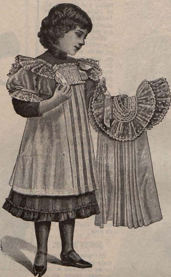
Núm. 16.—Delantalitos para niña de 3 á 5 años.

Núm. 9.— Sombrero Beguin para niña de 3 á 5 años .—De encaje de paja, adornado con rizados y lazos de cinta de faya blanca ó de color. Las dos figuras que en