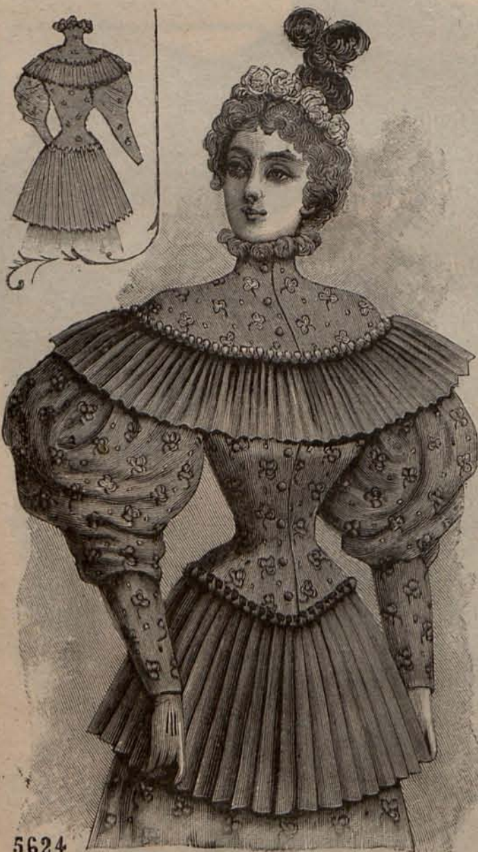
Núm. 3.—Chaqueta novedad (Delantero y espalda.)

La mujer ejerce una decisiva influencia en la vida del hombre, y casi puede asegurarse que es responsable de los actos buenos y malos que comete. Vive en su seno, nace en sus brazos, su corazón es blanda cera que ella puede amoldar á su gusto: la tierra virgen recibe la semilla, la planta crece con los cuidados de la madre; y la