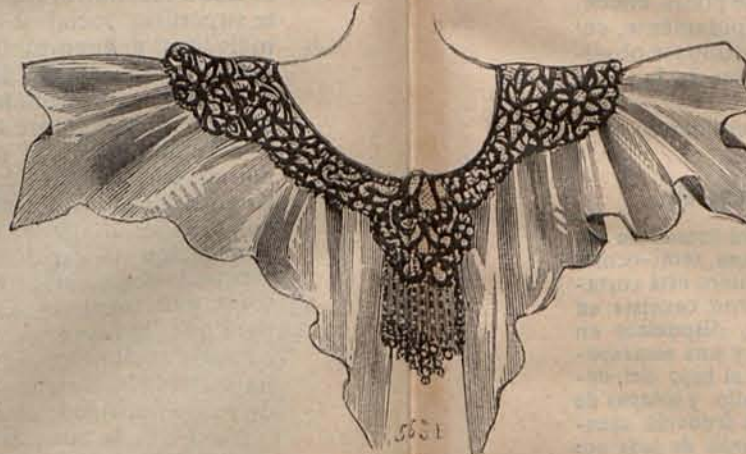
Núm. 13.—Berta púrcielago.

Terminaré indicando que las joyas deben ser proscritas de toda toilette de baño, tanto por razón de buen gusto como porque el oro y las