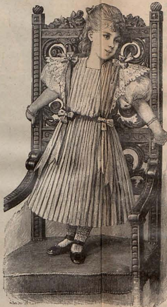
Núm. 12.—Traje para niña de 2 á 4 años.

No quiero abandonar la pluma, sin dar á mis lectoras algunos consejos que pueden serles útiles. Las morenas, las trigueñas y las rubias, sobre todo las últimas, deben evitar cuidadosamente