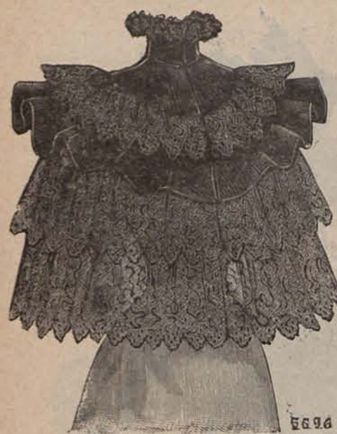
Núm. 8.—Escavina Estela.

plata y gris acero, negro y grana, azul y blanco ó gris y rosa, y se guarnecen con dobles ó triples cuellos vueltos y acanalados, cuyos contornos aparecen acentuados por rizados de cinta de alpaca del color que más domine en el tisú. Los segundos están confeccionados con peluche de lana rosa, azul, ralmón, grana ó blanco; y su adorno consiste en anchas grecas, bordadas sobre los contornos con hilo de oro ó hilo de plata. Las salidas de baño de tela rusa y las capas de hule, han pasado por completo de moda.