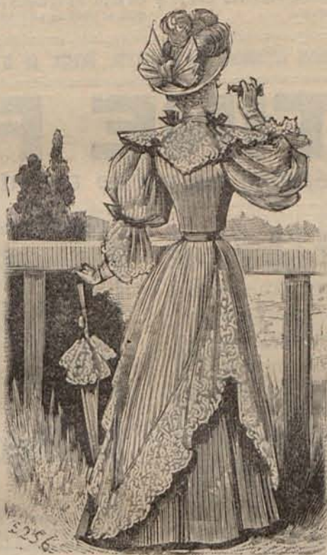
Núm. 20.—Reverso del Figurín acuarela.

DOS INSEPARABLES.—Contestación á las amables preguntas con que ustedes me favorecen.—1. a Los guan-