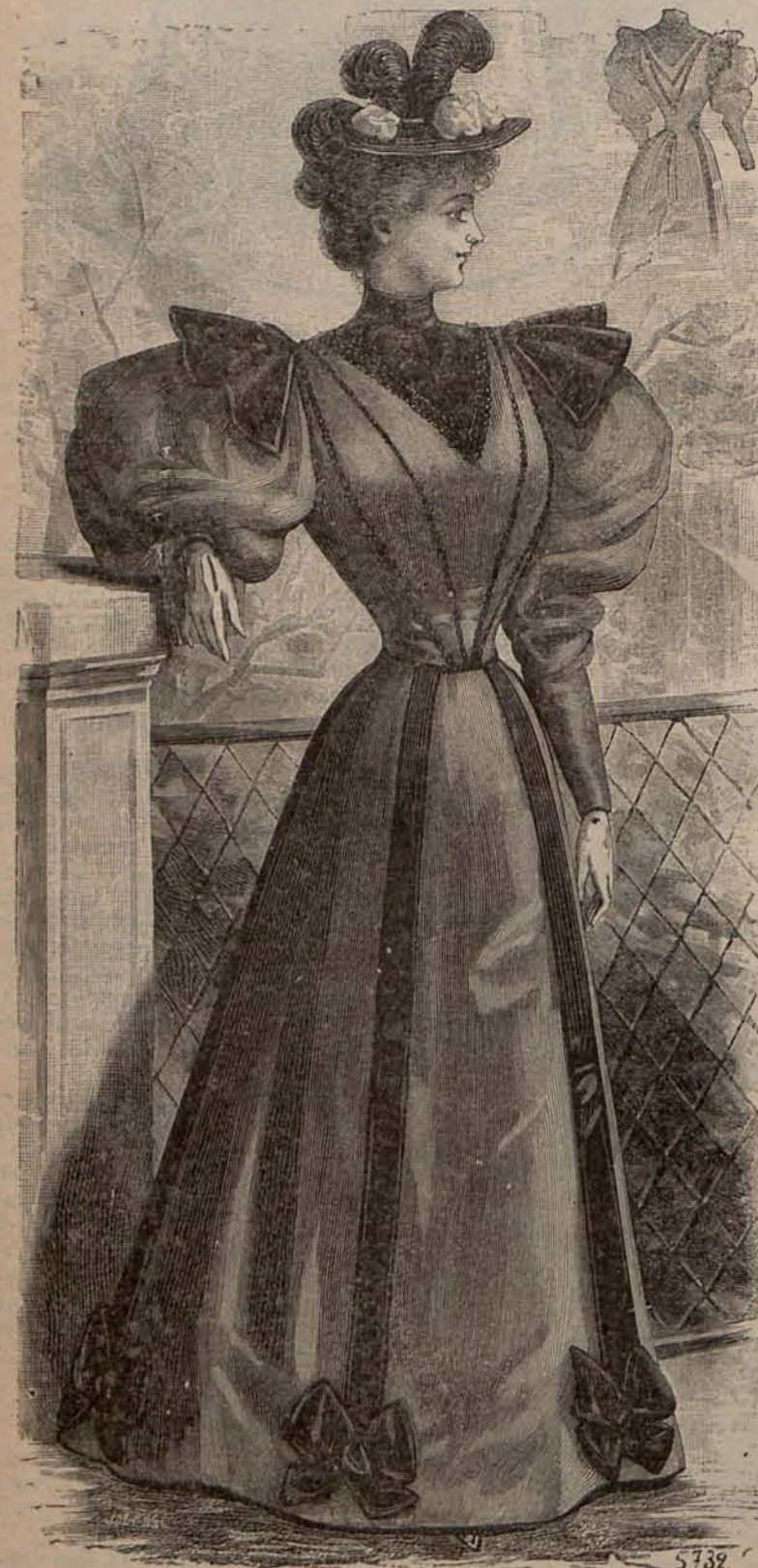
Núm. 9.—Traje para campo. (Delantero y espalda).

Las clásicas gorras de hule han caído también en desuso, y son reemplazadas por originales tocados confeccionados con arreglo á los modelos que á continuación describo. Uno de ellos consiste en una especie de pañuelo de tres picos, de seda impermeable lisa ó cuadrícula, bordeado de un goloncito elástico que queda oculto bajo un rizadito de seda impermeable picado en los contornos. Dicho tocado, se coloca sobre el cabello cruzando las tres puntas á la altura de la nuca y sujetándolas por medio de un lazo mariposa, de cinta de seda impermeable. Otro modelo afecta la forma de un beguin , y es de seda impermeable blanca, adornado con triples series de rizaditos de cinta de