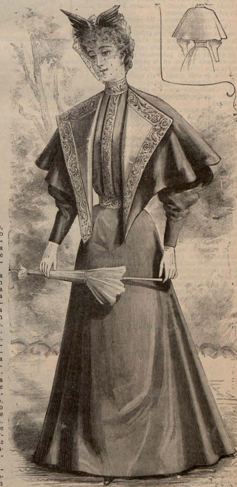
Núm. 17.—Traje para campo. (Delantero y espalda).