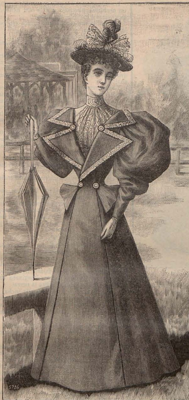
Núm. 14.—Traje para playa.

Núm. 1.— Trojes para visita. (1).—De crespón de lana color madera de rosa, forma Princesa . El cuerpo está adornado con encajes crudos dispuestos en forma de plastrón y berta, y la falda luce en el bajo un ancho jaretón de la misma tela. Mangas abullonadas. Sombrero de paja color madera, adornado con escarapelas de cinta y plumas de igual matiz. Tela necesaria para el traje, 9 metros de crespón de lana, doble ancho. Precio del patrón: 3 pesetas. (2).—Es de fulard moaré verde álamo. Falda de hechura campana. Cuerpo corto ajustado con un