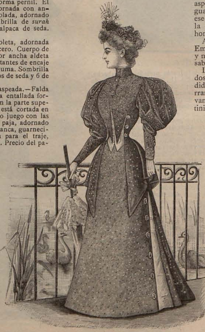
Num. 19.—Traje para excursión.

La vida aparece á la niña convertida en mujer, como un problema pavoroso y á la vez lleno de dulces esperanzas é inefables encantos.