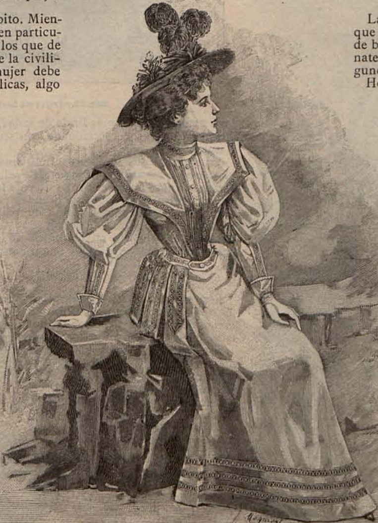
Num. 7.—Traje para campo.