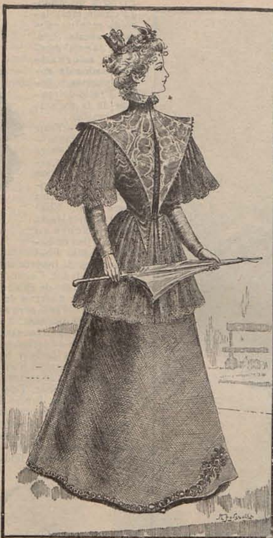
Num. 18.—Traje para visita.

Del mismo modo no se penetra en el templo del amor sin experimentar ansiedades, congojas, y verter lágrimas.