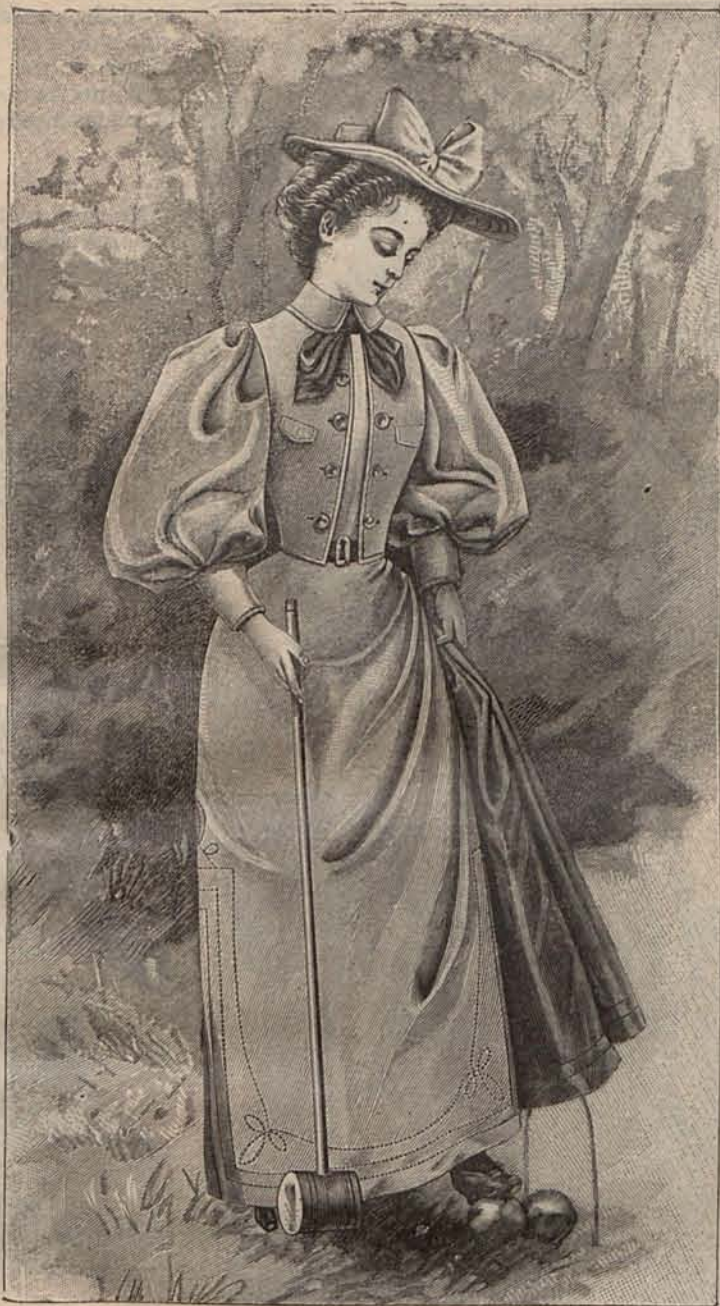
Num. 5.—Traje para LAWN TENNIS.

flor y el fruto son exclusivamente obra suya, porque no solo ha de procurar que la semilla sea buena, sino que debe protegerla contra los agentes exteriores que puedan perjudicarla y destruirla.