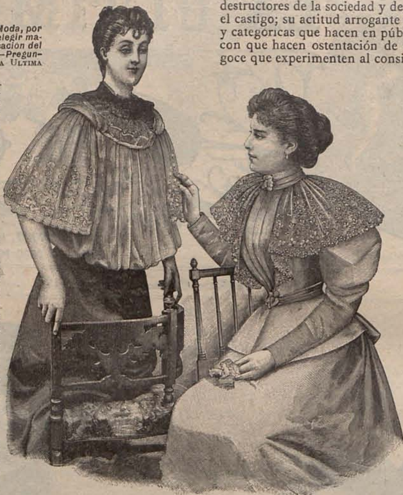
Núm. 2.—Deshabillés elegantes.

Apunto estas indicaciones, porque de otra manera no se comprendería que residiendo yo en París, no haya dedicado en mi crónica anterior algunas líneas á protestar contra el inícuo asesi-