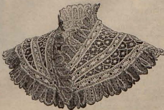
Núm. 11.—Cuello de guipure.

Las señoras, las señoritas y las niñas, usarán igualmente para baño sandalias de piel, sostenidas por flexibles correitas cruzadas y cerradas con dimi-