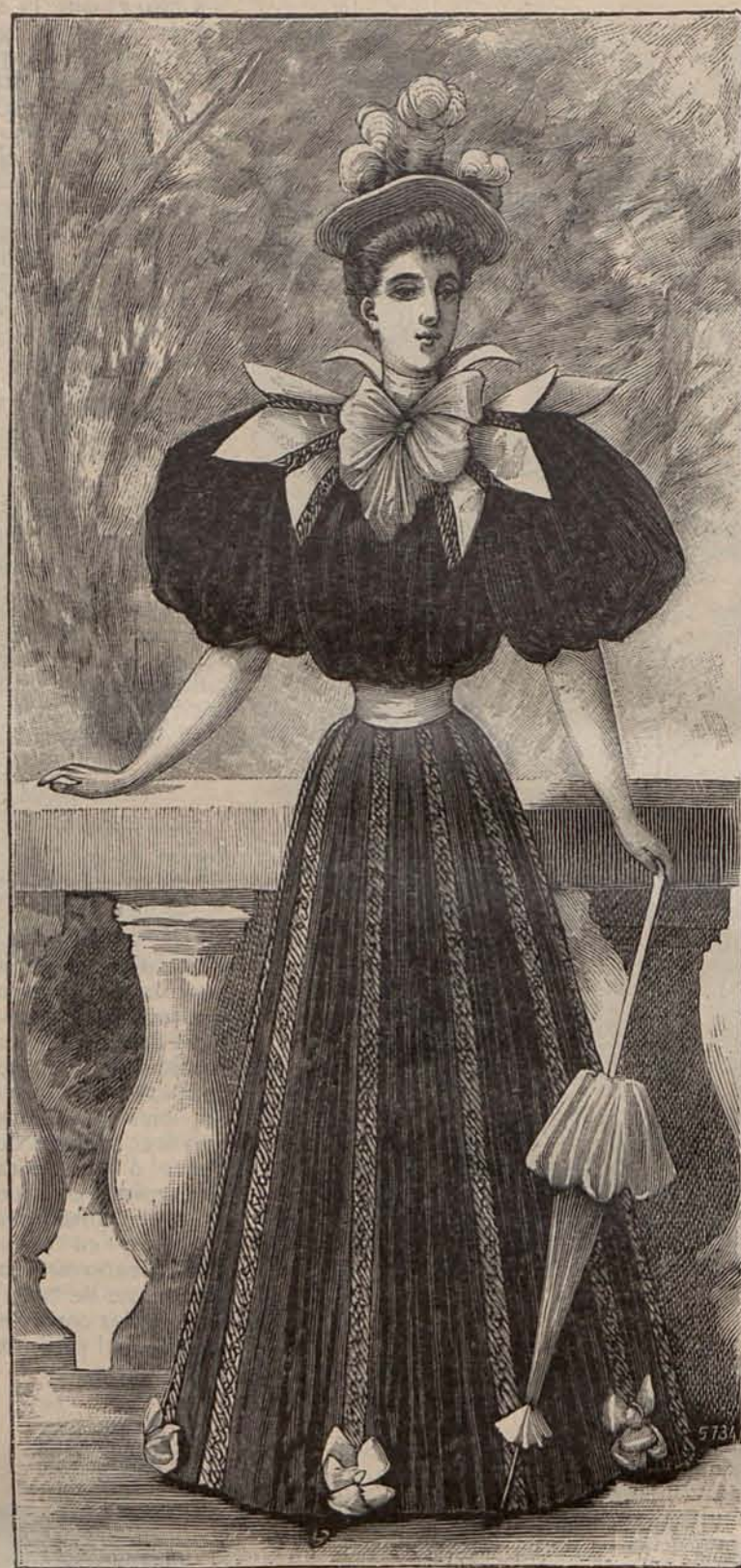
Núm. 10.—Traje para Casino

lana azul; y otro, el más lindo de todos, viene á ser una cofia Carlota Corday , confeccionada con seda impermeable tornasolada.