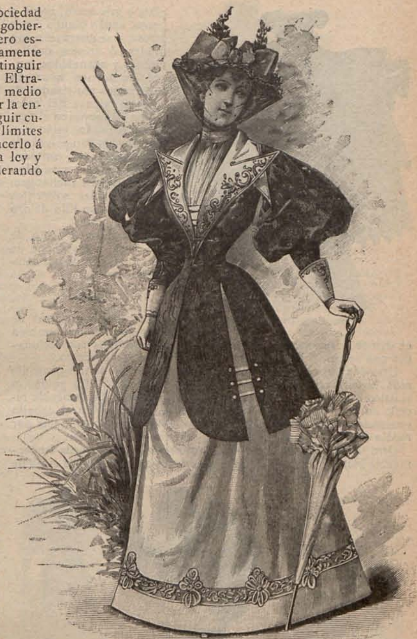
Num. 6.—Traje para visita.

Las primeras son todas de tisú impermeable de lana, seda ó algodón, liso ó cuadriculado y de tonos gris