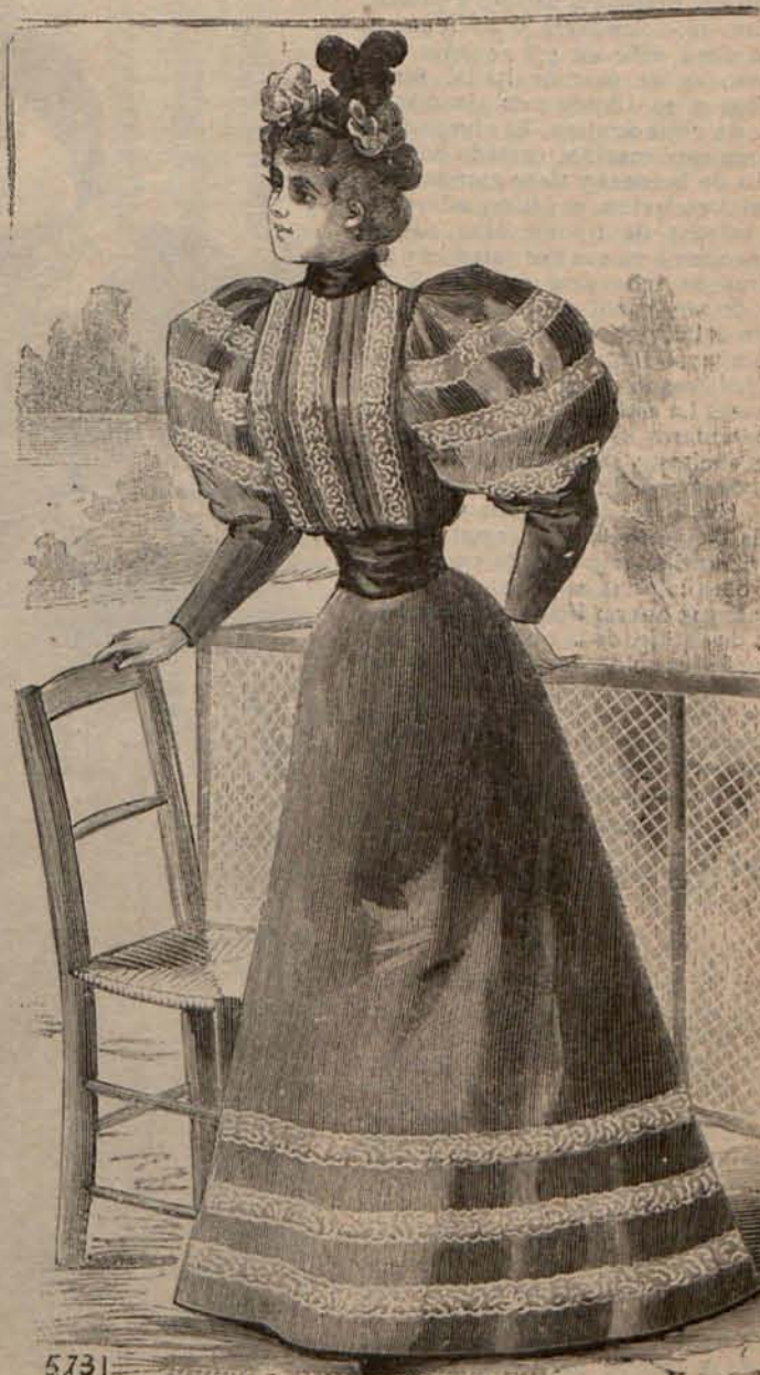
Núm. 15.—Traje para playa.