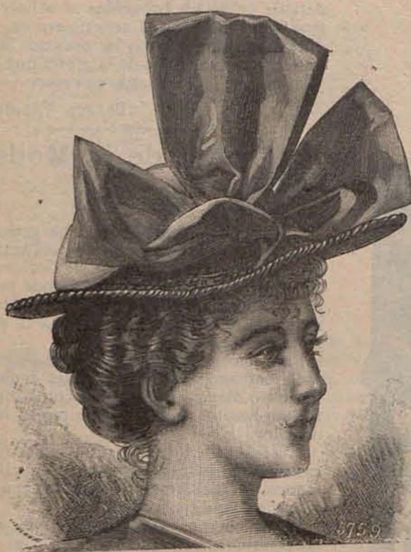
Núm. 8.—Sombrero de playa para señorita.

emplaza con un ancho cinturón de piel blanca cerrado por un doble broche níquelado.