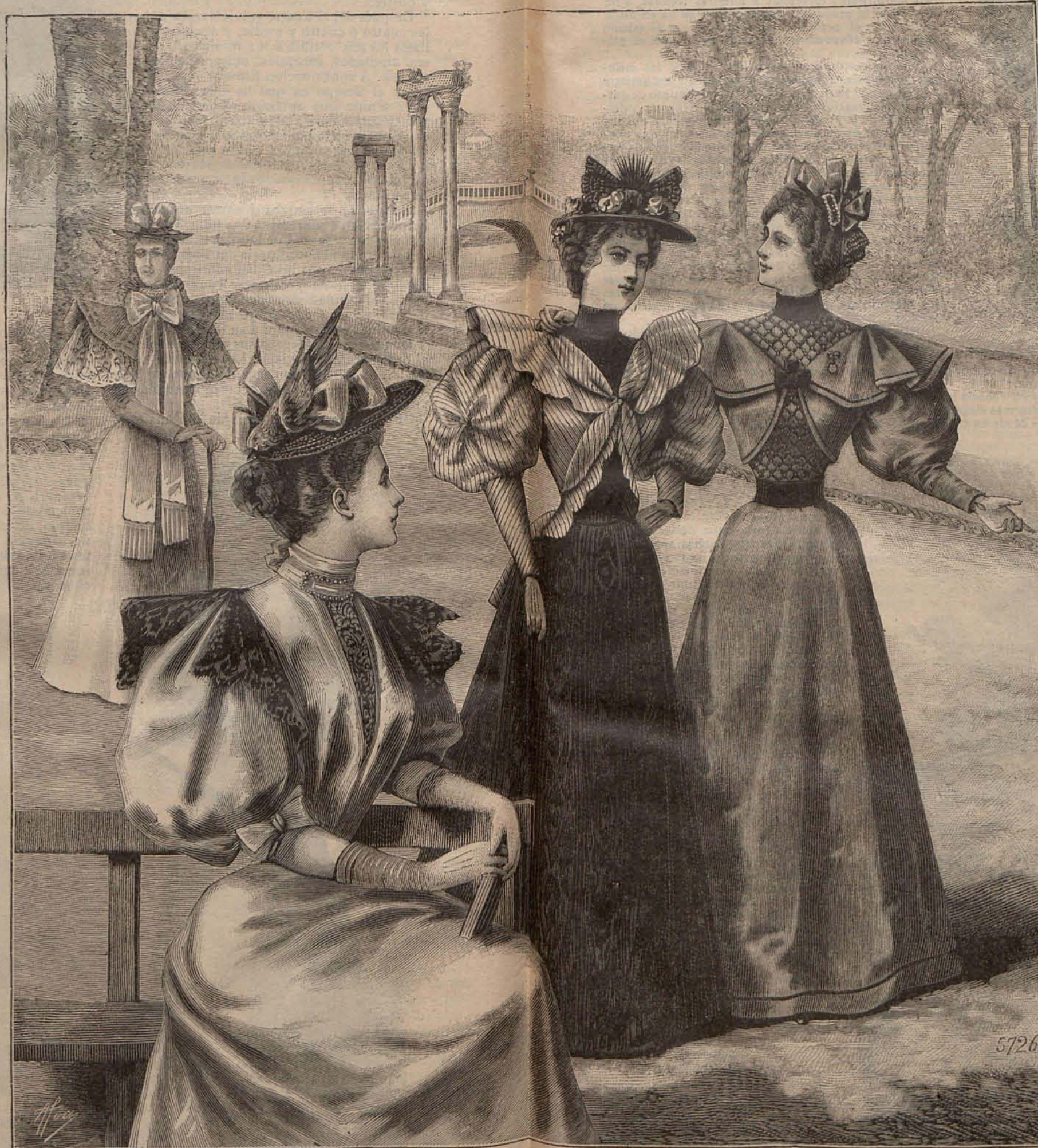
Núm. 13.—Toilettes para campo.

en el bajo con un ancho jaretón de la misma tela. Cuerpo fruncido, montado en un canesú de seda azul, rayado por aplicaciones de encaje crudo. De los contornos del canesú, y tanto en el delantero como en la espalda, parten cintas de seda azul prendidas con escarapelas, las cuales terminan en la cintura bajo un cinturón de lo mismo. Mangas de pernil. Sombrero de paja de Italia y encaje crudo, adornado con un gran lazo de surah azul porcelana. Tela necesaria para el traje, 14 metros de muselina de lana. Precio del patrón: 3 pesetas.