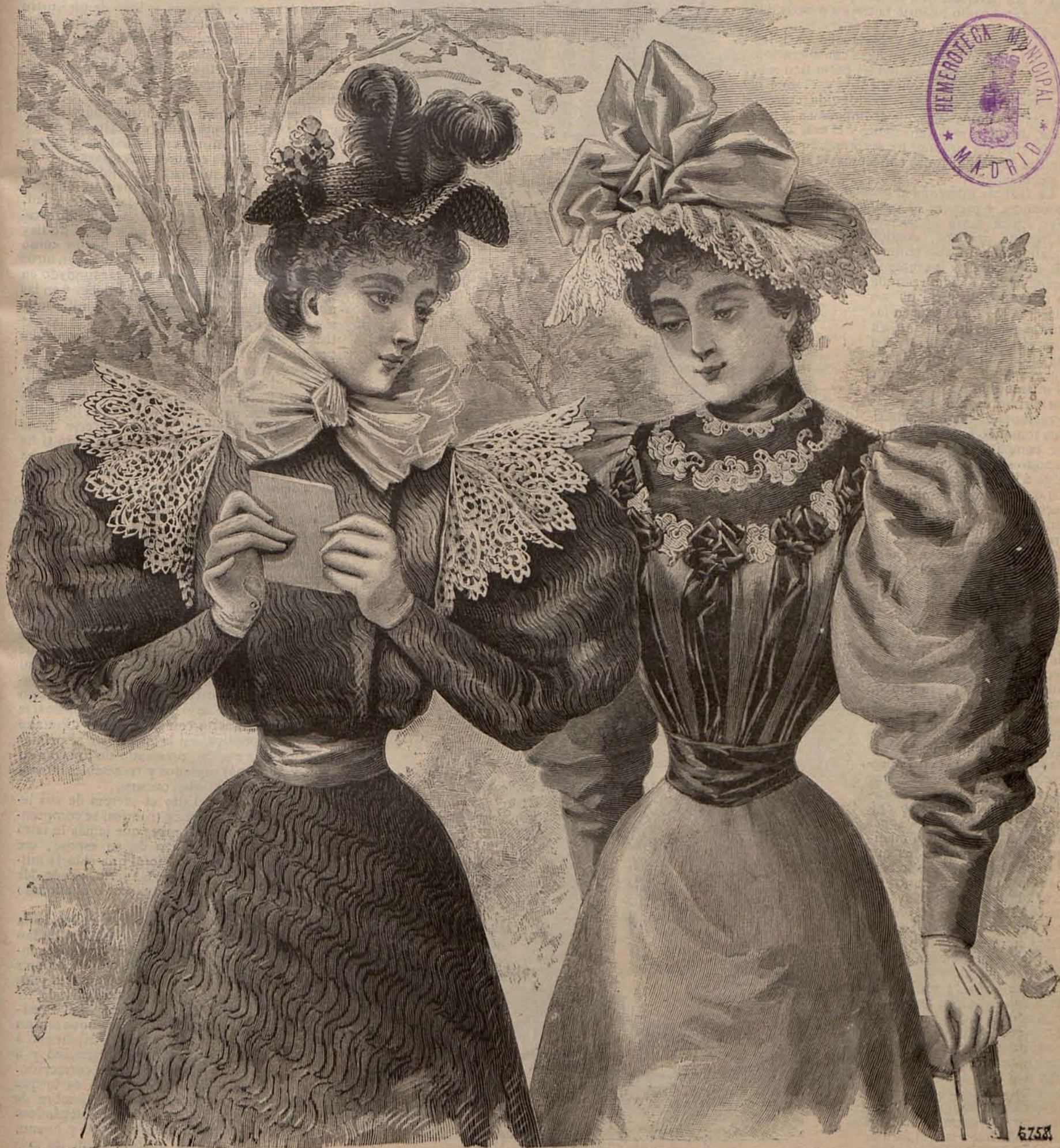
Núm. 1. Trajes para campo.