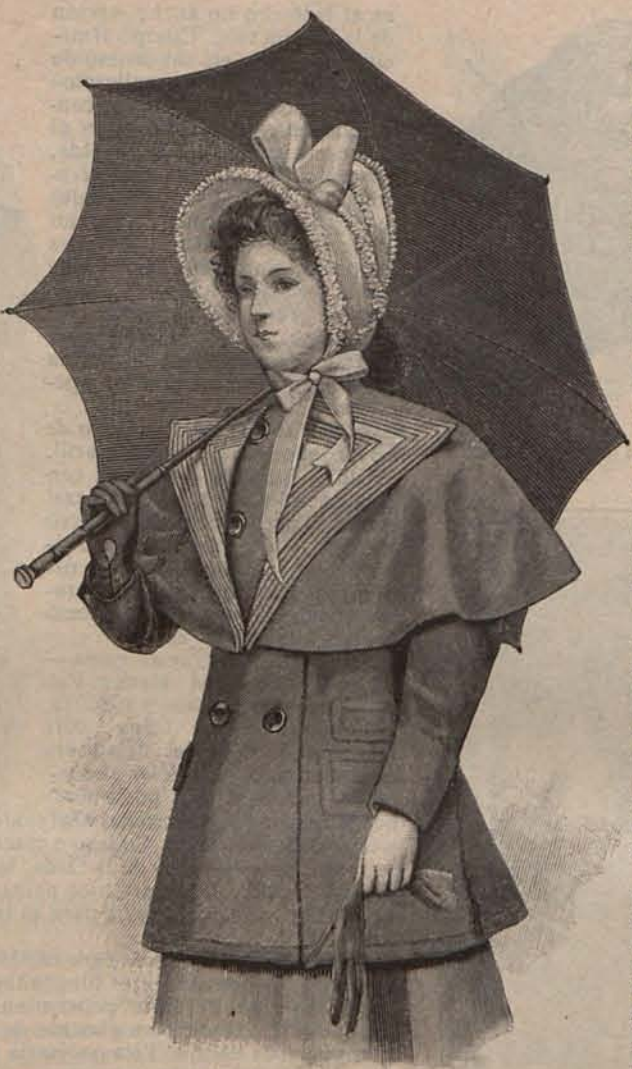
Núm. 16.—Sombrero y abrigo de playa para niña de 9 á 11 años.

Empezaré pidiendo mil perdones por no haber cumplido mi promesa de enviar correspondencias. Ha sido de todo punto imposible, y lo comprenderán nuestras muy estimadas suscriptoras cuando se enteren de que en un mes he estado en París, Lyon, Milán, Venecia, Viena, Florencia y Roma.