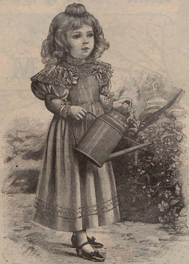
Num. 2.—Traje para niña de 4 á 6 años.

Sobre todo la mujer que vive consagrada al amor y al cuidado de su familia, que no toma parte activa en las continuas fiestas del mundo, que tiene tiempo en la soledad ó al lado de las personas queridas que comparten su hogar, para examinar y comentar los acontecimientos trascendentales que al formar la historia contemporánea,