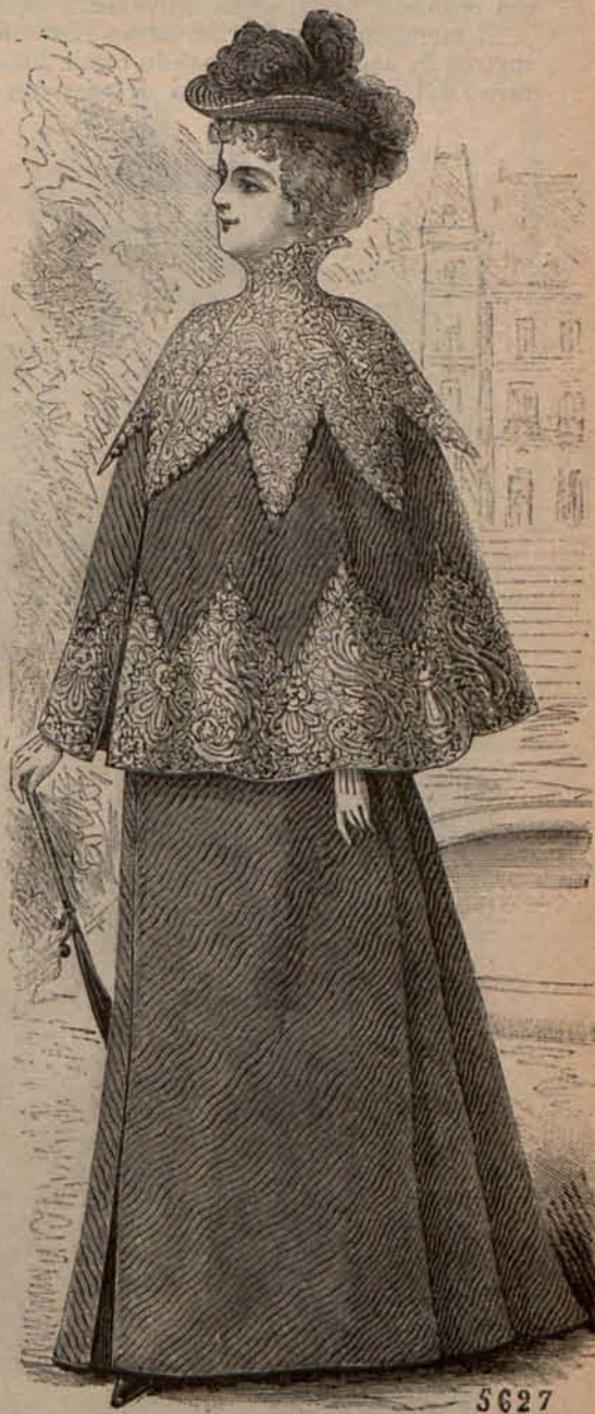
Núm. 7.—Cubre-polvo para viaje.

Como el tocado más á propósito para lawn-tennis , citaré el sombrerito canotier de paja lisa, blanca ó de color, sencillamente adornado con un