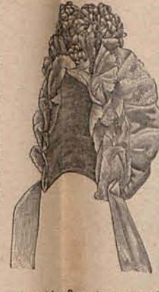
Núm. 11.—Capotita para niño de 4 á 6 meses.