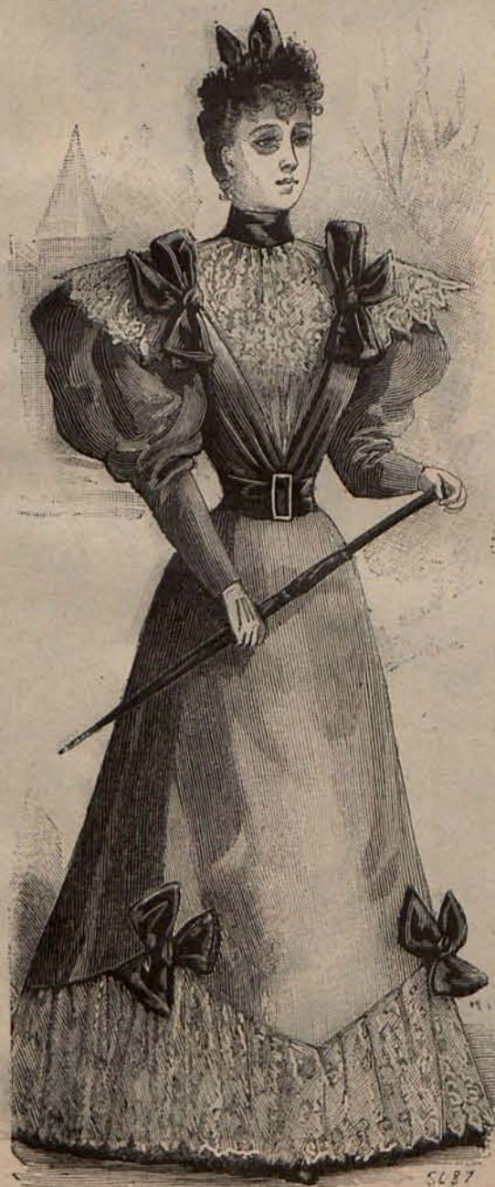
Núm. 5.—Traje para campo.