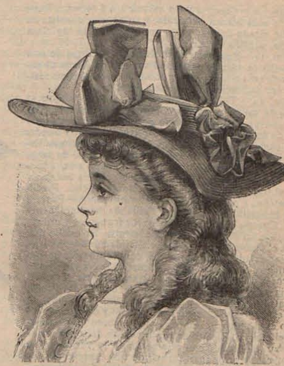
Núm. 14.—Sombrero de playa para niña de 10 á 12 años.

Núm. 10.— Cuello de encaje. —Este cuello es de encaje irlandés color crudo, formando en los contornos picos Eiffel , y puede ser empleado igualmente para adornar trajes de señoras, señoritas y niñas.