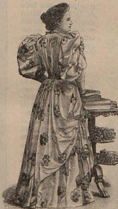
Núm. 6.—Espalda del modelo grabado núm. 4.

Gracias á esto podía al llegar á una población recibir á las autoridades ó asistir á un banquete sin que se notase en su traje el menor desperfecto. Una vez al llegar á Marsella cayó sobre él una lluvia torrencial desde la Estación hasta el Palacio del Municipio, donde debía hospedarse, recibir y presidir un banquete aquella misma tarde. En pocos minutos cambió de traje, y mientras todos los que acudieron á saludarle y se sentaron á la mesa estaban hechos una lástima, Carnot apareció tan pulcro y tan