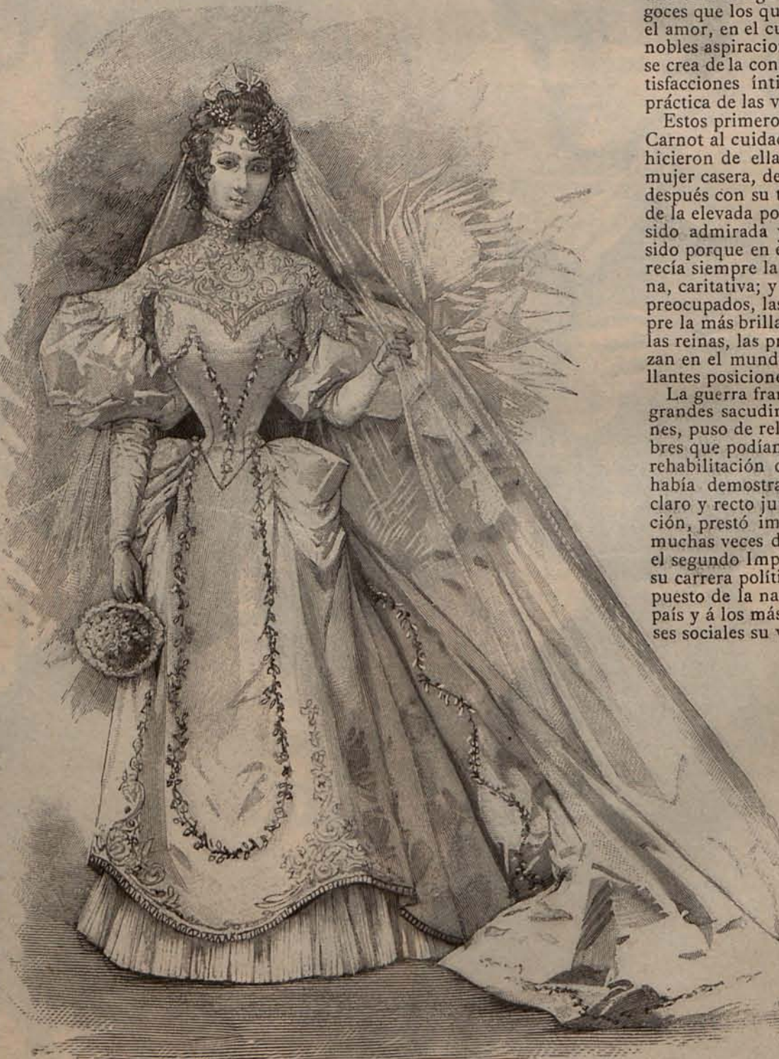
Num. 3.—Toilette de novia.

dan una idea exacta del estado moral y social, no deja de experimentar emociones ni de deducir consecuencias; y creo no equivocarme al afirmar que tanto en Francia como en los demás países de Europa, son muchas las mujeres á quienes todavía interesa vivamente cuanto se relacione con el ilustre magistrado muerto violentamente, con su esposa, con sus hijos; porque éstas páginas de la novela real, son más conmovedoras que las de las novelas imaginadas.