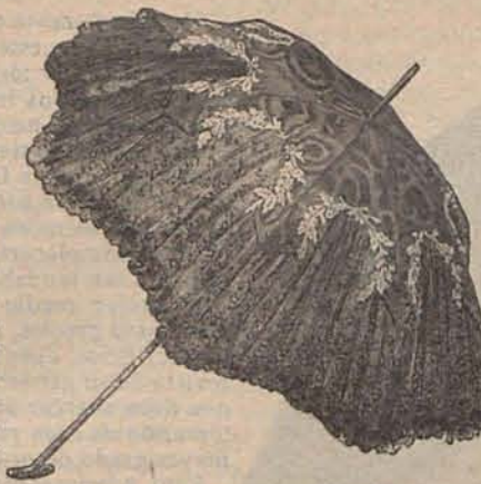
Núm. 12.—Sombrero de tul bordado.

Núm. 1.— Trajes para campo. —(1) De lanilla ondulada color guinda. Falda campana y cuerpo blusa, formando en el delantero y la espalda anchas palas sencillas. El escote se cierra con un lazo de gasa de seda blanca. Mangas de pernil, con hombreras de encaje. Sombrero de paja color guinda, adornado con dos plumas negras y un grupo de flores rosadas. Tela necesaria para el traje, 9 metros de lanilla ondulada, doble ancho. Precio del patrón: 3 pesetas.—(2) De muselina de lana azul porcelana. Falda campana, guarnecida