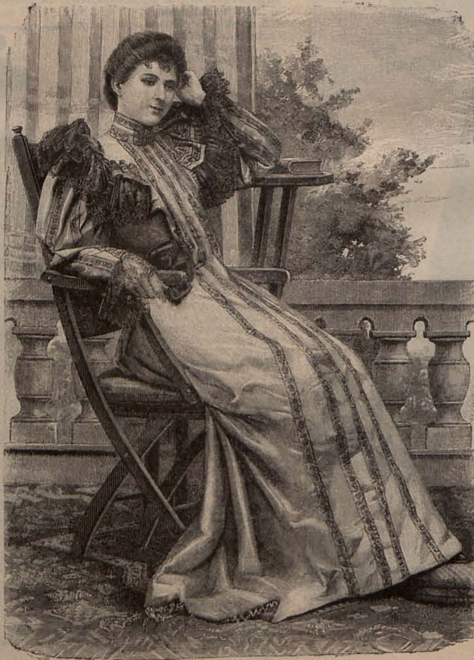
Núm. 17.—Bata elegante.

He sido durante treinta días una especie de... cris- tiano errante ; y este rápido y agradable viaje, consa- grado en primer término al estudio de las mejoras que LA ULTIMA MODA irá dando á conocer á sus constantes y cada vez más numerosas favorecedoras, me ha per- mitido al mismo tiempo que recreaba mi vista, pensar continuamente en las señoras españolas y americanas que tanto afecto profesan á nuestra revista, y que por lo mismo merecen el afán con que nuestro Director procura complacerlas, y el esmero con que todos coope- ramos á tan laudable empresa.