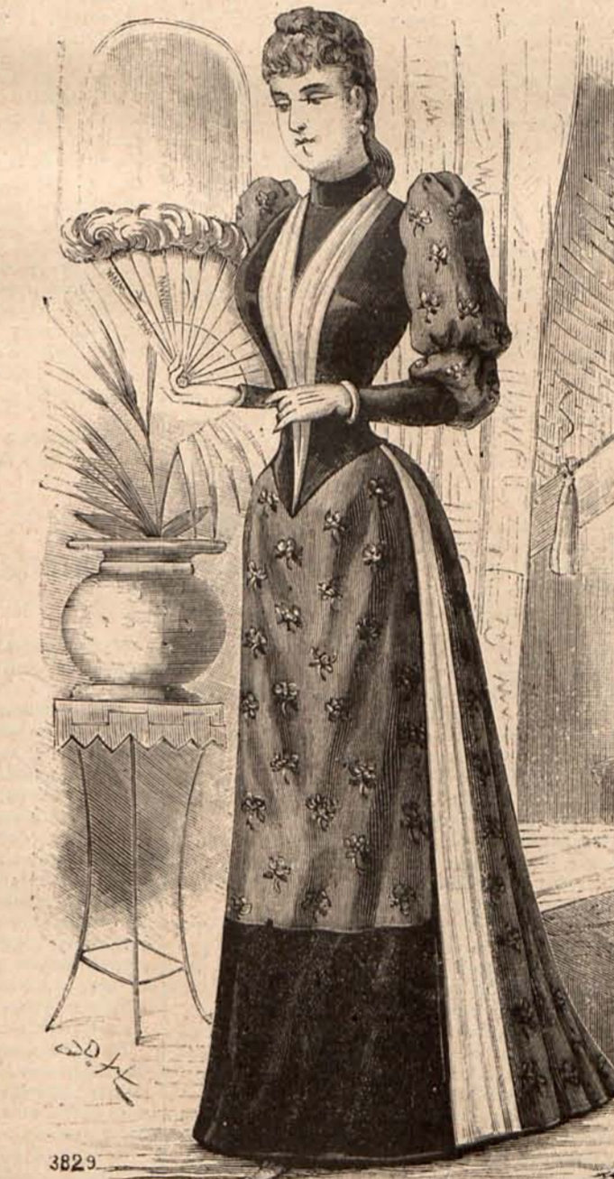
Núm. 19.—TRAJE PARA «FIVE O'CLOCK»