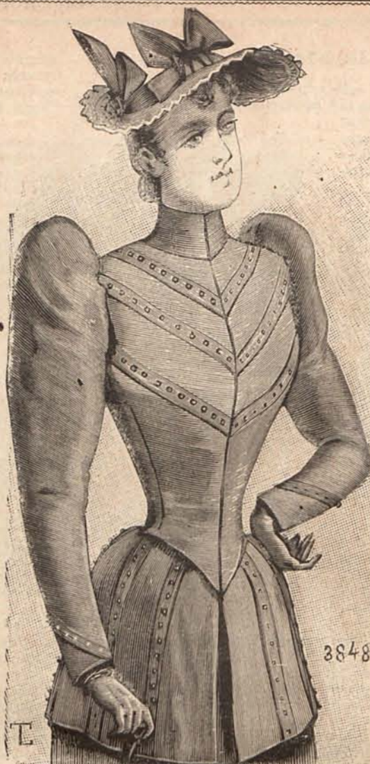
Núm. 12.—CUERPO PARA TRAJE DE PASEO

arabescos de soutache beige . Mangas lisas. Cuello y carteras de terciopelo. Sombrero de crin beige , adornado con galones de terciopelo y un grupo de plumas.—3. o Traje para visita. Es de cachemir azul. Levita de lo mismo, con greca de terciopelo, abierta sobre un delantero fruncido de surah crema . Mangas huecas. Capelina de cachemir, adornada con lazos de cinta.