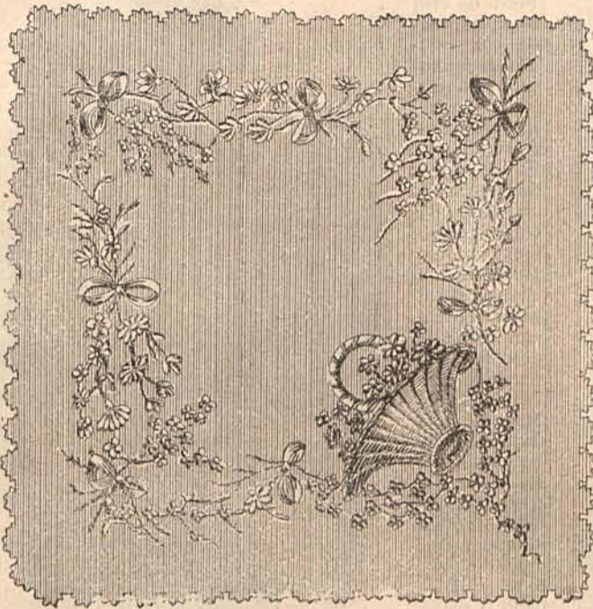
NÚM. 7.—PLATILLO PARA JARGÓN

Núms. 1, 2, 3 y 4. Toilettes de Primavera. —1.º Traje para señora joven. Falda recta de pekin listado de tonos gris claro y azul oscuro. Chaqueta de seda gris claro, con aldetas puntiagudas y plegadas. Los delanteros se cierran con una sardinetas de pasamanería perlada sobre un plastrón liso. Aplicaciones puntiagudas de terciopelo azul oscuro, ASo IV.—NÚM. 170,