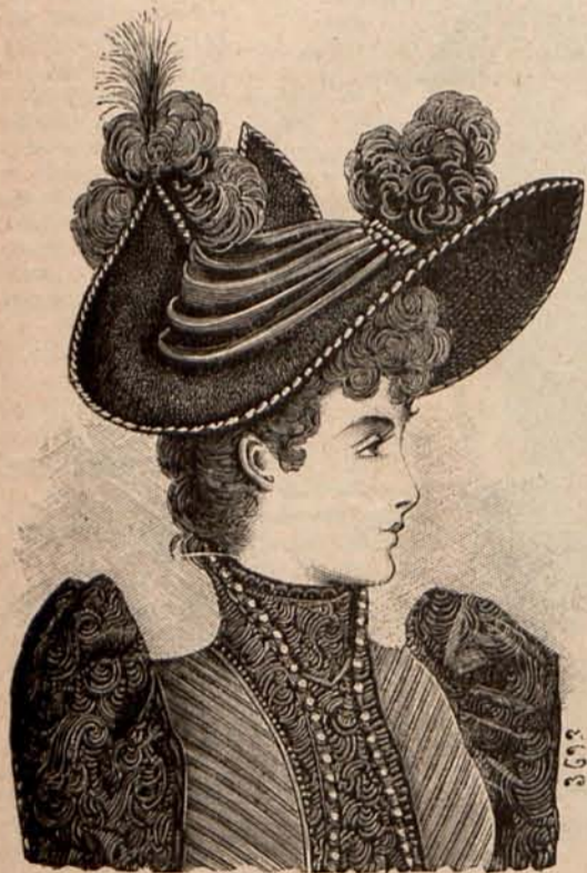
Núm. 16.—SOMBRERO PARA PASEO