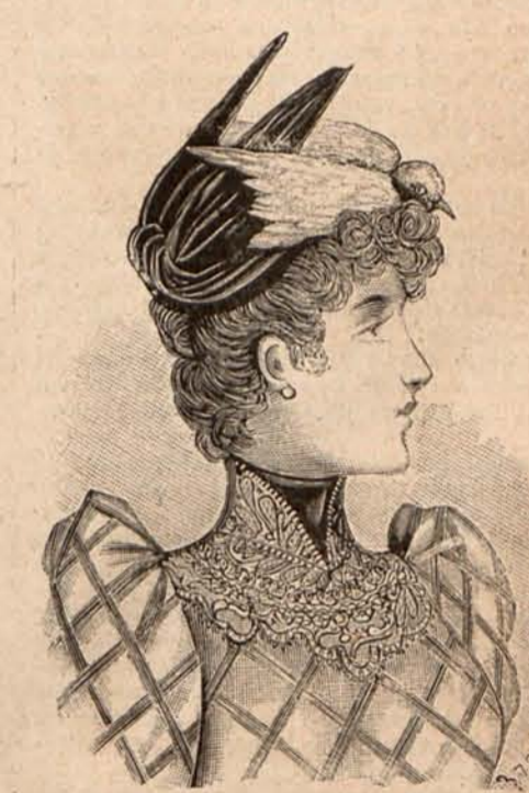
Núm. 20.—SOMBRERO TOCA

A todas las cartas que exijan contestación por el correo, deberá acompañarse un sello de 15 céntimos.