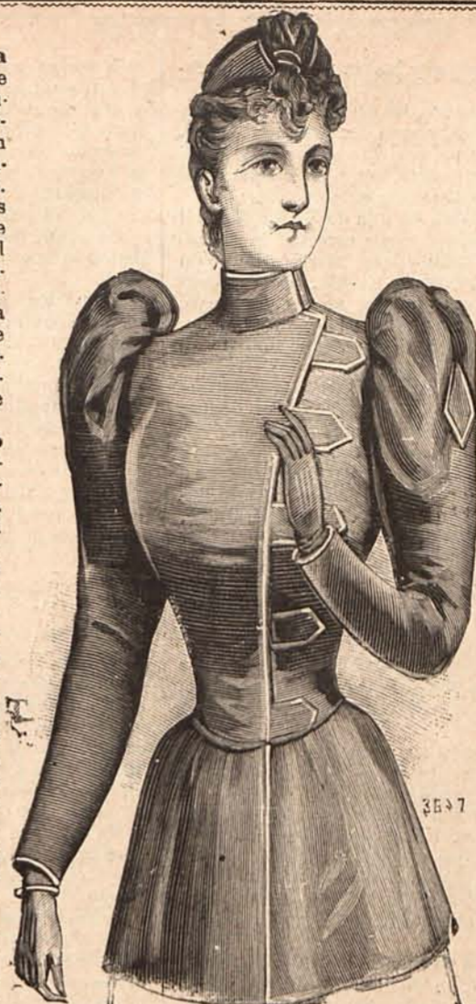
Núm. 14.—CUERPO PARA TRAJE DE CALLE

Núm. 20. Sombrero toca.—De terciopelo verde mirto, drapeado y formando dos altas y puntiagudas cocas. Se adorna con un pájaro fantasía colocado en el centro de delante.