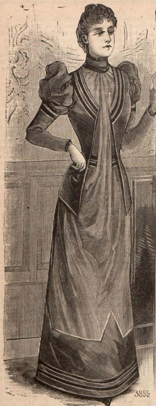
Núm. 11.—TRAJE PARA RECIBIR

guarnecen la parte inferior de los delanteros. Cuello Médicis , de pasamanería perlada. Mangas lisas, con aplicaciones de terciopelo y pasamanería perlada. Sombrero de terciopelo, adornado con un grupo de cocas de cinta de pekín .—2. o Traje para señorita. Falda de lanilla beige , plegada detrás y drapeada en el delantero. Chaqueta larga de fino paño, color pan tostado. El delantero izquierdo se adorna con una solapa de terciopelo nutria, y el derecho se abre sobre un plastrón de terciopelo bordado con