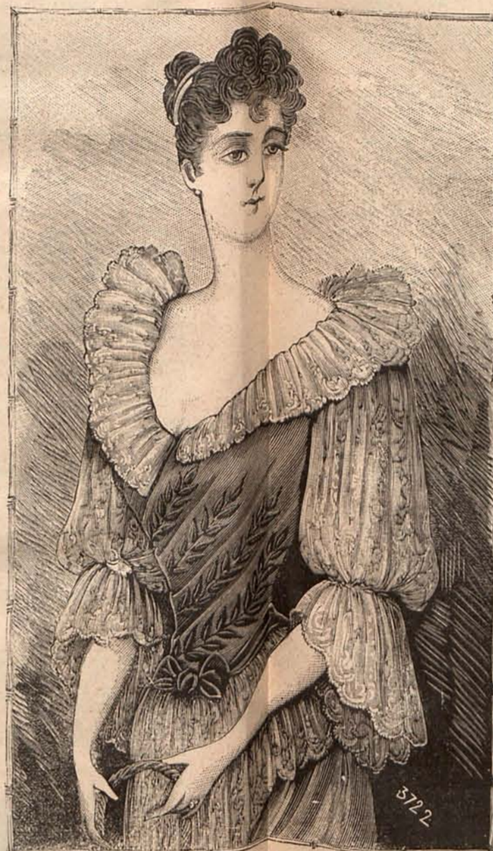
Núm. 18.—CUERPO ALTA NOVEDAD PARA «SOIRÉE»

Núm. 20. Sombrero toca.—De terciopelo verde mirto, drapeado y formando dos altas y puntiagudas cocas. Se adorna con un pájaro fantasía colocado en el centro de delante.