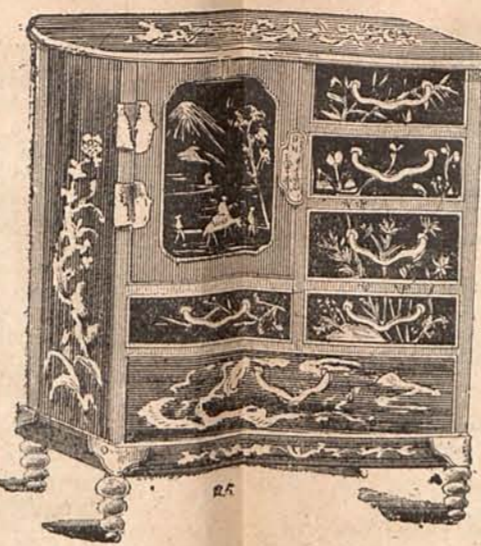
Núm. 13.—MUEBLECITO JAPONÉS

Núm. 14. Cuerpo para traje de calle.—De paño marrón, con adetas sobrepuestas y mangas lisas. Se guarnece con un estrecho galón de seda beige .