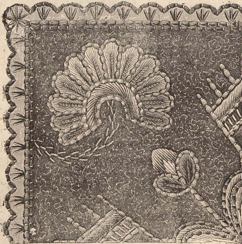
Núm. 5.—PLATILLO PARA LÁMPARA

la Moda los elementos para componer su obra, que no sólo despierta admiración, como la del artista y la del poeta, sino que es más trascendental aún, puesto que influye en su presente y en su porvenir, y en el presente y en el porvenir de las personas unidas á ella por los lazos íntimos de la familia ó los necesarios de la sociedad.