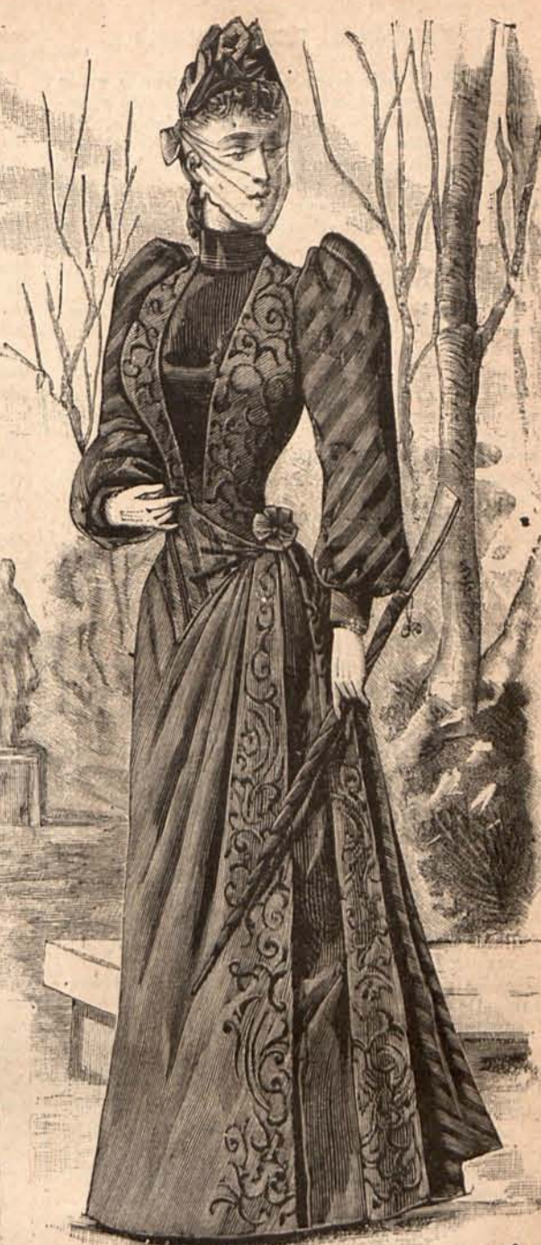
Núm. 15.—TRAJE PARA VISITA

Núm. 18. Mueblecito japonés. —Este lindo mueblecito es de maderas finas, y se adorna con motivos japoneses, bordados ó pintados sobre un fondo negro mate.