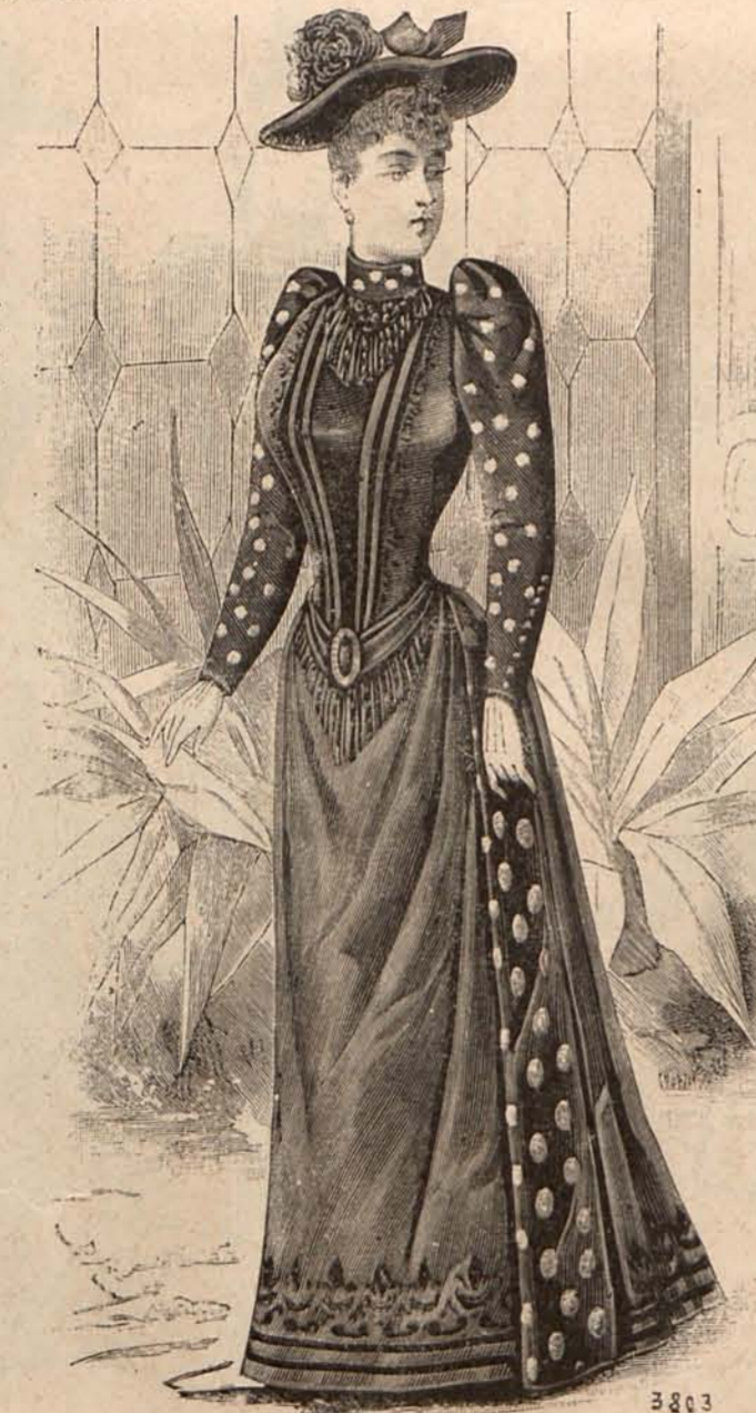
Núm. 17.—TRAJE PARA CALLE