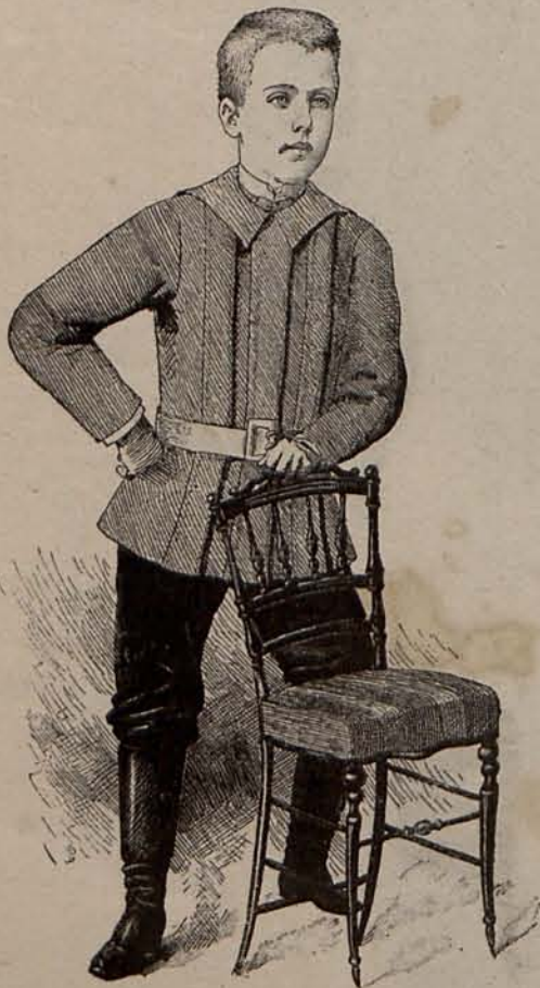
Núm. 4. Traje para niño de 5 á 7 años.