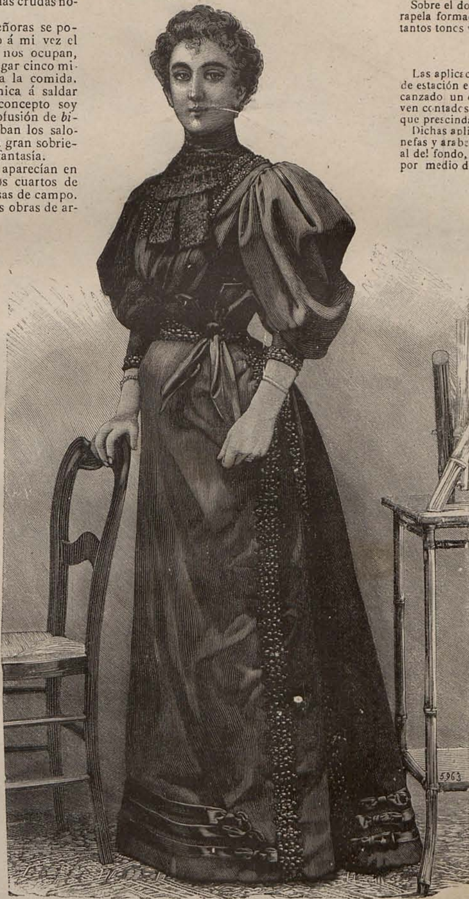
Num. 6.—Traje para comida de ceremonia.

El escote del cuerpo se cortará en redondo, cosiendo á sus contornos un ancho cuello vuelto de seda otomana y encaje, armado con linón y cerrado con un broche de turquesas. Un ancho cinturón de seda azul cerrado invisiblemente, servirá de gracioso complemento al cuerpo.