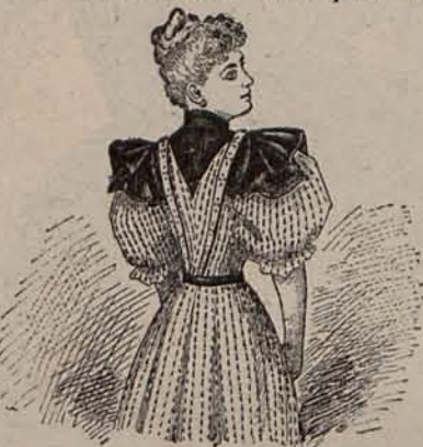
Núm. 9.—Cuerpo para traje de recibir.