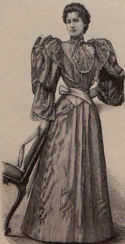
Núm. 11.—Bata de franela rayada

Núm. 11.— Bata de franela rayada .—La espalda modela el talle y los delanteros, sin pinzas, se fruncen