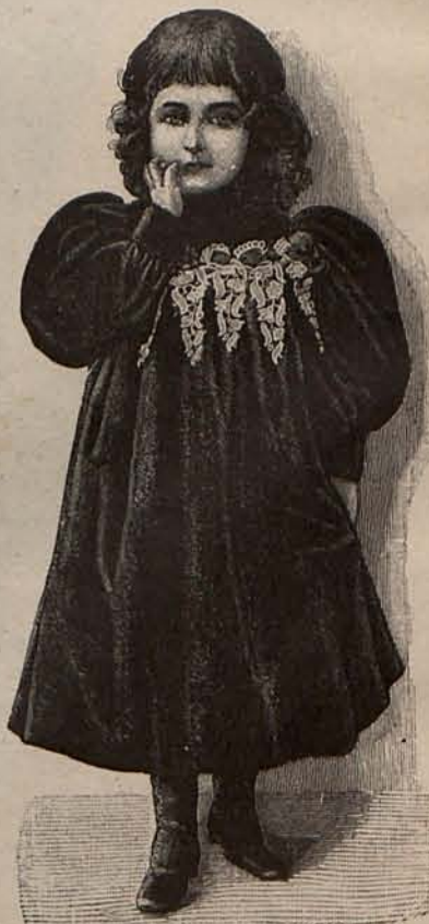
Núm. 5.—Traje para niña de 2 á 4 años.