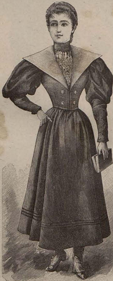
Núm. 3.—Traje para niña de 10 á 12 años