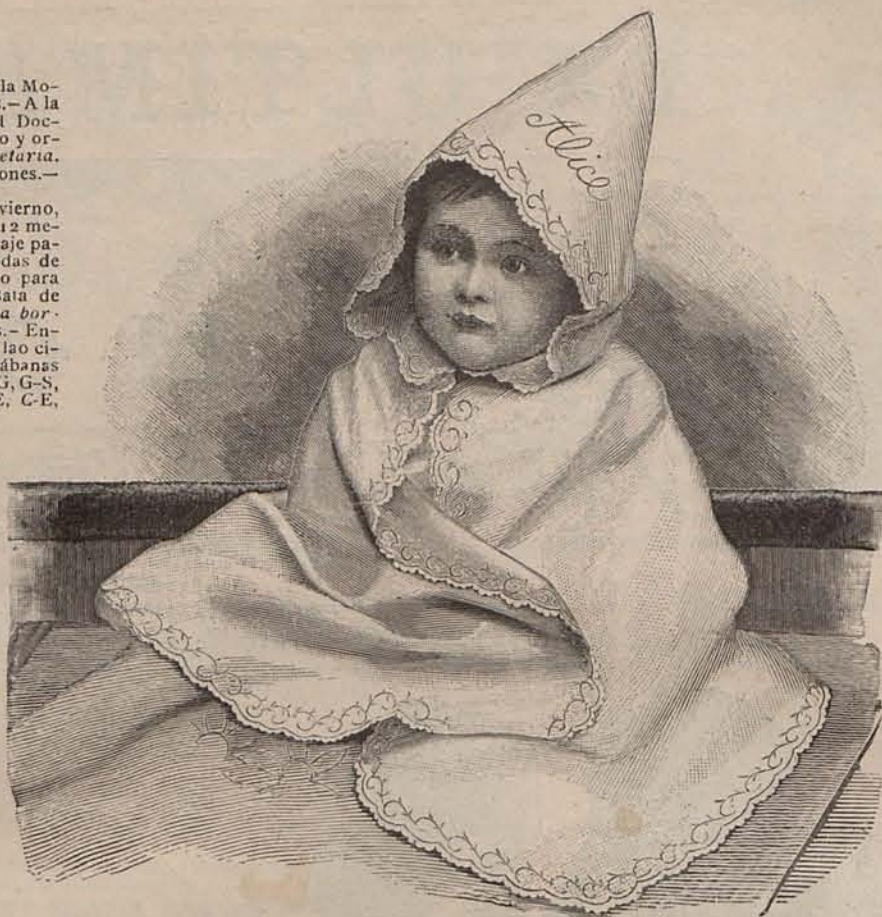
Núm. 2. Capelina inglesa para niño de 1 á 12 meses

Para los sombreros ha escogido los colores rusos y las dobles alas negras de mesa las vajillas de plata labrada