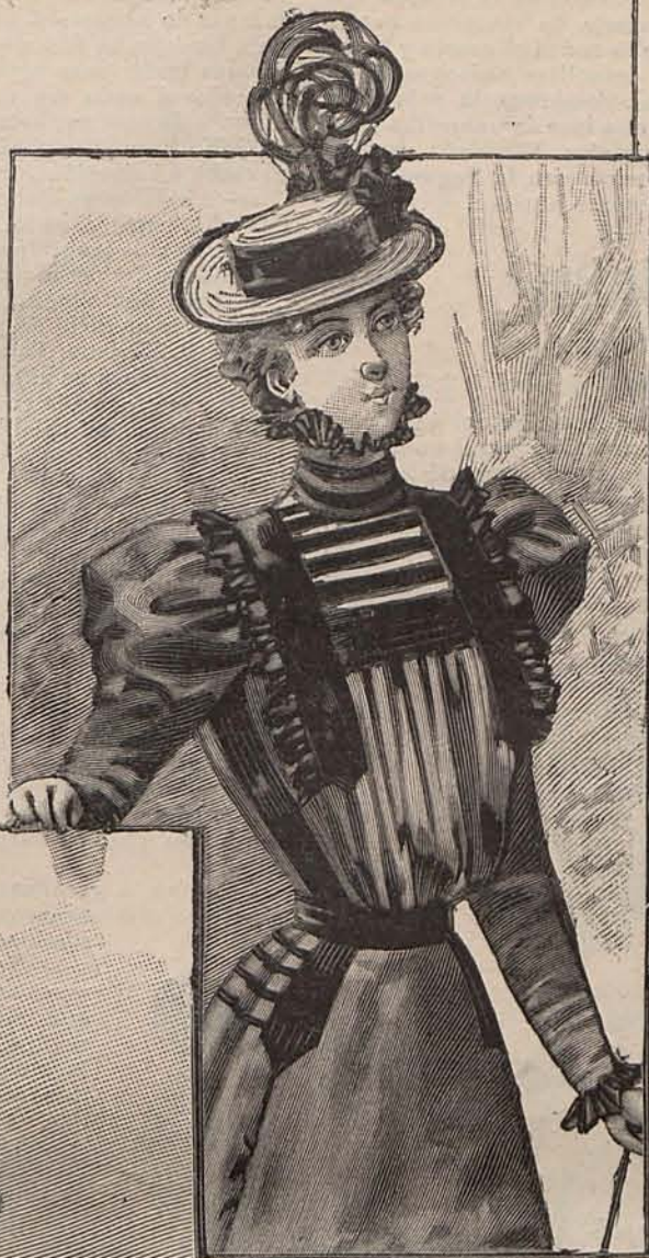
Núm. 27.—Traje para mañana.