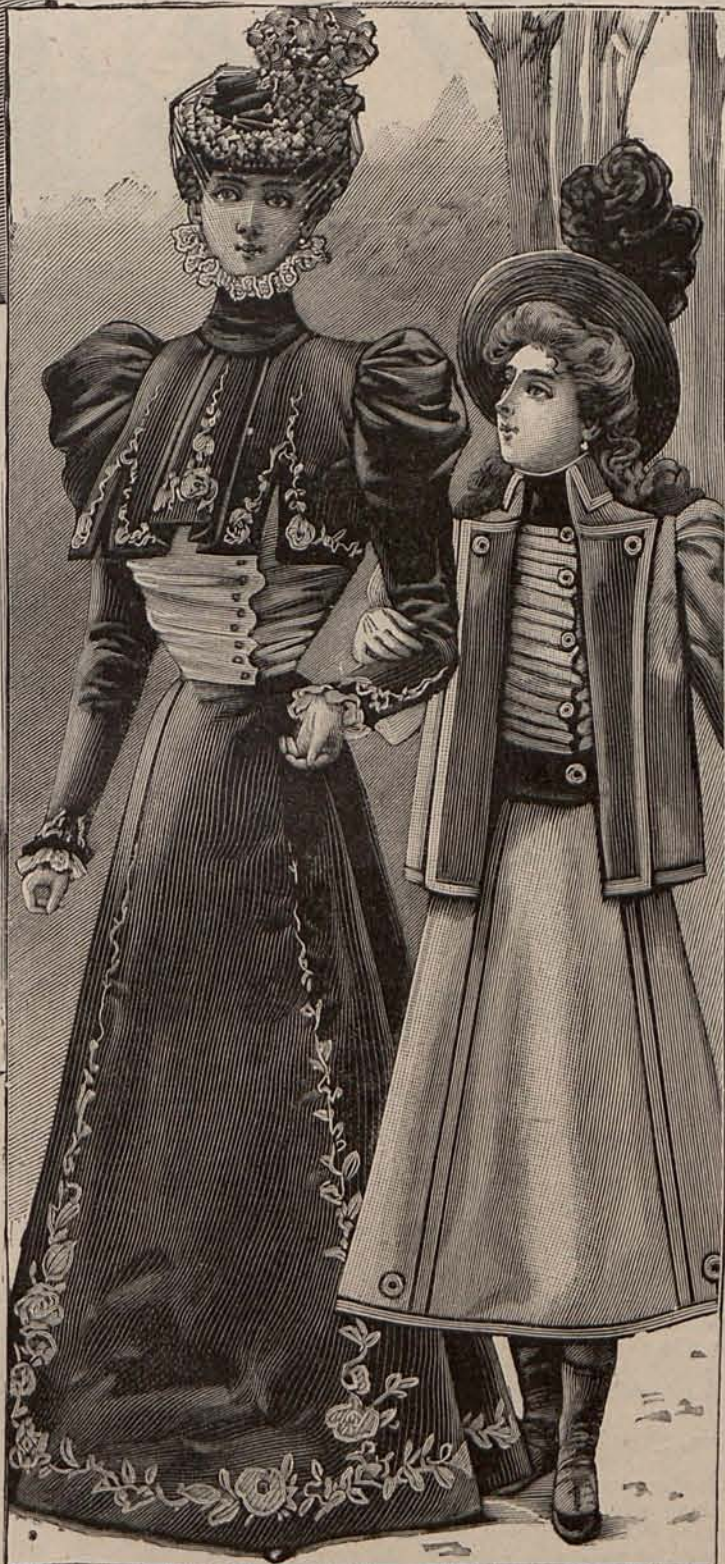
Núms. 29 y 30.—Trajes para paseo para señora y niña de 11 á 13 años.

El modelo núm. 21, es de lana labrada color cobre. Falda lisa y cuerpo corto, listado por anchas palas sobrepuestas. Su adorno consiste en un fantástico cuello y un ancho cinturón de terciopelo color dalia. Mangas semi-huecas. Toca de paja rizada color cobre, adornada con un doble lazo de terciopelo color dalia. Tela necesaria para el traje, 9 metros de lana y 2 de terciopelo. Precio del patrón: 3 pesetas. El modelo núm. 22, está confeccionado con lanilla glaseada y terciopelo de dos tonos verdes. La falda, de lana, luce siete volantitos de terciopelo, interrumpidos en los costados por un ancho canesú abullonado, al que sirve de marco un volantito de terciopelo. Mangas de lana. Cuello y puños de terciopelo. Sombbrero de paja de seda verde pálido, adornado con lazos y plumas verde oscuro. Tela necesaria para el traje, 7 metros de lanilla glaseada y 8 de terciopelo. Precio del patrón: 3 pesetas.