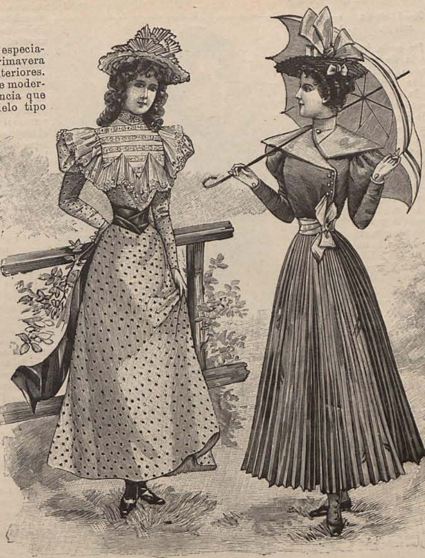
NÚMEROS 6 Y 7.

heliotropo y terciopelo verde hoja de violeta, adornada con un fantástico pájaro de tonos verdosos y negros. Dediquemos ahora algunos párrafos á los trajes y adornos de las niñas. Para casa, colegio y paseos matinales, las niñas no deben usar en Primavera y Verano más que trajes de batista lisa, floreada, rizada, calada, etc., de pálidos colores, tan bonitos como fáciles de lavar y planchar. Un modelo sumamente gracioso consiste en una falda ligeramente acampanada, de batista listada de tonos rosa y blanco, guarnecida en el bajo con tres volantitos fruncidos de batista lisa color de rosa. Cuerpo-blusa, formando en la parte superior de espalda y delanteros pliegues de lencería de tamaños escalonados, que dibujan un puntiagudo canesú. Los contornos del ancho cuello vuelto que rodea el escote, las hombreras y bocamangas, lucen volantitos análogos á los de la falda. Cinturón