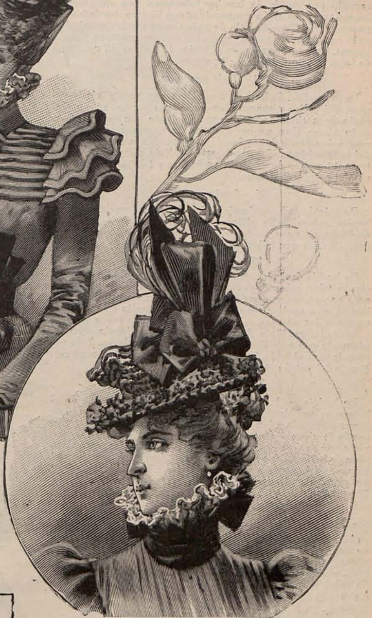
Núm. 31.—Sombbrero Anita.