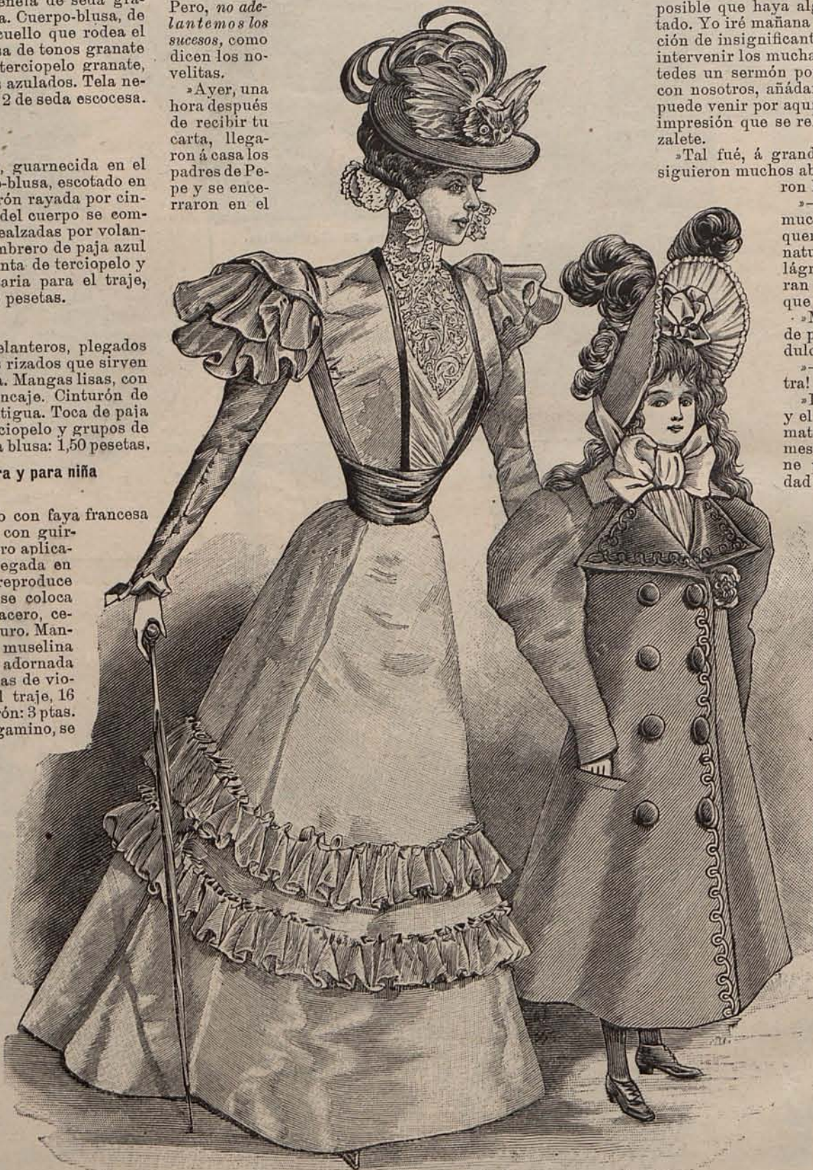
Núm. 33.—Traje para señorita.—Núm. 34.—Sobretudo de entretiempo para niña de 9 á 11 años.

Ayer, una hora después de recibir tu carta, llegaron á casa los padres de Pepe y se encerraron en el