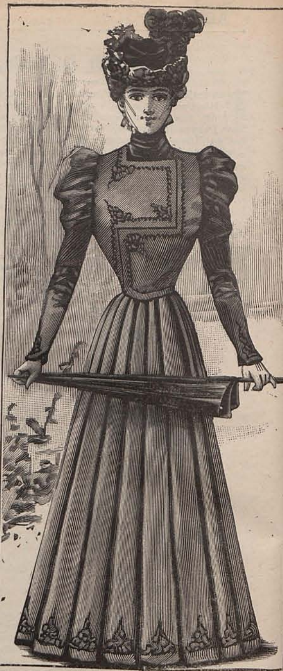
Núm. 23.—Traje para calle.

De lanilla oéige, combi- nada con seda color hueso. Falda de lani- lla, abierta en el costado de- recho para de- jar al descu- bierto una qui- lla cónica de seda. Chaqueti- ta torera, de lana, adornada con una fila de botones de es- malte y pun- tiagudas sola- pas de seda. Esta chaqueti- ta se coloca so- bre un cuerpo- blusa de seda, fruncido en la cintura y abu- llonado en el escote. Mangas lisas. Toca de paja de seda oéige, adorna- da con dos plu- mas mordora- das. Tela nece- saria para el traje, 8 metros de lanilla y 4