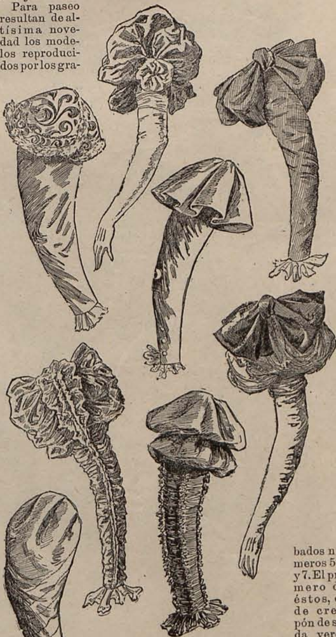
NÚMEROS 8 Á 15.

Para paseo resultan de altísima novedad los modelos reproducidos por los gra-