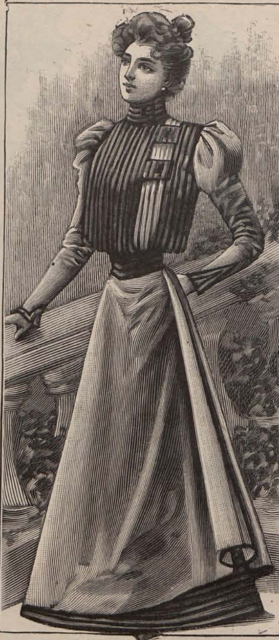
Núm. 20.—Traje para recibir

Amplia falda de seda, listada de tonos verde musgo y cobre. Chaquetita, en- tallada, del pri- mero de los dos tonos citados, cerrada por me- dio de sardine- tas abullonadas sobre una cami- seta-chorrera de encaje crema. Mangas semi- huecas, forman- do bocamangas acampanadas, guarnecidas con vuelillos de en- caje. Sombrero