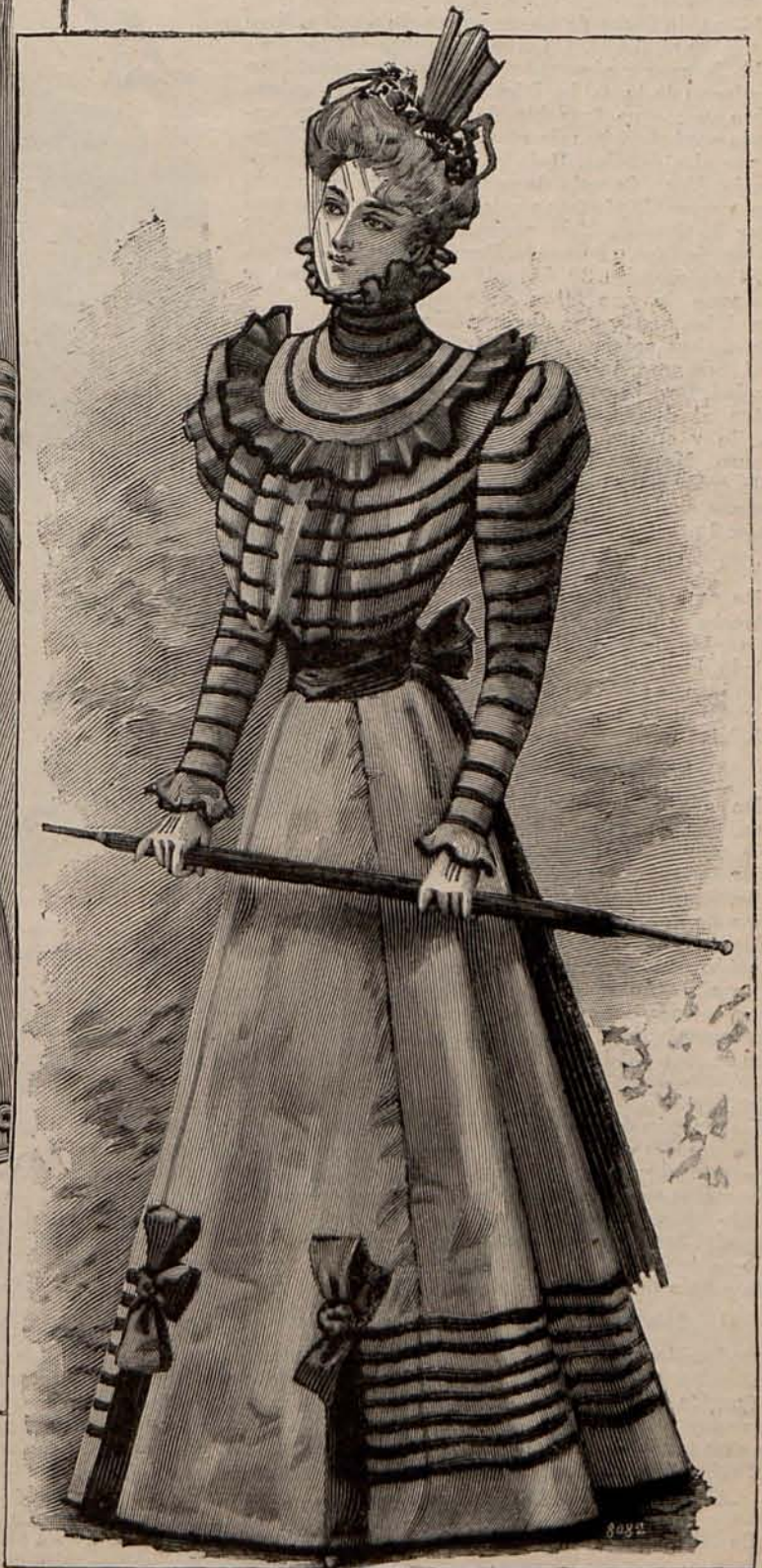
Núm. 32.—Traje para visita.

De muselina de lana color Corinto. Falda plegada á palas. Cada una de éstas, luce en el bajo una ligera aplicación de pasamanería de seda negra. Cuerpo corto, caprichosamente