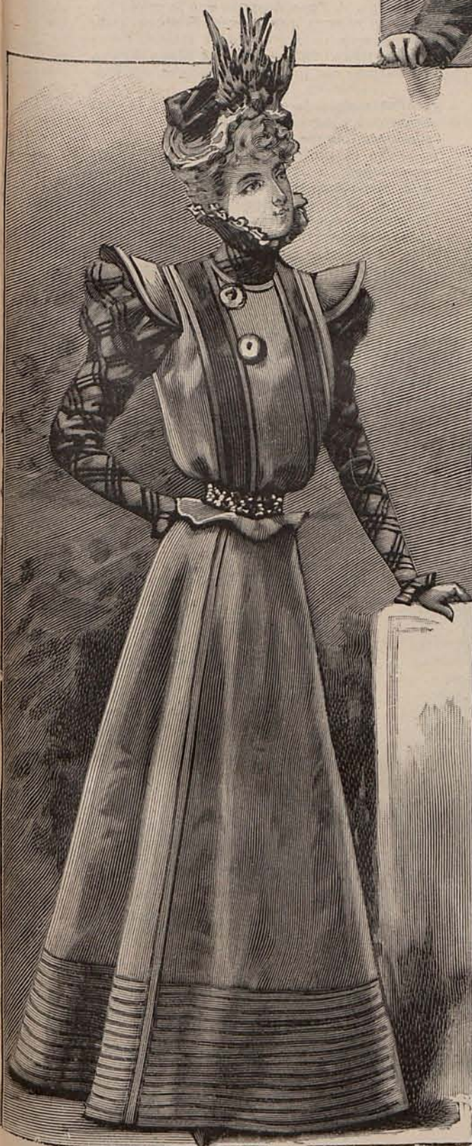
Núm. 26.—Traje para calle.