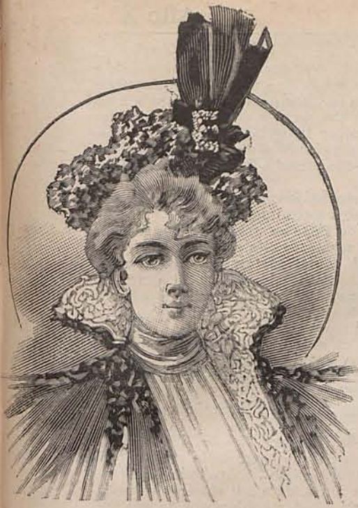
Núm. 25.—Sombbrero Aliana.