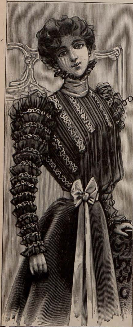
Núm. 19.—Blusa alta novedad.

Es de seda otomana verde musgo, guarnecida con triples volantes de muselina de seda rizada mecánicamente y una ancha cenefa bordada con fina soutache de seda negra. Los delanteros se cruzan sobre el pecho á modo de fichú , anudándose graciosamente en la espalda. Sombrero de paja de seda, verde pálido, con el