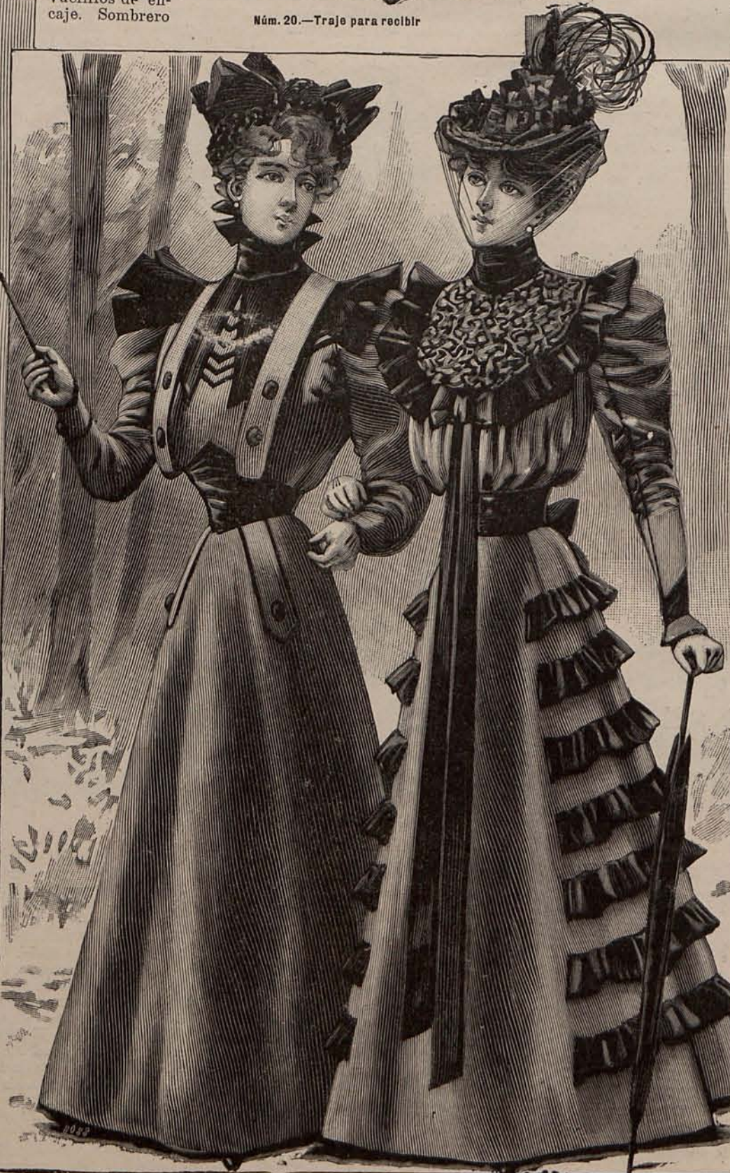
Núms. 21 y 22.—Trajes para paseo.

Es de seda otomana verde musgo, guarnecida con triples volantes de muselina de seda rizada mecánicamente y una ancha cenefa bordada con fina soutache de seda negra. Los delanteros se cruzan sobre el pecho á modo de fichú , anudándose graciosamente en la espalda. Sombrero de paja de seda, verde pálido, con el