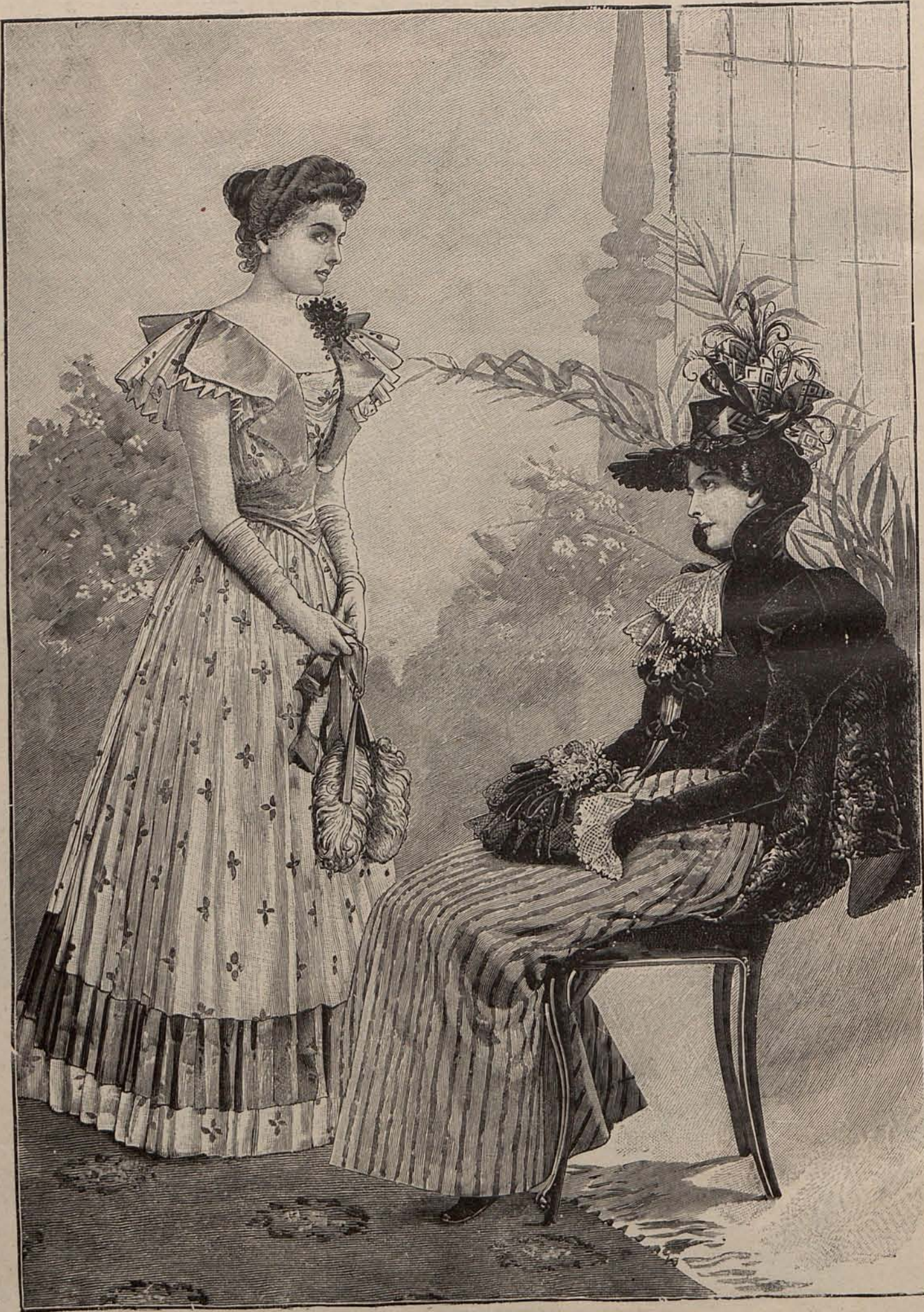
Núm. 2.—Traje para soirée .—Núm. 3.—Traje para visita.

Es verdad que hoy no se hace el arte por el arte; que el pintor como el político, como el negociante, aspira á adquirir pronto una fortuna. Mientras que los norteamericanos y los rusos han pagado sumas exorbitantes por los cuadros ha habido estímulo; y la seguridad de alcanzar el premio merecido, ha contribuido á desarrollar cualidades latentes, proporcionando honra y provecho á muchos artistas.