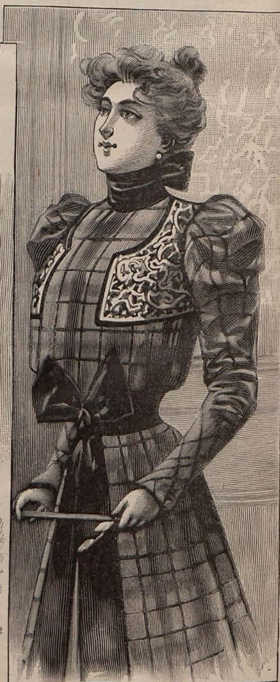
Núm. 24.—Traje para casa.

ala ondulada y la copa, alta, adornada con un de seda. Precio del patrón: 3 pesetas.