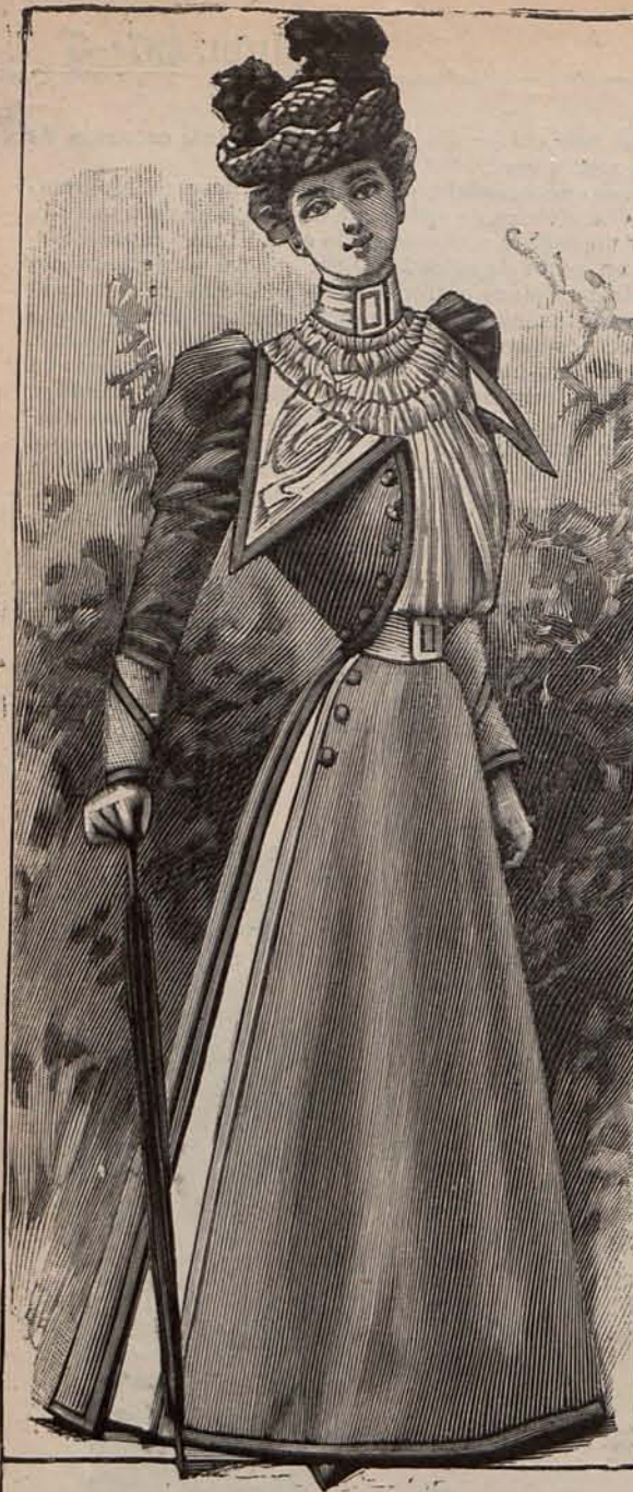
Núm. 18.—Traje para paseo.

gran ramo de margaritas y follaje. Sombri- lla de seda verde agua. Precio del patrón de la esclavina: 1,50 pesetas.