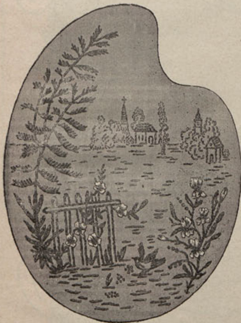
Núm. 2.—Labor de la pantalla núm. 1, tamaño natural.

los contornos del dibujo, operación que resulta sencillísima, merced á la transparencia de la tela. Luego y ántes de proceder al bordado, se monta el fondo en la armadura con lo que se evita el tener que colocarlo en un bastidor, lo cual resulta una ventaja indiscutible tratándose de tejido tan delicado como la muselina de seda. Para el bordado del pai-