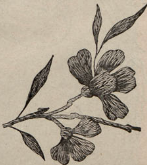
Núm. 6.—Detalle de la cestita núm. 5.