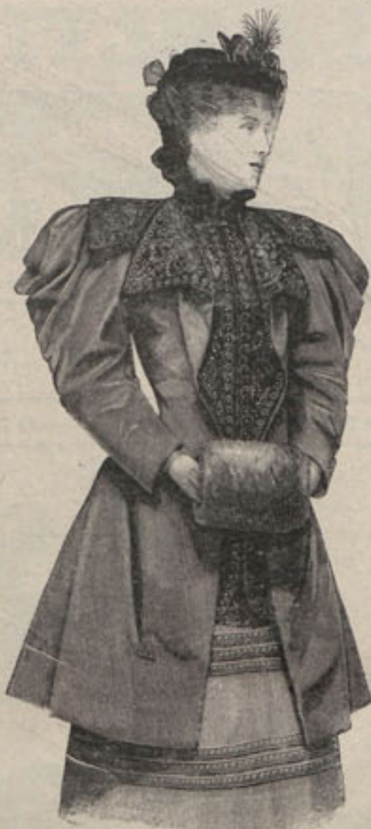
Núm. 2.—Chaqueta Andrea.

En los trajes de calle no se han introducido grandes novedades.