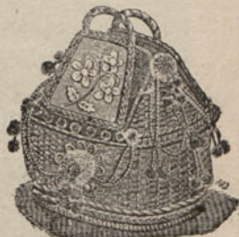
Núm. 5.—Cestita para guardar labor.

Números 5 y 6.—Cestita para guardar la labor.—Esta linda cestita es de mimbres barnizados y se recomienda por lo cómodo de forma. Las dos tapas aparecen forradas de paño gris ceniza, tejido que sirve de fondo á un lindo motivo representado en parte por el grabado número 5. Para éste motivo se emplean sedas matizadas de tonos verde claro para los tallos, coral y rosa para los pétalos de las flores y verde mediano y verde oscuro para las hojas. Cordones, borlitas y pompones de lana y seda combinadas completan el adorno de la cestita.