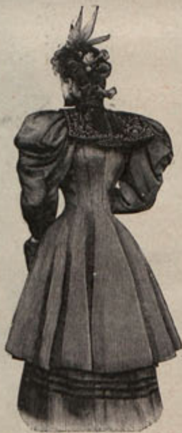
Núm. 4. Espalda del modelo núm. 2.