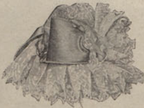
Núm. 9.—Gorra de mañana.

Y no se la debían pagar por indiscreta; pero ya se sabe que las modistas francesas corresponden á los grandes favores que las hacen las señoras españolas de muy mala manera, y con nuestras compatriotas se permiten lo que no se permitirían, de seguro, con las suyas.