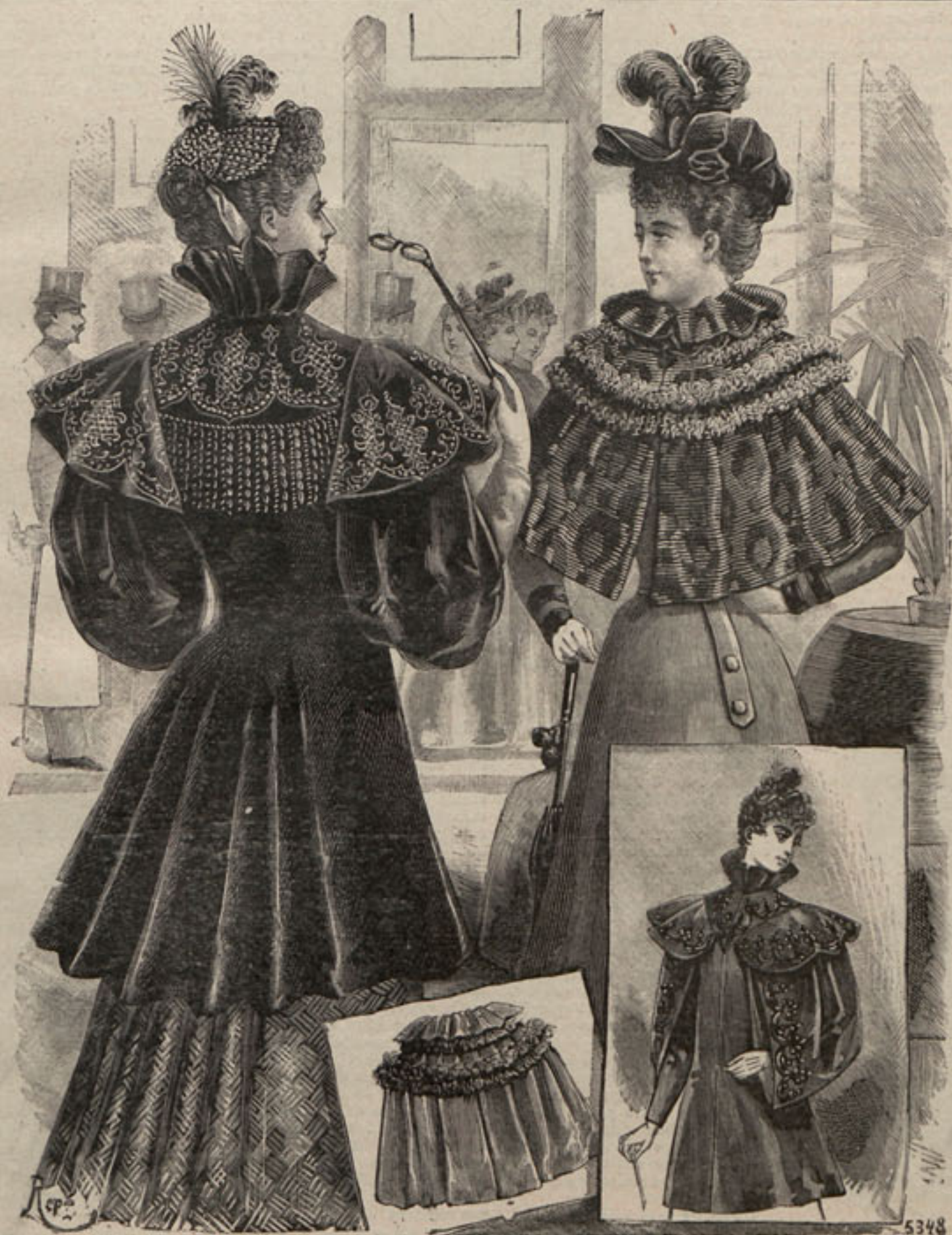
Núm. 1.—Abrigos de invierno.