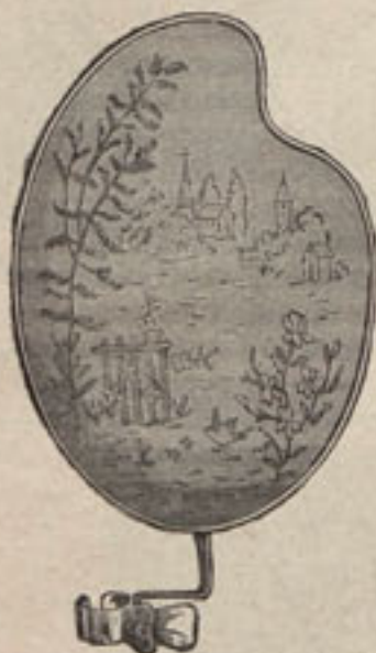
Núm. 1.—Pantalla para vela en forma de paleta.

Núm. 1 y 2.—Pantalla para vela en forma de paleta. —La armadura es de bronce dorado y el fondo de muselina de seda de un tono rosa sumamente pálido. Sobre este fondo se borda el diminuto paisaje representado de tamaño natural por el grabado número 2. Para ejecutar tan linda labor se empieza por pasar ó mejor dicho por calcar en la muselina