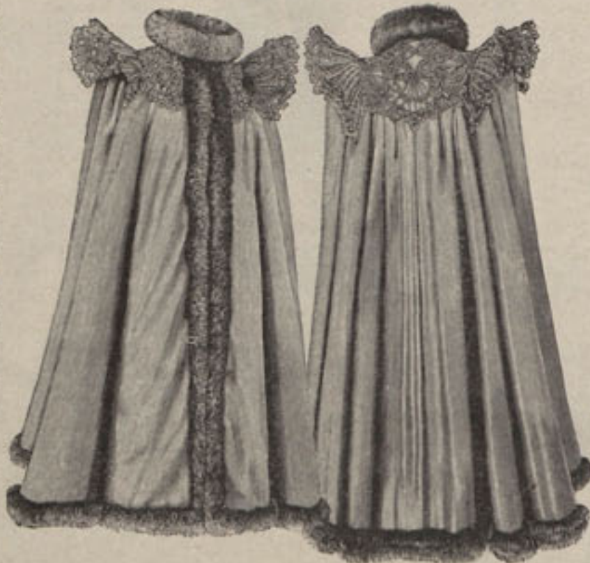
Núm. 8.—Salida de teatro.