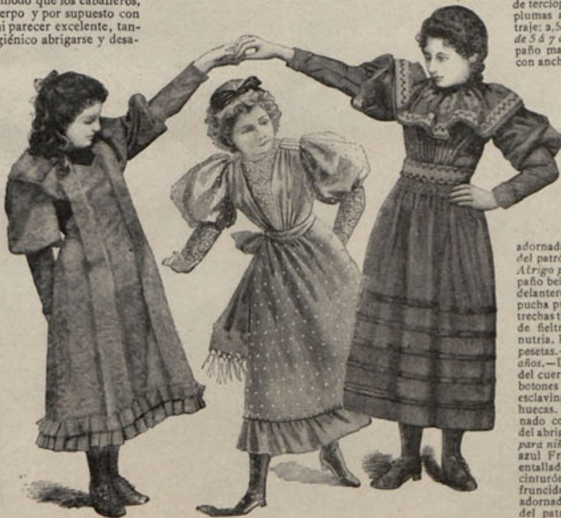
Núm. 6.— Trajes para niñas de 8 á 12 años.