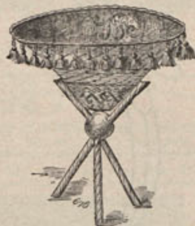
Núm. 4.—Vide-poche de mesa.

Núm. 3.—Acerico en forma de girasol.—El acerico es de terciopelo negro y la almohadilla interior está rellena de serrín. Los rizados pétalos de la flor se simulan con pedacitos de cinta amarilla dispuestas en la forma que indica el modelo. La primera vuelta se compone de 35 pétalos y la segunda de 44. Un grueso