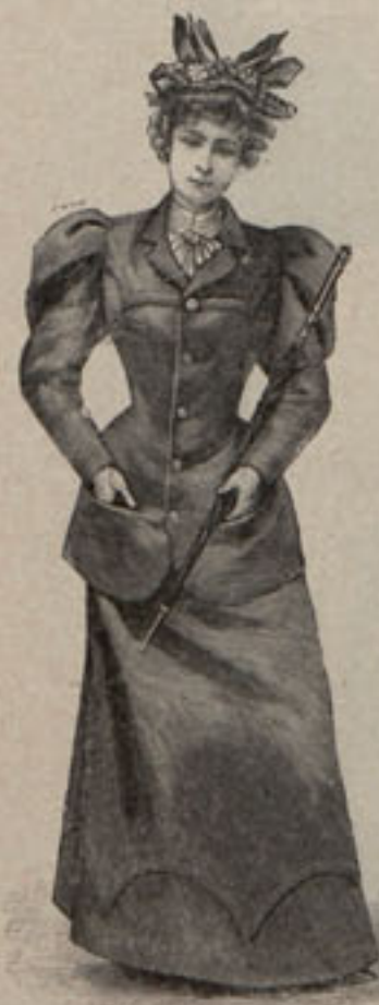
Núm. 3.—Traje corte de sastre.

La última comedia de Sardou, estrenada no hace aún mucho tiempo en París con éxito más que extraordinario, ha dado origen á una novedad que no carece de interés. Consiste en unas corbatas llamadas Sans Gène inspiradas en el gusto de la época de Napoleón, que han sabido captarse desde luego las simpatías de las elegantes parisien-ses. Hé aquí cuatro modelos-tipos de las citadas corbatas, pues, la Moda se ha mostrado en esta ocasión verdaderamente pródiga.—1. Consiste en un lazo ordinario de ancha cinta de moaré turquesa. En torno de las caídas, que son muy cortas, aparece dispuesto un ancho volante de guipure de Venecia que las une entre sí formando en el centro un pliegue cónico.—2. Lazo de cuatro cocas de cinta de raso negro. Del nudo parten dos caídas muy largas encerradas en marcos de rizado encaje.—3. Lazo de dos cocas formado por una ancha tira de crespón de seda negro. Las caídas, que son muy desiguales, lucen anchas cenefas bordadas con hilillo de plata.—4. Este modelo es el más caprichoso de la colección y se compone de un sencillo nudo de seda con dos caídas; la que correspon-