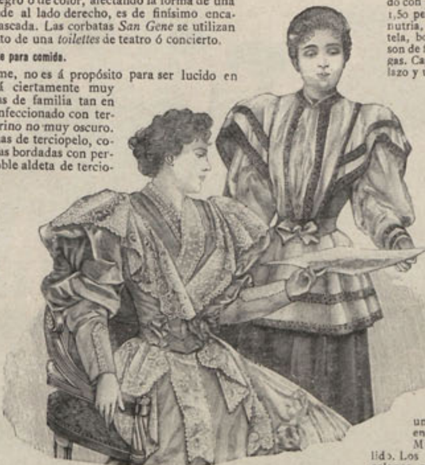
Núm. 5.— Matinées elegantes.

Núm. 1.— ABRIGOS DE INVIERNO. —(1) Chaqueta Olimpia. —De terciopelo del Norte verde muy oscuro. La espalda, muy entallada en el cuerpo, forma en la parte de aldeta cinco pliegues acanalados, y los delanteros son rectos. Cuello escarolado. Mangas de pernil con hombreras mariposa. Bordados de pasamanería perlada constituyen el adorno de esta prenda. Capota de pasamanería adornada con plumas. Precio del patrón de la chaqueta: 2,50 pesetas.—(2) Esclavina Loie Fuller (Espalda y delantero).—Es de seda tornasolada y se adorna con estrechas bandas de chinchilla. El interior se forra con seda capitonada. Sombrero de terciopelo negro, adorna-