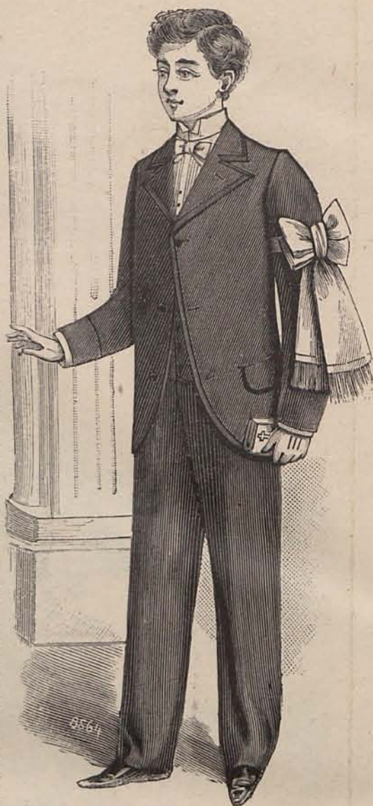
Núm. 32.—Traje de primera Comunión para niño.