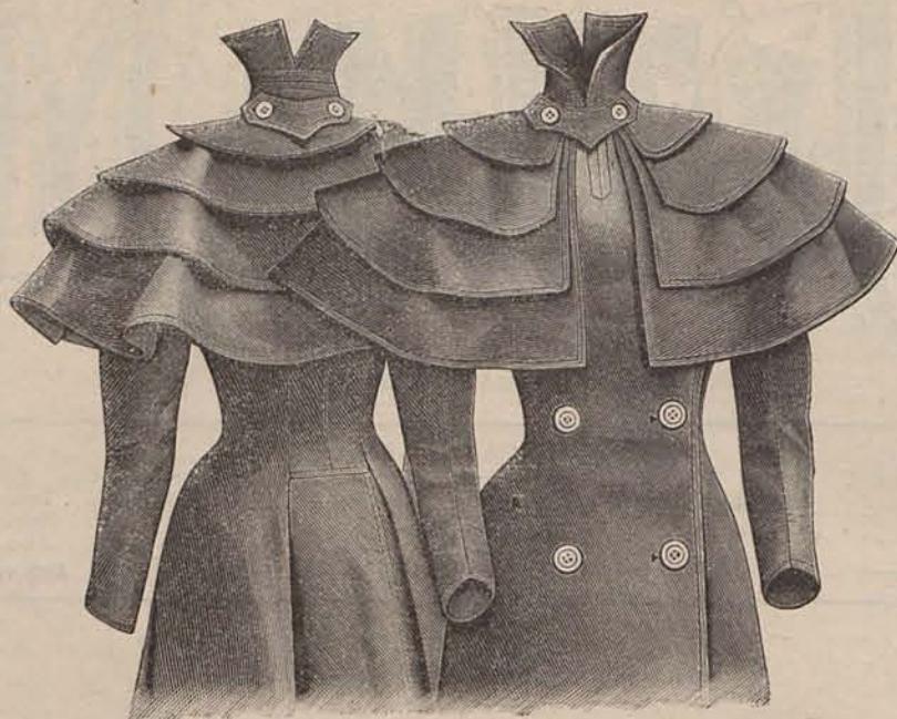
Núms. 4 y 5.—Sobretudo para viaje (Espalda y delantero).

FIGURIN ACUARELA (para la Primera edición y la Edición completa).—Traje de novia y traje de ceremonia.