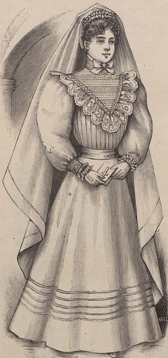
Num. 31.—Traje de primera Comunión para niña.

Núm. 19.—Para señorita.—De lanilla color salmón. Falda lisa y cuerpo corto bor-