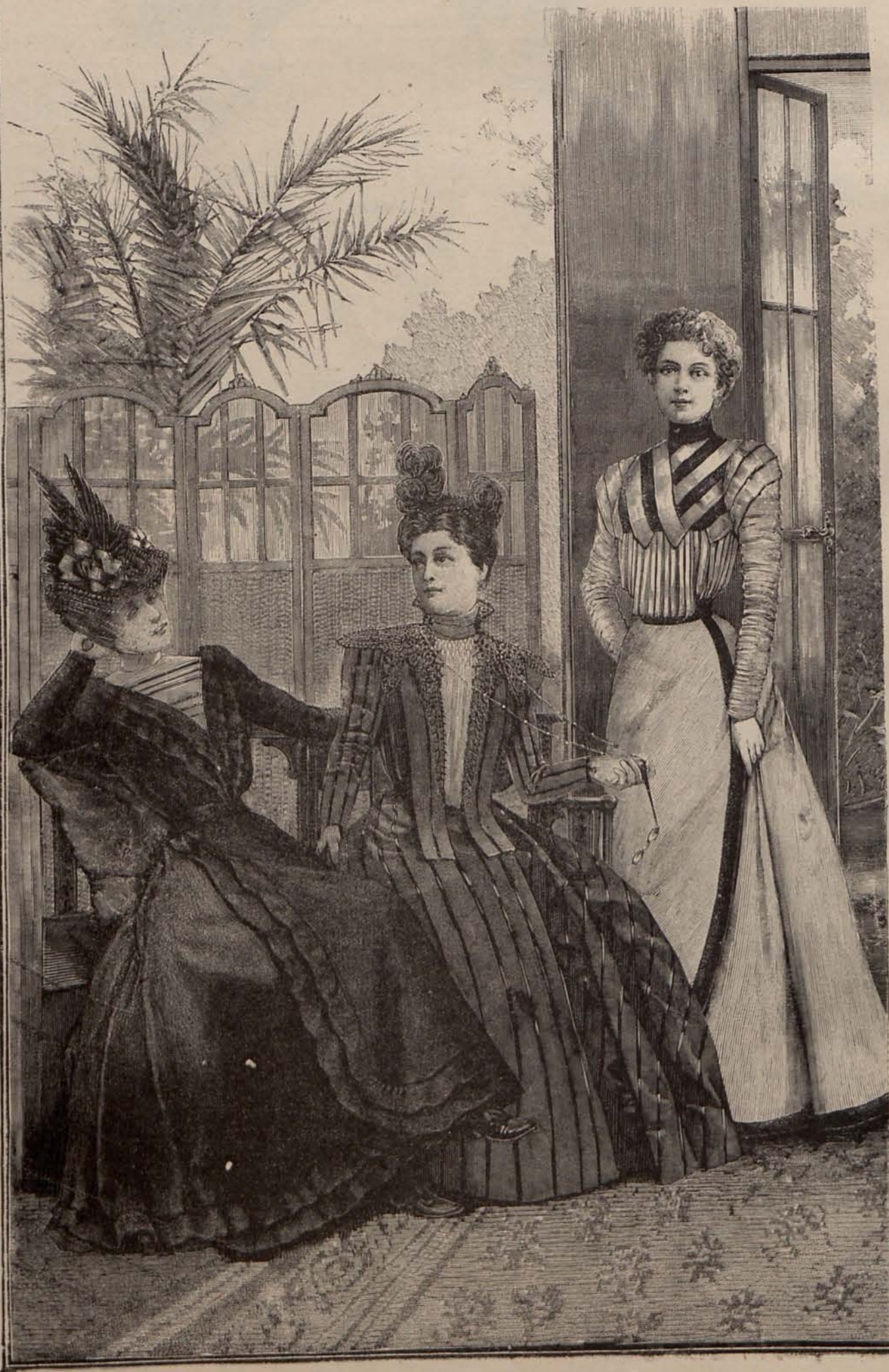
Núms. 6, 7 y 8.—Trajes para visita y traje para recibir.