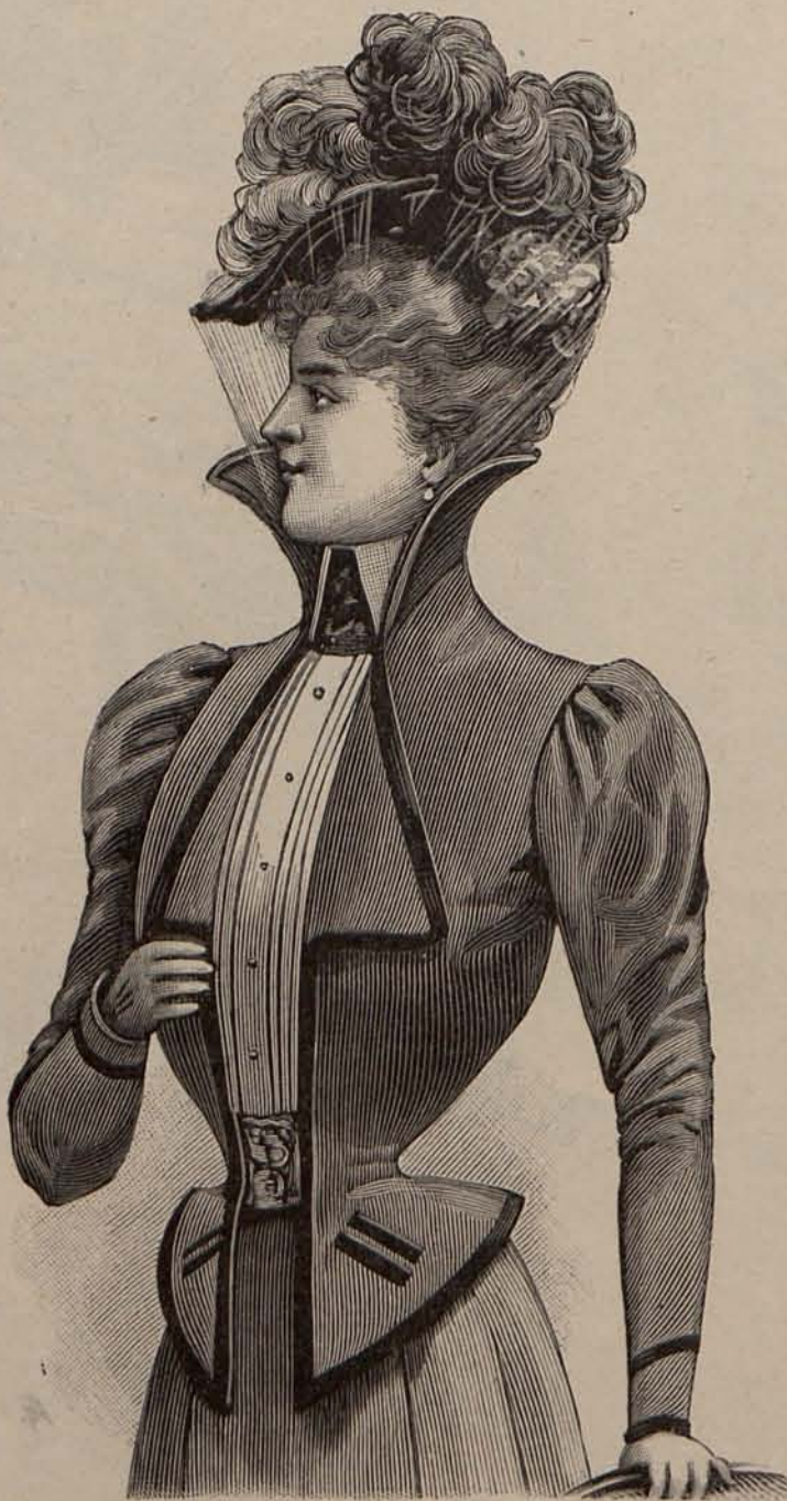
Núm. 33.—Chaqueta de entretiempo.