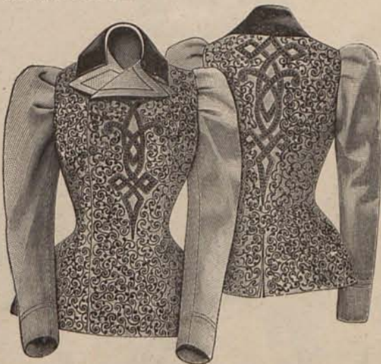
NÚMEROS 14 y 15.

redondeados, cerrados por un botón de esmalte y escotados en forma cuadrada sobre un plastrón masculino, de batista blanca con