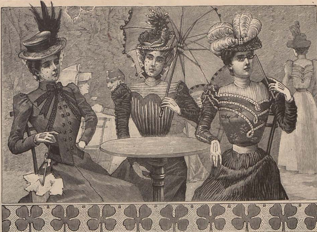
NÚMEROS 11, 12 y 13.

Los trajes corte de sastre gozarán también de gran favor durante la Primavera, y serán adoptados por las señoras y señoritas elegantes para viaje, calle, y aun visita; pues dentro de lo severo del estilo, hay modelos de exquisito gusto. En su número se cuenta el reproducido por el grabado núm. 16, que es de lana asargada de un delicado matiz entre tórtola y beige. Tanto la falda como la chaquetita lucen originales cenefas bordadas con trencilla azul zafiro. La chaquetita tiene los delanteros redondeados, cerrados por un botón de esmalte y escotados en forma cuadrada sobre un plastrón masculino, de batista blanca con