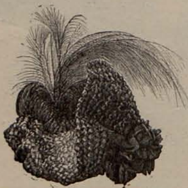
Num. 7.—Toca para paseo.

honor: aunque su fortuna se amengue, aunque no disfruten de todos los prestigios y grandezas que fueron su legítimo patrimonio, en los momentos supremos la ley de la raza se impone, y aunque la desgracia se ceba en ellas, jamás les falta la consideración y el respeto, ni aún de los mismos que han contribuido á su decadencia.