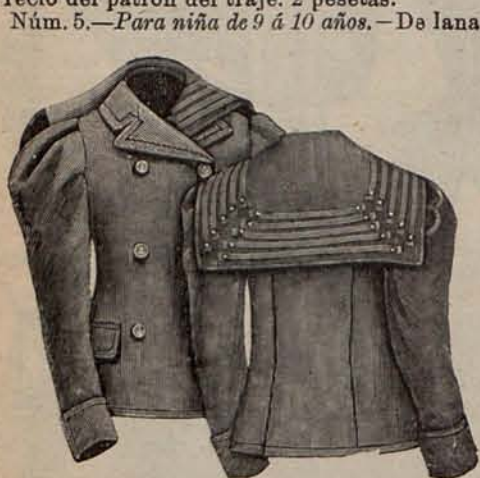
Núms. 35 y 36.—Chaqueta para niña de 7 á 9 años. (Delantero y espalda.)

Núm. 4.—Para niña de 2 á 3 años.—De sedalina rosa muy pálido. Un entredós de encaje blanco adorna la faldita. Cuerpo fruncido, escotado en forma cuadrada sobre un doble plastrón de encaje rodeado de una berta de sedalina. Mangas ajustadas. Cinturón drapeado. Precio del patrón del traje: 2 pesetas.