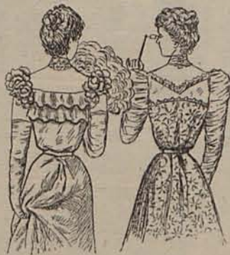
Nums. 10 y 11.—Espalda de los modelos grabados num. 8 y 9.