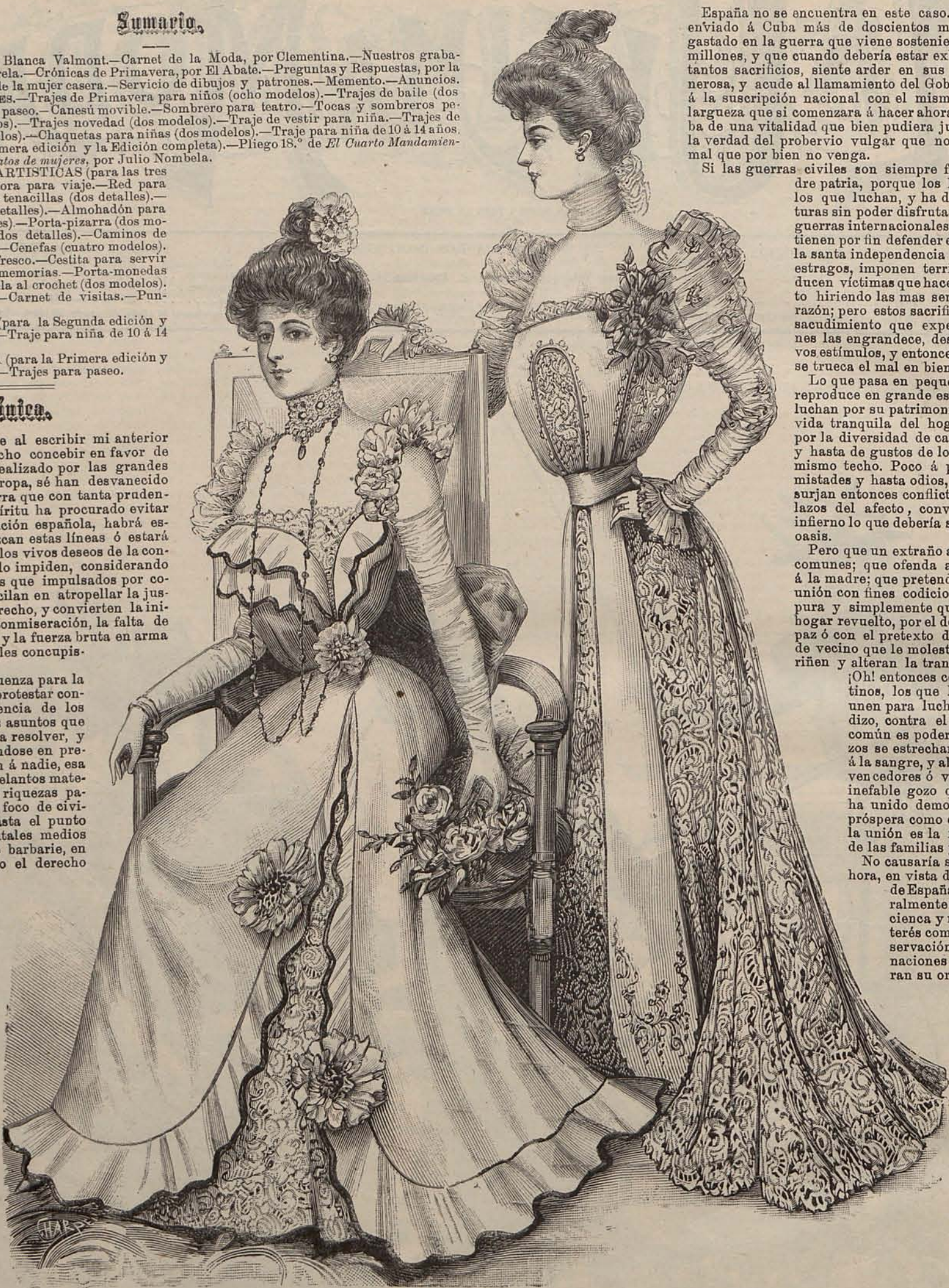
Nums. 8 y 9.—Trajes para baile.