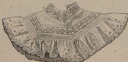
Num. 12.—Canesú movable.

deseamos triunfar, y alcanzará respeto á su desgracia, si en los altos designios de la Providencia, está resuelto, lo que no es de esperar, que á la luz de los grandes progresos del siglo XIX, la razón sea vencida por la fuerza, la justicia por la iniquidad, y el santo honor por el vil metal.