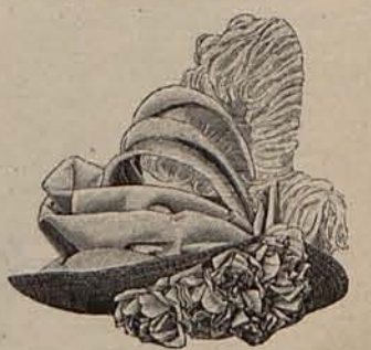
Num. 13.—Sombrero para teatro.

Pero de lo que no cabe duda es de que el pabellón español quedará bien puesto, de que España añadirá nuevos laureles á los que ilustran su historia á través de los siglos, y de que cualquiera que sea el resultado de la lucha, habrá dado un nobilísimo ejemplo que inspirará sincera admiración, si como