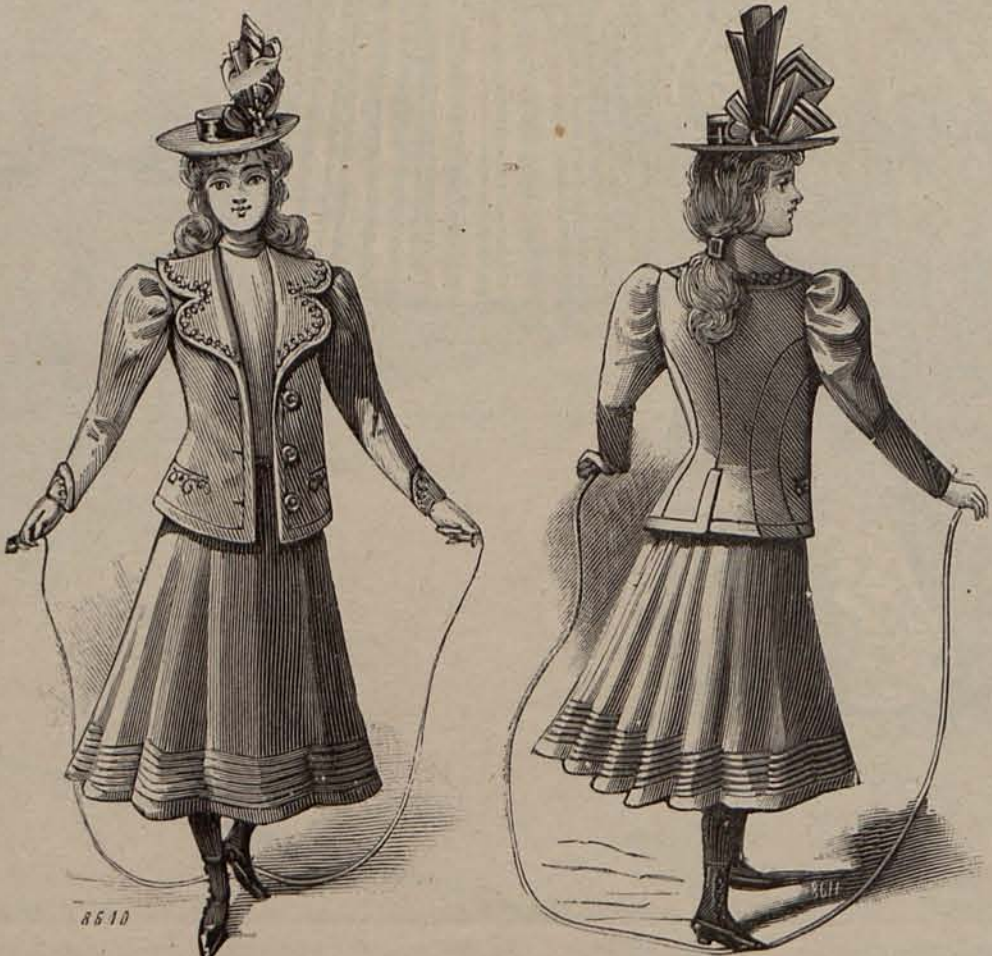
Núms. 41 y 42.—Traje para niña de 10 á 14 años. (Delantero y espalda.)