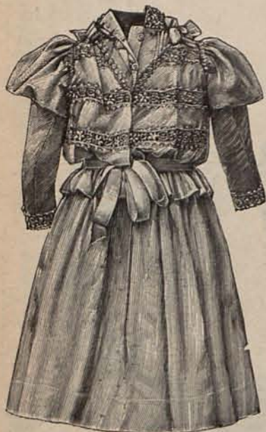
Núm. 34.—Traje para niña de 3 á 4 años. (Espalda.)

Núm. 2.—Para niño de 3 á 4 años.—De seda otomana color pergamino, con espalda y delanteros rectos, amoldados al talle por medio de un cinturón de cabritilla blanca con hebilla de nácar. Los delanteros están abiertos sobre un plastrón de raso blanco, rodeado de dos solapas de análogo tejido que lucen en los contornos volantitos fruncidos. Mangas semi-huecas. Sombrero de paja color pergamino, con cinta de raso blanco arrollada en torno de la copa. Precio del patrón del traje: 2 pesetas.