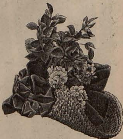
Núm. 10.—Sombrero para paseo.