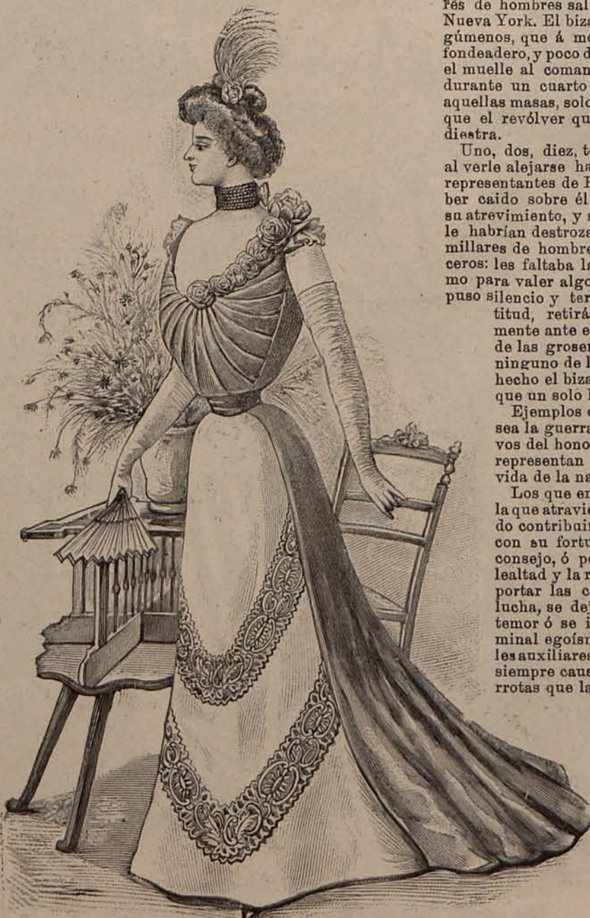
Núm. 9.—Traje de baile.