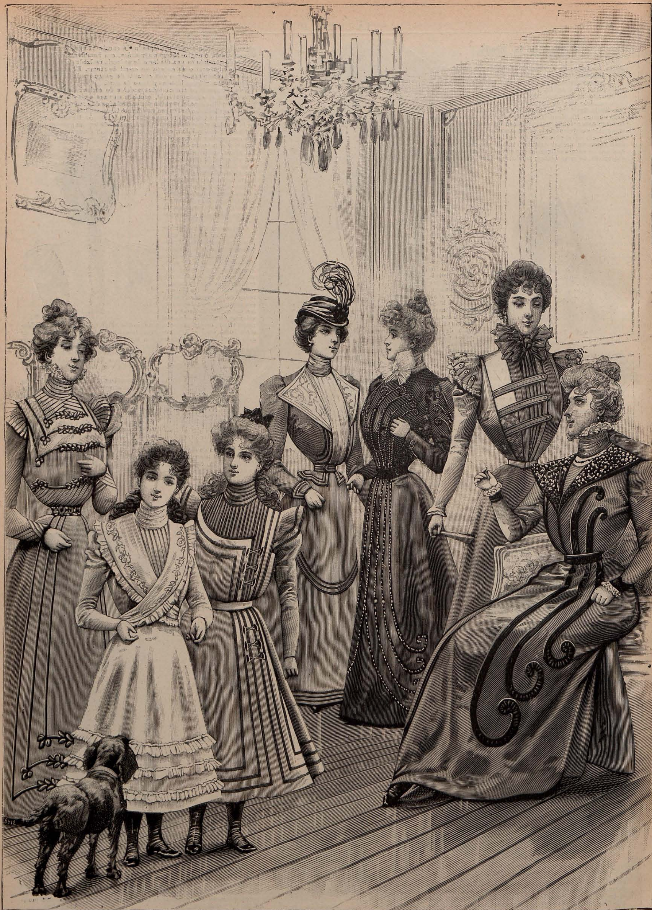
Núms. 18 á 24.—Trajes alta novedad para señoras, señoritas y niñas.