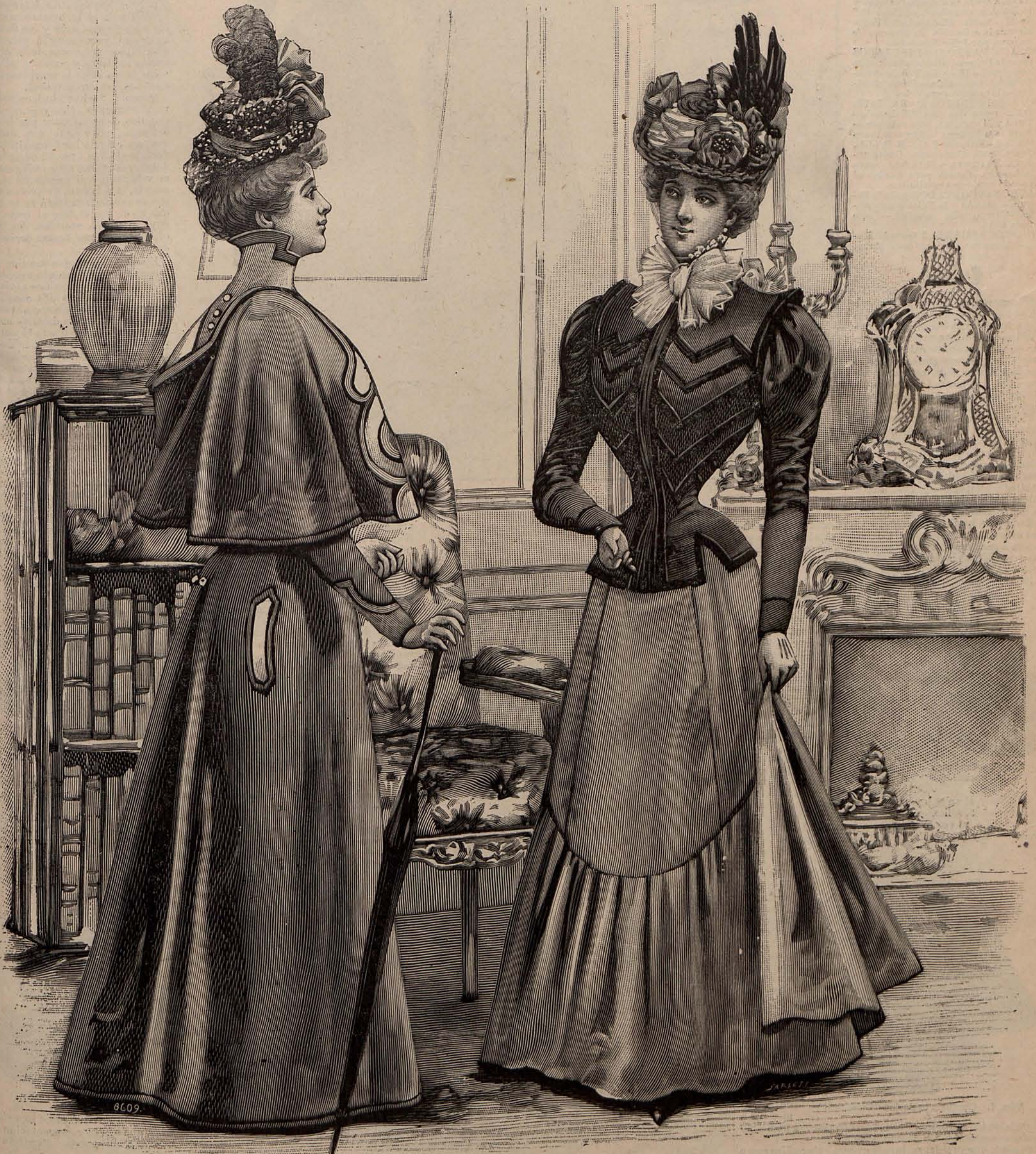
Núm. 1.—Sobretudo elegante.—Núm. 2.—Traje para visita.

Suscripción: Directa. Por comisión. En Portugal. Unión Postal. Trimestre..... 5 ptas. — 6 ptas. — 1.500 reis. — 10 francos. Semestre..... 10 „ — 12 „ — 2.600 „ — 20 „ Año..... 20 „ — 24 „ — 5.000 „ — 40 „ Núm. corriente: 40 céntos. Atrasado: 80 ídem.—En América fíjan el precio los Agentes.