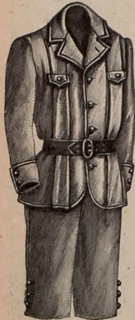
Núm. 33.—Traje para niño de 7 á 9 años.

El modelo segundo, tiene la falda de lanilla azul con ancho volante fruncido, y el cuerpo de seda otomana del color de la falda en tono más oscuro. Este último, está adornado con cenefitas de terciopelo azul y una corbata mariposa de muselina de seda blanca. Mangas ajustadas. Sombrero de paja de seda azul, adornado con draperías de seda y rosas blancas y un ala de pluma negra. Tela necesaria para el traje, 6 metros de lanilla y 5 de seda otomana. Precio del patrón: 3 pesetas.