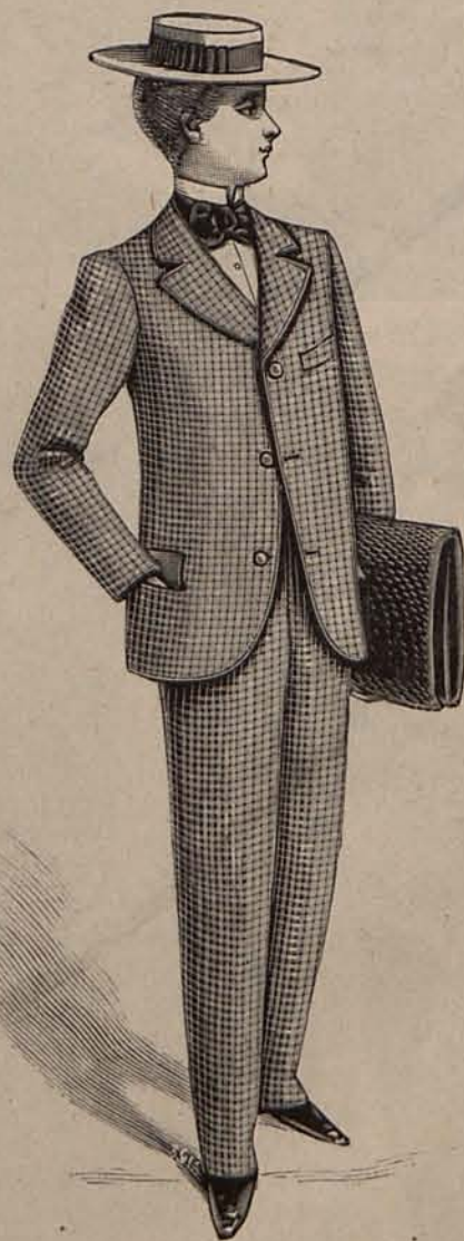
Núm. 38.—Traje para niño de 13 á 14 años.

Tela necesaria para la americana, 1 metro 10 centímetros de lanilla inglesa de 130 centímetros de ancho.