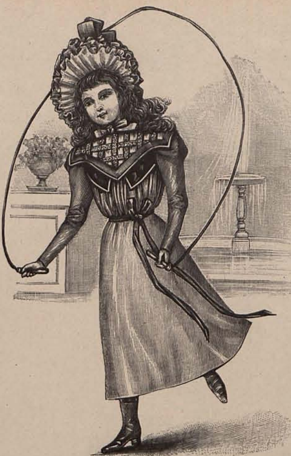
Núm. 34.—Traje para niña de 6 á 8 años.

El modelo núm. 6, de sarga Corinto, se compone de una falda lisa y un cuerpo-blusa con aldeta ondulada. El delantero derecho cruza sobre el izquierdo el que está unido en su mitad inferior, por medio de botones perlados. La mitad superior del citado delantero se vuelve y doble formando una solapa que deja al descubierto un forro de seda blanca. Mangas ajustadas. Cinturón de terciopelo negro. Sombrero de paja Corinto, sencillamente a tornado con una cinta de terciopelo negro. Tela necesaria para el traje, 8 metros de sarga. Precio del patrón: 3 pesetas.