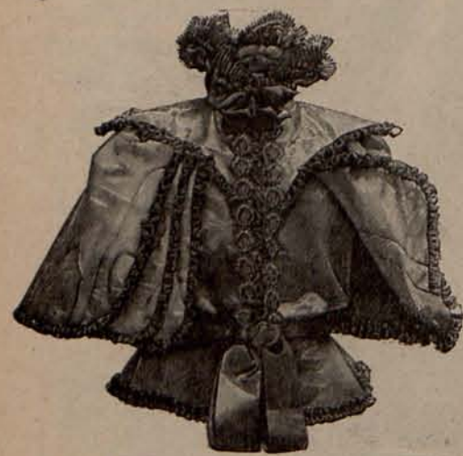
Núm. 4.—Chaqueta esclavina (Delantero.)