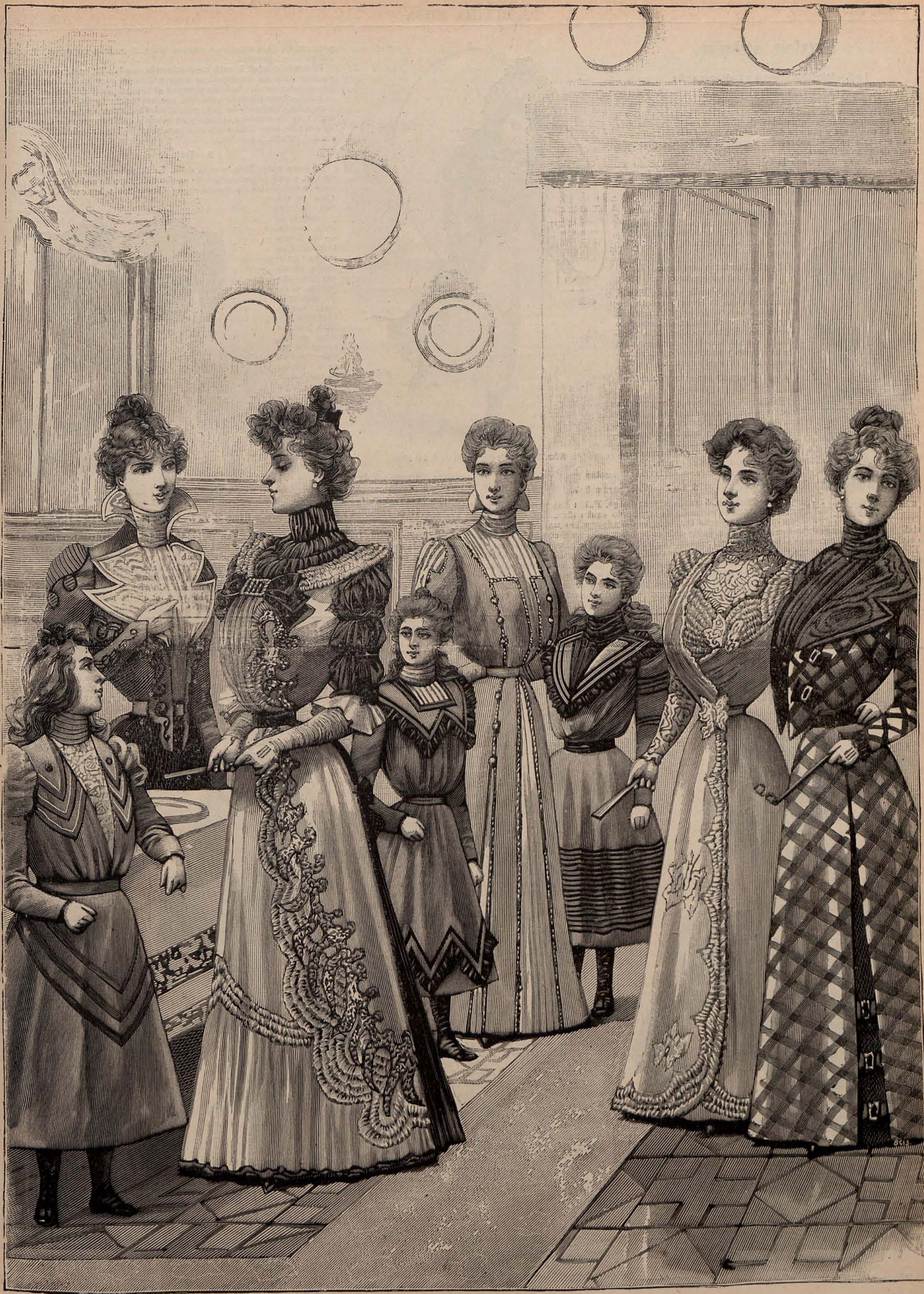
Núms. 25 á 32. — Trajes alta novedad para señoras, señoritas y niñas.