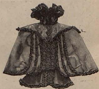
Núm. 9.—Chaqueta esclavina (Espalda.)