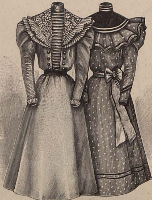
Núms. 35 y 36.—Trajes para niñas de 9 á 11 años.

De raso color lirio y seda maíz. La falda es de raso, con cola acanalada, y está abierta sobre un ancho delantero de seda adornado con anchos entredoses de encaje crema dispuestos sobre cenefas de raso. Cuerpo mitad de raso y mitad de seda, escotado en forma redonda. Una media guirnalda de rosas blancas bordea el lado izquierdo del escote. Cinturón de raso. Mangas muy cortas, formadas por volantitos de seda. Collar de turquesas. Un grupo de plumas azuladas, sostenido por una rosa blanca, adorna el peinado. Tela necesaria para el traje, 12