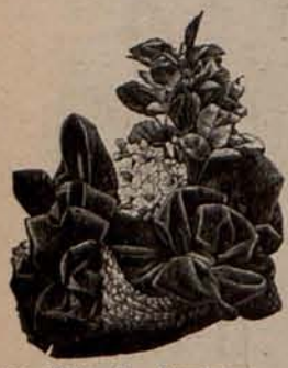
Núm. 3.—Sombrero para paseo.