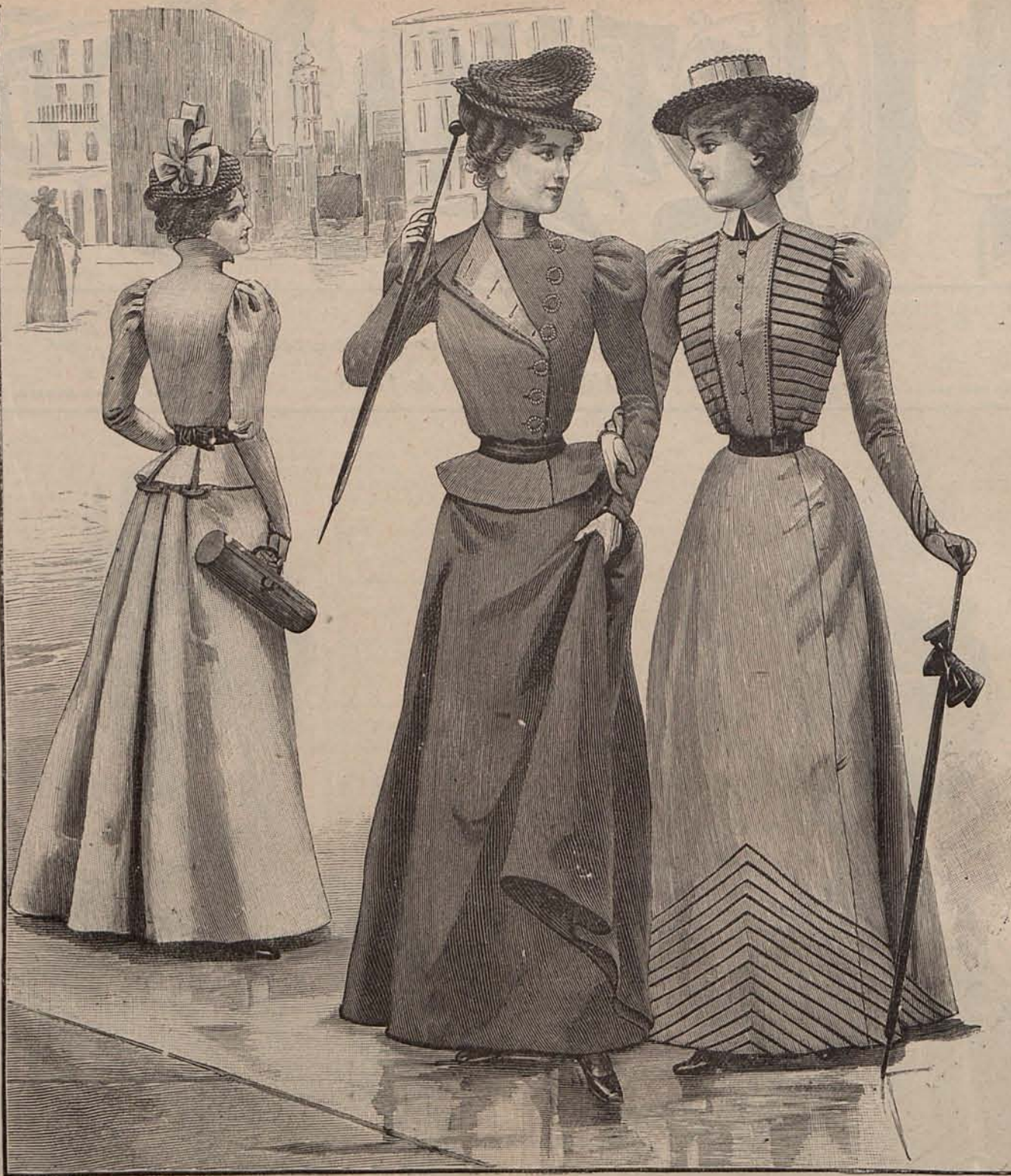
Núms. 5, 6 y 7.—Trajes para calle.

Suceda lo que suceda; ya dura la guerra quince días como ha profetizado el que después de desempeñar como diplomático en Cuba el vergonzoso papel de Judas, ha pasado