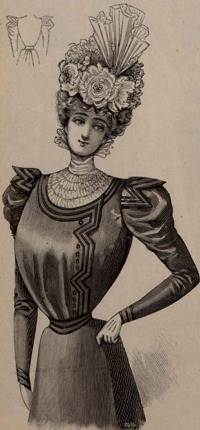
Núm. 37.—Cuerpo alta novedad.

CUERPO ALTA NOVEDAD PARA SEÑORA Y AMERICANA PARA NIÑO DE 13 Á 14 AÑOS