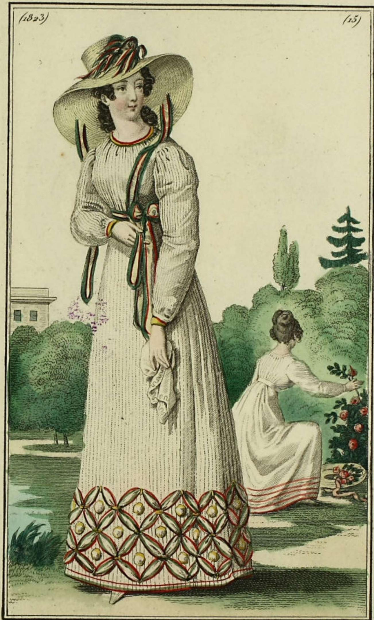
L'Indiscret Bureau, rue St. Hippolyte, N. 20.

Blouse en mousseline claire gaufrée, garnie à quadrille. Chapeau à la Pèlerine en paille d'Italie, orné d'herbes à rubans de chez M me Prevost, Fleuriste, rue de Richelieu.