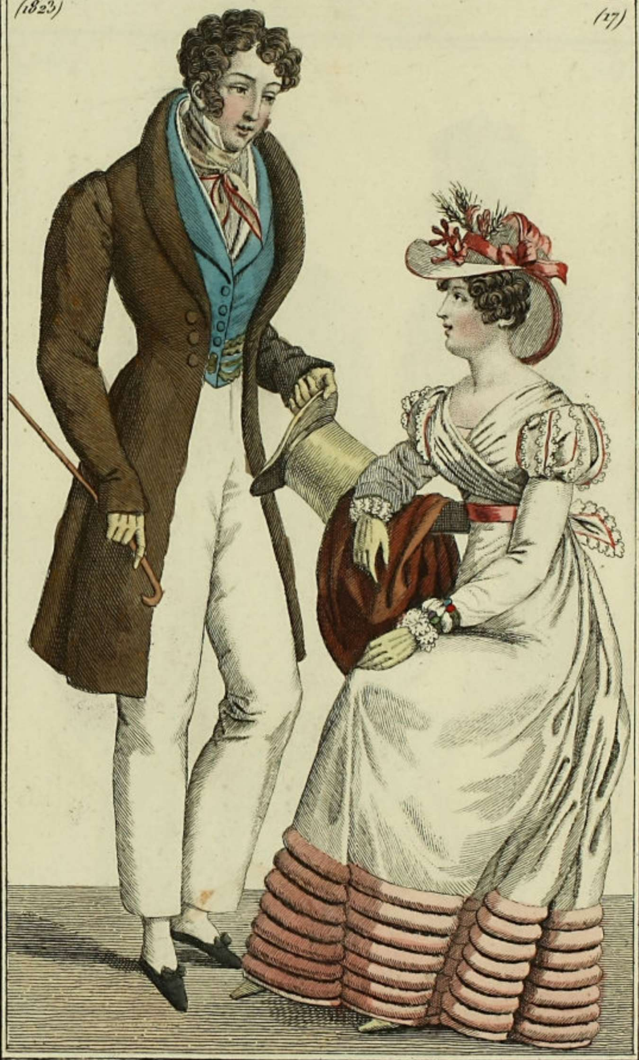
L'Indiscret Bureau, rue S te Apolline N o 20.

Robe de Percale garnie de rouleaux en mousseline claire, manches à crête de Coq. Draperie adaptée au corsage partant des épaulettes et formant ceinture. Chapeau paré en gros de Naples orné de fleurs et de paille. Redingotte de merinos avec des boutons de métal. Chapeau de paille d'Italie.