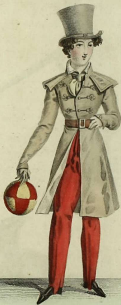
Observatoire des Modes, N o . 226. Bureau, rue Montmartre, N o . 179.

Enfant de 11 à 12 ans: Redingotte en drap améridien exécutée par M r Martel: Ceinture en cuir de Russie: Pantalon cosaque