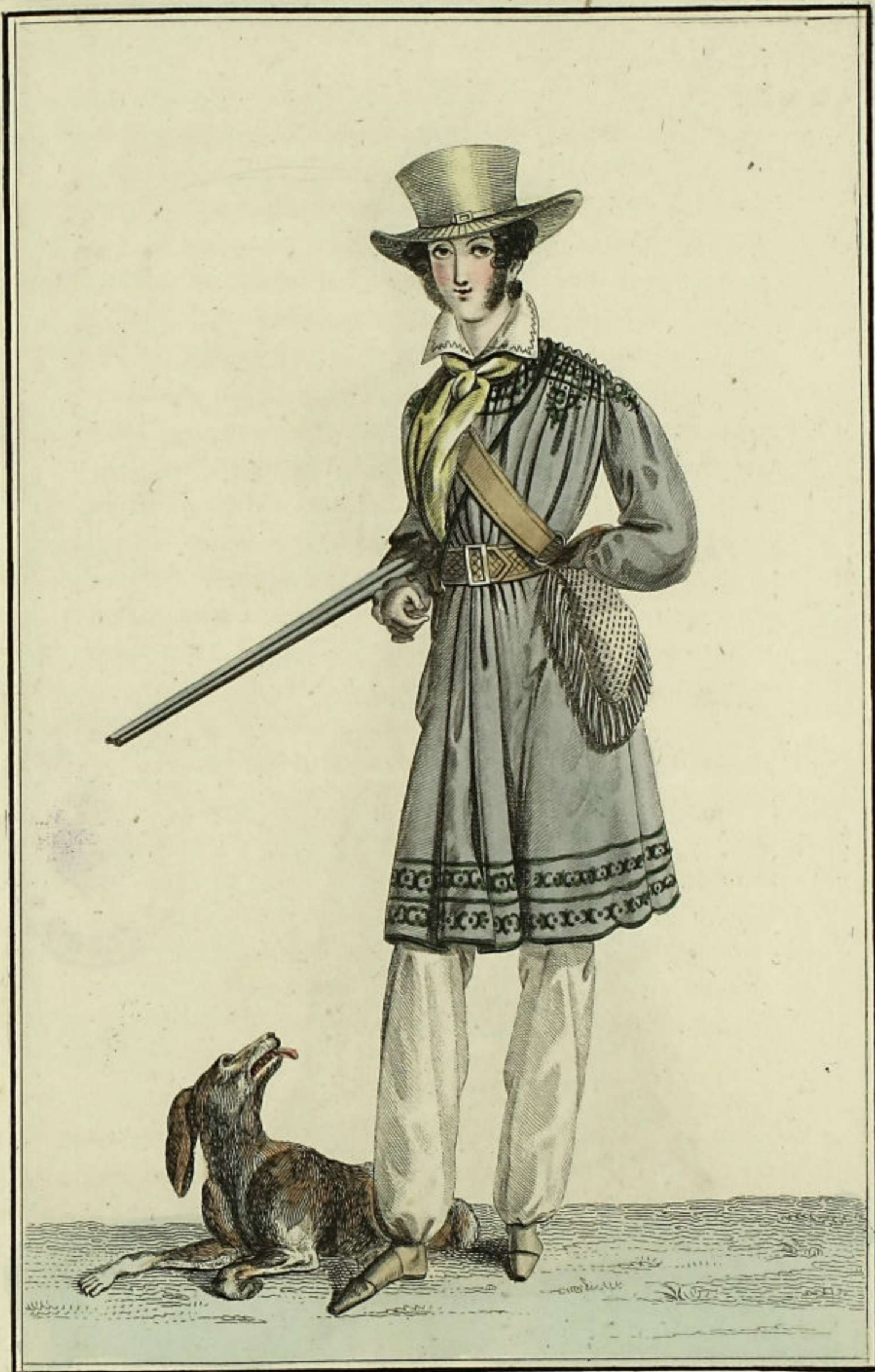
Observateur des Modes, N° 230. Bureau/rue/Montmartre/N° 179.

Costume de chasse: Blouse brodée en lacet: Pantalon de coutil, froncé: guêtres et souliers de castor.