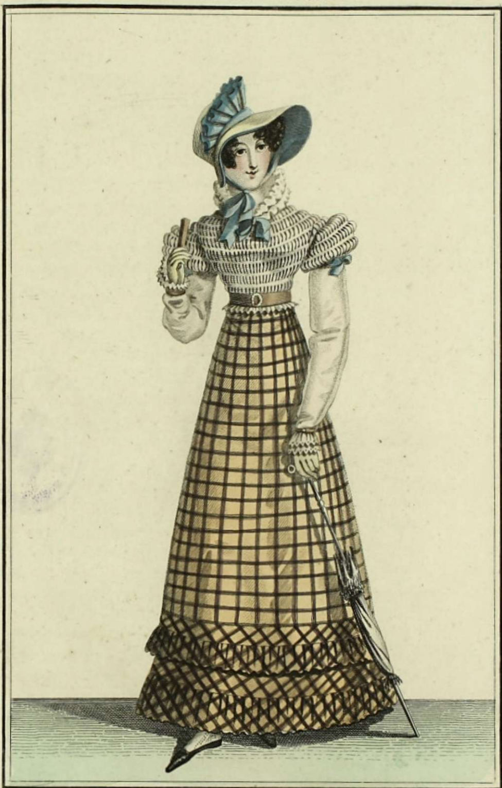
Observatoire des Modes N° 233. Bureau rue Montmartre, N° 179.

Chapeau au gros denaples orné d'un ruban ombré: Colerette en crepe, canezou de mousseline à manches. Robe en batiste imprimée garnie de biais et de deux grands volans.