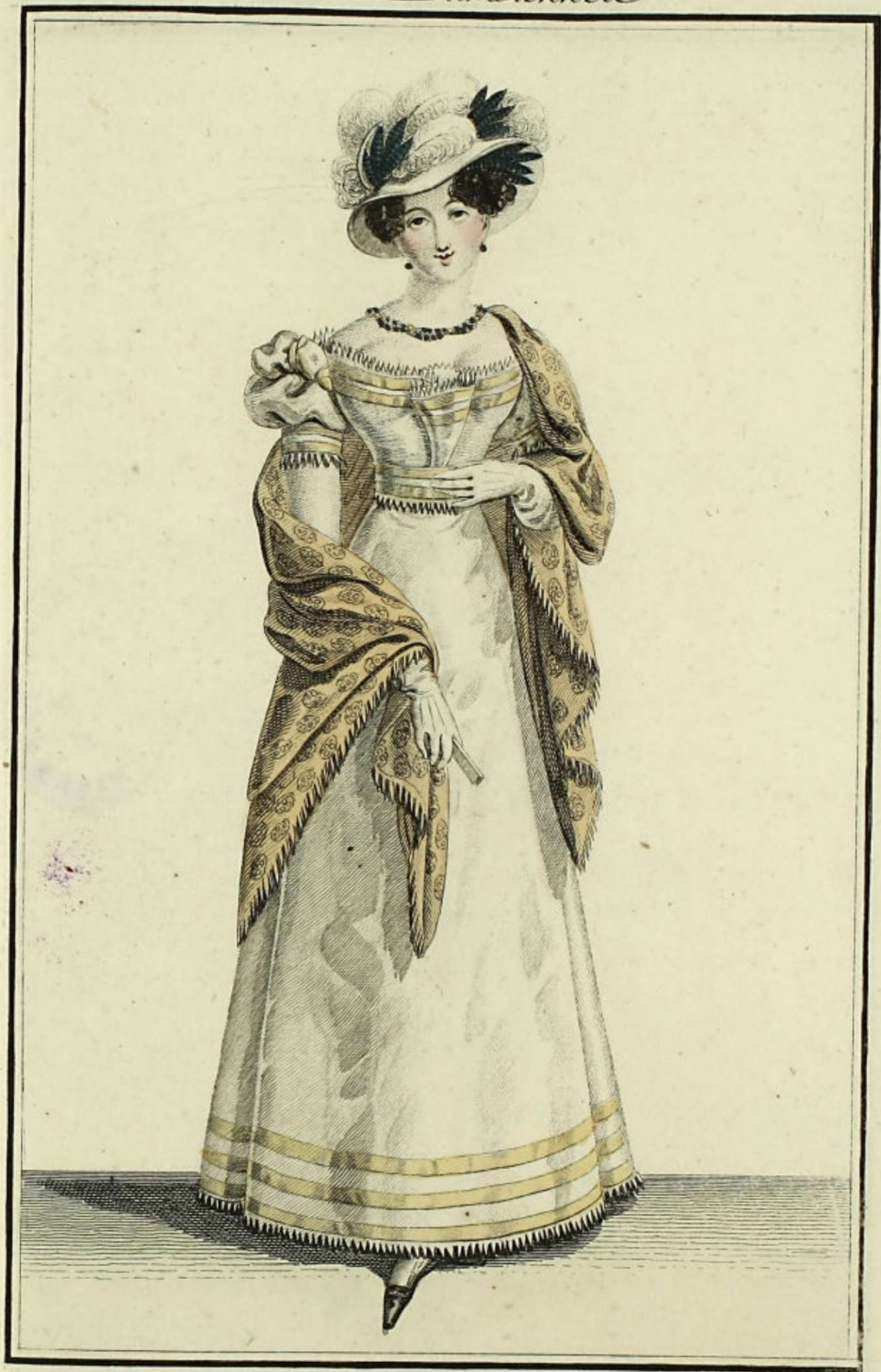
Observatoire des Modes N° 231. Bureau rue Montmartre, N° 179.

Chapeau de crêpe, orne de marabouts et de plumes de geai. Robe en mousseline de l'Inde à chefs d'or. Souliers de satin.