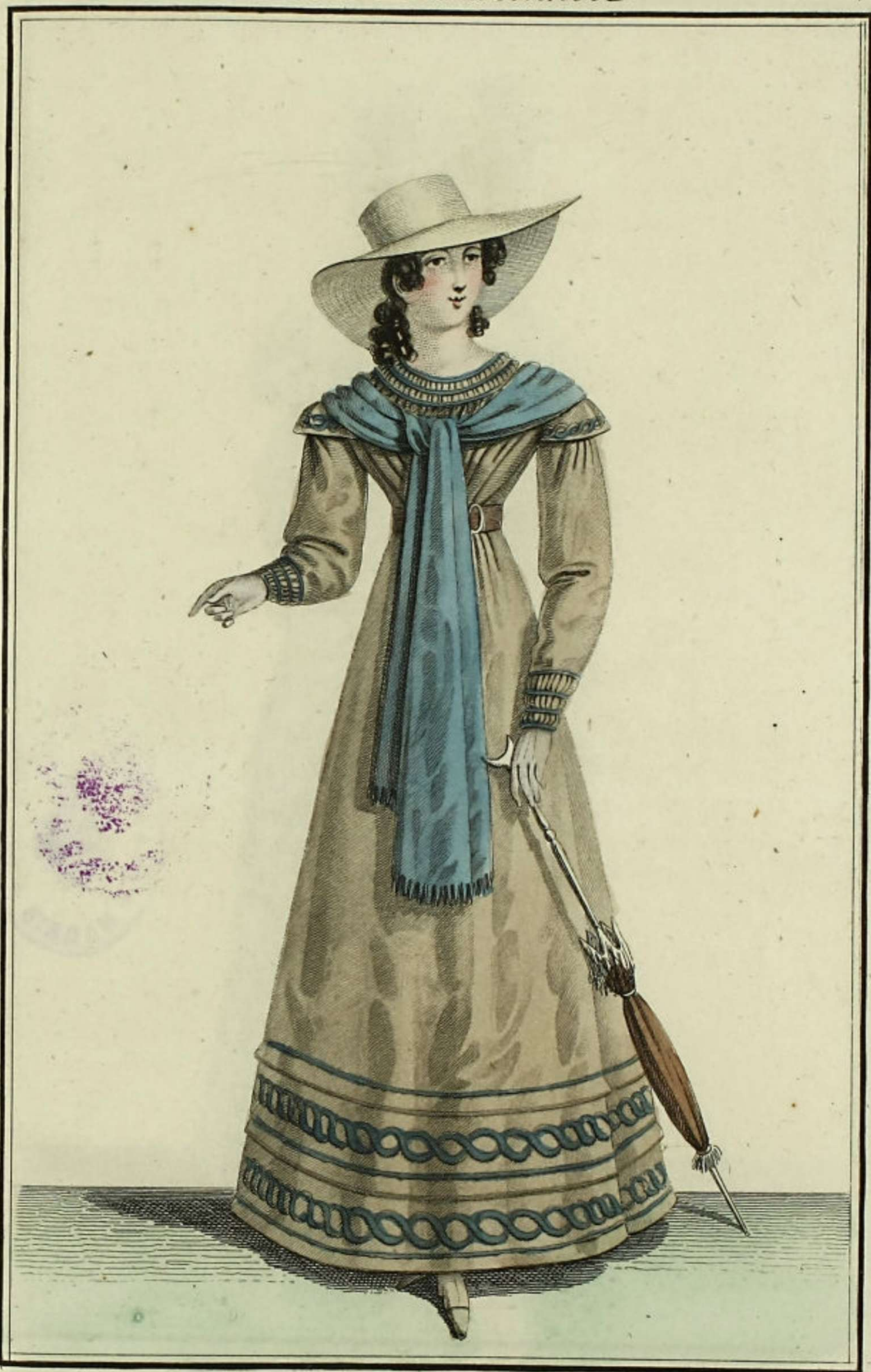
Observateur des Modes, N° 227. Bureau rue Montmartre, N° 179.

Paille d'Italie entière, coiffure à l'enfant: Blouse de batiste écrue brodée, à poignets froncés: Echarpe en barrège-cachemire.