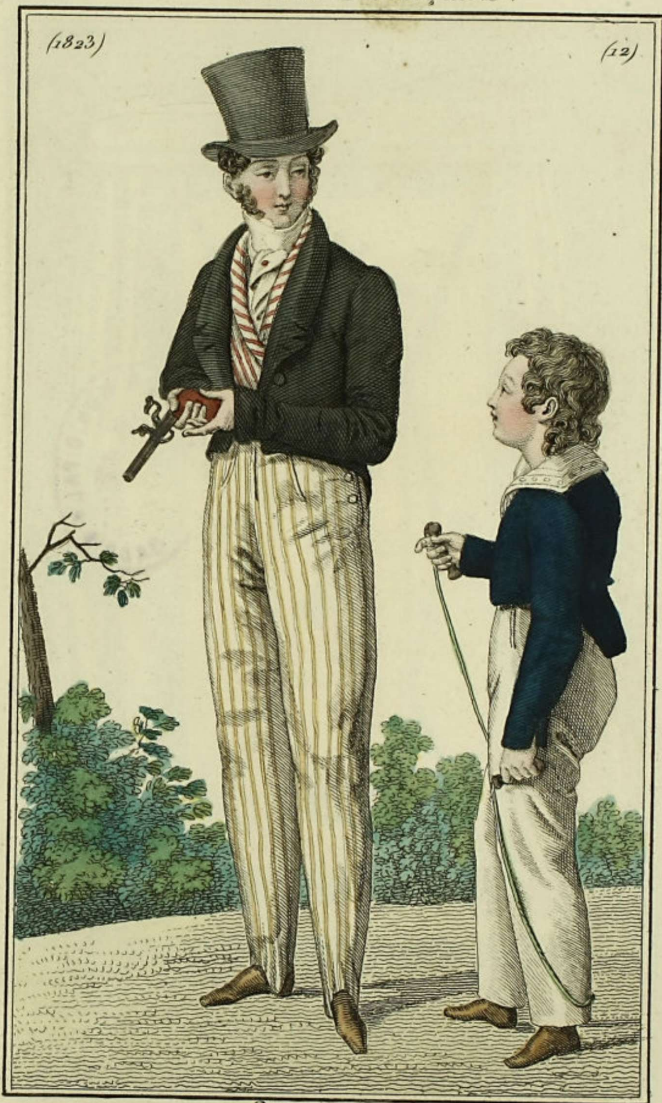
L'indiscret. Bureau rue S. te Appolline, N o 20.

Costume du matin à la campagne, pantalon rayé, chapeau gris, bottines en buffle; pistolet de la Manuf re de Versailles. habit-veste pour les enfans, collet de chemise brodé.