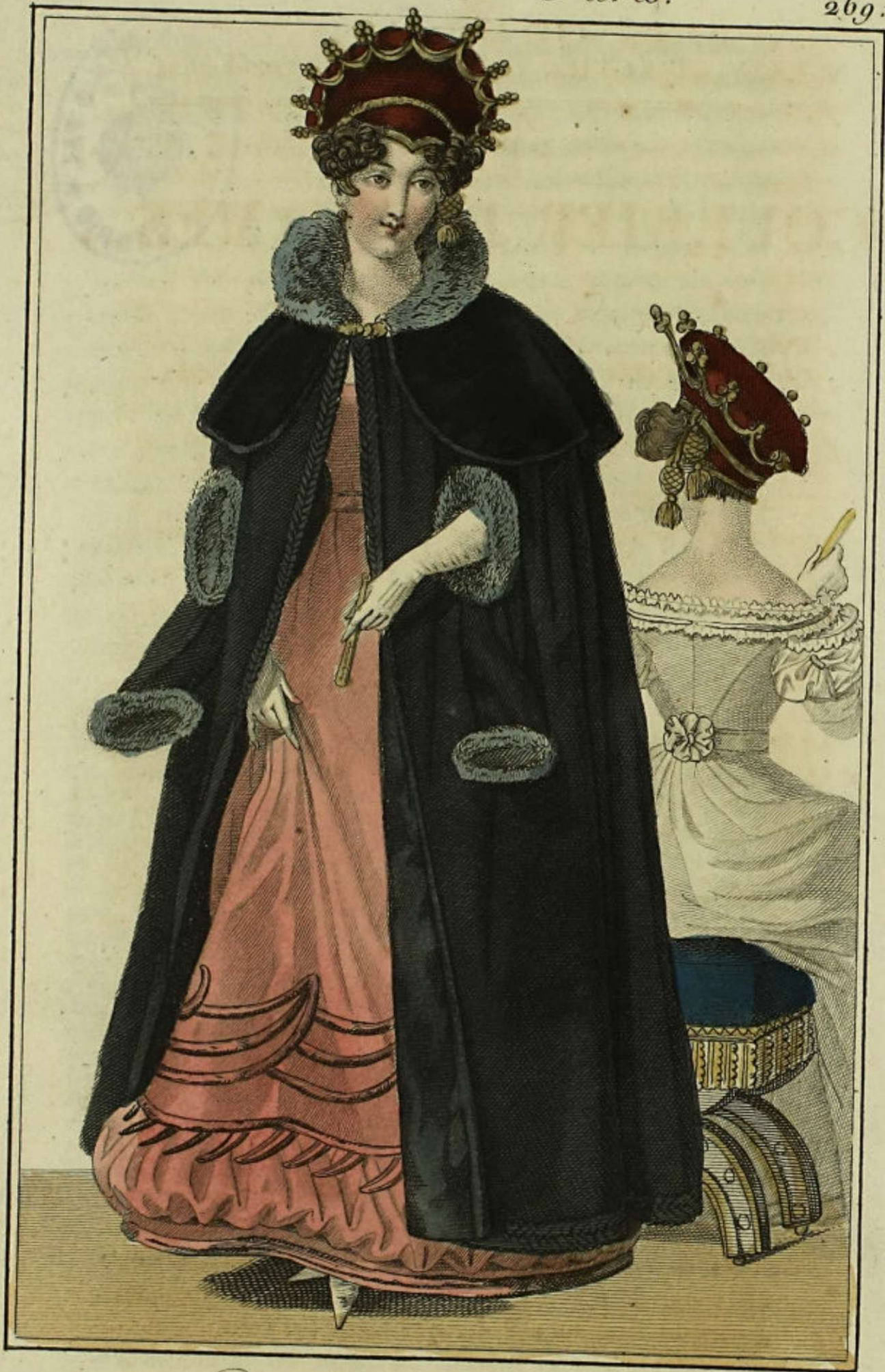
Petit Courrier des Dames.