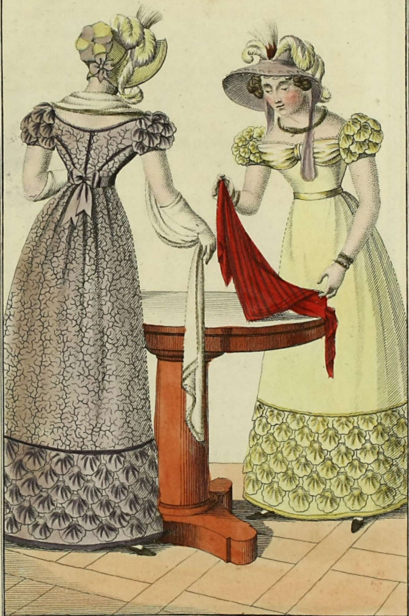
Robe de gros de Naples Lithographie, Fichu de Barrège de Cachemire basiné, Echarpe de Blonde, Chapeau avec plumes et Esprit.