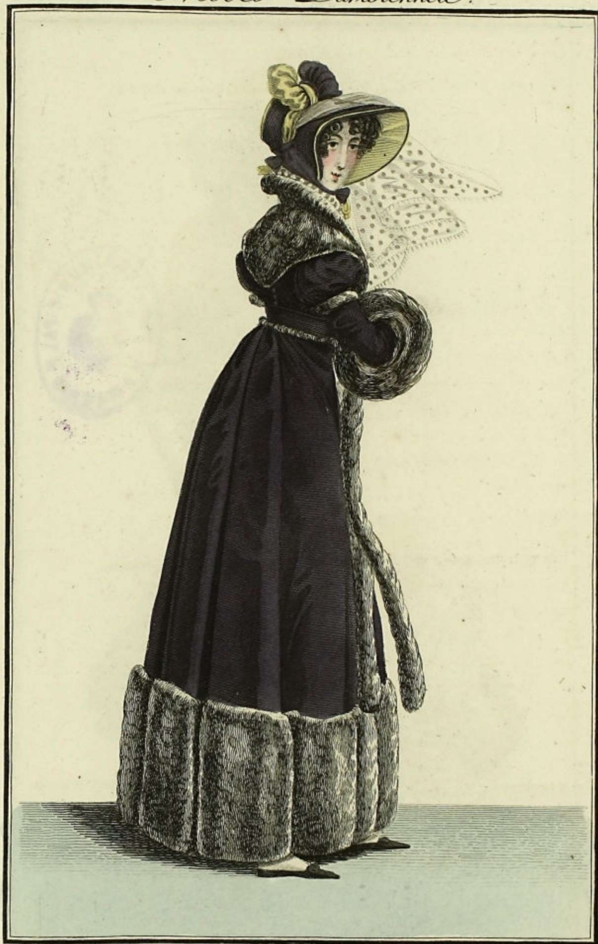
Observateur des Modes, N.º 195. Bureau rue Feytaud, N.º 20.

Chapeau de Velours orné d'un nœud-éventail et de deux écharpes en Crêpe lisse. Redingotte en Velours garnie de Chinchilla: fichu-palatine en Chinchilla.