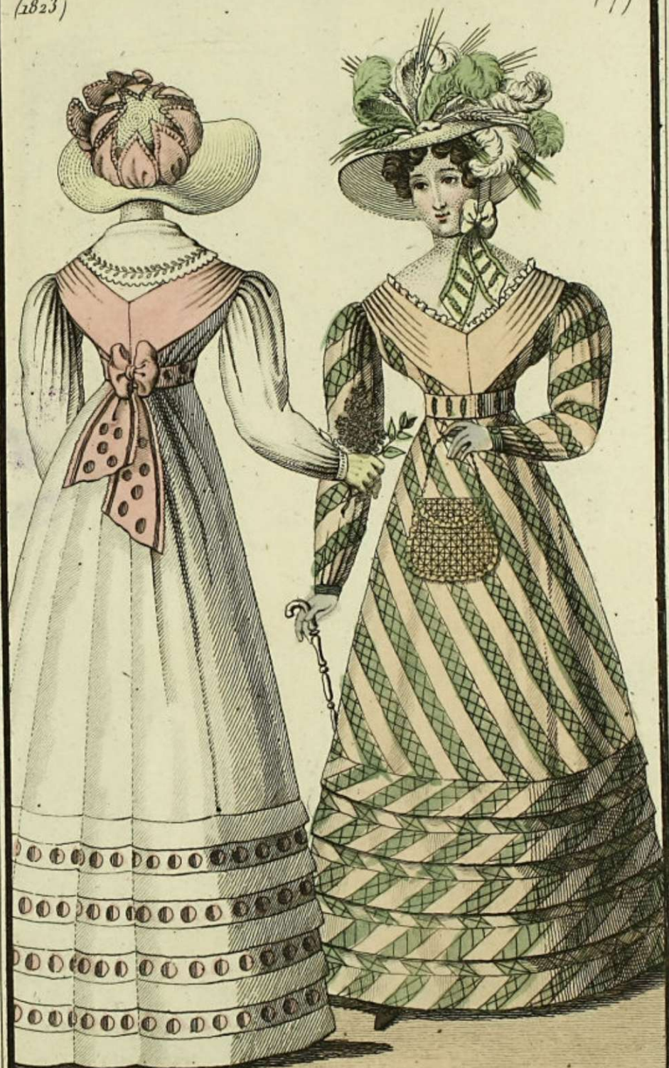
Robe en mousseline quadrillée : ceinture en large ruban formant fichu. — Chapeau de paille de soie orné de plumes et d'épis ; de la fabrique de M me Manceau, Rue S. t Avoye. Sac en tisser de paille.