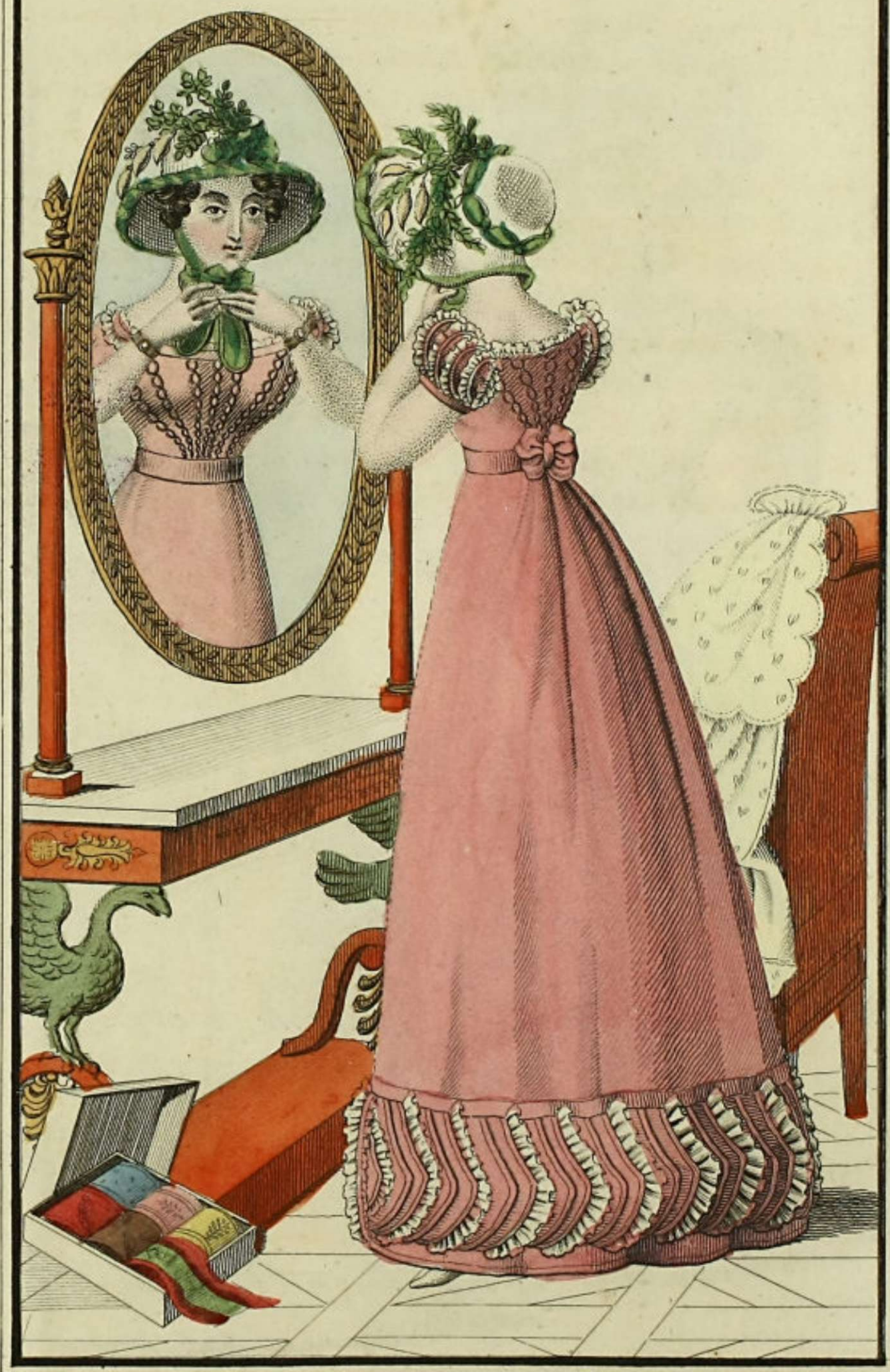
L'indiscret Bureau, rue S te Appolline, N o . 20.