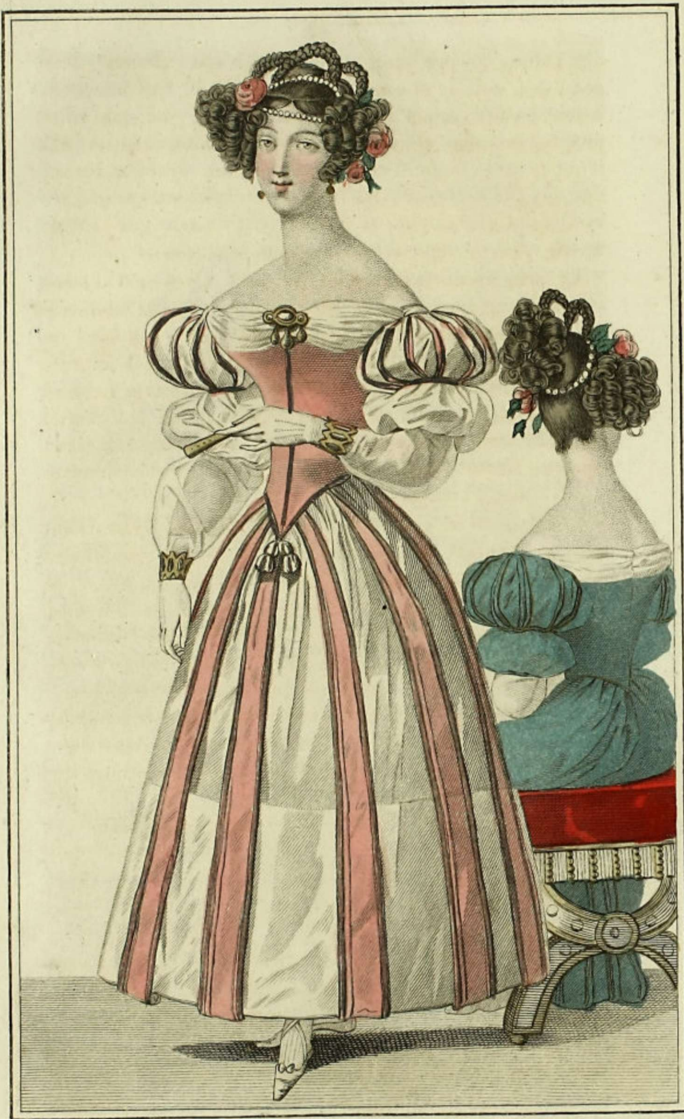
Petit Courrier des Dames Boulevard des Italiens N o . 2 près le passage de l'Opéra. Robe de Crêpe ornée de rubans de gaze, Coiffure Exécutée par M r Narcisse rue neuve des Mathurins N o . 31. Chaussée d'Antin.