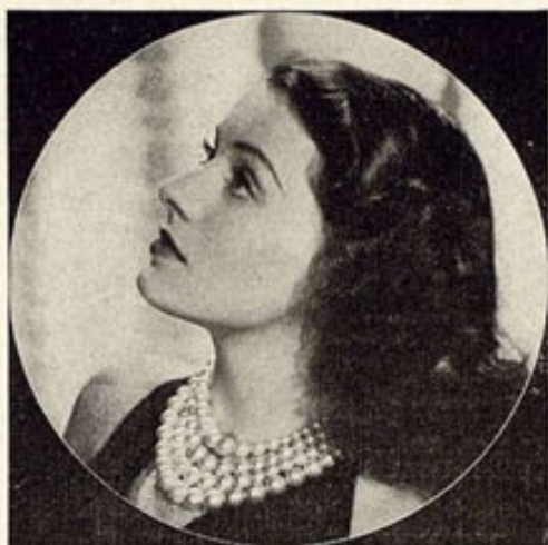
Ellen Drew, artista de Paramount Pictures