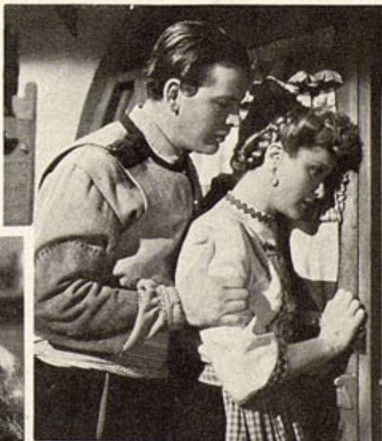
Philip Down y Anna Sten en el fotodrama de Twentieth Century-Fox "Chetnik", que revela la lucha heroica contra los nazis en los Balcanes.