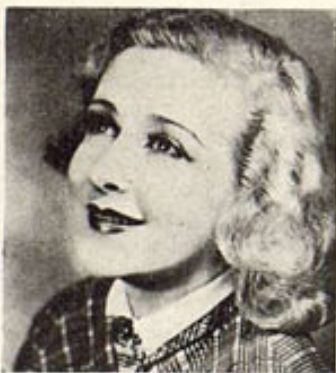
Mildred Harris, la primera esposa de Charlie Chaplin—que fue y es excelente actriz—vuelve al cine ahora, contratada por la Empresa Paramount.

Este se alargó innecesariamente por los interminables discursos pronunciados por cuantos fueron invitados por el Presidente de la Academia, Walter Wanger, a subir a la plataforma, cada uno de los cuales debió pensar para sí que el público se había congregado para escucharles, olvidándose de