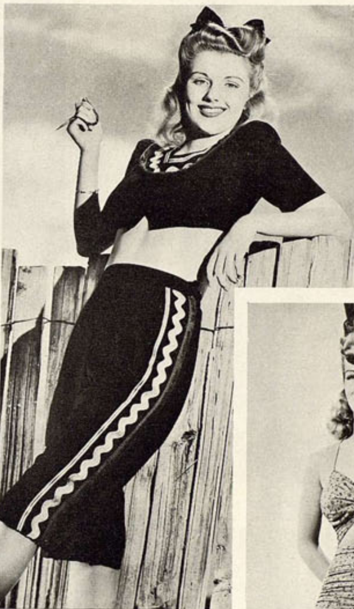
Dolores Moran, actriz de la Warner, con un traje de lino negro que acentúa una cordonadura amarilla, roja y verde en la falda—alargada hasta debajo de la rodilla—y en torno al escote. El mismo adorno acordonado marca el tallo. Dolores figura en la cinta titulada "La Diabólica".