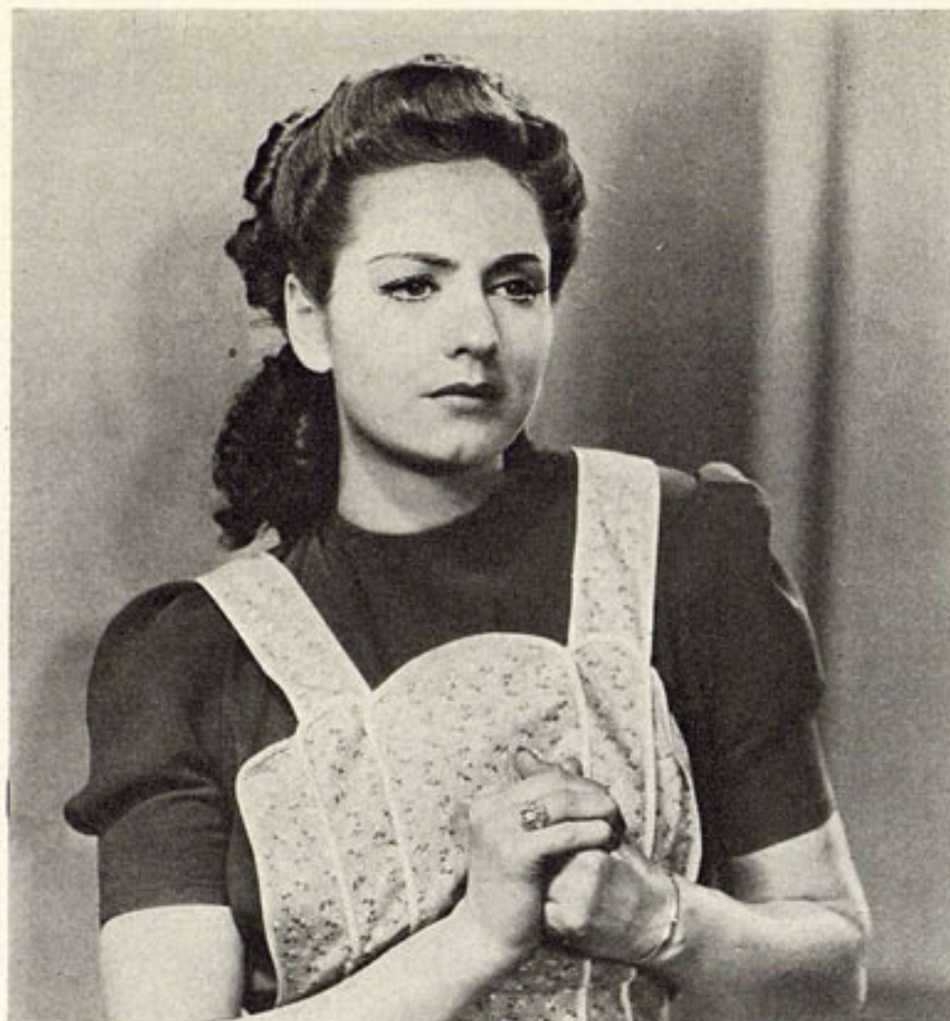
Susana Guizar, orgullo del Cine mexicano, que acaba de ser premiada por los críticos y el Instituto de Ciencias y Artes Cinematográficas de su país. Su última interpretación: "Noches de Ronda", que produjo Guillermo Calderón para Columbia.

Ya están en el puerto jarocho los artistas que