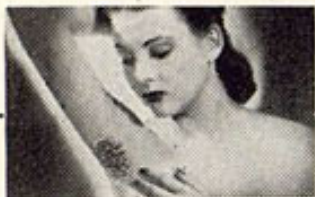
Piel irritada por desodorantes inferiores