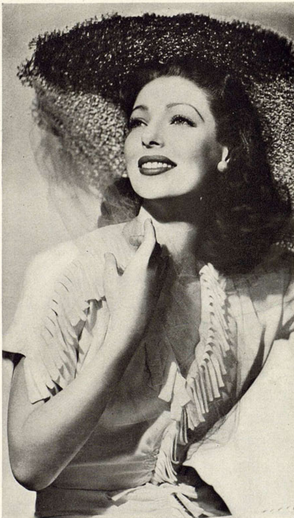
La fotografía más reciente de Loretta Young, en pose especial para esta revista, de la que es estrella predilecta. La joven tiene ahora a su cargo interpretaciones dramáticas para Paramount.

La concurrencia suspiró con satisfacción cuando Walter Wanger entregó la batuta de maestro de ceremonias al inimitable Bob