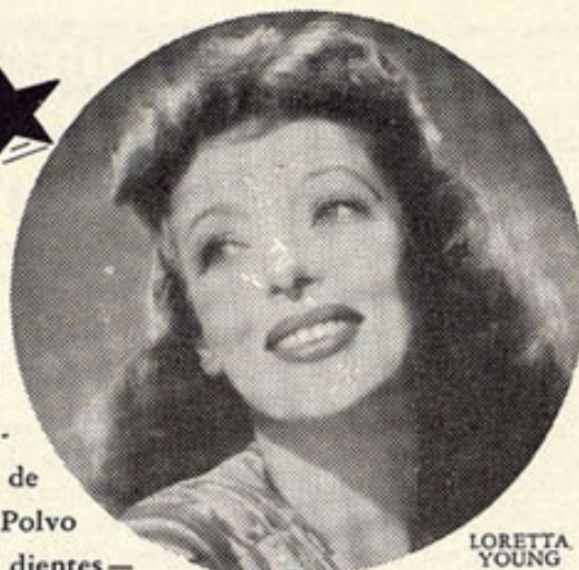
LORETTA YOUNG Estrella de la Paramount

tiene una finura y pureza que no arañará nunca el precioso esmalte. Pruébalo—¡por amor a la belleza!