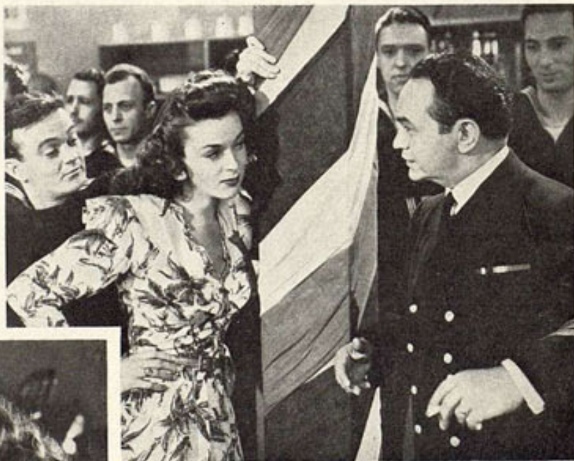
Marguerite Chapman contando los botones del uniforme de Edward G. Robinson, a ver si el número le trae suerte, en la película de Columbia "Destroyer".