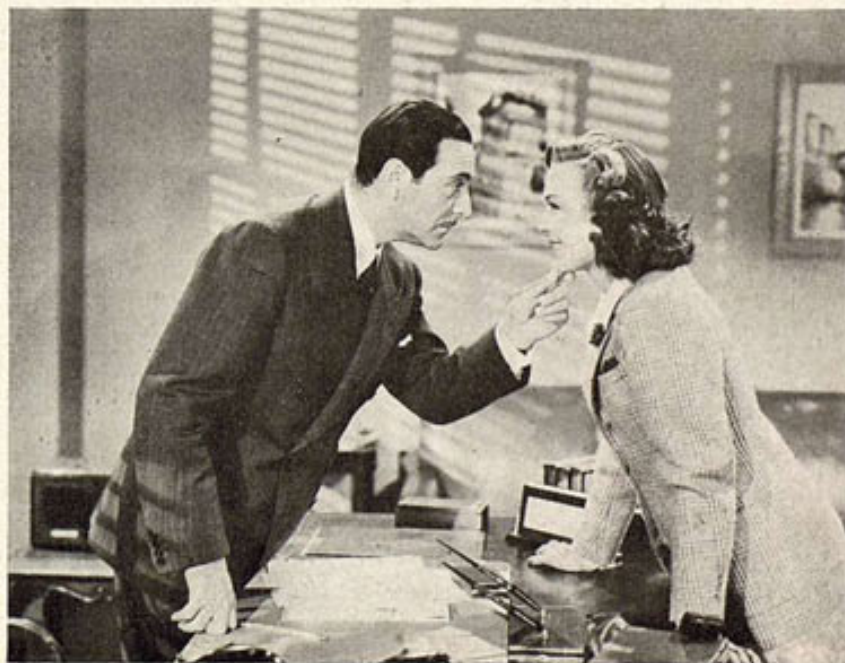
Ricardo Cortez y Joan Woodbury al iniciar la escena culminante de la película "Yo soy el asesino", asunto de mucha acción dramática que la Empresa Monoqram pronto estrenará en la América Latina.