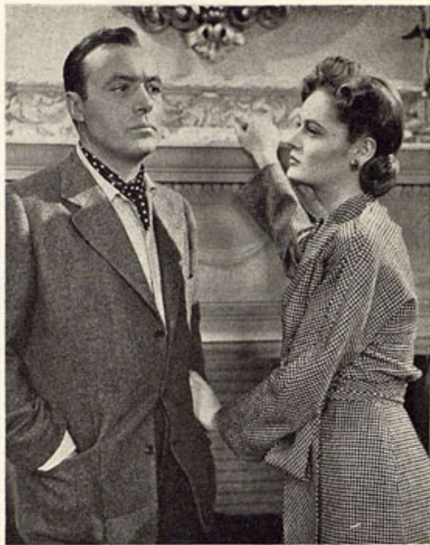
Charles Boyer negándose en absoluto a dejarse convencer por Alexis Smith de que debe ponerse la corbata dentro del cuello. Esta escena doméstica es de "La Ninfa Constante", cinta de Warner.