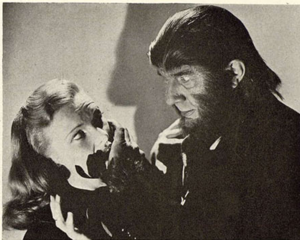
Aquí es nada: el propio Bela Lugosi infundiendo el terror de costumbre, y un poco más, a la rubia Louise Currie en un instante típico de la producción de miedo y de Monogram, "El Hombre Mono".

La Academia de Arte Cinematográfico de Méjico acababa de conceder por cuarta vez su primer premio al artista Arturo de Córdova, por "El Conde de Montecristo". Y como Arturo de Córdova se halla en estos momentos en Hollywood, contratado por la Paramount, la Academia de Méjico pidió a la Academia de Hollywood, que se