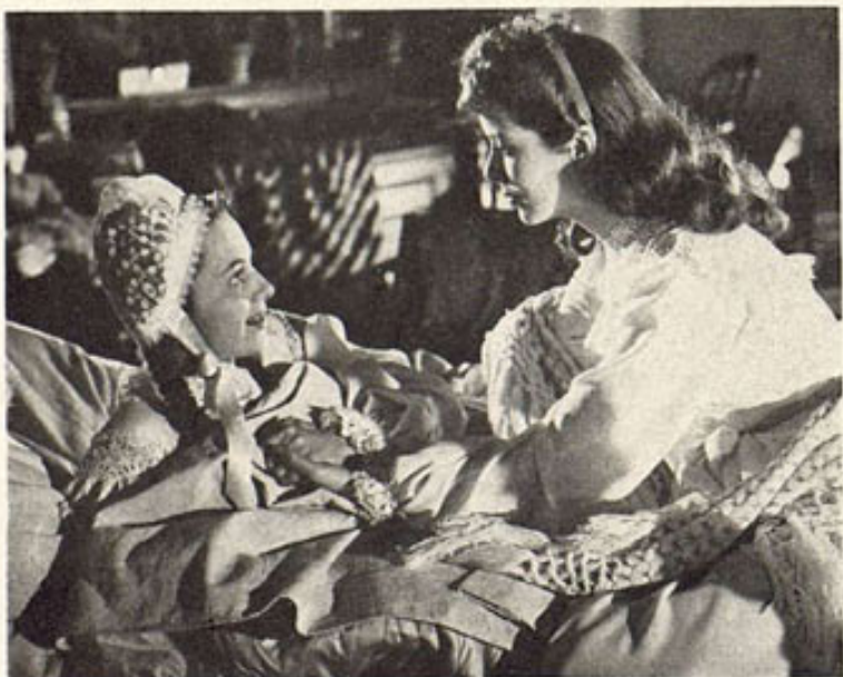
Por la izquierda, navegando en un mar de encajes, volantes, sábanas, gorritos y pañolones, Olivia de Havilland y la encantadora Ida Lupino. Ambas interpretan "Devotion", fotodrama que tiene por argumento la vida de las hermanas Brontë, célebres novelistas del siglo pasado. Es de marca Warner.