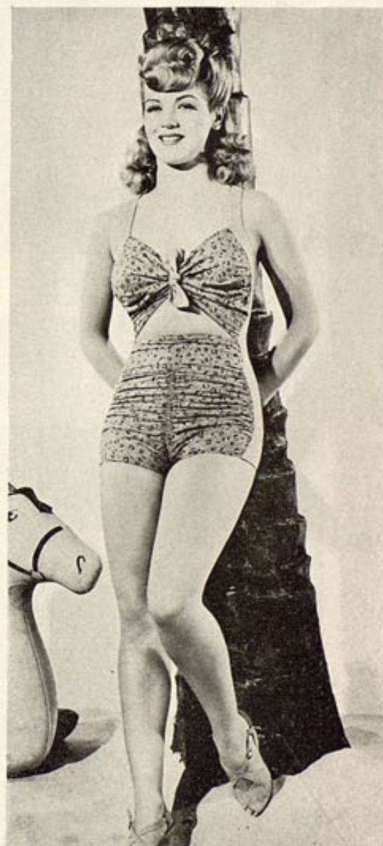
Por la derecha, la rubia Martha O'Driscoll, una de las más jóvenes artistas de Hollywood y una de las más gentiles intérpretes de RKO-Radio, luciendo en la playa un traje de baño, de sencilla tela estampada y al que dan originalidad los pliegues del material. Martha sale en "The Fallen Sparrow".