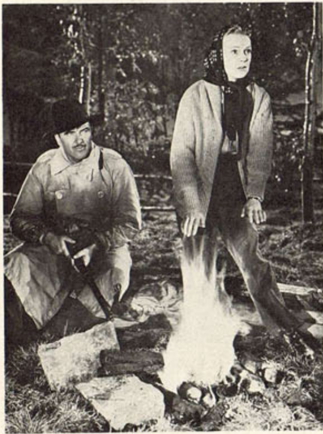
Momento invernal de la producción de Twentieth Century-Fox "My Friend Flicka", donde con el frío y la desconfianza se echa a perder un idilio, que, al sol, resultaría precioso entre Preston Foster y Rita Johnson.