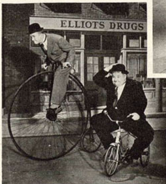
El peor modo de aprender a ciclistas (en máquinas del 1880) es el que escogen lógicamente Laurel y Hardy para su comedia de M-G-M "Vigilantes Aéreos".