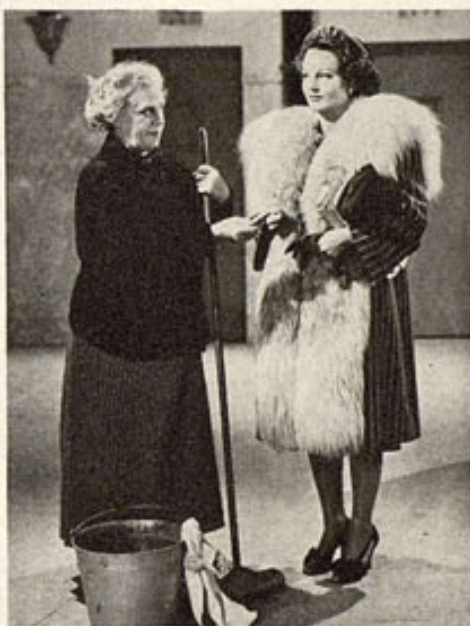
Rochelle Hudson, la de las pieles, en un diálogo de la cinta de marca P.R.C. "La Reina de las Apuestas".