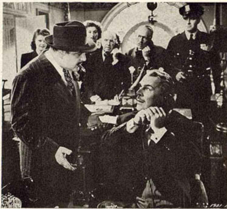
Brian Donlevy hablando por teléfono y con Akim Tamiroff en una de las escenas más álgidas de la película "The Miracle of Morgan's Creek", que ambos interpretan para la Paramount.

profesión en el cine americano. El premio enviado para él por la Academia de Méjico, consistía en una preciosa estatuilla de oro, montada en un globo del mismo metal. Y como hubiera sido grande la diferencia de este "Oscar" hispano, al lado de los sencillos "Oscars" americanos, que se alineaban en la mesa en el estrado, Arturo de Córdova la hizo desmontar previamente, recibiendo al parecer un "Oscar" como todos los demás, puesto que de lejos nadie podría apreciar que el suyo era de oro, mientras que los demás eran de plástica.