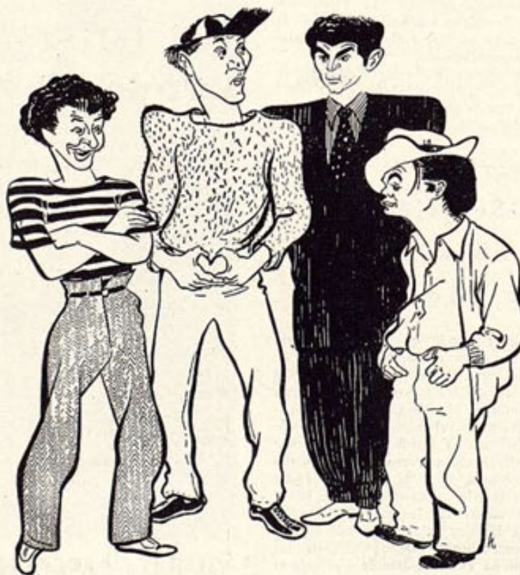
Los muchachos de La Pandilla Neoyorquina en trajes de gala "para bajar al asfalto". Así aparecen en la película Monogram "La Tragedia del Puente".

Napier no representará a su tío en la película, sino a un oficial inglés del servicio secreto, que defenderá los puntos de vista del difunto Ministro, basándose en el hecho de que Inglaterra en aquella época no estaba preparada.