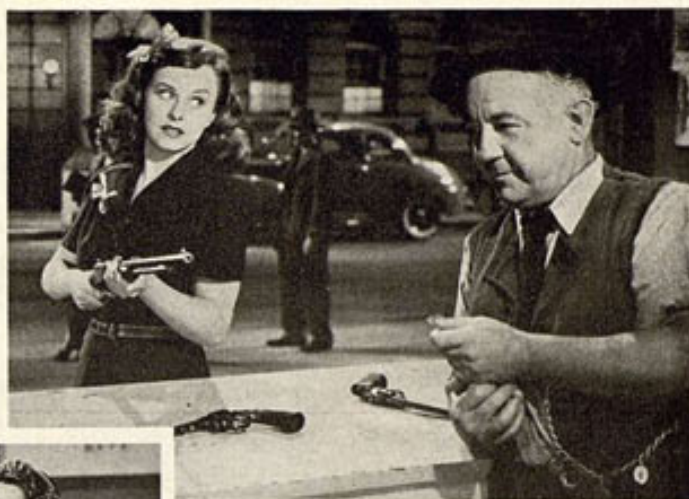
Paulette Goddard, a quien le sobran como arma los ojos, en actitud amenazadora de una escena de "La Bola de Cristal" por cuenta de Artistas Unidos. El propietario de la galería no se da por aludido.