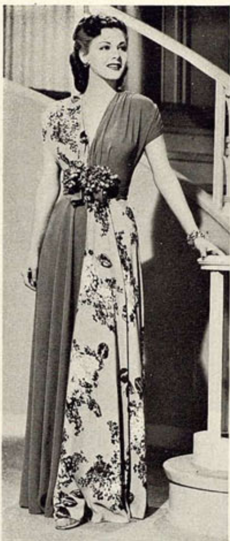
A la izquierda, María Montez, luminar de la Universal, vestida de etiqueta. La tela combina el tono violeta oscuro con orquídea y se adorna con un espléndido ramo de violetas blancas. Los paneles alternados, de tela violeta y tela estampada, dan dramático chic a esta creación.