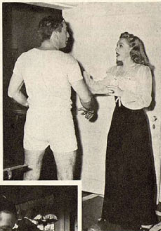
¡Bonito traje de etiqueta para hablar con una señora! El de los paños menores es Macdonald Carey; la señora, Betty Rhodes; la película, "La Mujer que yo Dejé"; la marca, Paramount.