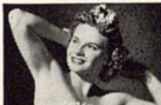
ARRID es la crema blanca, inocua, que no irrita