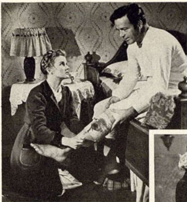
Dorris Bowdon haciendo de enfermera de William Post en la producción de Twentieth Century-Fox "Se ha Puesto la Luna".