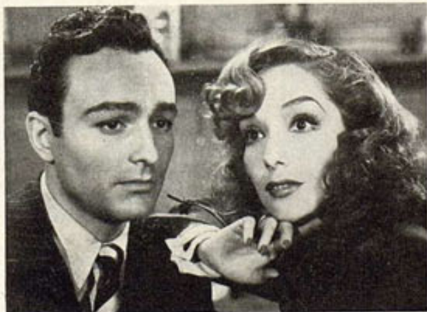
Izquierda, Michael Duane y Lupe Vélez en "El Torbellino Femenino" (no hay más que ver el pelo), película de la Columbia.