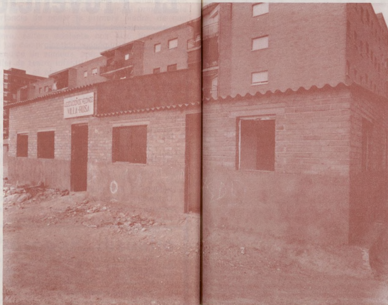
El nuevo domicilio social aun en obras.