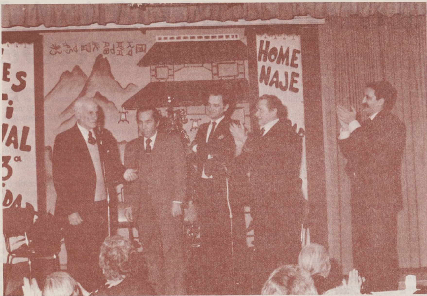
Los Directores de las Cajas de Ahorros del barrio con el Presidente y Secretario del Hogar de Ancianos.

El pasado día 23 de diciembre, en la parroquia Santa Rosalía, se ha celebrado el homenaje a la tercera edad, para el cual han trabajado juntos el Hogar de Ancianos y la Asociación de Vecinos de Villarosa. El acto resultó muy bonito, a él asistieron todos los ancianos de la colonia fueran socios o no, ya que nuestro deseo era que acudieran a este acto todos nuestros mayores, los cuales lo pasaron sin duda muy bien, e incluso actuó esa misma tarde una rondalla formada por ellos mismos, otros contaron chistes, etc.