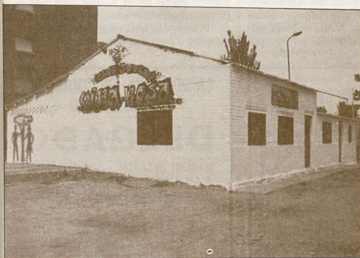
Fotografía correspondiente al actual local de la juventud, final de la calle de El Pedernoso, junto al Polideportivo Villa-Rosa.