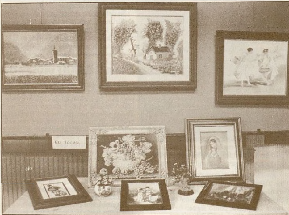
Un detalle de la exposición organizada con motivo de estos actos.