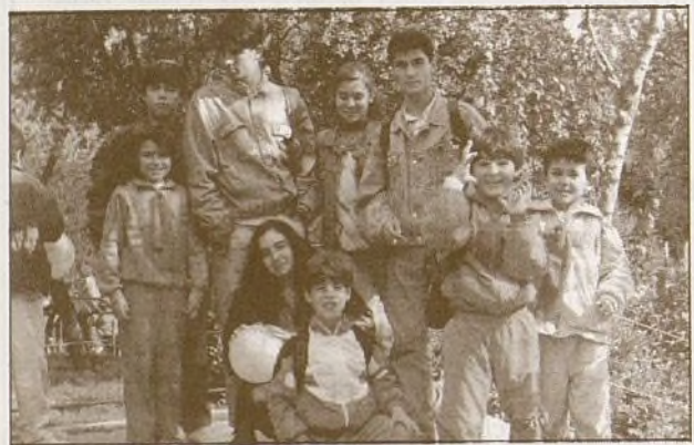
Algunos miembros de la excursión.

A partir de aquí, "El show de los papagallos", la "Naturaleza misteriosa" o la entrada al pabellón de las serpientes, todo fue un escenario de bocas abiertas y cuellos estirados con sonrisas congeladas, por los más pequeños, en gastos de atónita sorpresa... Teníamos la extraña sensación como si cada criatura desde sus lugares quisiera llamar nuestra preciada atención con sus movimientos aprendidos en la costumbre, ya nada extraña, de ver a tanta gente observándoles a su alrededor.