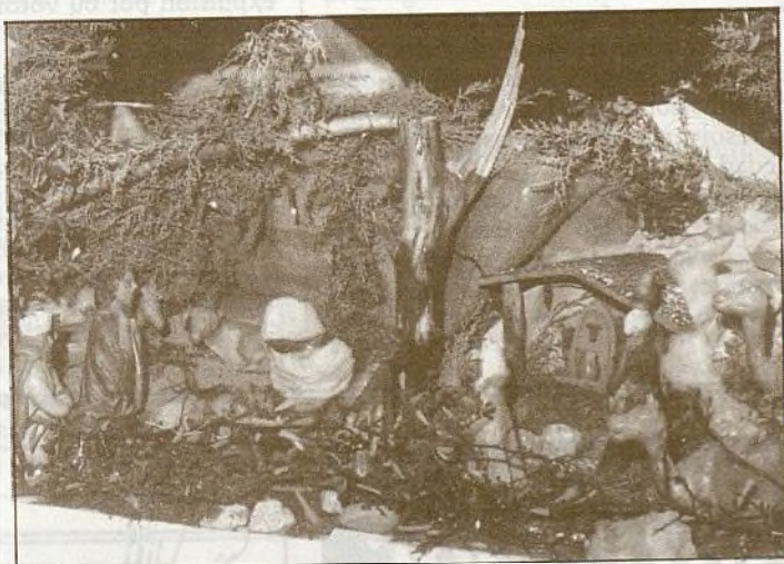
Belén de cerámica hecho por las artesanas de la A VV.

No podemos decir lo mismo de la antigua costumbre del Cartero Real, al que acudieron pocos niños a depositar su carta a los Reyes Magos. Hubo actuación, con el éxito de costumbre, de nuestros Grupos de Baile, el día 2 de enero en el colegio Pérez de Ayala y el día 3 en el Hogar del Pensionista, donde se les espera, año tras año, con verdadera expectación y se les recibe con mucho cariño.