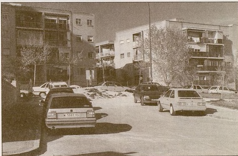
Otra muestra de la transformación que está sufriendo Villa Rosa, con nuevas vías de acceso y el saneamiento de algunos rincones hasta ahora sin urbanizar.

Tenemos un equipo de cadetes femenino de voleibol que juega en el distrito de Fuencarral-El Pardo. En el Campeonato de Liga han quedado las terceras. Felicitamos a nuestras jugadoras por este honroso puesto en su debut.