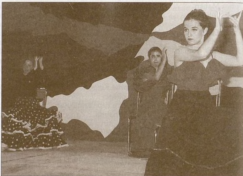
Un momento de la actuación de nuestras bailarinas en las fiestas