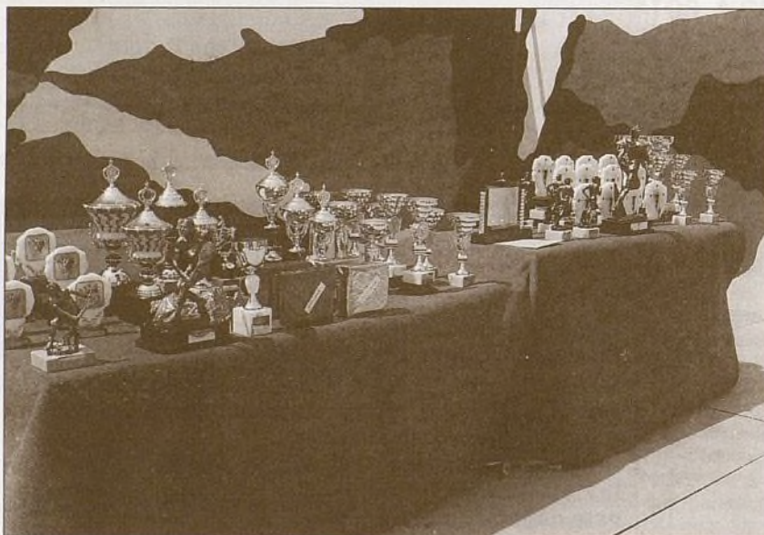
Los trofeos, antes de ser entregados a los vencedores.