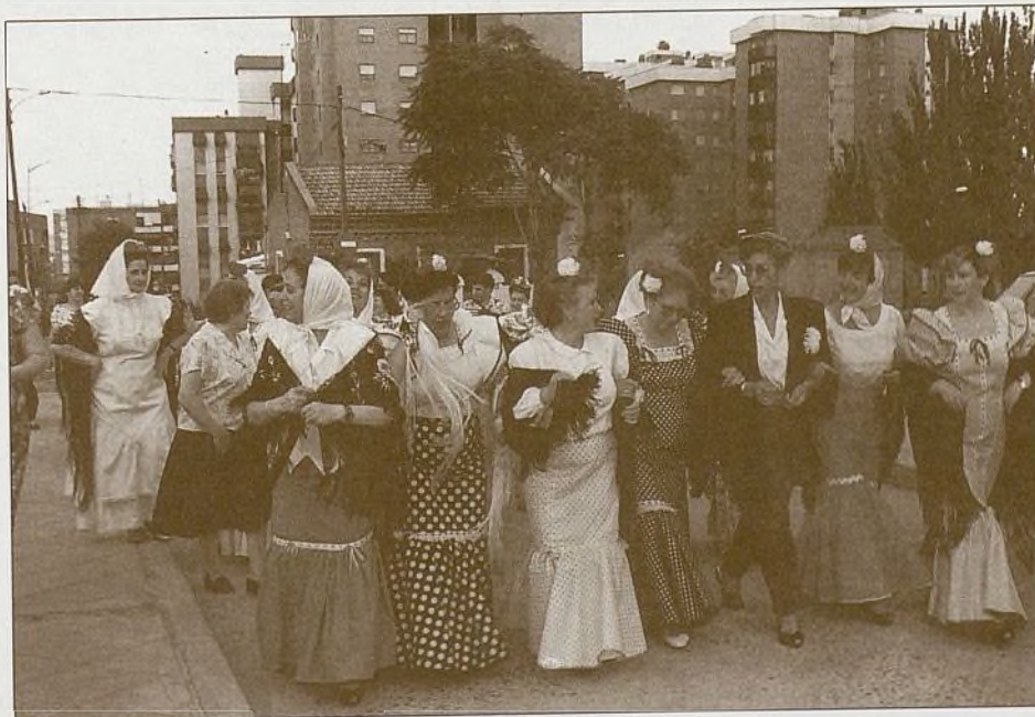
Las guapas componentes del grupo Chipén, en un momento de su paseo por las calles de Villa Rosa, en el inicio de las fiestas. Ayuntamiento de Madrid