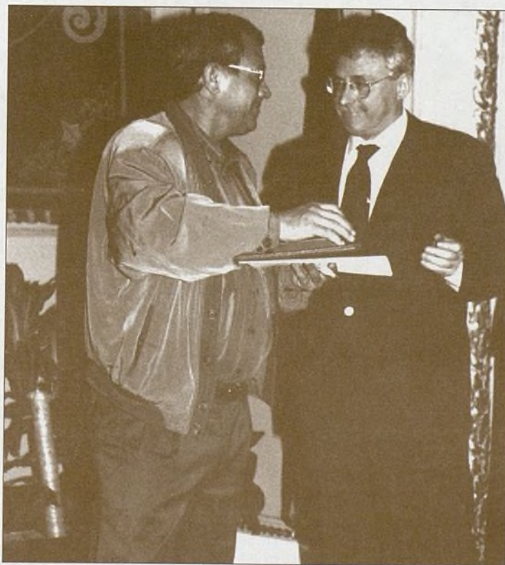
Joaquín Leguina, presidente de la Comunidad, haciendo entrega de la Medalla de Oro de Madrid a las Asociaciones de Vecinos.