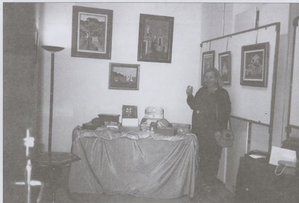
En la foto, un detalle de la exposición de manualidades y trabajos artísticos, que profesoras y alumnos muestran año tras año con motivo de las Fiestas.

Mercería Mari Carmen. Ferretería. Hombre Mujer. Panadería José. Pastelería Juan. Joyería. Bar El Mesón. Estanco Villa Rosa. Videoclub Alfe. Jade. Floristería Color. Cristalería Delgado. Cafetería Burgos. Frutos Secos Pica Pica. Restaurante Petri. Bar Yantar. Airtel Agente Autorizado. Farmacia Don Tomás. Muebles Caribe.