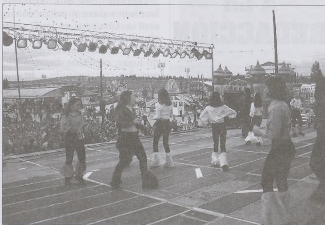
En esta foto, las jóvenes del grupo de baile moderno evolucionan sobre el escenario ante la mirada atenta del público.

Nota: Los beneficios estimados son de 88.000 pesetas . Las cantidades son aproximadas por la premura de tiempo para cerrar el Boletín. En el próximo número ofreceremos las cifras más exhaustivamente.