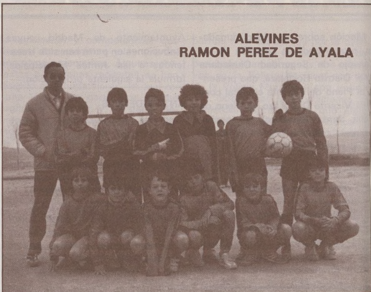
ALEVINES RAMON PEREZ DE AYALA