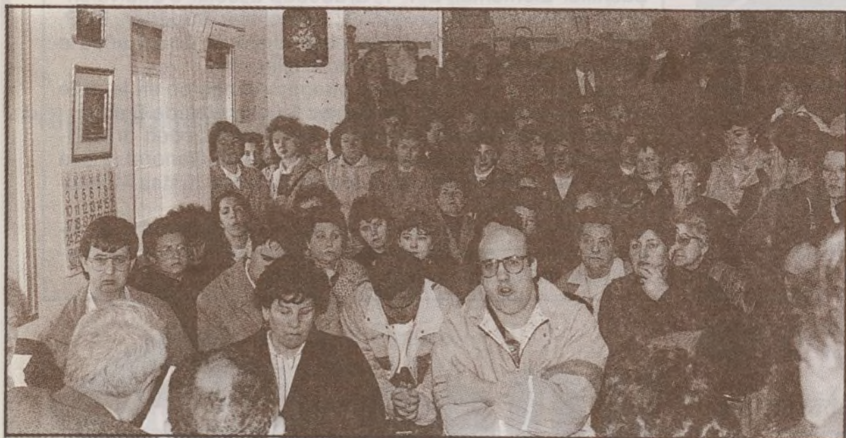
Un momento de la enorme expectación despertada en nuestros vecinos por la Cooperativa, que el día 27 de abril acudieron a los locales, que estuvieron repletos de personas necesitadas de vivienda.