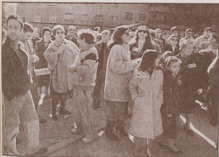
Asamblea hecha en la calle al día siguiente de la «inauguración» de la estación de Metro de Villa Rosa. A la asamblea asistieron representantes de los partidos políticos.

conoció que las unidades que hacen el servicio en la línea 73 y en otras son las peores con las que cuentan. Posteriormente acudieron el subdirector y el jefe de la División de Explotación, que a su vez reconocieron nuevamente el mal estado de los autobuses, que íbamos apretados, etc., es decir, nos dieron la razón, pero al plantear la necesidad del autobús 87 se opusieron al mismo, a pesar de reconocer la no rentabilidad de la misma. Quedaron en llamarnos y reconocer la línea con nosotros.