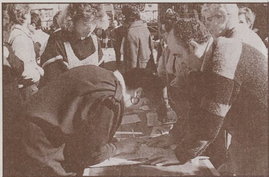
Un momento de la recogida de firmas, para protestar por el transporte, que se hizo el 8 de abril de 1987, hace ahora dos años.