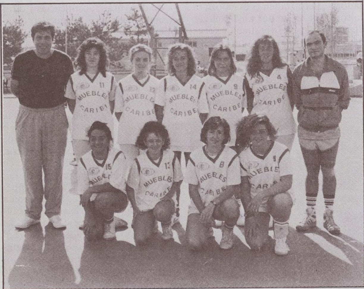
El equipo de baloncesto Juvenil femenino de Villa Rosa es Campeón de Invierno y virtual Campeón de Liga