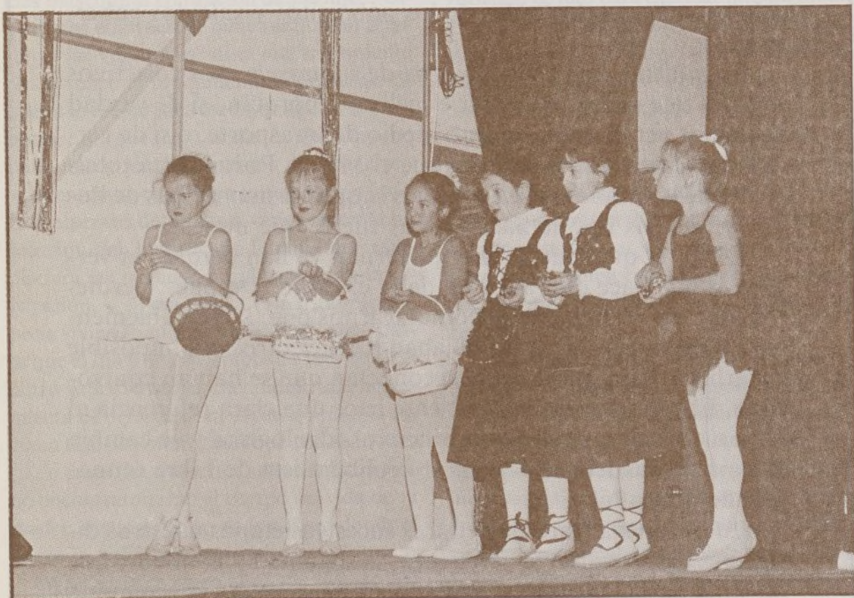
Un momento de la representación del cuento navideño en el escenario del colegio público Ramón Pérez de Ayala.

En vista de lo cual, nos seguimos apuntando para próximos años.